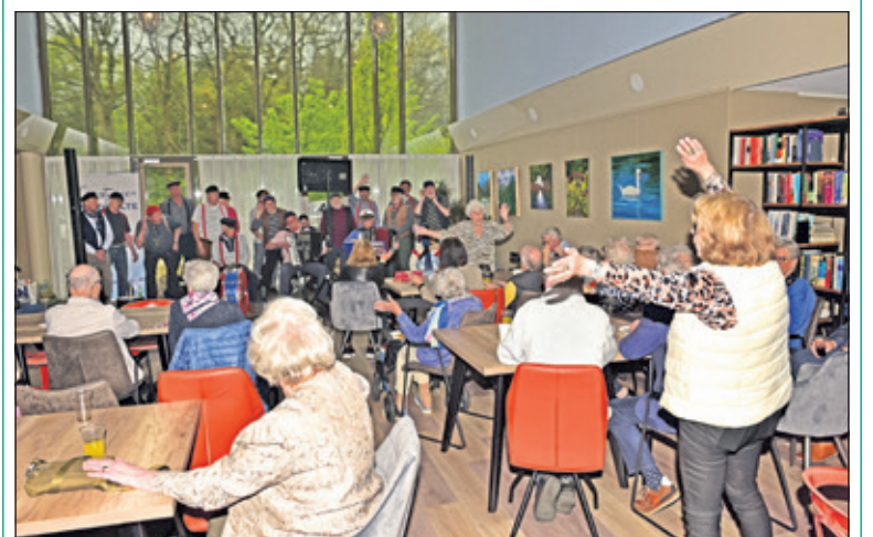
Bewoners van De Leijenburgh vieren hun eerste lustrum.

De Leijenburgh doet zijn naam als 'sociaal wooncomplex' eer aan want onder de bewoners is in de afgelopen vijf jaar een behoorlijk sterk gemeenschapsgevoel ontstaan. Dat komt mede door de bouwwijze van het gebouw, met inpandige atriums, waardoor bewoners gemakkelijk contact met elkaar kunnen leggen. Er worden regelmatig gezamenlijke activiteiten georganiseerd in de gemeenschappelijke ruimte, zoals kaartavonden en gezamenlijke maaltijden. Een van de bewoners met interesse in kunst draagt zorg voor wisselende collecties schilderijen in de ruimte. Daarnaast werken bewoners samen in een beheercommissie en er is een groep die het prachtig aangelegde gemeenschappelijk groen rond het gebouw onderhoudt. (Rob Jastrzebski)