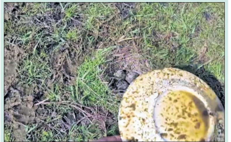
Ongeschonden komen de eieren vanonder de borden tevoorschijn.