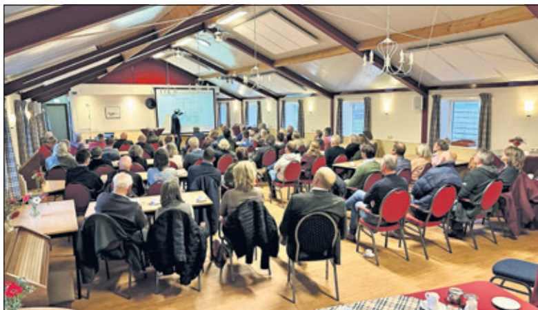
Bezoekers luisteren aandachtig naar de plannen voor de boerderij.