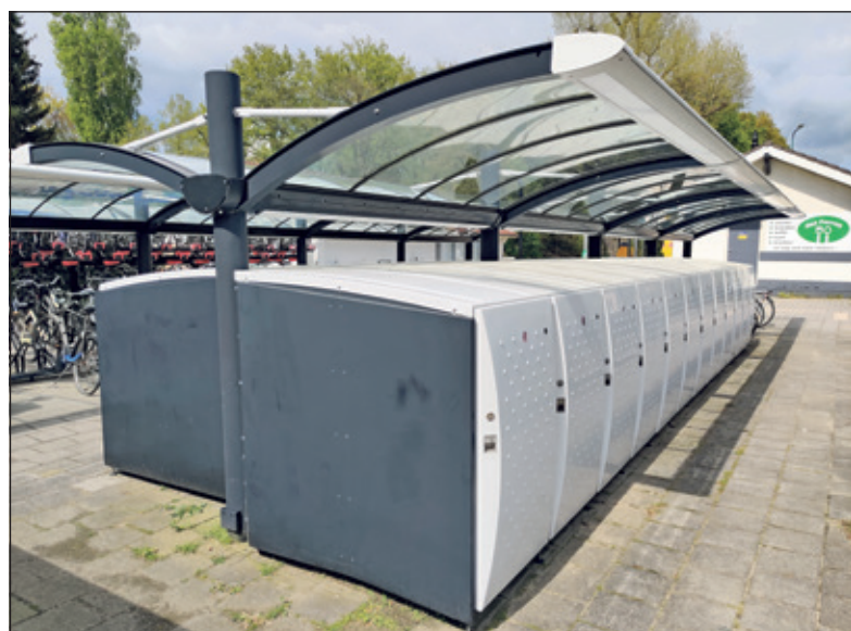
Het fietspaviljoen bestaat uit kluisjes waarin de OV-fietsen zijn ondergebracht.

Het was al met al donderdag(-middag) een feestelijk gebeuren bij station Hollandsche Rading. Dit niet in de laatste plaats omdat het die middag droog bleef. Jammer was wel, dat niemand uit Hollandsche Rading en de overige kernen van de gemeente door de organisatoren hierop was geattendeerd; dit terwijl er hier toch wel sprake is van een - zij het lichte - uitbreiding van het voorzieningenniveau van de (kleine) kern Hollandsche Rading. Een gemiste kans.