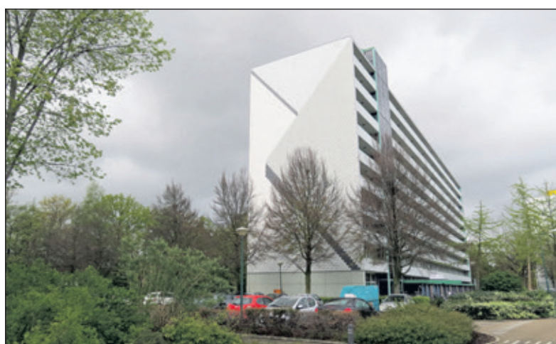
Een straat in Brandenburg-West.