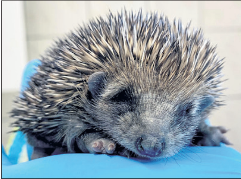
Schattige egeltjes vallen nog wel eens ten prooi aan een robotgrasmaaier.

Handig, zo'n maaier die automatisch je gigazon bijhoudt. Ik kan me voorstellen dat mensen met een forse tuin deze keuze maken, want wekelijks zelf de boel maaien kost veel tijd. Maar er zit een addertje onder het gras... Ieder jaar komen er bij de egel- en wildopvangcentra zwaargehavende egels binnen die onder zo'n maaier terecht zijn gekomen. De overlevingskans voor deze dieren is nihil. Ook dit jaar heb ik bij de Dierenbescherming het eerste slachtoffer alweer voorbij zien komen. Muizen, vogels en andere dieren vluchten als er een robotmaaier komt, maar egels rollen zich op als ze zich bedreigd voelen.