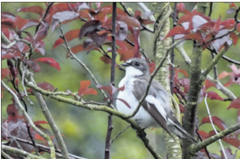
Bonte vliegenvanger.

De start was in Beukenburg waar de vogels van bos en open veld de groep trakteerden op een uitbundig concert als dagopening. Merel, zanglijster, koolmees, winterkoninkje en boompieper gingen de competitie aan om het hoogste lied. Na de slotakkoorden, konden ze de vogelsoorten apart en meer geïsoleerd beluisteren en leren herkennen. Bijzondere waarnemingen waren een rustende bosuil, bakkeleide goudhaantjes, een paartje appelvinken, en de zwarte en de grote bonte specht die af en aan vloog naar zijn nestholte.