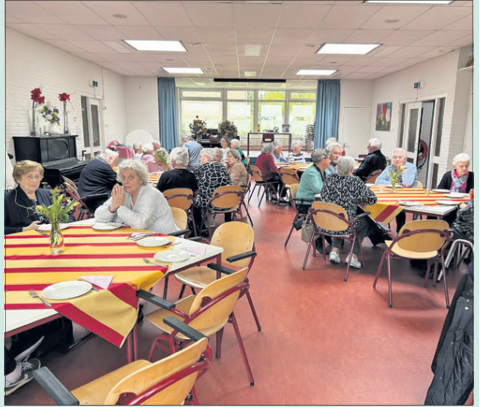
Deelnemers zijn neergestreken aan tafel in afwachting van de lunch.