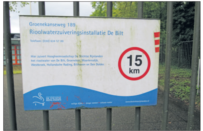
De rioolzuiveringsinstallatie als leverancier van een warmtenet.