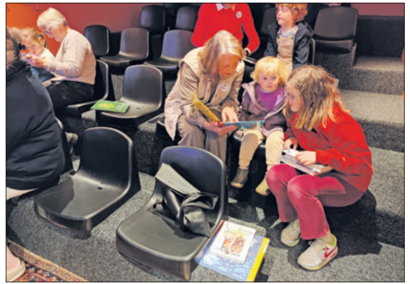
Grootouders voor het Klimaat verzorgden 20 april een voorleesmiddag bij de Bilthovense Boekhandel.

Zeven jaar later studeerde ik Sustainable Energy Technology, duurzame energie technologie, aan de TU in Eindhoven. Ik ging dat jaar op vakantie met mijn vriend naar Noorwegen. We hadden foto's bij ons. Foto's van markante plekken in Noorwegen met zijn tante op de voorgrond. Het leek ons grappig om die locaties op te sporen en de foto's na te maken, maar dan met hem op de voorgrond. Het lukte ons om de locaties te vinden, maar het