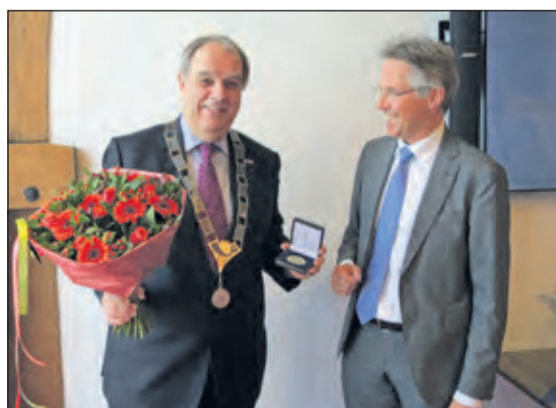
Burgemeester Bas Verkerk met de Chapeaupenning.