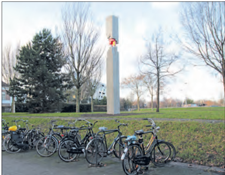
In december werd in het Griftpark in Utrecht de 'grenspaal' met kleurrijke Stijl-motieven onthuld.