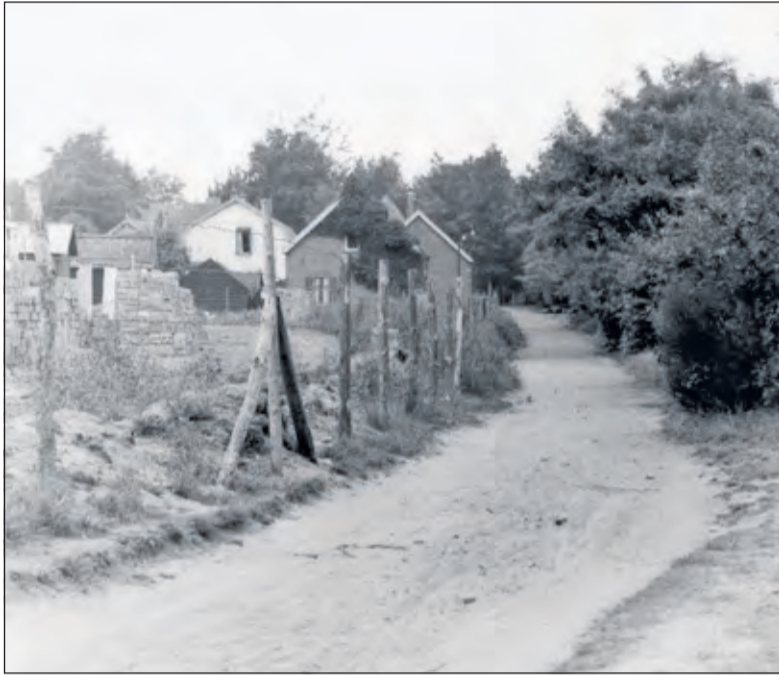
Een foto uit 1952; Jachtlaan 'Doodweg'.