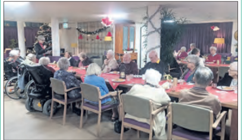
Op kerstavond werd er een broodmaaltijd georganiseerd voor bewoners (en familieleden) van De Koperwiek. Het werd een mooie avond, met sfeervolle muziek; tussendoor werden er kerstverhalen en een gedicht voorgedragen. De broodmaaltijd werd belangeloos gesponsord door AH De Bilt. (Judith Scheepstra)