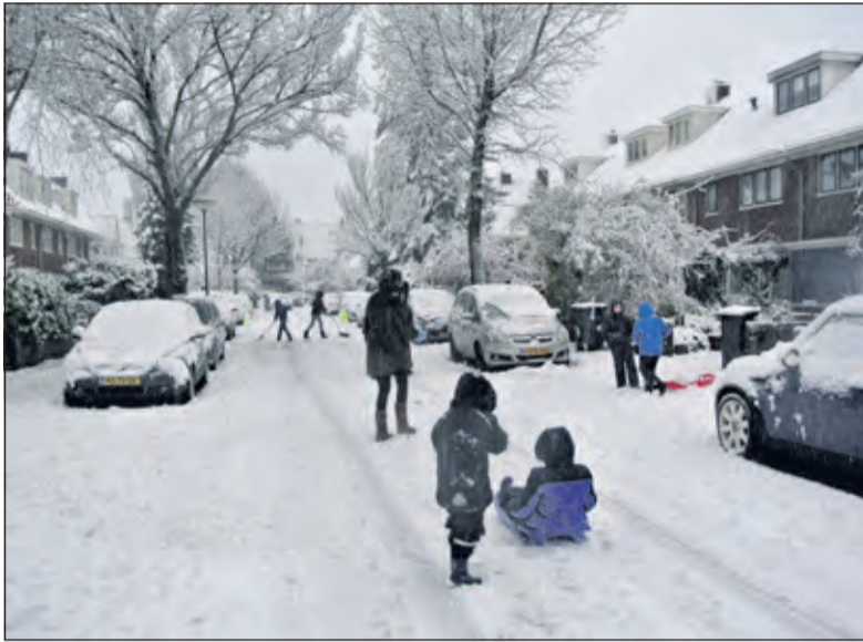
Sneeuwpret in de Steenen Camer anno 2017.