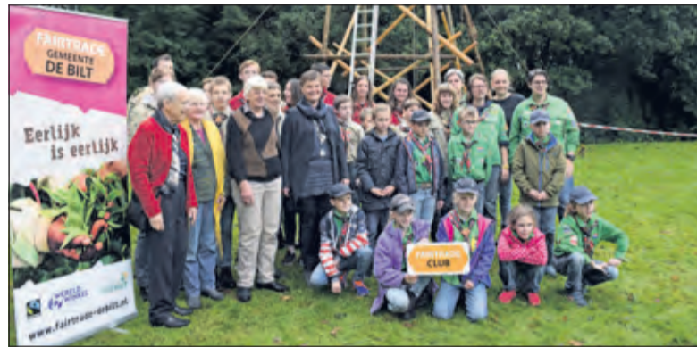
De eerste Fair Trade scoutinggroep in Nederland.

De Scouting Agger Martini Groep wordt de eerst Fair Trade scoutinggroep in Nederland. Commissaris van de Koning Willibrord van Beek brengt een werkbezoek aan De Bilt. Wim van Schaik overleed op 19 september. In Westbroek wordt een Automatische Externe Defibrillator