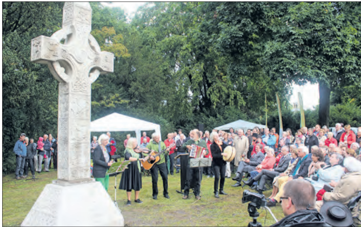
In het van Boetzelaerspark in De Bilt werd 14 september 2013 onder grote belangstelling het Iers Hoogkruis onthuld. Het kruis staat symbool voor de geschiedenis van De Bilt dat toen zijn 900-jarig bestaan vierde.

bij verwerven van erfgoedobjecten. Veel kunstwerken hebben ook erfgoedwaarde. Er zijn verschillende aanleidingen voor het plaatsen van kunst. Als de gemeente - dus de Biltse samenleving - op enigerlei wijze de verantwoordelijkheid draagt voor het plaatsen van kunst, moet de medewerking van de gemeente het lokale belang dienen. Dat betekent dat kunst, die wordt geschonken als belichaming van uitingen die niet terug te leiden zijn tot een algemeen gemeenschapsbelang, niet met medewerking van de gemeente of mede op kosten van de gemeente wordt geplaatst. Uit de aanleiding voor de schenking of het initiatief en/of uit de thematiek van een kunstwerk kan worden afgeleid, of er sprake is een algemeen belang. Kunstwerken moeten verder voldoende artistieke kwaliteit hebben om bij te dragen aan de kwaliteit van de openbare ruimte. Het meewerken aan het plaatsen van kunstwerken die vooral als doel hebben het uitdragen van overtuigingen en denkbeelden van specifieke religieuze, levensbeschouwelijke of politieke aard, is niet in het algemeen belang. Vanuit de historische context kan hierop een uitzondering worden gemaakt (bijvoorbeeld het Biltse Hoogkruis). De afdeling Communicatie van de gemeente De Bilt vult desgevraagd nog aan: 'De procesbeschrijving geldt voor plaatsing van nieuwe kunstwerken. Van consequenties voor reeds aanwezige kunst is zodoende geen sprake'.