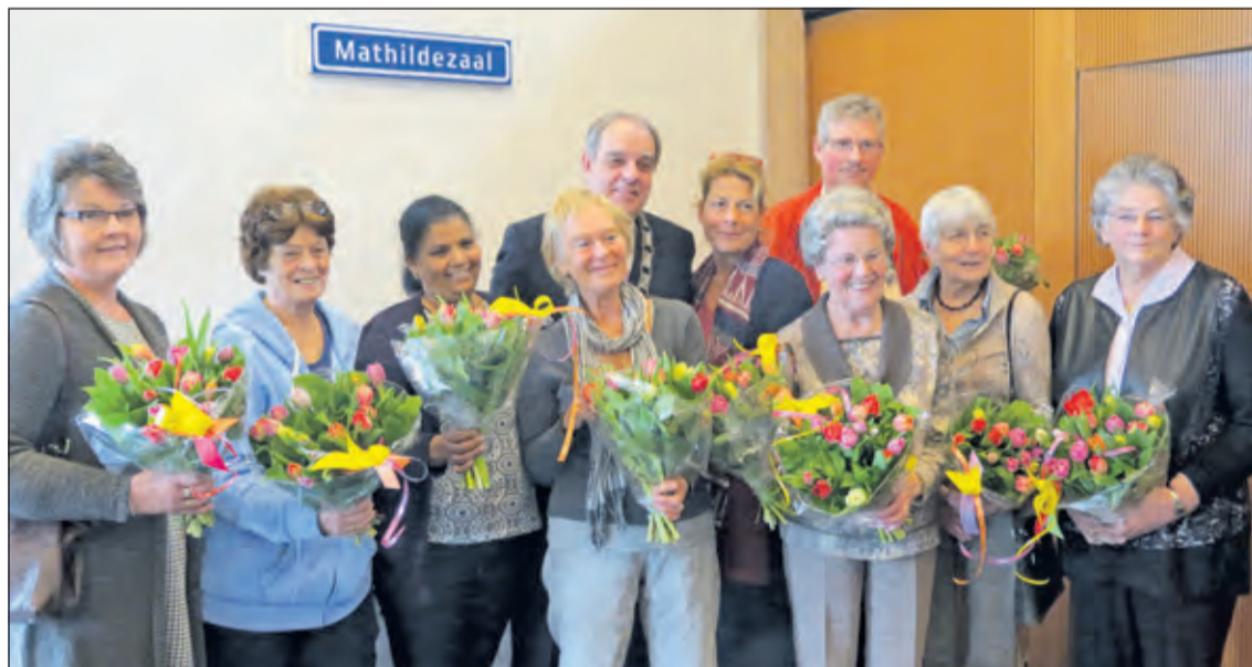
Ontvangen bloemen als waardering voor hun inzet.

Op Mathildedag werden vrijwilligers in het zonnetje gezet. Gluren bij de Buren wordt voor de negende keer gehouden. De Vierklank brengt een informatieve Lenteespecial uit. De nieuwbouw van basisschool De Regenboog gaat van start. Er was gratis compost af te halen op de gemeentewerf. Het werd een van de zachtste maartmaanden in ruim drie eeuwen. De gemiddelde temperatuur was 8,6 graden tegen normaal 6,2. De maand telde 3 vorstdagen tegen 8 normaal en 2 dagen met een temperatuur boven de 20 graden. Normaal heeft maart geen warme dagen. De zon scheen in De Bilt 176 uur tegen 122 uur normaal.