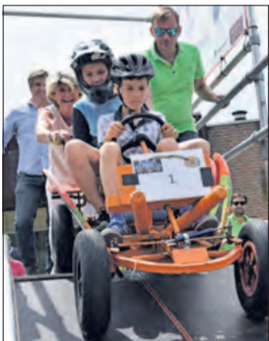
Winnaar van de zeepkistenrace: de drakenvleugel van de Julianaschool.