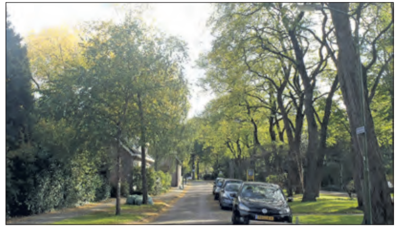
Het pad zelf werd nu een echte weg met Jachtlaan als naam.