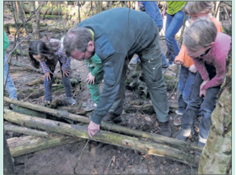
Terwijl de dassen slapen kunnen de kinderen op bezoek in hun burcht.

KinderNatuurActiviteiten van Het Utrechts Landschap (HUL) organiseert activiteiten voor kinderen in en over de natuur. Dit wordt gedaan onder leiding van vrijwilligers van HUL en IVN De Bilt op Beerschoten. Woensdag 10 januari wordt er van alles verteld over de Dassenburcht in en buiten paviljoen Beerschoten. Buiten worden spullen uit het bos verzameld waarmee de kinderen met klei een eigen dassenburcht mogen maken. Er is wat lekkers met limonade. Leeftijd: 6 t/m 10 jaar. Tijd: 14.30 tot 16.30 uur. Plaats: Paviljoen Beerschoten, De Holle Bilt 6 in De Bilt. Aanmelden per email kan tot en met zaterdag 6 januari via kindernatuuractiviteiten@gmail.com.