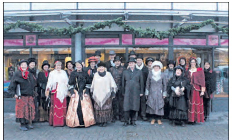
Sparks of Joy brengt Dickensfeer op het Maartensplein.