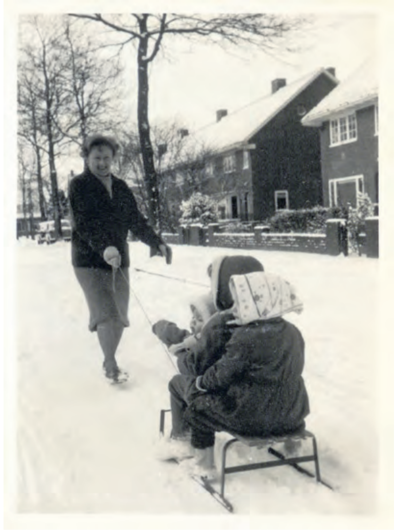
Sneeuwpret in de Steenen Camer anno 1962.