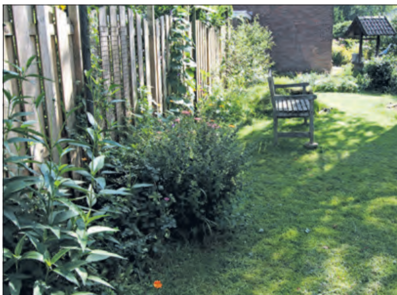
'Parkallure in De Bilt-Oost'.