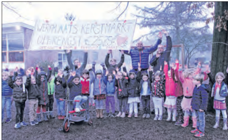
De opbrengst van de kerstmarkt overtreft alle verwachtingen.