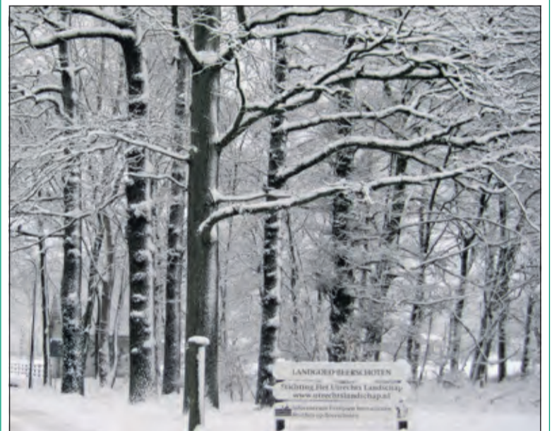
Beerschoten levert met sneeuw een mooi plaatje op.

Op zondag 7 januari organiseert Utrechts Landschap een wandeling op Landgoed Beerschoten. Landgoed Beerschoten in De Bilt behoort tot de mooiste landgoederen van de Utrechtse Heuvelrug. In het gebied komen reeën, de das, de vos en vele vogels voor zoals de raaf. Tijdens deze wandeling vertelt de gids over de rijke historie van dit landgoed. De wandeling duurt anderhalf tot twee uur. Vertrektijd 14.00 uur. Start vanuit Paviljoen Beerschoten, gelegen aan de Holle Bilt 6, in De Bilt; voorbij de parkeerplaats van de Biltsche Hoek linksaf. Vooraf aanmelden is nodig in verband met het maximaal aantal deelnemers. Dit kan op de website van Utrechts Landschap bij 'activiteiten'. Deelname is gratis.