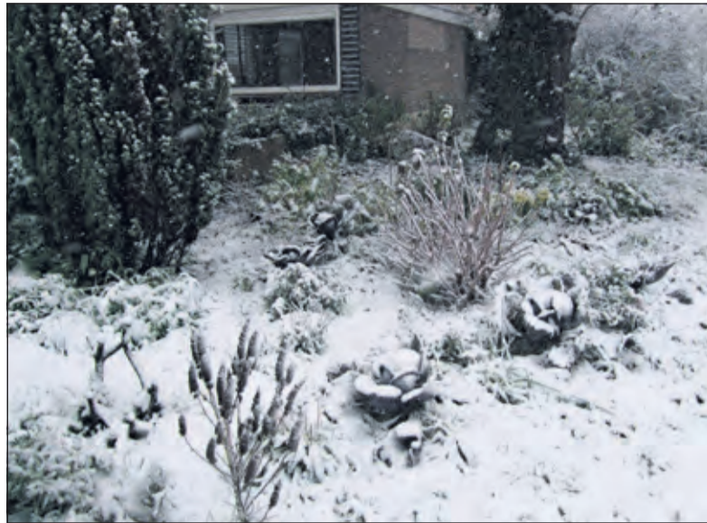
'Kool en gras'.

Oplossing? Graszaad. Gras houdt het water vast en biedt beschutting. Met de regen kwam er leven in het nieuwe plantsoen. Mijn man Koos ging bij mevrouw Zandbergen langs en kwam terug met koolplantjes: rode kool en spitskool. Die werden de talk of the town. Verbazing alom, toen ze almaar groter en groter bleken te worden. Wat jeugdherinneringen opriep bij passerende oudere dames. Vragen uit de buurt: 'is het nou een siertuin of een volkstuintje?'. Op een zeker moment werd ik aan de deur gewaarschuwd. 'Of ik wel wist dat er allemaal rupsen op de rode kool zaten?' Zeker wist ik dat, en dat was nou net de bedoeling.