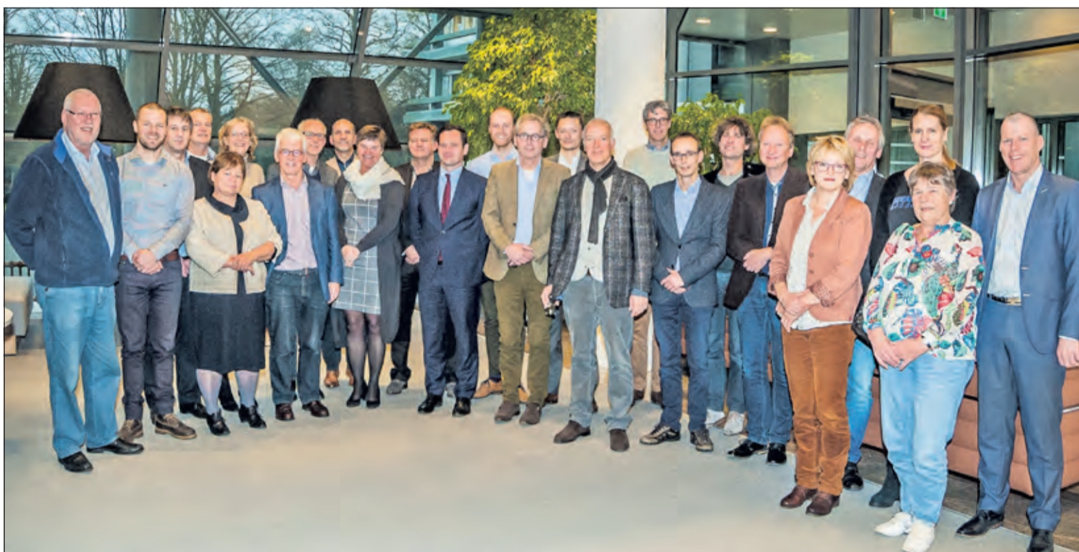
Bijeenkomst van de partners van het Bilts Energie Beraad bij het KNMI.