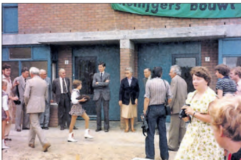
De opening op 14 juni 1980.