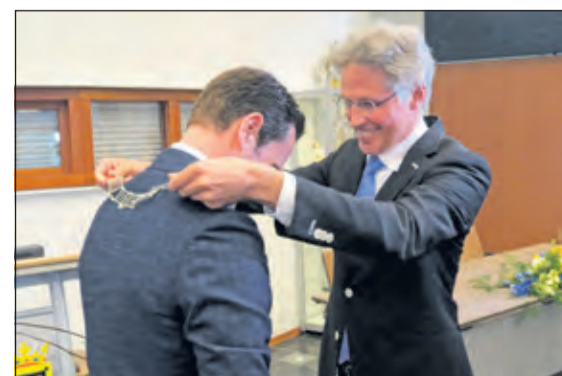
Burgemeester Potters krijgt de Chapeaupenning omgehangen.

VOOR AL UW KLEINE REPARATIES KUNT ELKE WOENSDAG VAN 11.00 - 17.00 UUR TERECHT OP HET MAERTENSPLEIN