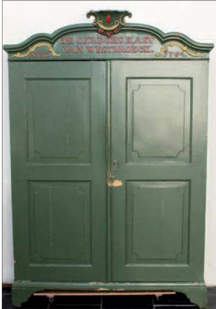
Op deze gerechskast in het 'koor' van de Hervormde kerk in Westbroek, staat te lezen: 'De Gerechskast van Westbroeck, Anno 1764'.

Het project bestaat uit vier lessen. Les 1 en 4 doet de school zelf. Les 2 speelt zich af op de locatie van Jeugdtheaterschool Masquerade. Les 3 (de rechtszaak) is in een bijgebouw van de Nederlands-hervormde kerk in Westbroek: Het Kerkelijk Centrum Rehoboth. In les 1 krijgen de leerlingen informatie over een rechtspraak uit de lokale geschiedenis. Vervolgens worden ze in les 2 door een docent van Masquerade voorbereid. Daarna worden ze in les 3 verwelkomd op een locatie die met rechtspraak te maken had. Daar spelen zij al improviserend, begeleid door een rechter (acteur), met op school voorbereide argumenten de rechtszaak. Terug op school geven ze in les 4 hun mening over de uitspraak in de vorm van een krantenartikel over de rechtszaak. Tijdens dit project krijgt de leerkracht voor het rollenspel een echte zaak uit de geschiedenis. Ook al is de zaak al vele jaren oud, er kunnen nog steeds parallellen naar het heden getrokken worden.