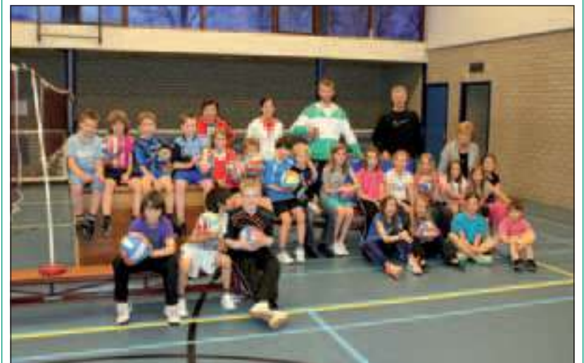
Tijdens de gymlessen maken kinderen van de MLK-school kennis met volleybal.

Om de kinderen zoveel mogelijk facetten van het spel aan te bieden wordt een tweede training in de aansluitende week gegeven voor dezelfde groepen. De eerste training is door trainers van Salvo gegeven. De tweede training wordt gegeven door een bondstrainer van de Nederlandse Volleybalbond. Wanneer de kinderen enthousiast zijn kunnen zij de rest van het seizoen gratis bij Salvo meetrainingen. Bij de tweede training wordt informatie daarover meegegeven. De jeugd was erg enthousiast. Vooral het onderdeel smashen vanaf de kast was favoriet. [HvdB]