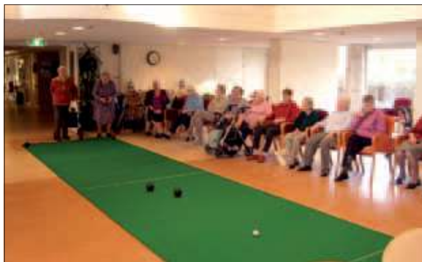
Elke keer na het koersen zijn de bewoners zo enthousiast. Ze zouden het 't liefste elke dag willen doen.

Sinds een paar maanden is Koersbal geïntroduceerd bij Woonzorgcentrum De Bremhorst in Bilthoven. Koersbal is een sport op zich. Het zijn namelijk niet zo maar gewone ronde ballen. Het is een speciale manier van het laten rollen van de zware koersballen. De bewoners vinden het best pittig om dit goed te laten lukken. Maar iedereen beleeft er veel plezier aan en is tevens in beweging. Het is dus een goede sport voor ouderen die willen bewegen en wedstrijden willen spelen. (Trees van Rooyen)