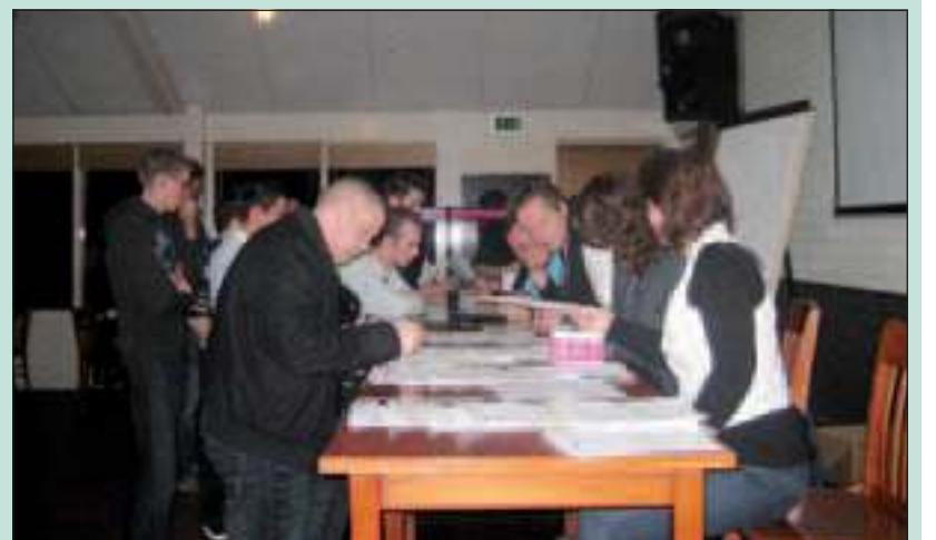
Na de uiteenzetting volgde de inschrijving van 46 coureurs.