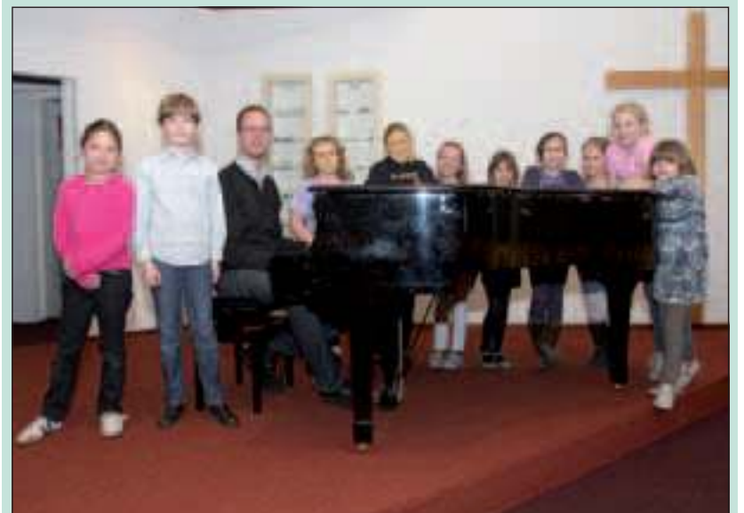
Kinderen van de Julianaschool werken mee.