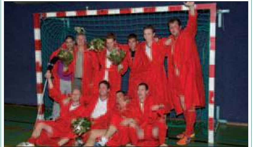
Bloemen voor de FC De Bilt zaalkampioenen.

Daar de concurrentie dezelfde avond dure punten verspeelde kon het kampioenschap en de promotie na de 1ste klasse worden gevierd. Afgelopen woensdag werd er vervolgens ook nog met 1-6 van het Baarnse All Stars gewonnen.