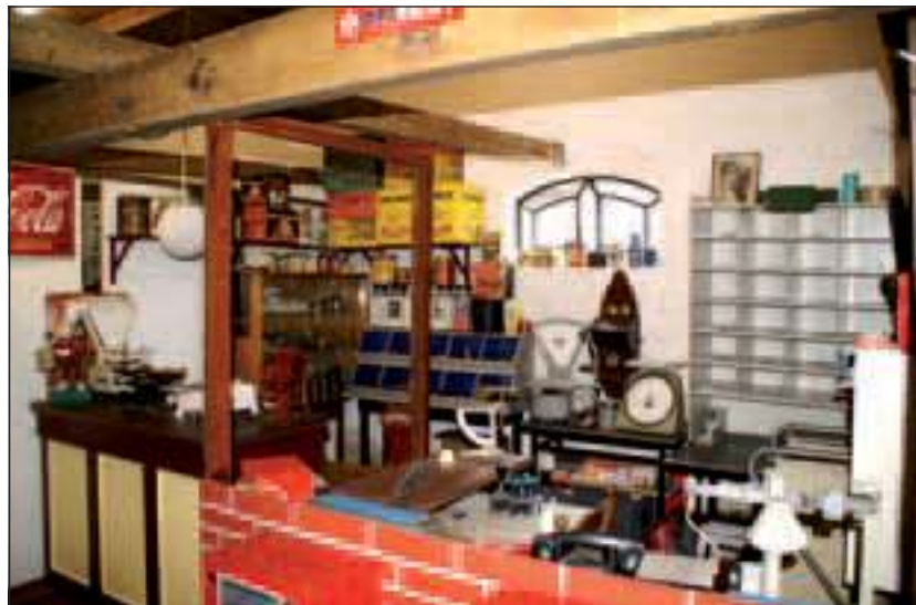
Nostalgie ten top in Streekmuseum Vredegoed.

De museumruimte is overzichtelijk ingericht in themaruimtes, die een goed beeld geven van het vroegere boerenleven in de Vechtstreek. Het is een boeiende collectie voor jong en oud. Er is in het museum een timmermanswerkplaats, een smederij, een kaasmakerij, een huiskamer uit de jaren '30, een kruidenierswinkeltje, een PTT postkantoor, een washok, een keuken met bedstee, een arrenslee en andere boerenwagens en veen- en landbouwgereedschap. Bij elke themaruimte kunnen de gidsen