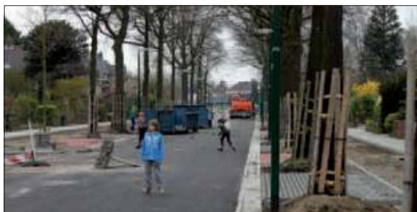
Op de 1ste Brandenburgerweg kon in het weekend alweer gespeeld worden.