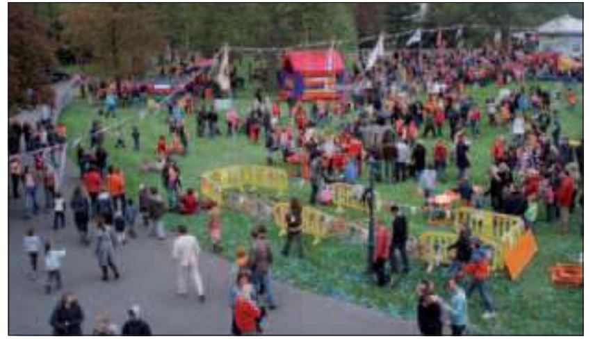
Het oranjecomité De Bilt-Bilthoven slooft zich weer uit om er mooie dag van te maken.