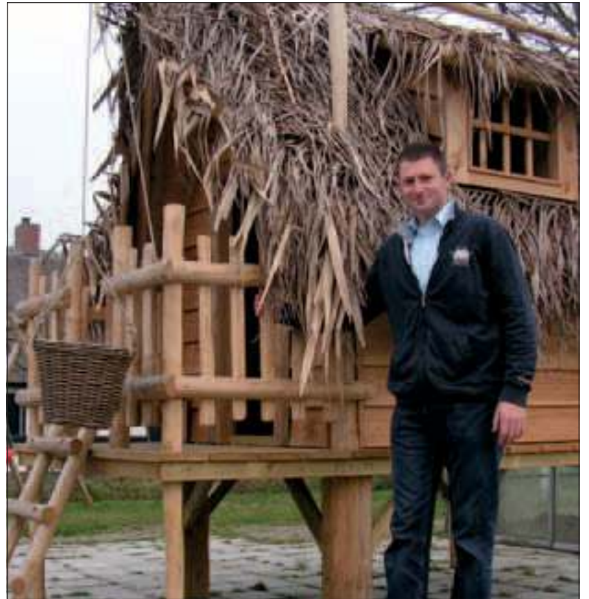
Tijdens de open dag op 16 april valt er genoeg te ontdekken bij de De Twaalf Gaarden.