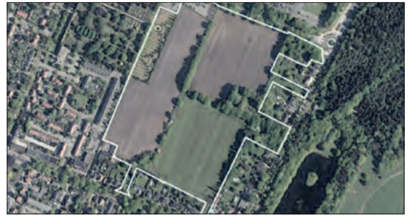
Luchtfoto met te wijzigen gebied.

'Verder leven op deze begraafplaats en de Schapenweide diverse dieren, zoals hazen, kikkers, vleermuizen en eekhoorns. Dassen sporen zijn regelmatig gevonden en een uil laat zich af en toe horen. Het gezang van merels en andere vogels is een lust voor het oor. Het ecosysteem zal worden verstoord, terwijl de gemeente steeds meer gaat uitpuilen van gebouwen. Het gemeentelijk ontwikkelingsplan laat zien dat een derde deel van Schapenweide bestemd zal worden voor woningbouw en twee-derde deel zal opgaan in hoge kantoor- en laboratoriumgebouwen. Alsof dat niet genoeg is, wil men ook nog een deel van de begraafplaats gebruiken. Juist in dat deel bevindt zich de vijver en de eerder genoemde prachtige oude bomen. Dat er woningen komen is een logische ontwikkeling, maar blijf af