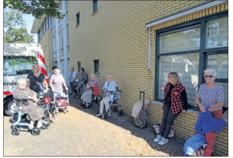
Geduldig wachten gasten en vrijwilligers op de bus die hen naar de vakantiebestemming zal brengen.

Vrijdagavond werd de week afgesloten met een uitgebreid afscheidsdiner. Op zaterdag werd na de lunch de thuisreis aanvaard. Alle gasten en vrijwilligers kunnen terugzien op een succesvolle vakantieweek.