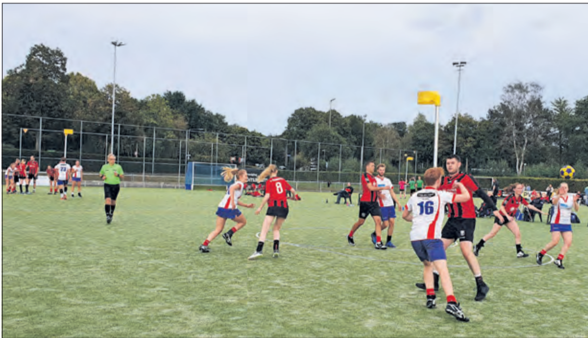
Ondanks de sterkere tweede helft wist Nova 1 geen punten te behalen in Nijmegen.

19. Nova kon echter niet op gelijke hoogte te komen met Noviomagum en daarmee glipte een gelijkspel uit hun handen. Het eindsignaal klonk bij een stand van 22-21. Dat betekende een zure nederlaag voor Nova. Volgend weekeinde ontmoet Nova om 15.30 uur thuis Movado uit Dordrecht. (Tessa van der Laan)