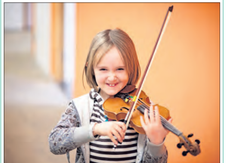
Zaterdag 10 oktober kan je een gratis proefles volgen in Het Lichtruim.

Aanmelden voor een proefles van 20 minuten kan tot 7 oktober via email naar muziek@kunstenhuis.nl o.v.v. naam, leeftijd en instrument (max. 2 instrumenten).