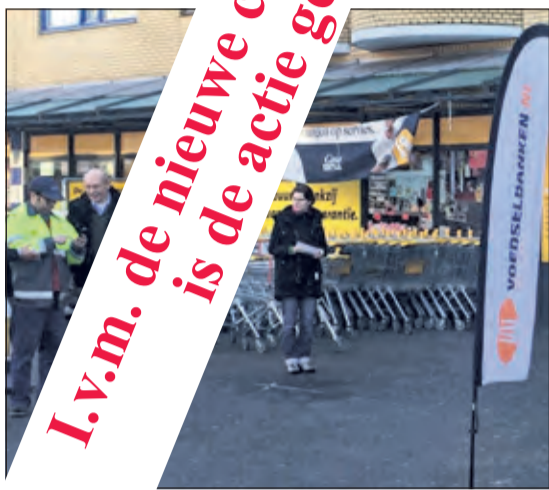
De actie wordt geannuleerd. Maartensdijk 2020 bij Jumbo Maartensdijk.

Op vrijdag 2 en zaterdag 3 oktober Jumbo voor de Voedselbank. Klanten van producten te kopen en direct van de Voedselbank. Vrijwilligers voor de Voedselbank kunnen zo veel mogelijk aanwezig zijn om de actie te geven en producten in ontvangst te nemen. Met deze actie hoopt Voedselbank de maatschappij bij te kunnen vullen.