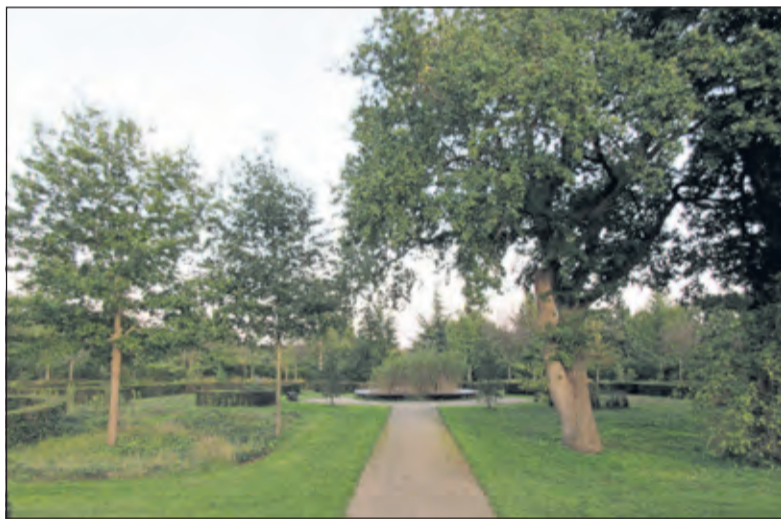
Een foto, gemaakt door een van de bezoekers. Op dit gebied zouden de gebouwen van Life Science komen.

Wie ook waarde hecht aan het behoud van deze begraafplaats en de Schapenweide kan een schriftelijke of mondelinge reactie indienen voor 12 oktober 2020. Schriftelijke reacties kan u richten aan: College van Burgemeesters en Wethouders van de Bilt, Postbus 300, 3720 AH Bilthoven.