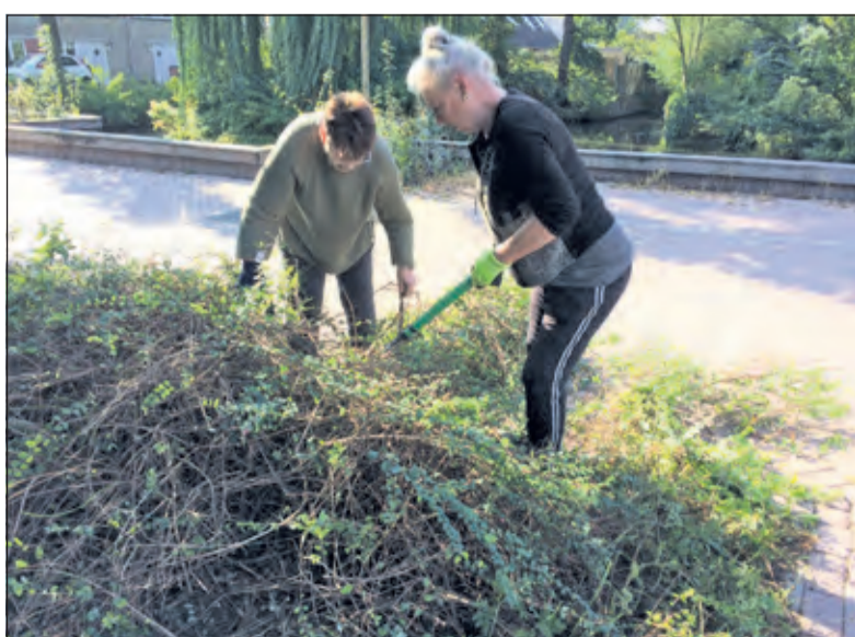
Verwilderde heesters worden geëlimineerd.

Vorige week werd de redactie op één dag – volledig onafhankelijk van elkaar – benaderd over het onderwerp 'Laat de begraafplaats met rust'. In gesprekken kwam duidelijk naar voren welke emoties alleen al het praten daarover oproept; dat is ook mede de reden, dat de wens om niet 'bij name genoemd te willen worden' wordt gerespecteerd. [HvdB]