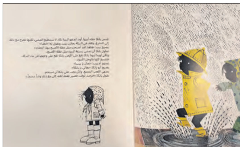
Jip en Janneke in het Arabisch