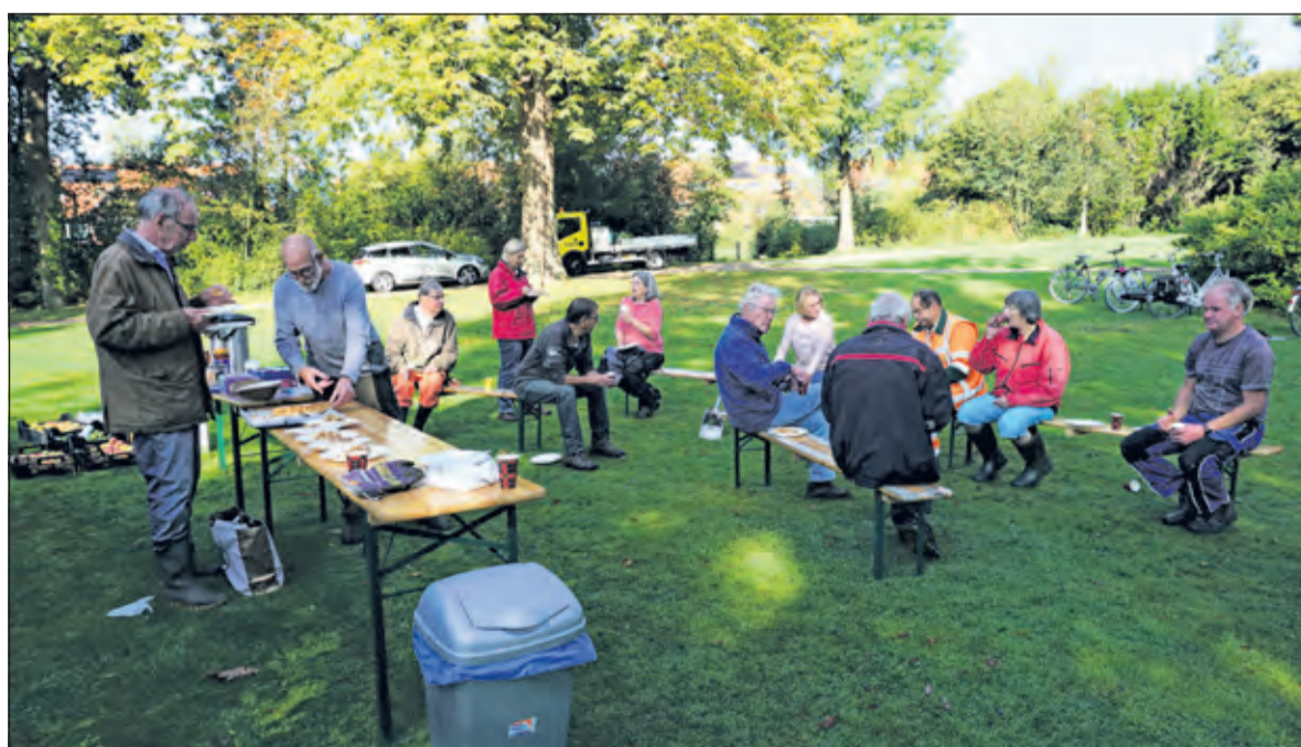
Vrijwilligers van en in het Van Boetzelaerpark genieten in de kofflepauze tijdens de eerste werkochtend na de zomervakantie van, door een van de vrijwilligers gebakken, appeltaart.