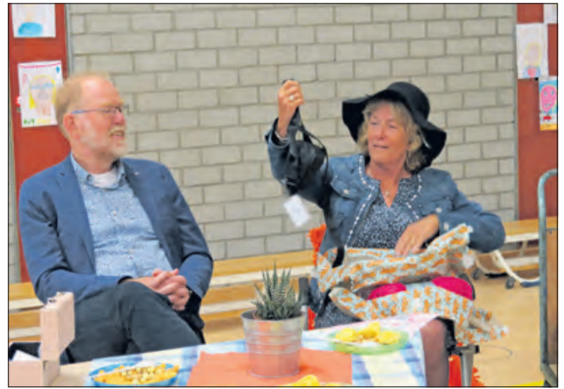
Bij de vele cadeautjes zat ook een mooie hoed die meteen werd opgezet.