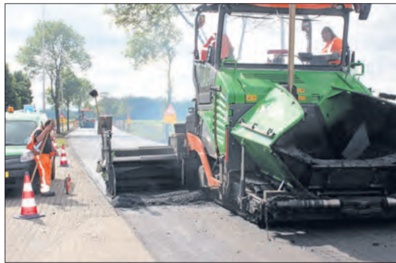
Een asfaltmachine legt een laag klaar voor verwerking ter hoogte van de Brandweergarage Maartensdijk.

Zo houden we corona onder controle Veiligheidsregio Utrecht