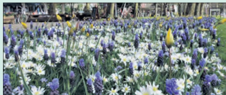
Een mooie bloeiende berm: Volgend lente misschien ook in Westbroek.

In het afgelopen half jaar was er meerdere keren overleg met de gemeente en is er een aantal stappen gezet. De Stichting KIEM heeft de werkgroep voorzien van subsidie om de plannen te realiseren. De gemeente heeft begin september voor het maaien van de bermen in het dorp gezorgd, Cor Bouwman zal de grond bij de entree van het dorp op de Huydecoperweg (grofweg vanaf het bord Westbroek tot aan het dorps huis) wat los maken zodat er stukken ingezaaid kunnen worden met geschikt bloemrijk biologisch zaad.