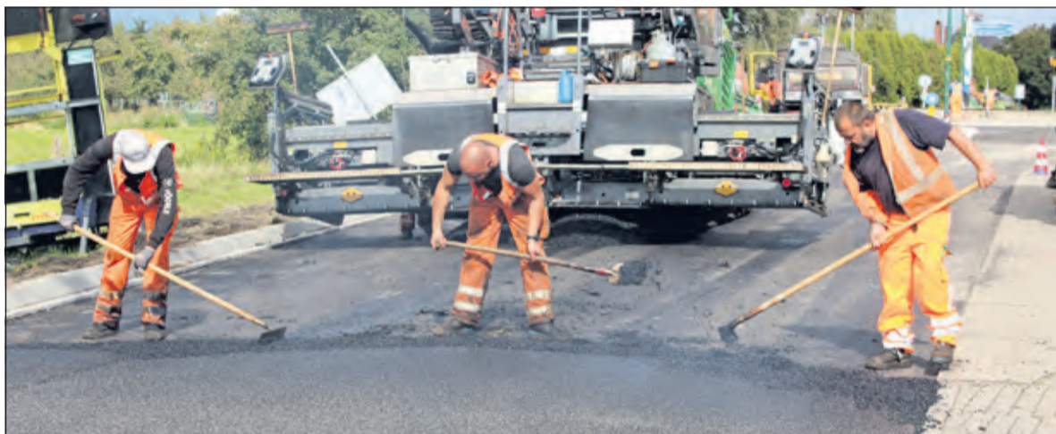
Handwerk is nog steeds onmisbaar.

Doorgaand verkeer vanuit Utrecht en Hilversum richting Maartensdijk wordt omgeleid via de A27, de N234 (De N234 provinciale