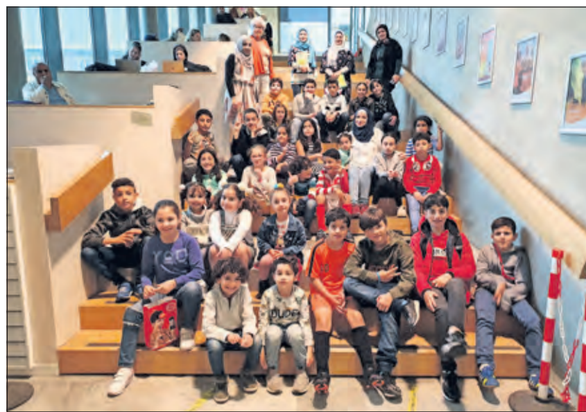
Vijftig kinderen volgen lessen Arabisch in de openbare bibliotheek.

‘Vanaf 3 september geven wij nu iedere donderdagmiddag in het Lichtruim les aan vijftig kinderen van Syrische, Egyptische, Palestijnse, Marokkaanse en Libische komaf en zij zijn allen tussen zes en dertien jaar oud’, vertelt Jamal. Voor velen is Arabisch inmiddels de tweede taal. Met deze cursussen willen wij onze kinderen leesvaardigheid bijbrengen en hopen wij dat zij ook in de toekomst blijven lezen. Een ander doel is hen van de straat te houden’. ‘En dat lukt goed’, vult Donders aan. ‘Na de les zoeken veel kinderen een leuk boek uit in de bibliotheek, om dat thuis te lezen. Jip en Janneke in het Arabisch bijvoorbeeld. De afstand tussen kind en boek moet kort zijn. En wat is dan beter les te geven tussen de boeken die wij hier hebben staan?’