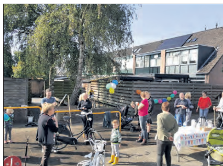
Burendag op Corona-afstand; niet iedereen kon op de foto.