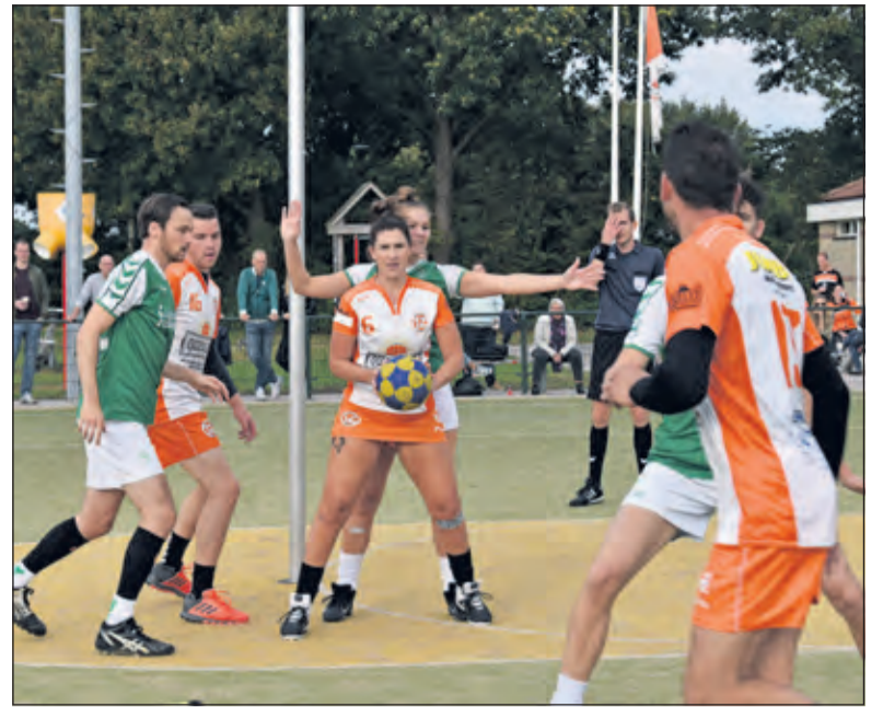
Geconcentreerd spel onder de korf.

steeds gelijk op en er werden nog steeds niet veel doelpunten gemaakt. De thuisploeg slaagde er niet in de tegenstander de baas te worden. De laatste gelijke stand die op het scorebord gestaan heeft was 12-12. Hierna wist BEP een klein gat te slaan dat niet meer kon worden gedicht. De eindstand was 13-16 en TZ liet nogmaals de punten liggen. (Sterre Thijs)