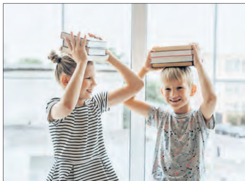
Kinderen ontdekken de werelden van vroeger in de boeken van nu.

iets lekkers heerlijk wegdromen in een boek; van 14.30 tot 16.00 uur. Ook hier is de leeftijdscategorie van 6 t/m 12 jaar en de toegang gratis.