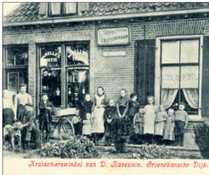
Kruidenierswinkel van Ravestein te Groenekan.