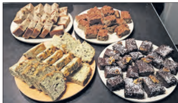
Tijdens het zomerprogramma kan je een workshop 'gezonde tussendoortjes' volgen.

In de workshop legt Annoesjka uit wat bepaalde voedingsstoffen in je lijf doen, proeven de deelnemers een paar tussendoortjes en daarna mogen ze zelf aan de slag: 'Een ideale combinatie'. Aanmelden voor de workshop kan via https://www.mensdebilt.nl .