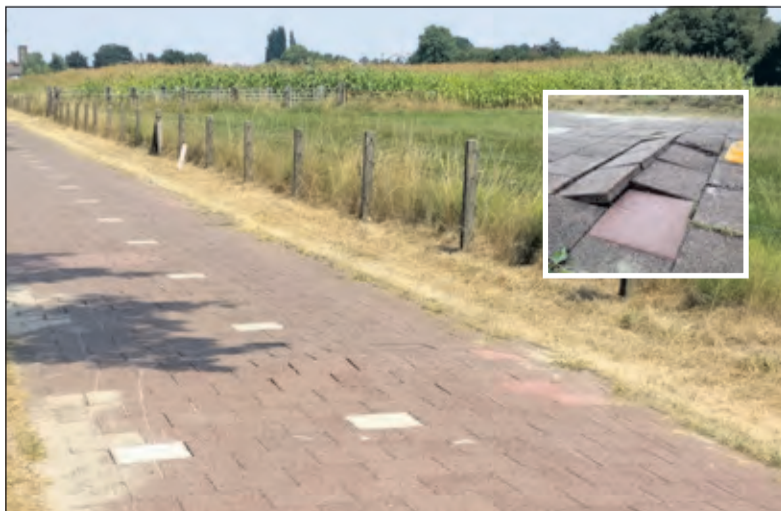
Het fietspad was donderdag rond 13.00 uur gerepareerd.

Van Foreest vervolgt: ‘Wij vinden het belangrijk dat de wegen en de fietspaden in een goede en verkeersveilige conditie zijn en blijven. De tegels van het fietspad bij Maartensdijk zijn omhoog gekomen door de aanhoudende warmte en de droogte. Er kan sprake zijn van uitzetting over een grotere lengte waardoor er spanning is ontstaan en dan gaat het ergens mis. Ook droogt het zand tussen de tegels uit waardoor de tegels los kunnen raken. In 2020 is de N417 toe aan groot onderhoud. De tegels van het fietspad zullen dan vervangen worden door asfalt. Tot die tijd blijven we reparaties uitvoeren als dat nodig is’.