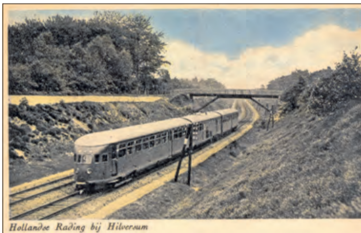
Trein in 1950 onder de spoorwegovergang bij de Zwaluwenberg in Hollandsche Rading.

'Groenekan, Hollandsche Rading, Maartensdijk en Westbroek in oude prentbriefkaarten' door Rienk Miedema is per e-mail te verkrijgen via rienk.miedema@hetnet.nl.