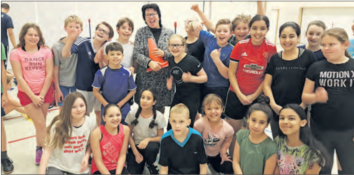
Missie 'Wat beweegt jou' is geslaagd.