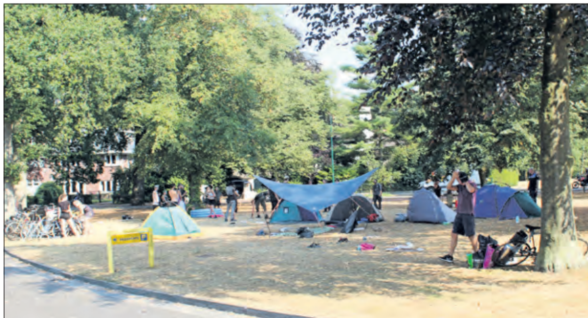
De krakers bivakkeren uit protest op het terrein voor het gemeentehuis.

Met de gebouwen in Groenekan is het anders gesteld. De puinhoop is daar zo groot dat de gemeente een bedrijf heeft moeten inschakelen om de rotzooi op te ruimen.