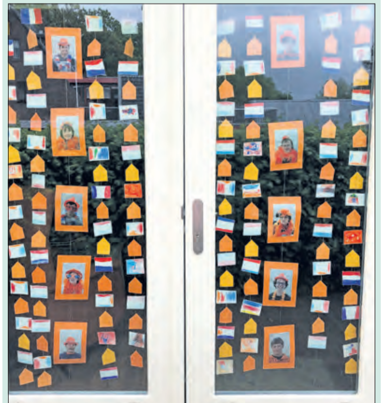
Het Thomashuis sleepte de 2e prijs in de wacht.