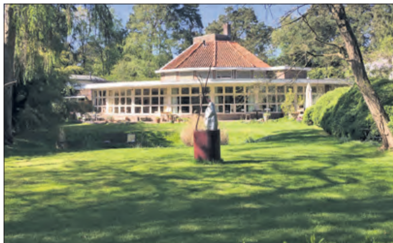
Een voorbeeld(-vraag): Waar staat dit rijksmonument? (foto), Wanneer is de huidige gemeente De Bilt ontstaan? Dit en vele andere vragen vind je in de quiz over de gemeente De Bilt!

code die naar deze quiz leidt. De quiz zal 2 (misschien 3) weken online zal zijn vanaf 25 of 26 mei. Deelnemers kunnen ook winnaars worden; in het kader van 'mee-doen is belangrijker dan winnen' maakt iedereen kans ongeacht het aantal vragen goed of fout. Elke deelnemer kan maximaal 1 prijs winnen. Na de eerste week komt er een bericht online (Facebook en Instagram) met daarin nogmaals de link naar de quiz en de bekenmaking wat er allemaal te winnen is.