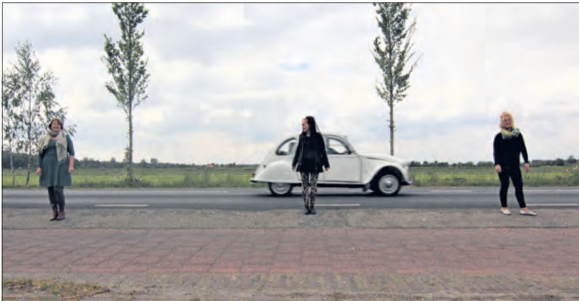
Bewoners op de Koningin Wilhelminaweg, zonder bescherming van een voetpad, balancerend tussen twee kwaden - de snelweg en het fietspad - beide ingericht om te snel te rijden.

groep) vervolgt: 'Er ligt nog steeds geen tekening, financiële onderbouwing, tijdslijn, niks. Deze week namen de ambtenaren van de gemeente al een voorzetje op de gevolgen van de coronacrisis: de bezorgde ouder en leden van de werkgroep werd duidelijk gemaakt dat aanpassing van de straat lang op zich laat wachten want het geld voor herinrichting is na de coronacrisis zeker op en 'weet u wel hoeveel straten deze gemeente heeft?'. Werkgroep lid Paul Lange-dijk: 'Nou, de bewoners van de KW weg waarschuwen de gemeente: hun geduld is ook op. Kinderen zijn kinderen, een stap vanaf het erf kan dodelijk zijn. De politie heeft voor de zoveelste keer duidelijk gemaakt: ze zullen nauwelijks handhaven want de wegbeheerder is verantwoordelijk voor een juiste inrichting van de weg'. De bewoners roepen de politiek op om hun belofte na te komen en nou eindelijk eens werk te maken van het kind-vriendelijker inrichten van de Koningin Wilhelminaweg Groenekan.