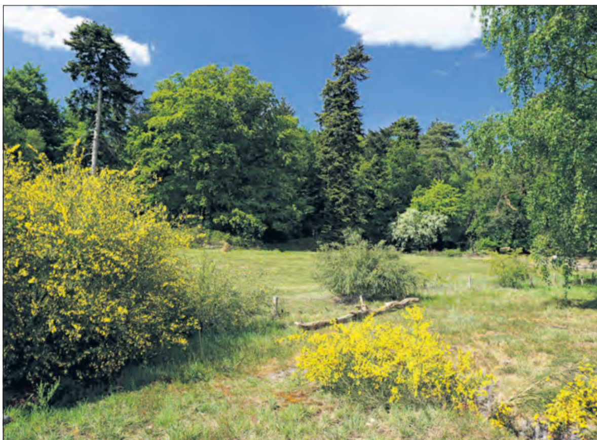
Wie een wandeling op landgoed Houtringe in Bilthoven maakt kan worden verrast door de kleurenpracht van het bos en - ondanks het mooie lenteweer - meevallende aantal genietters.