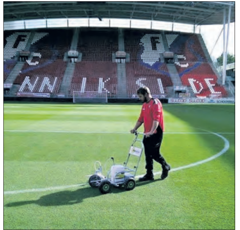
Jan trekt lijnen.