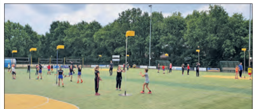
Afgelopen zaterdag kregen de spelers en speelsters uit de E en de D al een eerste clinic van selectiespelers.

Inmiddels trainen de jeugdteams van Nova alweer drie weken, met inachtneming van de coronamaatregelen. De korfbalvereniging organiseert zaterdag 23 mei trainingen voor niet-leden-kinderen van 4 tot en met 12 jaar. Kinderen kunnen worden aangemeld via 'Sjors Sportief – Veilig Sporten' of stuur een mailtje met de naam, leeftijd en basisschoolgroep naar tc@kvnova.nl . Lees voorafgaand het corona-protocol op www.kvnova.nl .