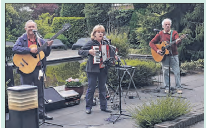
Vrijdag 15 mei werden de bewoners van Schutsmantel getraakteerd door de groep Traesure op een concert. Zij speelden Engelstalige muziek uit de 50, 60, en 70-er jaren. Er werd genoten en regelmatig meegezongen. (Marlies Dijkkamp)