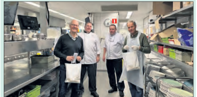
In de keuken van Van der Valk Hotel De Bilt zijn weer smakelijke maaltijden bereid.

Er stond een lange rij auto's van de bezorgers van de Rotary klaar om de warme maaltijden bij het restaurant aan te nemen en bij de ouderen langs te gaan. Een van de leden berichtte na afloop dat een dame bij zijn komst aan haar deur in huilen was uitgebarsten. Hij had zelf moeite om het droog te houden. Een van de andere leden verliet zijn bezorgadres met twee chocoladerepen die hem als dank werden aangeboden. (Gert-Jan Sikking)