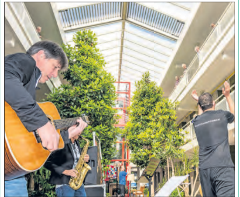
De muzikale sportactiviteit trok veel belangstelling van bewoners van Dijkstate in Maartensdijk.