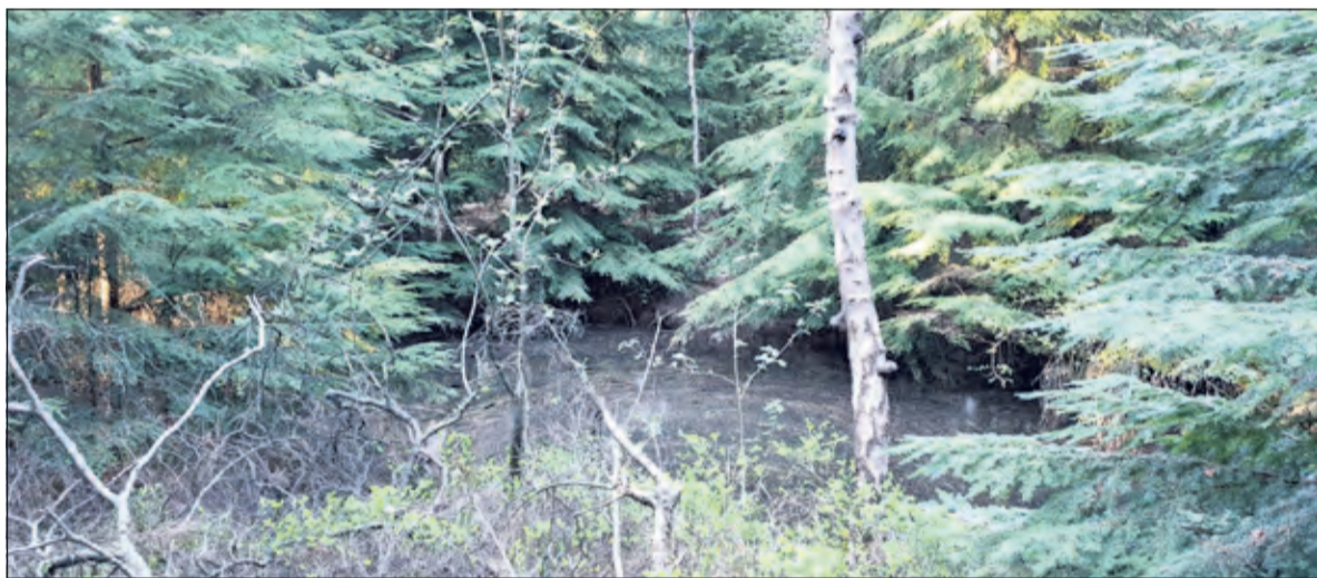
De Canadezen hebben veel Duitse munitie afgevoerd, maar sommige stukken lieten ze springen in een springgat in het bos van Venwoude. Het is nu grotendeels gevuld met water en is deels overwoekerd door struikgewas.

scheen en op Bevrijdingsdag 5 mei bij de inwoners van Lage Vuursche huis aan huis werd bezorgd.