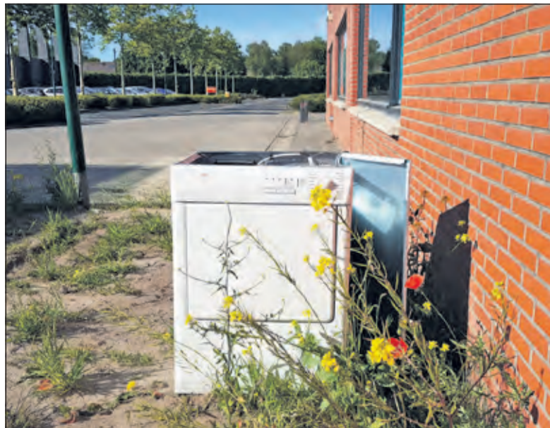
Voor zwembad Brandenburg heeft iemand een oude wasdroger gedumpt. Tussen de klapprozen, dat dan weer wel...

‘In de grootste eenzaamheid wordt zelfs een nutteloze stem belangrijk. Een bloem op de puinhopen, een klapproos tussen al dat grijs,’ zei de Vlaamse dichter Clem Schouwenaars, en de klapproos is dan ook een echte pioniersplant: specialisten in het innemen van een kaal gebied, hebben over het algemeen een korte levenscyclus en vermeerderen zich snel. Ze is daarom het symbool voor de Eerste wereldoorlog, omdat het zaad vooral ontkiemt wanneer de grond wordt verstoord. Daarom stonden op de slagvelden in Vlaanderen tijdens de Eerste Wereldoorlog hele velden klapprozen uitbundig in bloei. Nu maar afwachten tot gemeenteambtenaren de rommel opruimen, en de bloemen laten staan. (Peter Schlamilch)