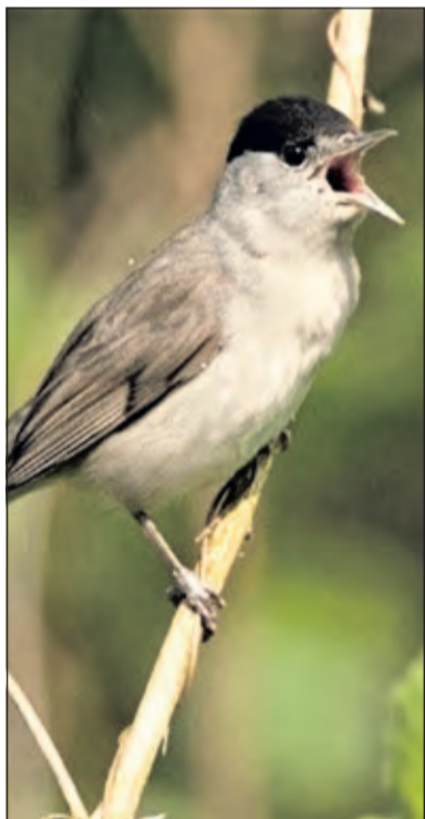
Onlangs is een zwartkop gesignaleerd op de Prinsenlaan.

Het Prinsenlaantje wordt al getekend op de oudst bekende kaart uit 1696 van het gebied rondom Maartensdijk; toen nog Oostveen geheten. Het is een verbindingsweg tussen de dijk van Maartensdijk en de huizen Beukenburg en Bogaerts Burgh, die ten zuiden van de Nieuwe Wetering lagen. Deze beide huizen waren omgeven door bos. Het laantje werd getekend als een dubbele rij bomen, waaruit je kunt afleiden dat het een echte laan moet zijn geweest, met markante oude bomen. Het laantje wordt onderbroken door een stuk bos: het Ridder Bos. Waarschijnlijk heeft hier toen al een boerderij gestaan. Op deze plaats is later de boerderij Ridderhofstad gebouwd, die in 1978 na stormschade is afgebroken.