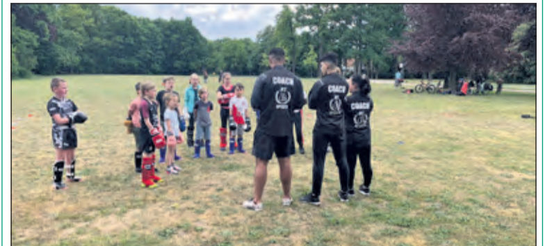
Kickboksen op het grasveld voor het gemeentehuis.

Nu de coronamaatregelen versoepeld zijn, mag de kickboksclub in De Bilt, weer lekker buiten trainen. 'We zijn heel blij dat we weer lessen mogen geven en deze moeilijke tijd overleefd hebben door de steun van al onze leden. In de laatste maanden hebben we home workouts gemaakt en live trainingen om onze leden toch fit te houden. De laatste dagen meldden zich ook niet-leden aan om een weekje gratis mee te doen met onze lessen.' Aanmelden kan via jkekickboxing@gmail.com