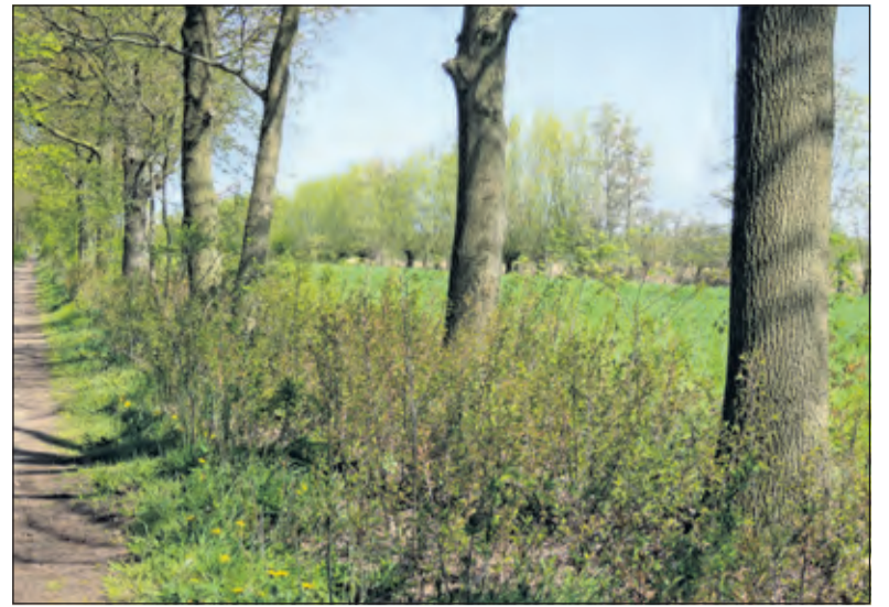
Langs de Prinsenlaan staan veel eiken waar de rups zich bijzonder thuis voelt.

Onlangs werd op twee plekken langs het Prinsenlaantje een koppeltje zwartkoppen waargenomen - duidelijk bezig met het zoeken naar een geschikte nestlocatie. De zwartkop is ongeveer net zo groot als een koolmees en dankt zijn naam aan de zwarte pet op zijn kop, die alleen het mannetje draagt. De zwartkop laat zich niet makkelijk zien, hij laat zich vooral horen: zijn zang is melodieus en gevarieerd en kenmerkend zijn de luide, heldere en hoge tonen aan het einde van de zang. [HvdB]