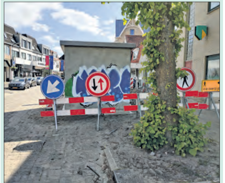
Het gewraakte trafohuisje is toch geplaatst.

Elke brief van de zijde van ondernemers en aanwonenden eindigt met ‘Altijd bereid constructief mee op te denken’ en geeft ook oplossingsrichtingen aan. Het niet in overleg willen treden en het uitvoeren van de eenzijdig bedachte plannen door de gemeente maakt dat ondernemers en aanwonenden wellicht alsnog het wapen van gerechtelijke stappen zullen gaan inzetten.