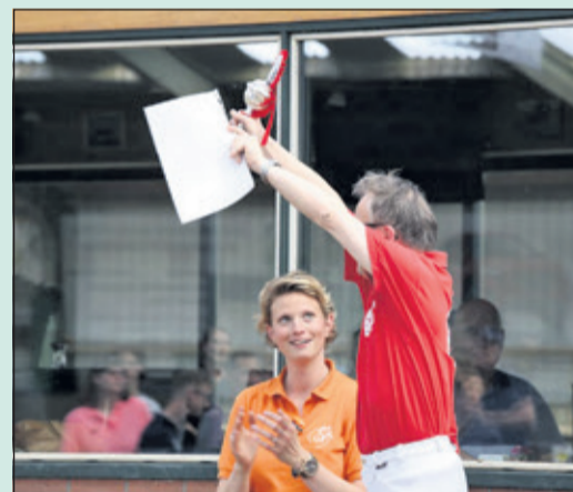
Grote blijdschap bij een van de deelnemers aan het ruiterveekend

Voor het Ruiterveekend Gehandicapten zet een enorme grote groep vrijwilligers zich in en worden alle deelnemers een heel weekend lang waar nodig ondersteund. De ruiters kijken er ieder jaar weer naar uit en niet alleen vanwege de wedstrijden. Want naast de wedstrijden staat er ook een feestavond op het programma. Ruiters en begeleiders ontmoeten twee dagen lang mensen met dezelfde hobby en daar ontstaan weer nieuwe vriendschappen uit.