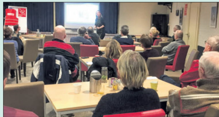
Belangstellenden worden geïnformeerd over de activiteiten van Hartslag De Bilt.

Om meer inwoners van de gemeente te bereiken wordt er op 13 februari een volgende algemene voorlichtingsavond georganiseerd in Maartensdijk. Het programma is gelijk aan dat van de avond in De Bilt: Overweegt u burgerhulpverlener te worden, heeft u een AED en wilt u deze beschikbaar maken voor de gemeente, overweegt u met de buurt een AED aan te schaffen, heeft u vragen over de app van Hartslag Nu, op al deze en overige vragen wordt antwoord gegeven. Ook voor Burgerhulpverleners die hun ervaringen willen delen is er ruimte. De informatieavond start om 20.15 uur en vindt plaats in De Vierstee in Maartensdijk. Voor nadere informatie zie www.hartslagdebilt.nl