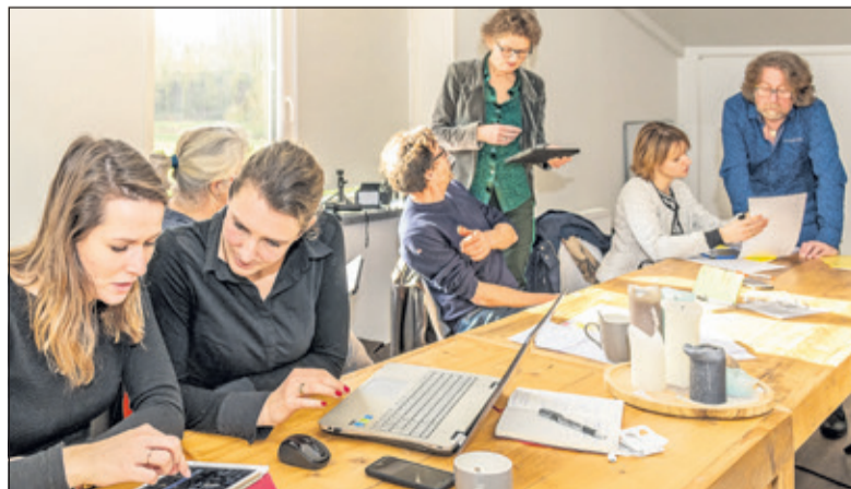
Cursisten OneMinuteVideo leren hun filmpjes monteren.

De afspraak tussen De Totem en genoemde maatschappelijke organisaties, werd gemaakt tijdens de beursvloer van Gemeente De Bilt van november jl. Bij deze beursvloer handelden bedrijven en maat-