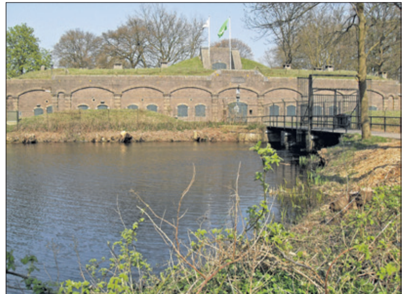
Fort Ruigenhoek was een belangrijk onderdeel van de Nieuwe Hollandse Waterlinie.

In 1996 nam UNESCO de Stelling van Amsterdam op de Werelderfgoedlijst op. In juni 2014 besloot het Rijk om de Nieuwe Hollandse Waterlinie op de voorlopige nominatielijst voor UNESCO Werelderfgoed te zetten, als uitbreiding op de Stelling van Amsterdam. De hoop is dat de Nieuwe Hollandse Waterlinie in de zomer van 2020 door UNESCO wordt aangewezen als Werelderfgoed. Daarmee is het UNESCO-Werelderfgoed Hollandse Waterlinies een feit.