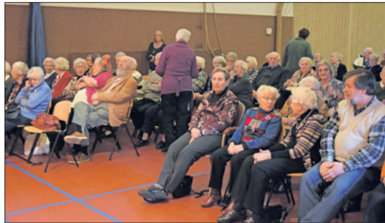
De Zonnebloem geniet weer van een leuke middag.