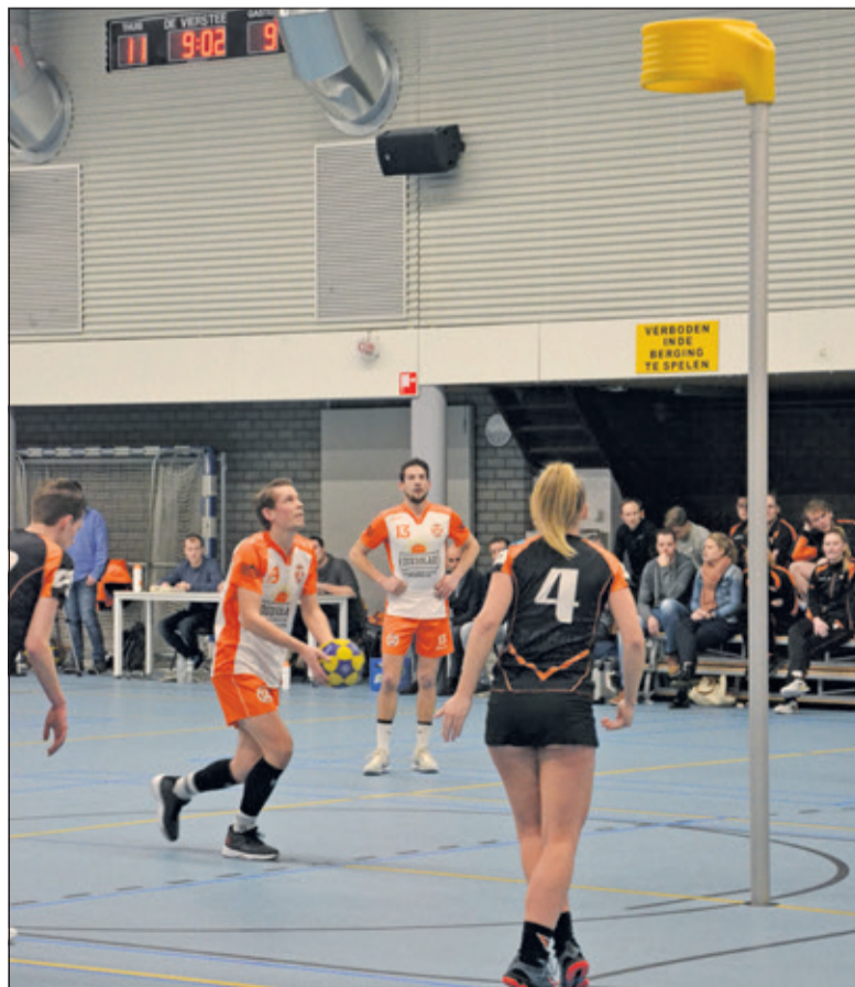
TZ krijgt bij een voorsprong van 11-9 een strafworp.

Na de rust werd zelfs een 20-15 en 25-20 voorsprong bereikt, maar toch ging het aanvallend moeizamer en moest er verdedigend steeds meer vrije worpen cadeau gegeven worden, waardoor Pernix zich terug knokte tot een 26-26 stand en zelfs 2 minuten voor tijd op 27-28 kwam. Uiteindelijk wist Randy de gelijkmaker via een strafworp neer te zetten en eindigde de wedstrijd in 28-28. Een dubbel gevoel overheerst, voor 90% de betere ploeg, maar in de slotfase had er ma zo verloren kunnen worden. Volgende week wacht een mooie krachtmeting in Gorkum tegen GKV.