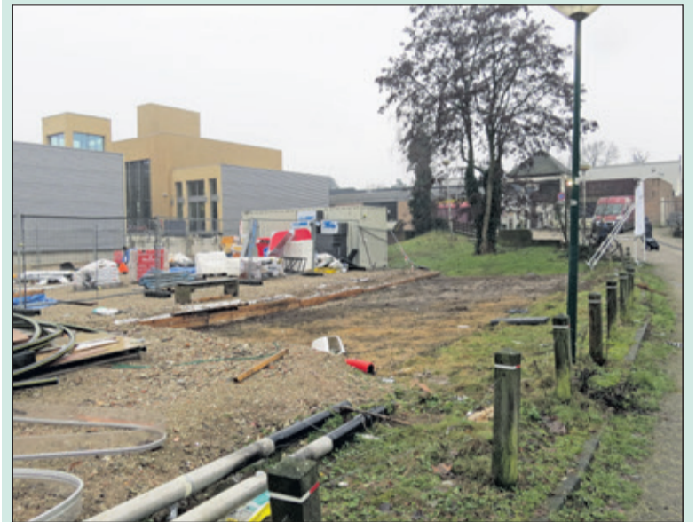
Het voormalige grasveld bij de Kwinkelier nu.