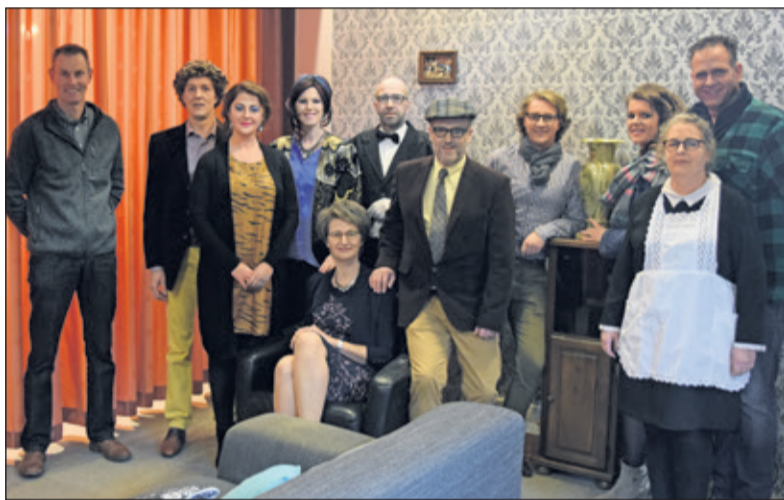
De toneelgroep staat klaar voor een paar gezellige uurtjes.

Vrijdag 8 februari en zaterdag 9 februari vinden nog twee uitvoeringen plaats van het toneelstuk 'Belgisch Roulette', in het Dorpshuis, Prinses Christinastraat 2 te Westbroek. Aanvang: 20.00 uur, zaal open vanaf 19.15 uur. Tijdens de pauze zijn er verlotingen met leuke prijzen. Een deel van de opbrengst wordt ook dit jaar besteed aan de extra voorstelling voor De Zonnebloem.