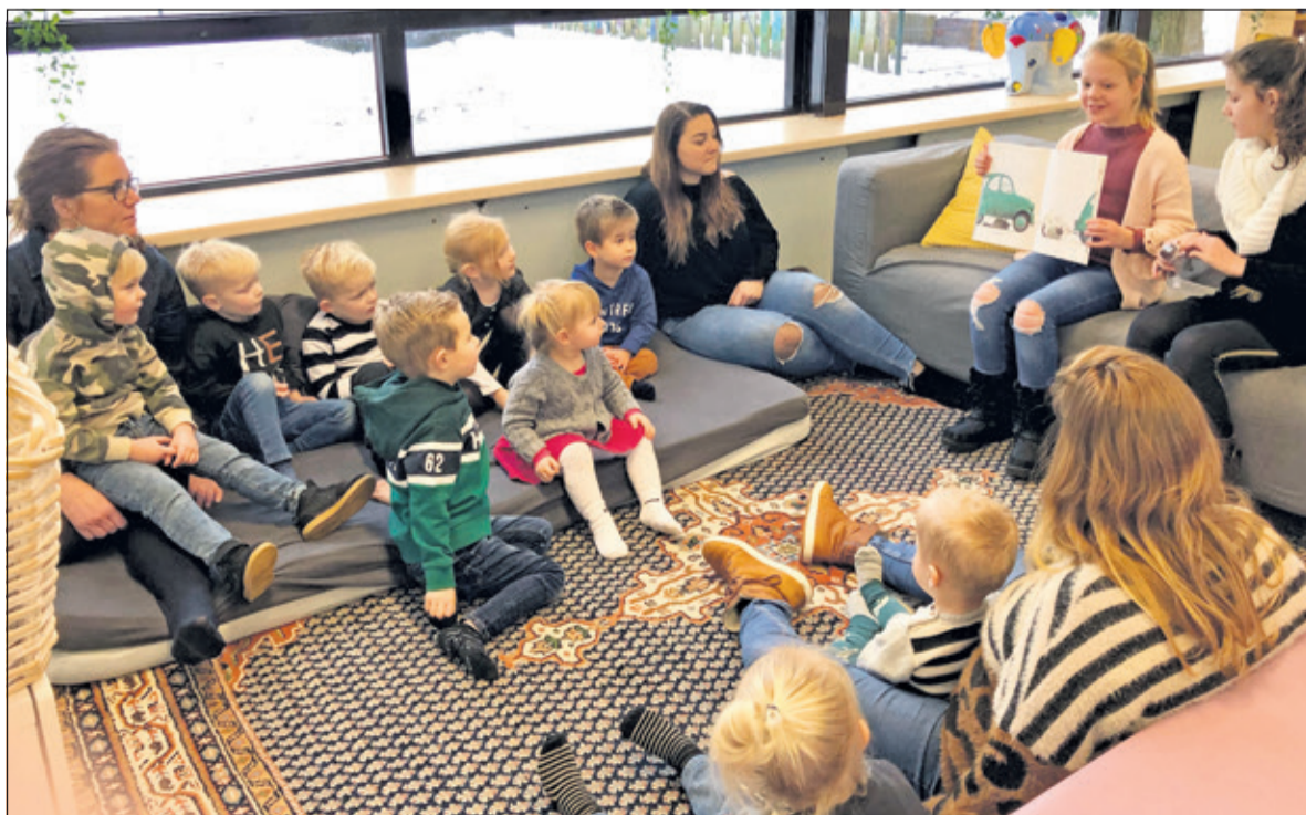
Leerlingen uit groep 6 lezen voor aan de peuters.