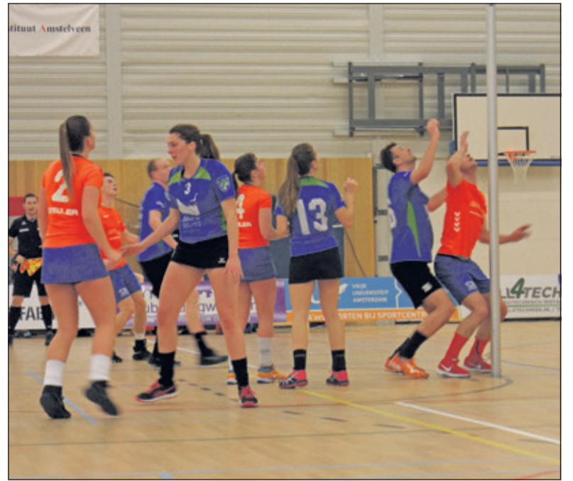
Door de 18-19 overwinning stijgt DOS naar de vierde plek op de ranglijst.

dit seizoen gaven de Westbroekers zich niet snel gewonnen. Op wilskracht werkten ze de achterstand weg. Met een eerste serie van drie doelpunten kwam DOS op 16-16. Na een doelpunt van KVA kwam DOS met een tweede serie van drie doelpunten op een 17-19 voorsprong richting het einde van de wedstrijd. Een vrije bal van KVA in de laatste minuut zorgde nog voor spannende slotseconden, maar DOS speelde de wedstrijd vakkundig uit. Volgende week ontvangt DOS koploper HKC uit Hardinxveld in De Vierstee. De wedstrijd begint om 20.30 uur.