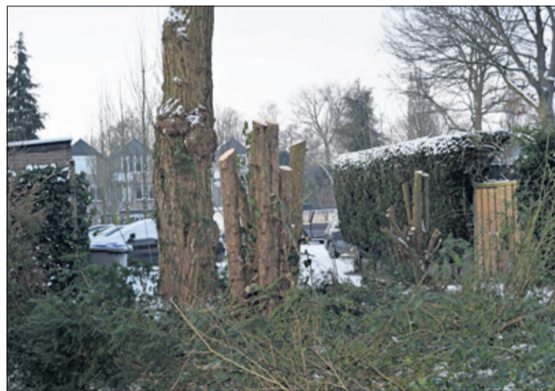
Kaalslag op de Iepenlaan.

Wat steekt is de wijze waarop de snoei heeft plaatsgevonden. 'Het is zo onverschillig gedaan. Dat er gesnoeid moet worden, wij vinden het niet noodzakelijk, maar daar leggen we ons dan maar bij neer. Maar als dat nou je werk is, waarom dan niet met een beetje plezier. Je bent hetzelfde aantal uren bezig. Wie geeft toch die opdracht om de omwonenden zo ongelukkig mogelijk achter te laten. Wat is onze winst als we naar kale muren, scheefgezakte schuttingen en verbleekte parasols moeten kijken omdat de prachtige groenblijvende bomen op last van