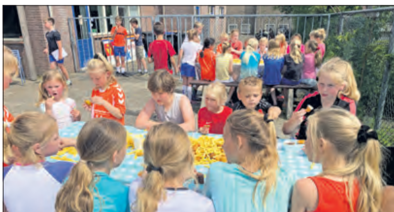
Afsluiting van de dag met friet-tafels, lekkere snacks, een watergevecht, en natuurlijk, met een leuk potje korfbal!