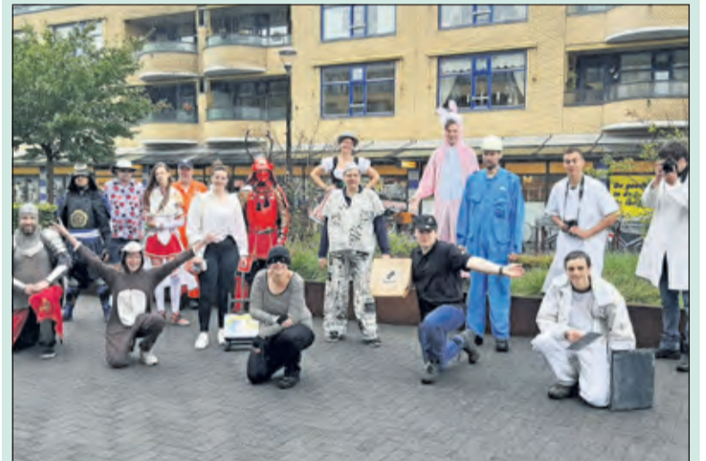
De vossen van AMG weten zich ieder jaar weer mooi te vermommen.

In september start een nieuwe bevergroep bij de AMG. De bevers zijn kinderen tussen de 5 en 7 jaar oud en komen elke zaterdag van 11.45 tot en met 13.15 uur bij elkaar op het clubhuis voor spellen, knutselen en koken naast veel andere activiteiten. Info beversamg@gmail.com