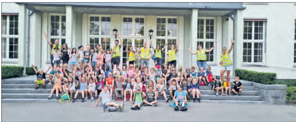
De deelnemers bij gemeentehuis Jagtlust in Bilthoven.

daille in ontvangst te nemen. Daarna konden de kinderen en ouders die gereserveerd hadden, genieten van een heerlijke snack op het 1,5 meter-terras. (Renske van Kempen)