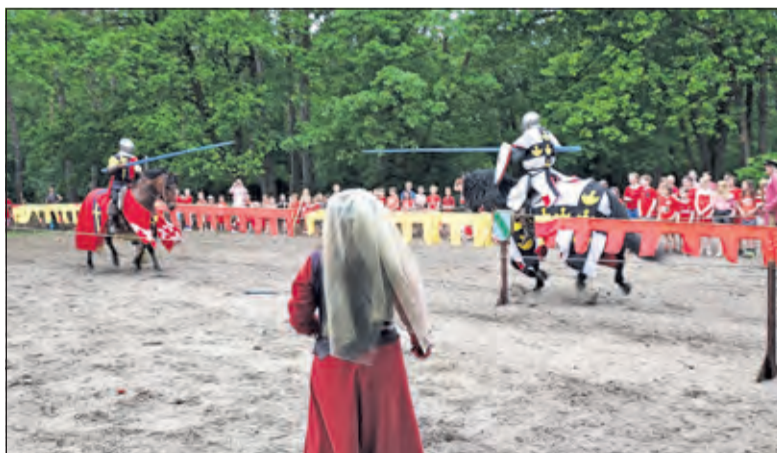
Het toernooi was het hoogtepunt van de dag.

Er moest gekozen worden tussen Ridder Rode Roderick en Ridder Witte Wilhelm. Alle ruim 200 kinderen werden verdeeld in een rode en een witte ploeg en moedigen hen aan tijdens een echt toernooi. De ridders hadden natuurlijk het een en ander uit te vechten en hierbij konden ze wel wat steun gebruiken van extra ridders. De leerlingen gingen daarom in de ochtend zwaardvechten, boogschieten,