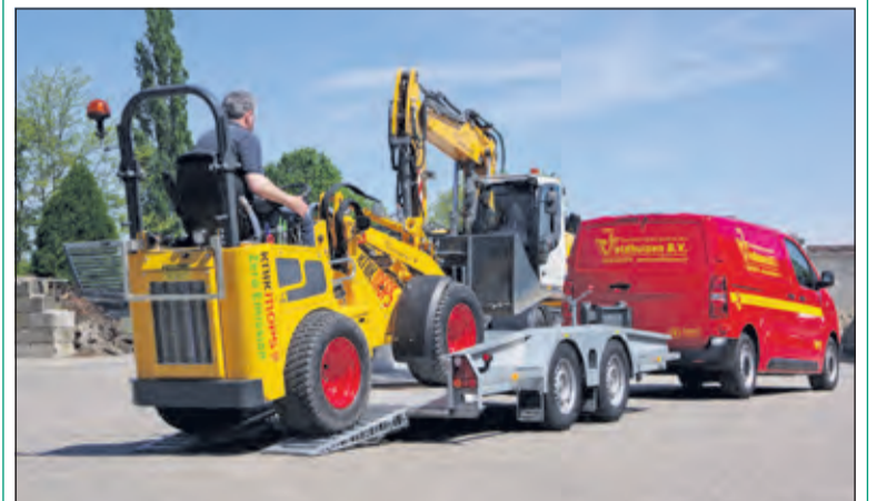
Veldhuizen Wagenbouw maakt zero emissie transport mogelijk voor het Westbroekse aannemersbedrijf.

Naast de elektrische Toyota en de E-Knikmops heeft J. Veldhuizen ook een volledig elektrische 17,5 tons mobiele kraan besteld. Daarmee breidt het bedrijf de zero emissie services nog verder uit voor klanten die bereid zijn om wat extra te betalen voor duurzame oplossingen voor bestratingswerken.