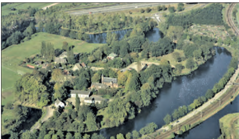
De Bastionweg loopt rond fort Blauwkapel naar de Voordorpsedijk.