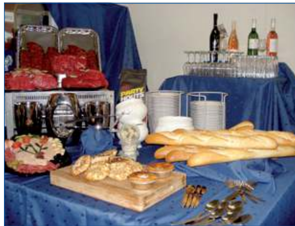
Zweistra ontzorgt graag.

Kortom, Zweistra levert niet alleen het vlees, maar ook het brood en de mandjes. Ze komen de spullen schoon brengen, halen het vuil weer op en doen de afwas!