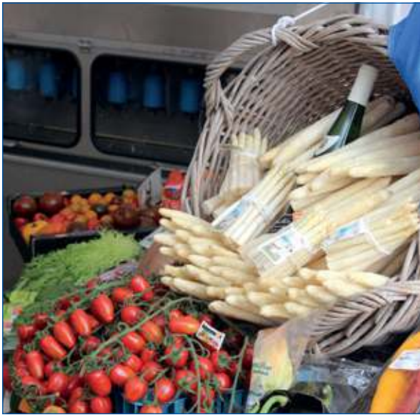
Met Landwaart tover je in een handomdraai een lekkere maaltijd op tafel.