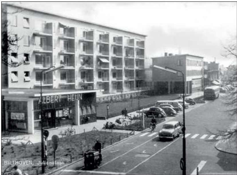
In de 'zwarte doos' is nu de Bilthovense Boekhandel gevestigd en in de kelder Macloud.