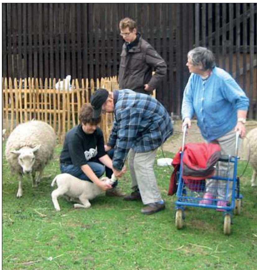
Het vertroetelen der dieren.

Daarnaast kan men ook kennis nemen van de mogelijkheden voor dagbesteding op de boerderij waar het gaat om arbeidstraining en leerwerktrajecten om mensen voor een betaalde baan op