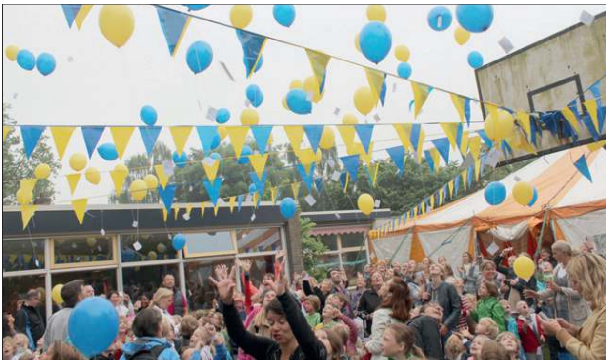
Op aftellen vertrokken de ballonnen naar onbekende oorden en niet lang daarna alle leerlingen van de Nijepoort naar De Efteling. [HvdB]