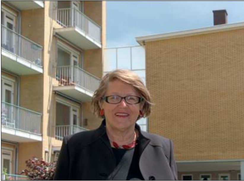
De zwarte doos van Dudok moet beslist behouden blijven, want het pand maakt deel uit van het Dudokcomplex bij station Bilthoven. Het complex in zijn geheel is van grote architectuurhistorische waarde en tegenwoordig ook als culturele ontmoetingsplaats van grote betekenis voor de gemeente.