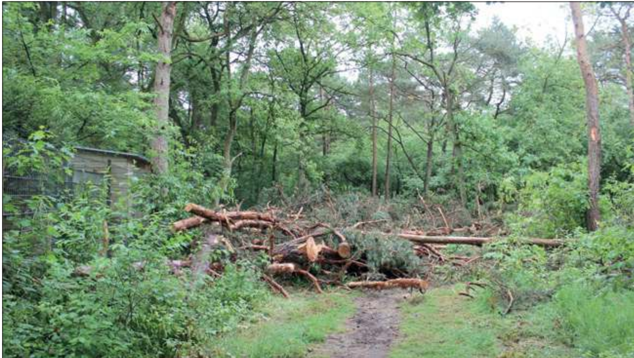
Het bos lijkt reddeloos, de eigenaar redeloos en de lokale bestuurders radeloos.