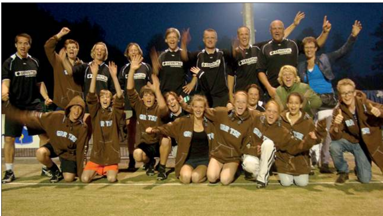
De enthousiaste finalisten van het 16e Combikorfbaltoernooi.