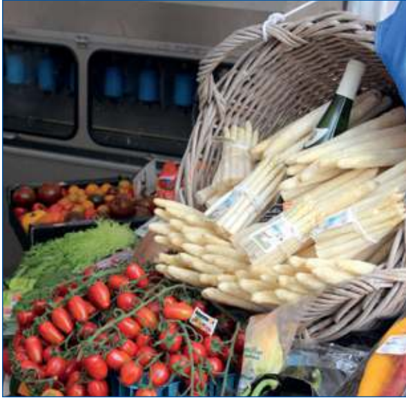
Met Landwaart tover je in een handomdraai een lekkere maaltijd op tafel.