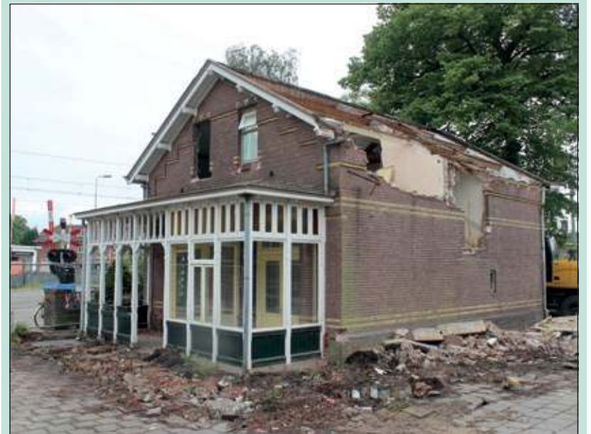
De ontmanteling van de voormalige spoorchefswoning in Bilthoven is in volle gang. 21 mei jl. werd het tijdpad openbaar: op 22 mei werd begonnen met asbestverwijdering en 29 mei met de demontage en opslag. Op 8 juni moet alles weg zijn, inclusief het groen er omheen. [GG]