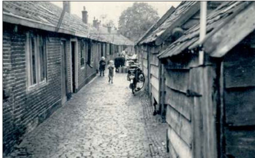
Het oude Jodenkerkhoff (100 bij 100 m 2 ) werd door de gemeente rond 1920 aangekocht, behalve een stukje zgn. 'heilige grond' van 10 bij 10 m. Hoe?; dat kan men straks in het boek lezen.

Saamhorigheid was een sleutelwoord op 't Jodendom. Verenigingen, sporten, oranje- en zomerfeesten, jaarlijks slachten en bij geboortes, de saamho-