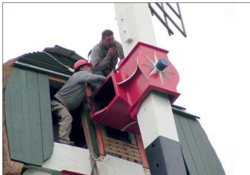
Heel voorzichtig wordt de eerste roede op de molen bevestigd. Een secuur werkje.

volgende dag beginnen om ook het 'kale stuk' van de roede weer van dit latwerk te voorzien. De restauratie begint op z'n eind te lopen. De bedoeling is dat de € 225.000 kostende restauratie op 1 juli is afgerond en dat de molen op die datum wordt opgeleverd. Achter op de kap staat nu al heel parmantig een zwart vogeltje op een stokje. Het lijkt verdacht veel op een kraai. Het doet dienst als windvaan zodat de molenaar precies kan zien uit welke hoek de wind waait.[MN]