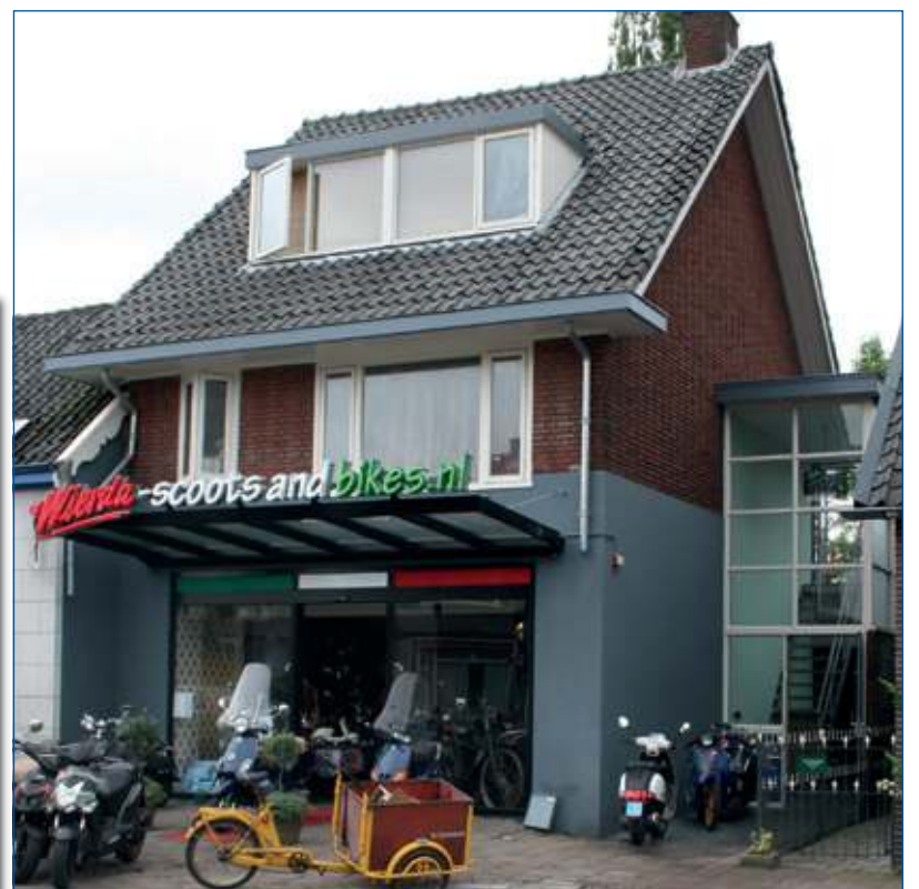
265 m 2 showroom vol mogelijkheden.

Openingstijden: dinsdag t/m vrijdag 9.00 - 18.00 uur zaterdag 9.00 - 17.00 uur