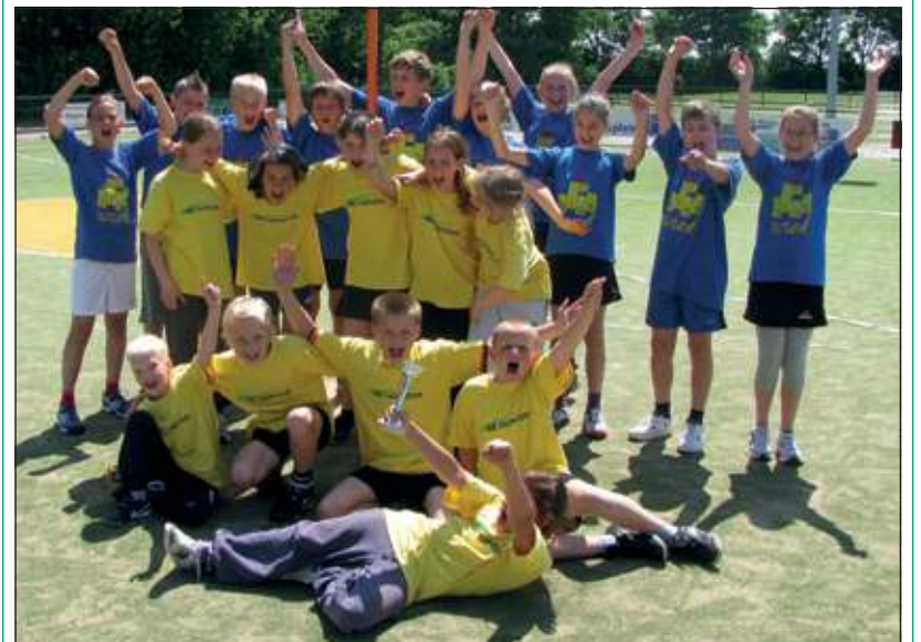
De kampioenen, in het geel De Horizon, met de blauwe shirts De Vlaswiek.

De winnaars waren bij groep 5/6 De Horizon uit Amersfoort die met 3-1 won van de Patrimoniumschool uit Veenendaal. Bij groep 7/8 ging de winst naar De Vlaswiek uit Houten die na verlenging met 9-6 won van Het Mozaïek uit Maarssen.