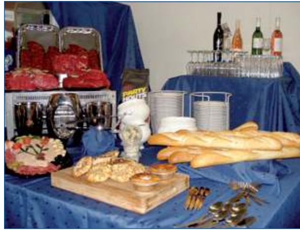
Zweistra ontzorgt graag.

Kortom, Zweistra levert niet alleen het vlees, maar ook het brood en de mandjes. Ze komen de spullen schoon brengen, halen het vuil weer op en doen de afwas!