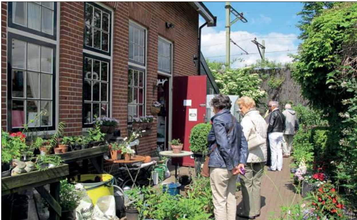
De Open Dag bij de Theetuin is goed bezocht.

De Theetuin is gelegen aan de Spoorlaan 11 in Bilthoven en is in juni elke woensdag geopend van 12.00 tot 17.00 uur; plus de eerste twee woensdagen van juli en de laatste twee woensdagen van augustus. [LvD]