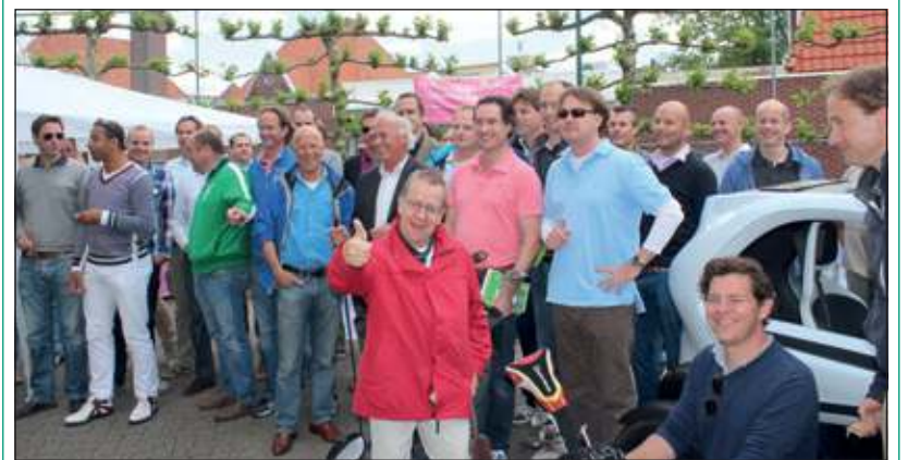
Deelnemers voor de start eerst met iedereen op de foto.