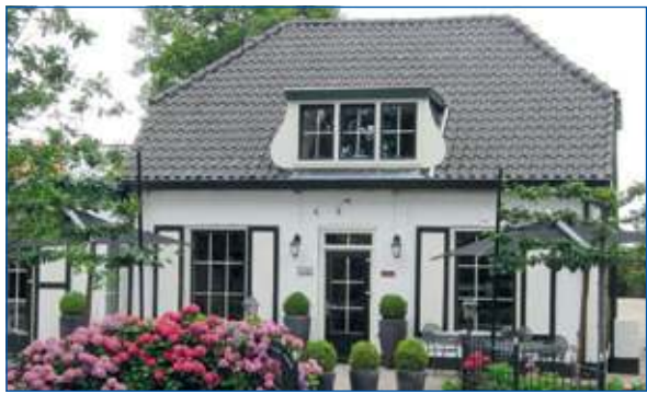
Zilt & Zoet trakteert de geslaagden.

Schroom dus niet om je examenuitslag te vieren met een 3, 4 of 5-gangen menu bij Zilt & Zoet. De prijs van de menu's begint bij € 35,00. Ben je met minimaal 3 personen, dan eet de geslaagde helemaal gratis. Wel even melden bij reservering, luidt het verzoek en voor alle duidelijkheid; drank is niet inbegrepen.