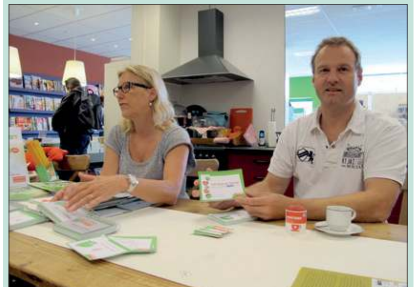
DiKiBo helpt kinderen op een andere manier leren.