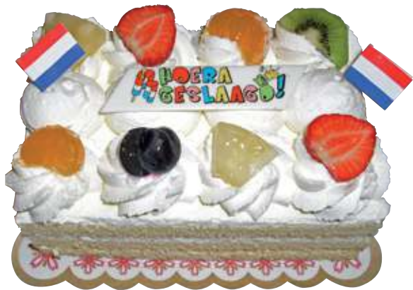
De banketbakkers verheugen zich al op het maken van de feestelijke examentaarten.