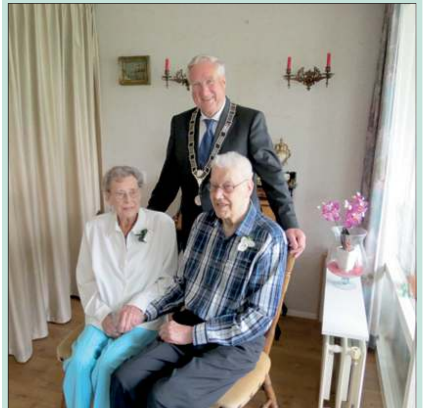
Het diamanten bruidspaar met locoburgemeester Ditewig.