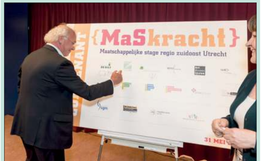
Op het podium stond een manshoog bord met de logo's van deelnemende partijen. Eén voor een zetten directeuren van scholen en welzijnsinstellingen en wethouders hun handtekening op het bord.

Donderdag jl. is het convenant maatschappelijke stage regio zuidoost Utrecht ondertekend. Deelnemende partijen uit de gemeenten Zeist, De Bilt, Utrechtse Heuvelrug en Wijk bij Duurstede spraken met elkaar af om nog beter te gaan samenwerken rond maatschappelijke stages (MaS). Het is de bedoeling dat stage(aan-)bieders voortaan niet door vijftien leerlingen tegelijk worden benaderd voor een enkele stageplek en VMBO leerlingen evenveel kans hebben op een stageplek als VWO leerlingen. Kortom; afspraken om de kwaliteit van maatschappelijke stages te verbeteren.