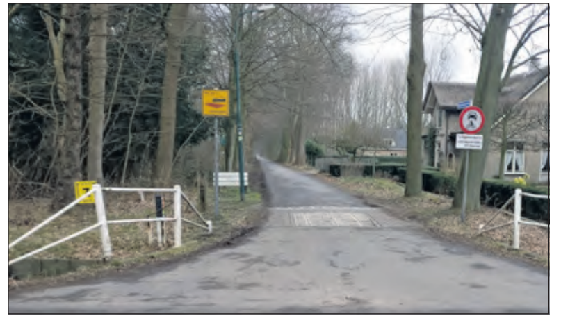
Entree klompepad bij Beukenburg.