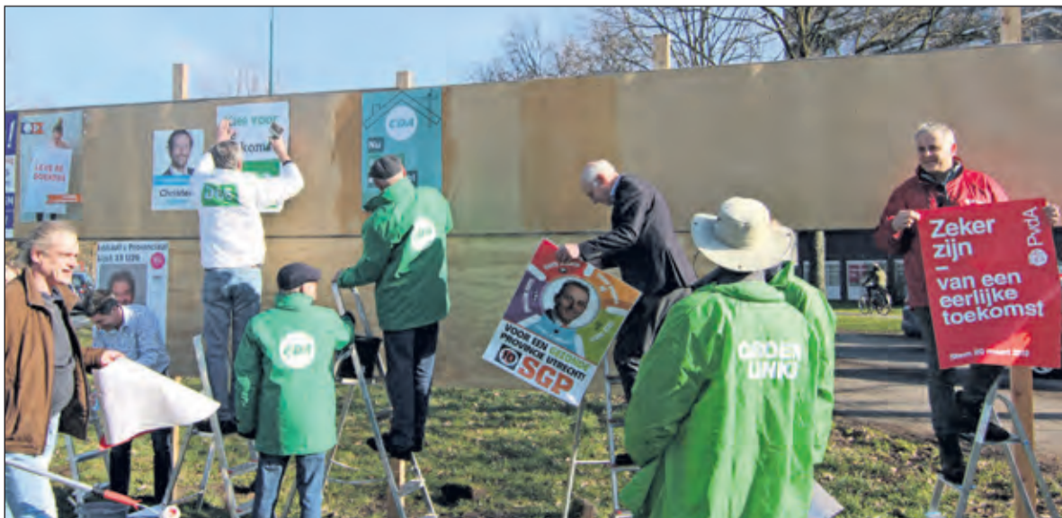
Zaterdag 23 februari plakten Biltse politieke partijen met een vertegenwoordiging op de kieslijst van Provincie en/of Waterschap in een gezamenlijke plaksessie de verkiezingsposters.