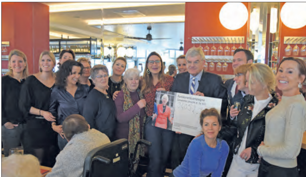
Ouderen bijeen in restaurant Danel voor een gezellig etentje met twee burgemeesters ter afsluiting van een campagne, waarin iets meer dan 34.000 euro werd opgehaald.

Deelnemende restaurants in De Bilt zijn: Amis, Meneer Vink, De Witte Zwaan, Brasserie Le Nord, Eetcafé Van Miltenburg, Joos, Pomp 41, Buiten!, Ripassa, PK Bilthoven, Dorpsbistro Naast de Buren, Yamas, Artisjok, Settlers, Loft88, Zebs en Bubbles en Blessings. Voor mee informatie over 'Eet met je Hart': www.metjehart.nl