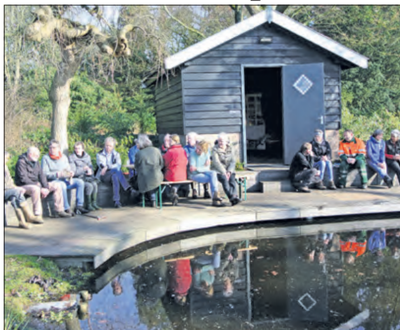
Tijdens de maandelijkse werkochtend in het Van Boetzelaerpark genieten vrijwilligers zaterdag 23 februari in de koffiepauze van de voorjaarszon. (Frans Poot).