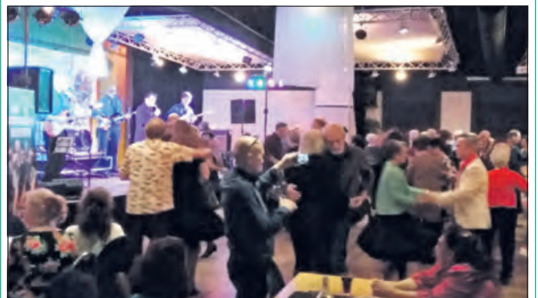
The Explosion Rockets weet de gasten de dansvloer op te krijgen.

In een afgeladen grote zaal dansten de paren dat het een lieve lust was, stomende lichamen en erotische 'moves' waren aanwezig en de opzwepende muziek hield niet op de dansers aan te vuren tot grote hoogten. Een supergezellige en sfeervolle avond, waarvan er overigens binnenkort meer gepland staan. (Peter Schlamilch)