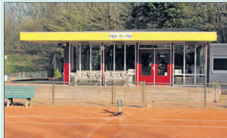
Zondag 31 maart 2019 start het jubileumjaar met het traditionele openingstoernooi.