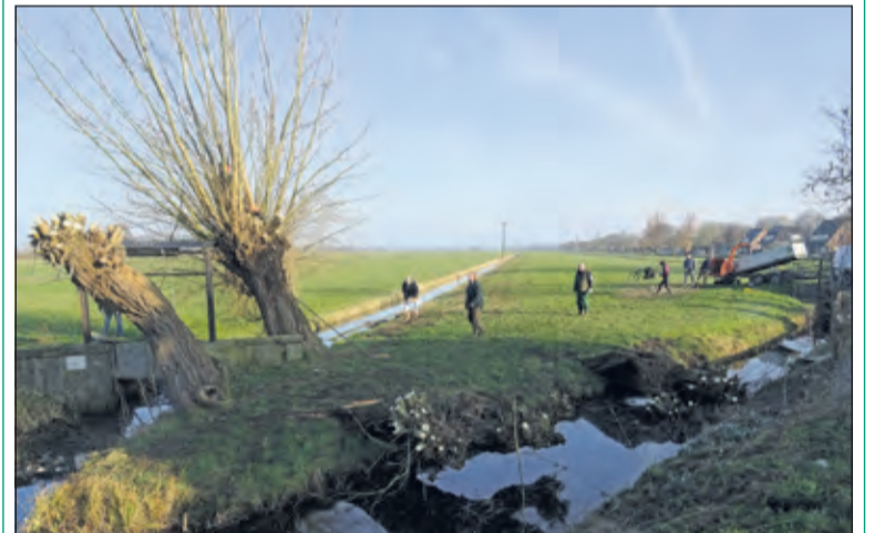
Leden van Het Groenekans Landschap zijn druk met het onderhoud van de wilgen.

Niet alleen de wilgen werden geknot. Ook werd er onderhoud gepleegd aan het historische sluisje en werd de paal met het ooievaarsnest dat van de Koningin Wilhelminaweg zo goed is te zien neergehaald in afwachting van een betere plek. Het Groenekans Landschap is nog op zoek naar die andere plek voor het nest. 'Dat is een plek waar de ooievaars reuring om zich heen hebben en bomen achter het nest' aldus een vrijwilliger. Rond 12.30 uur was het werk geklaard.