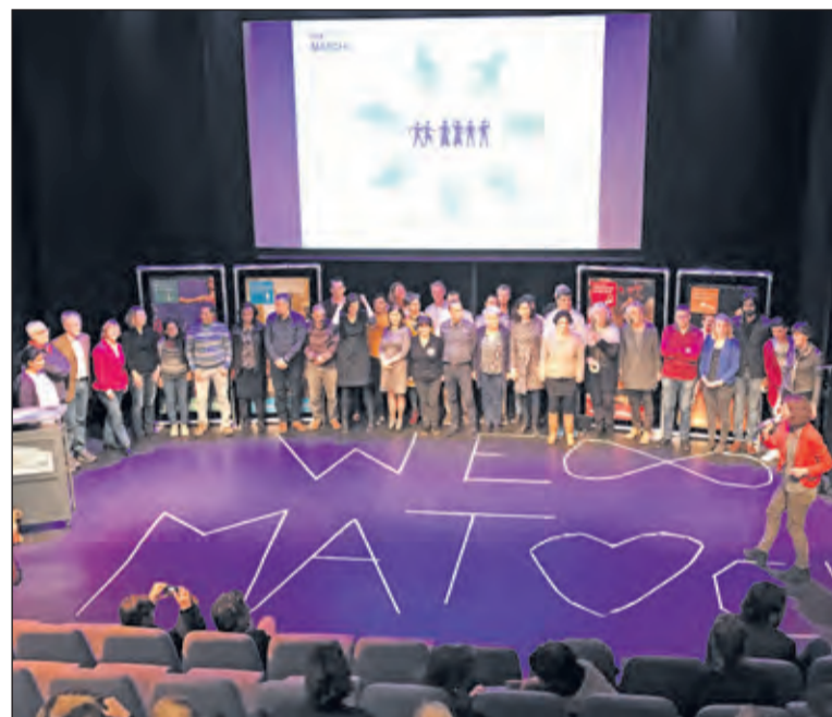
Van de deelnemers aan de eerdere edities vond 80% een baan of begon aan een studie.

De data voor informatiebijeenkomsten zijn dinsdag 5 maart 10.00 uur, locatie Het Lichtruim (Planetenplein 2, Bilthoven) en donderdag 7 maart 19.00 uur eveneens in Het Lichtruim. Aanmelden hiervoor kan via wematchdebilt@gmail.com (voor een aparte afspraak) met Willy Marks (tel. 06 80165980).