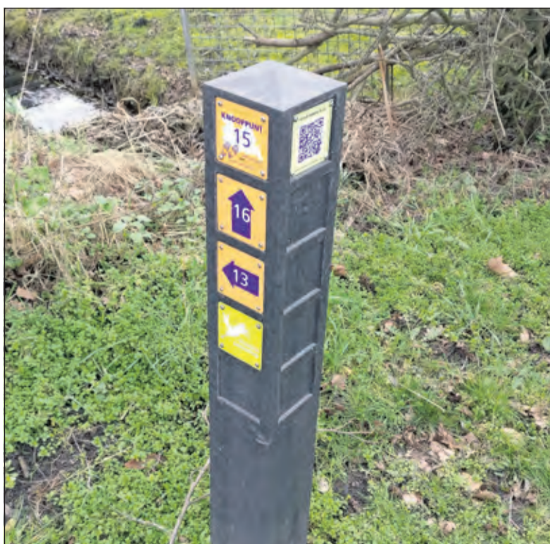
De aanduiding hoek Groenekansweg en Hogenkampse pad is ook voorzien van code plaatje van de QR- route Groenekan, die op 8 maart operationeel zal worden.