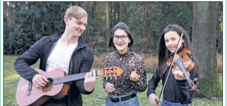
Solisten Tim, Naomi en Emmy speelden en zongen prachtige muziek, waaronder Beethoven, Händel en een mooie jazzsong van Ella Fitzgerald

De afspraak tussen De Koperwiek en De Keen School werd gemaakt tijdens de beursvloer van Gemeente De Bilt van november jl. Bij deze beursvloer handelden bedrijven en maatschappelijke organisaties in materialen, middelen en kennis & kunde. Zonder inzet van geld als ruilmiddel. De beursvloer leverde 82 matches op met een maatschappelijke waarde van 189.365 euro. Eén van de matches was dus de afspraak dat leerlingen van de Keenschool ouderen trakteren op prachtige muziek. (Judith Boezewinkel)