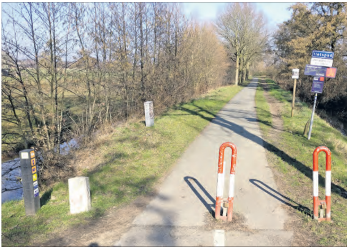
De extra lus van het klompepad loopt langs de Hogenkampse plas en Voordorpsepada.

De route Beukenburgerpad (14 km) start formeel bij de parkeerplaats Groenekansweg bij het viaduct onder de A27 ter hoogte van huisnummer 40. Bij de hoek Groenekansweg / Vijverlaan kan deze minder aantrekkelijke weg al worden verlaten om via allerlei aanwijzingen op de app en min of meer parallel aan het Voordorpsepada in de Nieuwe Wetering te komen. Langs de Nieuwe Weteringseweg (t.h.v. huisnr 153) gaat het weer