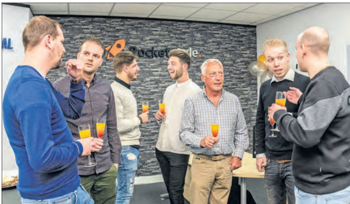
BCB-ondernemers waren onder de indruk van startup Rocketstyle.

ring. Dit houdt in dat Rocketstyle het bedrijf door een aantal fases heen helpt en daar per bedrijfssector een unieke methode voor ontwikkelt. 'Op dit moment zijn we dit aan het uitrollen voor de retail,' vervolgt de enthousiaste ondernemer. 'Om zo winkeliers te helpen de online mogelijkheden te benutten en dat is broodnodig.'