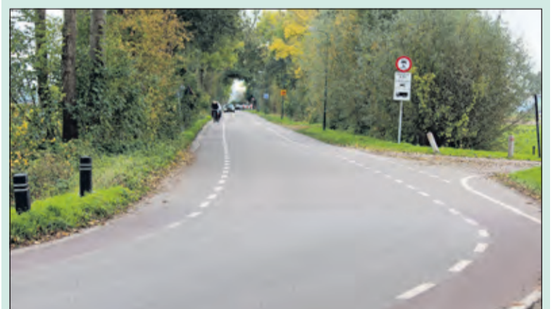
Op de Korssesteeg in Westbroek wordt het verkeer gemonitord via kentekenregistratie.

Het inrijverbod op de Korssesteeg tijdens de spitsuren geldt sinds 2009 en is aangegeven met borden. Veel automobilisten negeren het verbod. Het vele autoverkeer tast de leefbaarheid aan op de smalle wegen in het landelijk gebied waarvan ook fietsers en lokaal vrachtverkeer gebruikmaken. Uit onderzoek is gebleken, dat veel forenzen de route over Westbroek gebruiken om de files aan de noordkant van Utrecht te vermijden. Meer informatie over de proef met de kentekencamera is te vinden op debilt.nl als u 'Korssesteeg' invult in het zoekvenster.