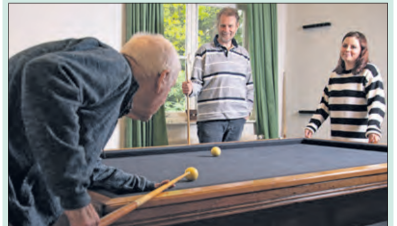
Biljarten dankzij een match op de beursvloer.