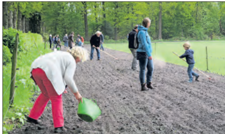
Een jaar geleden werd er een uit meer dan 20 'soorten' samengesteld zaaimengsel aan de akkerranden van een gerstakker langs de Eikensteeg toevertrouwd.

In de weilanden mogen kruiden en bloemen groeien, goed voor het vee, maar ook goed als voeding voor de wilde bij. Daarbij wordt rekening gehouden met reekalveren en hazenjongen door op verschillende percelen niet of uitgesteld te maaien. Ook in de akkers worden akkerlanden ingezaaid met bloemen en kruiden. Op de akkers wordt ploegloos verschillende soorten graan geteeld waardoor het bedrijf geheel zelfvoorzienend is geworden in de stro- en krachtvoerbehoefte. Er zijn rondleidingen en er is een theatervoorstelling in de graanakker door Huize Linda en s 'avonds is er een landgoeddiner in de graanakker direct naast de boerderij (op inschrijving).