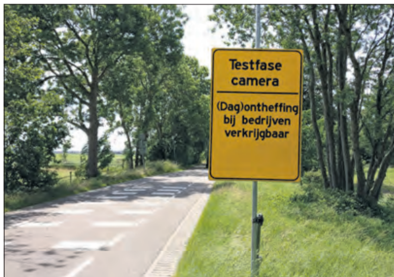
De camera blijft gewoon staan, maar de borden eromheen gaan weg.

Onderdeel van de proef was het testen van een app waarmee ondernemers incidentele dagontheffingen voor hun bezoekers kunnen aanvragen. De app maakt onderdeel uit van een nieuw beheersysteem van ontheffingen. De proef heeft laten zien, dat de app nog niet naar behoren werkt. De komende tijd werkt