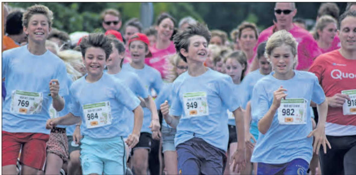
Velen renden de vijf kilometer.