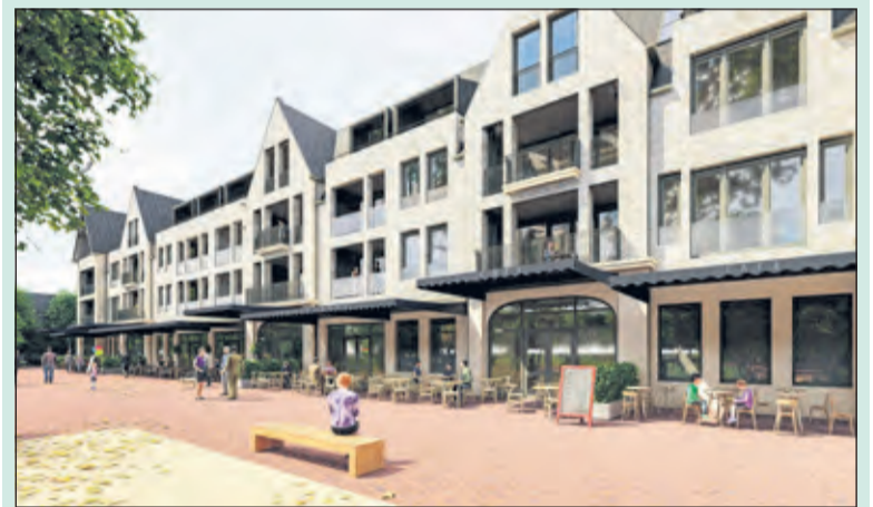
Residence Vinkenplein in wording.

Een groepje leerlingen van de nabijgelegen Julianaschool heeft de afgelopen weken, onder leiding van hun techniekjuf, gewerkt aan een fictief pand. Dit ontwerp is 15 juni in de Kwinkelier te bewonderen. Terwijl (groot-)ouders elders zijn kunnen kinderen een gratis vaderdagkrant maken: bij goed weer buiten op het plein, bij slecht weer binnen aan het plein. (Josta Koot)