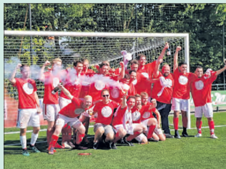
Enthousiasme bij het team van FC De Bilt 5 na het behalen van het kampioenschap.