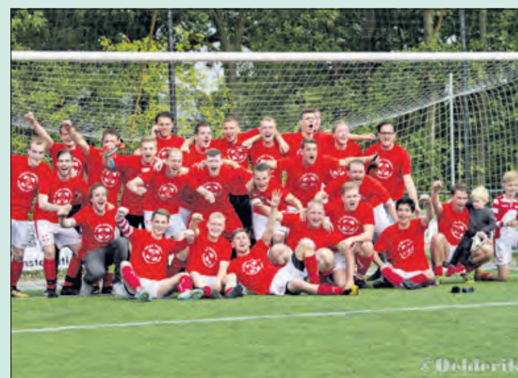
FC De Bilt 7 is blij met de titel.