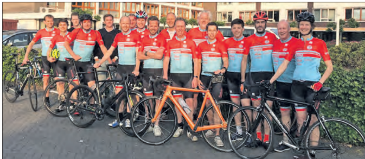
Dankzij sponsors dragen de wielrenners vanaf heden ook hun eigen wielertenue.