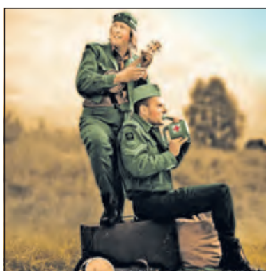
De Sunshine Soldiers verzorgen livemuziek.

Op vrijdag 21 juni is de primeur van een splinternieuw gratis Mantelzorg Festival in de gemeente De Bilt: een bijzonder en gezellig uitje voor mantelzorgers en hun partner of familie op het Berg en Boschterein, Prof. Bronkhorstlaan 10 in Bilthoven.