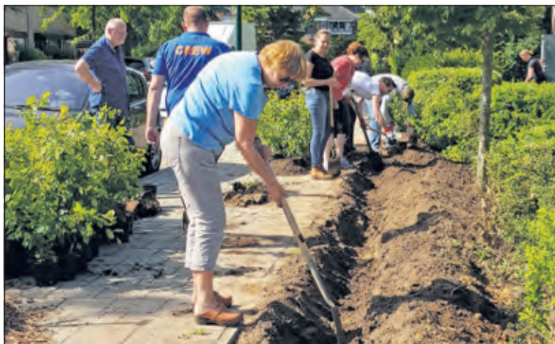
Bewoners van Weltevreden steken de handen uit de mouwen.

Om een en ander te bekostigen hebben de buurtbewoners geld gestort op een speciale groenrekening van de belangenvereniging Weltevreden. Hiervan worden o.a. de planten, bloemen en struikjes gekocht en onderhouden.