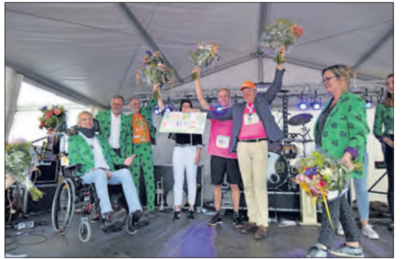
De vele deelnemers haalden uiteindelijk 210.000 euro op.