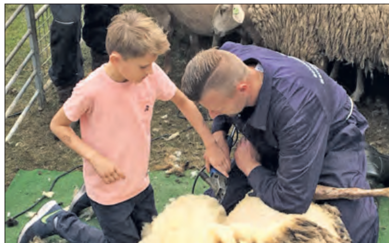
Ook in 2018 was er goede belangstelling bij het schapenscheerdersfeest.

Na een bezoek aan het Schaapscheerdersfeest kan er natuurlijk ook nog een wandeling worden gemaakt in de prachtige bossen die het dorpje omringen of kan er wat gegeten of gedronken worden in de gezellige restaurants in het dorp. Tevens bestaat er die middag de mogelijkheid om van 14.00 tot 16.00 uur een kijkje te nemen in de eeuwenoude Stulpkerk in Lage Vuursche. Gelet op het aantal te verwachten bezoekers is het advies om op de fiets naar Lage Vuursche te komen. [HvdB]