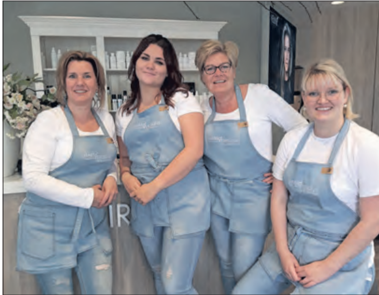
Het Hairdesqueteam verwelkomt graag nieuwe medewerkers.

Je bent gastheer/ gastvrouw van de salon. Je ontvangt klanten, gaat leren haren wassen en krullen drogen en natuurlijk houdt je de kapsalon op orde. Al snel breidt je je werkzaamheden uit met onder andere kleuren en andere leuke technieken. Om je alle vaardigheden eigen te maken, krijg je éénmaal per week een avondtraining.