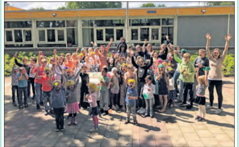
Grote blijdschap op obs Kievit na een positieve beoordeling van de inspectie.

Het team van obs Kievit in Maartensdijk heeft een jaar lang hard gewerkt in aanloop naar de inspectie op dinsdag 4 juni. Een dag later kregen ze het officiële bericht dat de school weer in het Basisarrangement opgenomen is. Dit houdt in dat op alle kernindicatoren, waar de inspectie de school op beoordeelt, voldoende is gescoord. Samen met de leerlingen en ouders werd alweer een dag later het behalen van deze mijlpaal donderdag gevierd; kinderchampagne, feesthoedjes en de grootste taart die de kinderen ooit hadden gezien.