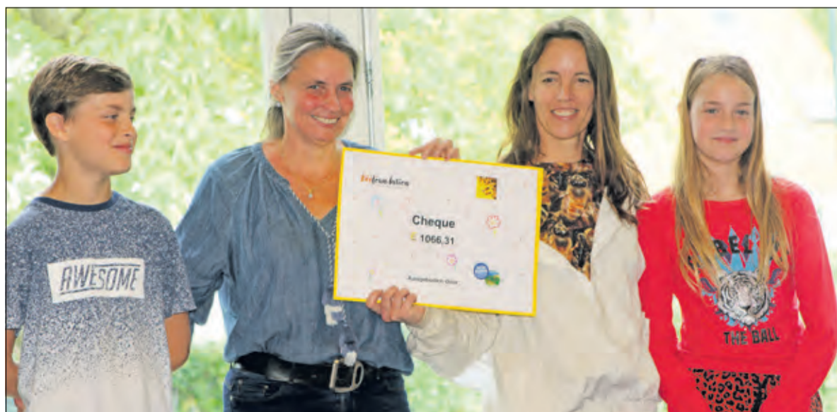
De Patioschool haalde € 1066 euro voor de bijen.

Op dinsdag 11 juni vond om 10.30 uur de uitreiking van de cheque plaats van de goede-doelen-actie van Patioschool De Kleine Prins aan Stichting Bee Foundation.