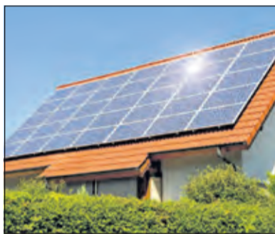
Provincie Utrecht gaat het voor iedereen makkelijker maken om te verduurzamen.

Gedeputeerde Huib van Essen, verantwoordelijk voor Energietransitie: 'We hebben een flinke ambitie als coalitie: in 2040 moet de provincie energieneutraal zijn. Dat betekent dat de vraag naar energie in de provincie dan even groot is als het aanbod aan duurzame energie'. Om dat te bereiken, zet de provincie in op enerzijds een