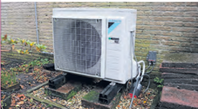
Buitenunit warmtepomp in een tuin in De Bilt.

Huiseigenaren kunnen gebruik maken van de landelijke Subsidieregeling Energiebesparing Eigen Huis (SEEH). Als je meerdere maatregelen tegelijk neemt, kan tot 20 procent subsidie mogelijk zijn. Daarnaast is een bonussubsidie beschikbaar als je het huis zeer energiezuinig of energieneutraal maakt. Dat laatste scenario, een slecht geïsoleerde woning in één keer goed aanpakken, kan aantrekkelijker zijn dan in stapjes verduurzamen. De beide Energieambassadeurs leggen het graag uit. Verder is er op 15 januari alle ruimte om eigen vragen in te brengen.