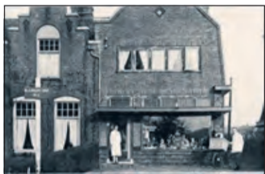
1e generatie Ploeger voor de winkel aan de Blauwkapelseweg.

Op 10 januari 1930 opende de familie Ploeger de deuren van hun levensmiddelenzaak aan de Blauwkapelseweg. Aanstaande vrijdag 10 januari viert de 3e generatie het 90-jarig bestaan van de zaak aan de Hessenweg 182 in De Bilt.