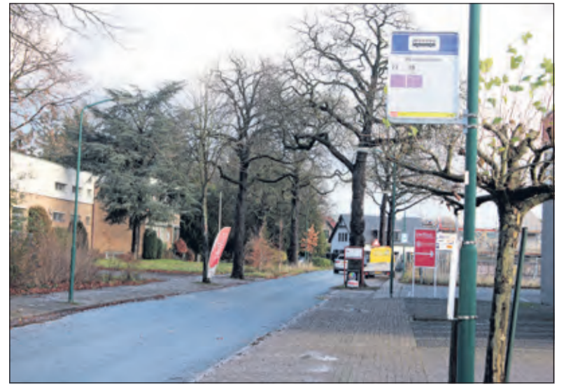
Bushalte Rembrandtlaan (foto december 2018) was toen niet rolstoelvriendelijk.

Daarnaast kijkt de busvervoerder op korte termijn naar aanpassingen in de dienstregeling zodat er minder lang en vaak veel bussen