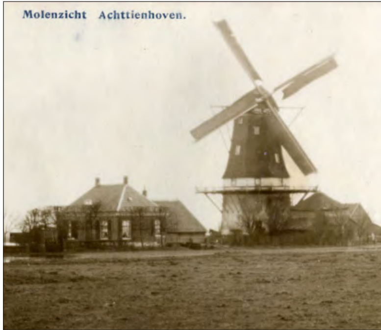
Molen de Kraai anno 1910.

In 1973 bleek de molen niet meer rendabel en werd hij stilgelegd. Tussen 1977 en 1979 werd de molen weer gerestaureerd, en opnieuw in 1996. De omloop werd volledig hersteld, het riet op de kap werd vervangen en het oorspronkelijke Oudhollandse wiekenkruis werd weer aangebracht. In 2011-2012 werd de molen opnieuw gerestau-