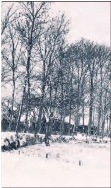
Een sneeuwlandschap in Groenekan.

De viering van het Kerstfeest, zoals wij het kennen, is nog niet zo oud. In de voorchristelijke tijd vierden de Germanen in onze streken het zgn. Joelfeest, het feest der 12 nachten. Het was een midwinterzonnenuwdefeest. De Germanen vierden de