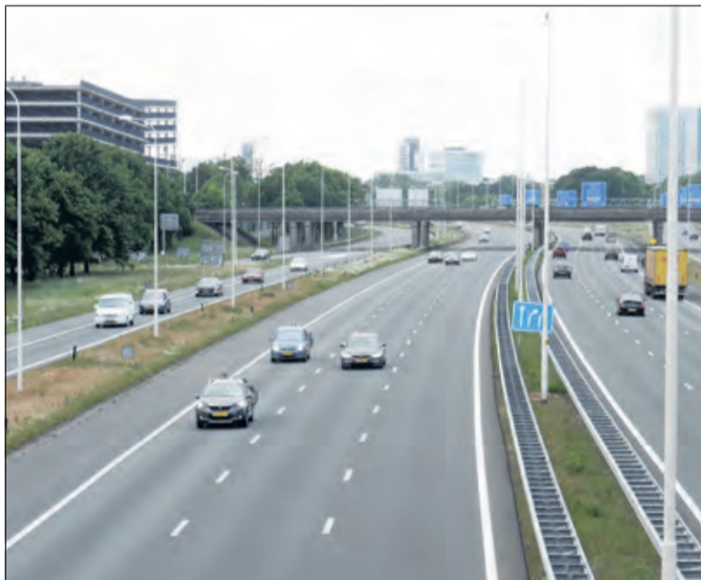
Deze foto toont het beeld richting Rijsweerd.