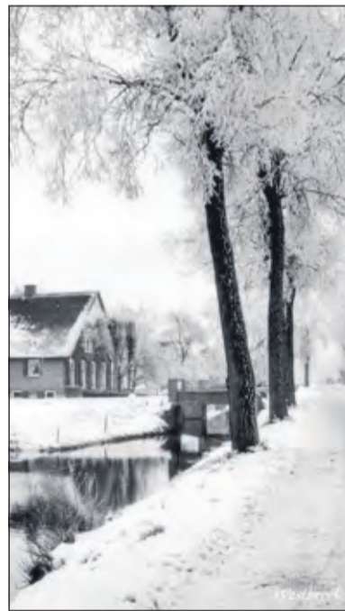
Wellicht doet deze foto recht aan het contrast tussen toen en nu; kerstboom en lichtjes in de tuin...