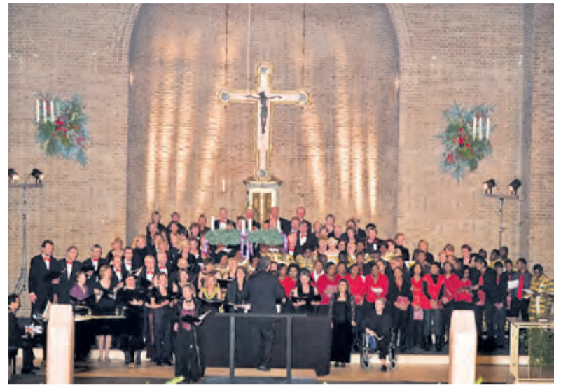
In december 2007 stond voor de 80 vrouwen en 40 mannen van het Algemeen Zangkoor Maartensdijk alles in het teken van hun multicultureel Kerstconcert in de Michaelskerk in De Bilt...

Begin jaren zeventig werd de eerste kerstboom buiten voor het gemeentehuis gezet. Tot drie jaar geleden stond er ook jaarlijks een kerstboom bij De Vierstee. Helaas werd deze boom geleidelijk een doelwit van baldadigheid van de wat gro-