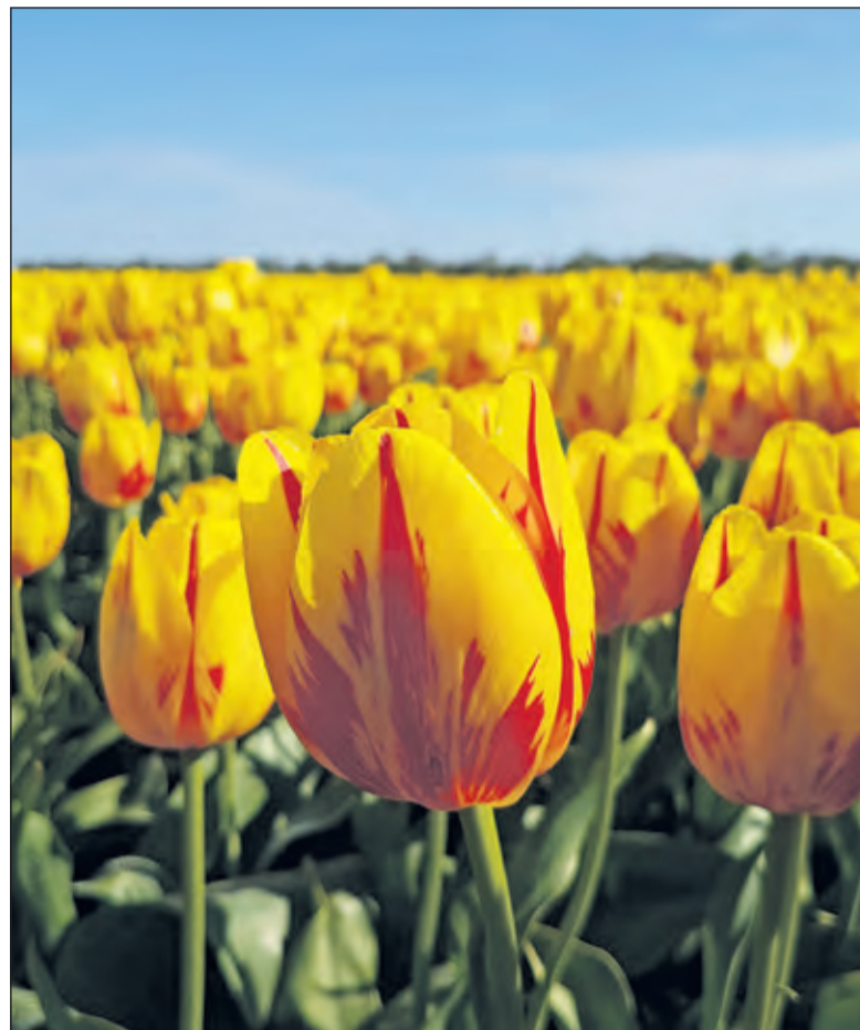
In mei zullen in het hele land deze speciale vrijheidstulpen 'Freedom Flame' bloeien.

Bij de gedenking van de slachtoffers van de Holocaust met een tijdelijk monument zijn kinderen en vertegenwoordigers uit de ge-