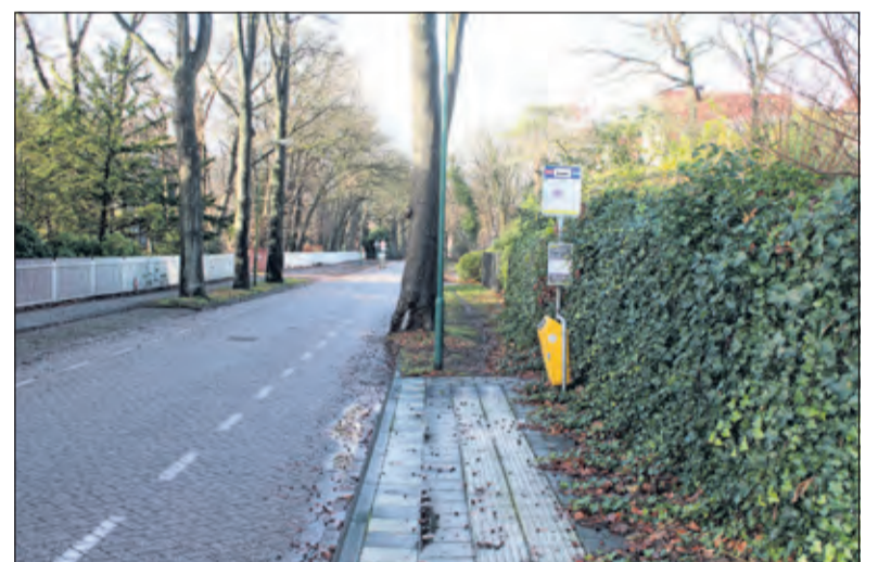
Lijn 78 vervolgt zijn weg vanaf Station Bilthoven, langs halte Rubenslaan Bilthoven en verder langs Jan Provostlaan Bilthoven. [foto december 2018]