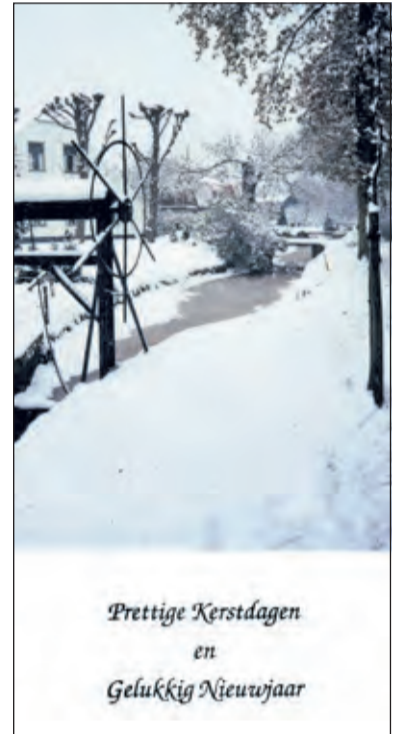
Prettige Kerstdagen en Gelukkig Nieuwjaar Het sluisje in de sneeuw voor boerderij Groeneveld aan de Dorpsweg in Maartensdijk, voorkomend op een Kerst- en Nieuwjaarswens van voor 1995.