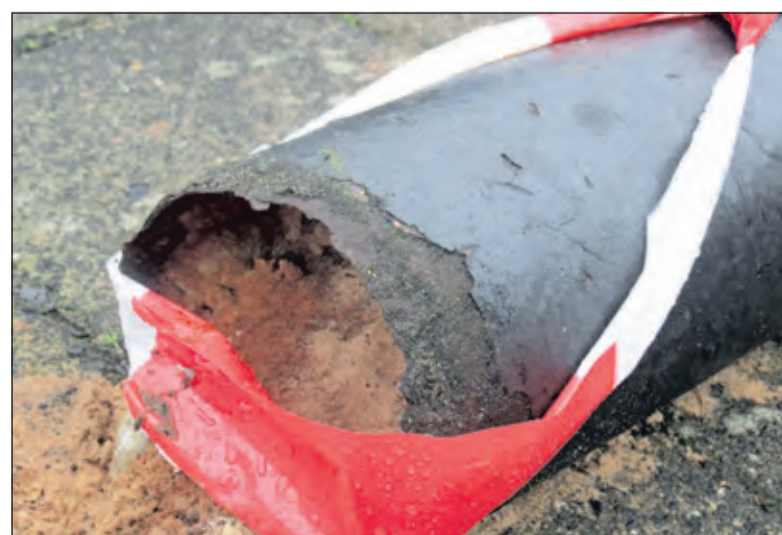
Tot en met 31 december (dinsdag) was de lantaarnpaal op het trottoir gedrapeerd. Op deze foto is de breukrand goede te zien.