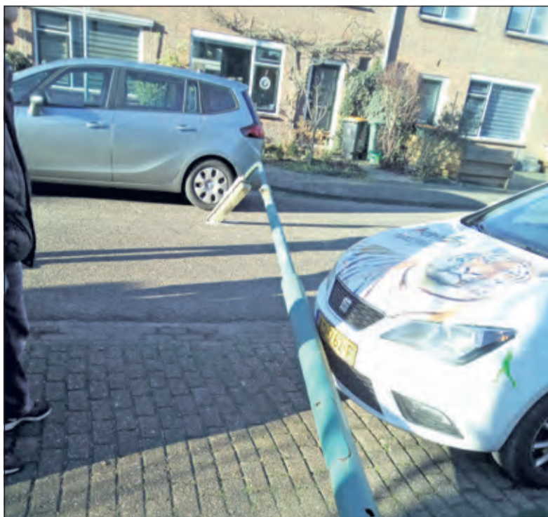
Zijn er meer palen in Maartensdijk, die op 'scherp staan'?