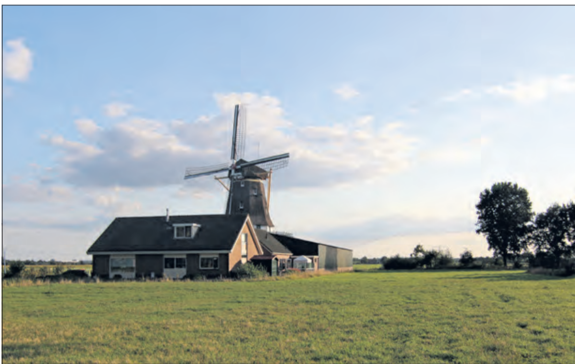
Molen de Kraai anno 2018.

reis door de geschiedenis van de molen heeft gemaakt. 'Ik heb door het stof van een lange periode heen gekeken', vertelde ze. Zij heeft veel foto's bijeengebracht maar ook veel verhalen verzameld die door Westbroekenaren aan haar zijn verteld. De veranderende tijdgeest vind je terug in de geschiedenis van de molen. 'De Kraai' heeft in haar bestaan goede en slechte tijden gekend. Periodes van bloei en verval. Het hele dorp heeft zich altijd betrokken gevoeld bij het wel en wee van 'De Kraai'. [HvdB]