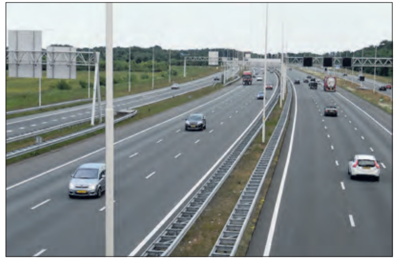
Deze foto laat het beeld richting Zeist zien.

Nu gaat het pal westwaarts langs de noordkant van de A28 tot verkeersknooppunt Rijsweerd. Het zuidelijk deel van de grens vormt een soort zak in het grensverloop waardoor het gebied van het voormalige klooster Oostbroek op Bilts grondgebied ligt.