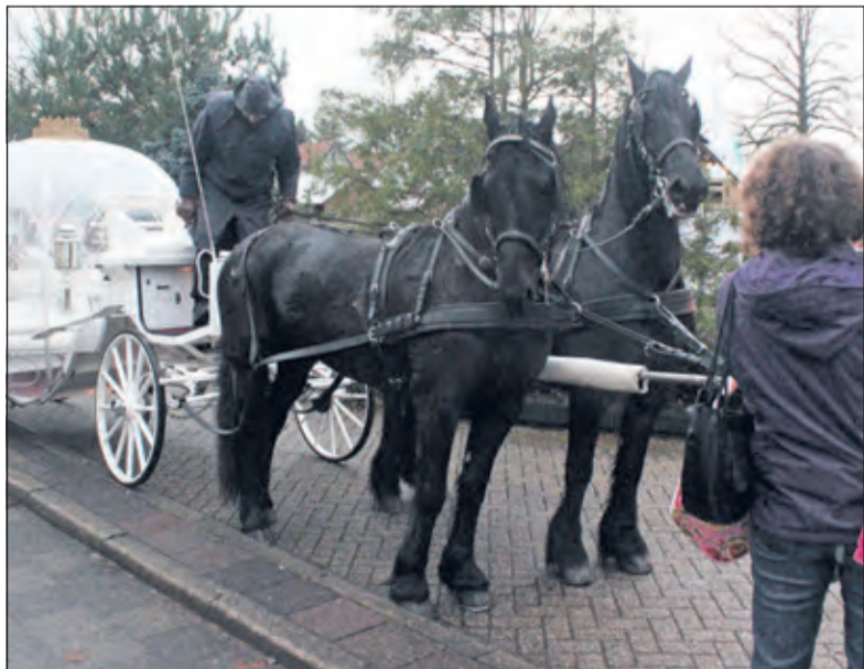
In december 2012 kon men tijdens een Kerstmarkt met de Kerstman in de sprookjesachtige koets een paardenritje maken.

Door de eerste Christenen werd 6 januari als de geboortedag van Je-