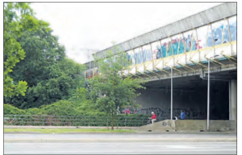
Vanaf het knooppunt Rijsweerd volgt de grens circa een kilometer de A27 tot het viaduct met de Utrechtseweg (N237) Op deze foto kijken we langs het viaduct richting Rijsweerd.

Nu gaat het pal westwaarts langs de noordkant van de A28 tot verkeersknooppunt Rijsweerd. Het zuidelijk deel van de grens vormt een soort zak in het grensverloop waardoor het gebied van het voormalige klooster Oostbroek op Bilts grondgebied ligt.