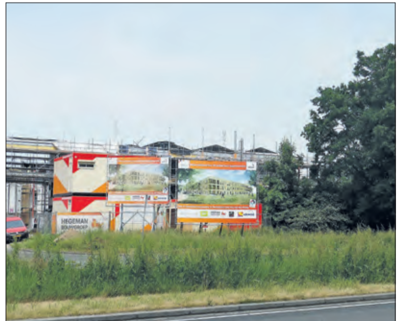
Van dit punt buigt de grens tenslotte noordwaarts af langs de Utrechtse wijk Voordorp, het voormalige Veemarkterrein (deze foto mei 2018), tot de Biltse Rading. Wanneer deze wordt gekruist, volgt nog één keer een haakse bocht naar links en wordt het beginpunt aan de zuidzijde van fort Voordorp weer bereikt.