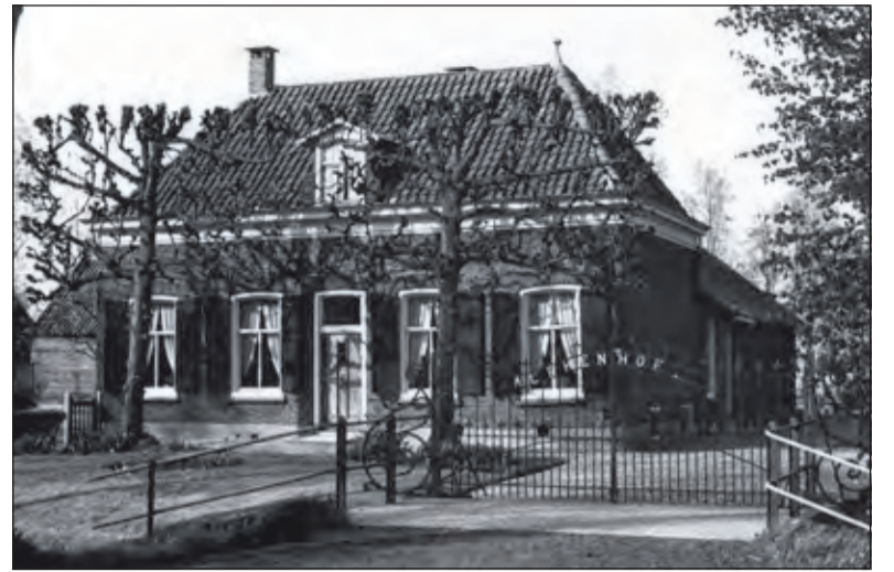
Een foto van de Alphenhof in 1965.

'Zijn genie moet daar niet in berusten: hij houdt een koe voor zijn huishouden, die hem melk en boter geeft, zijne dochters beurtlings staan aan den karmolen, een paard er voor te houden is hem te kostbaar, maar het loopend spit - de wieg - zijn zijne wegwijzers; in zijn