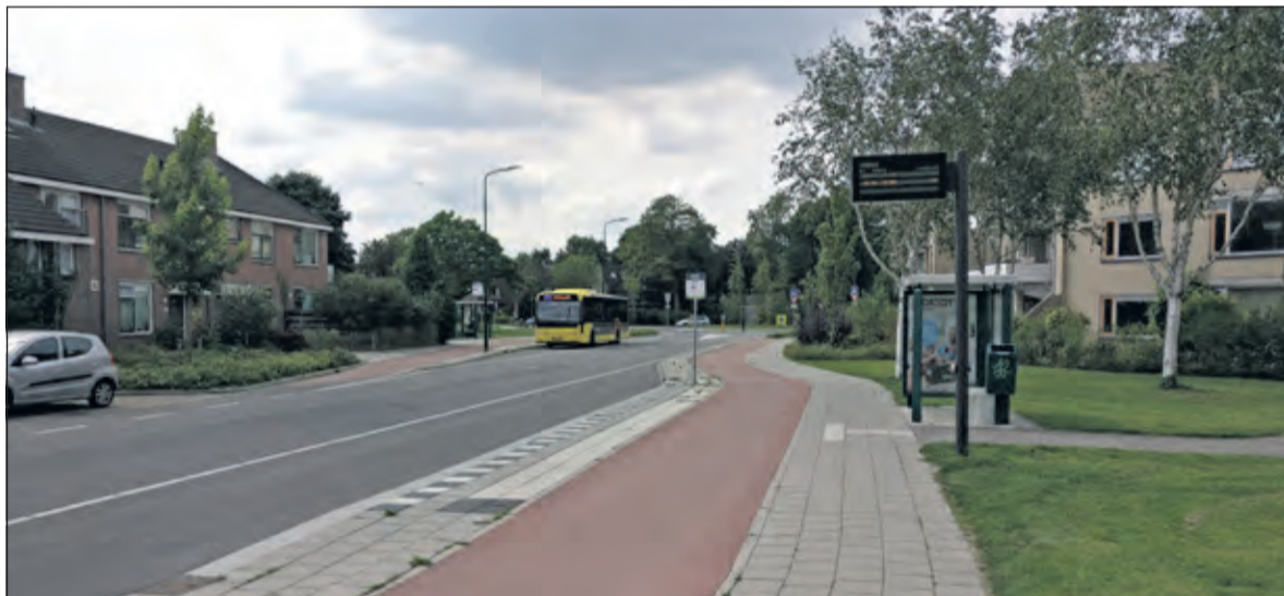
Lijn 77 komt via Zonneplein, Duivenlaan, door de tunnel in de Leijenseweg (rechtsaf) de Massijslaan opgereden, om daar te stoppen bij de halte Walnootlaan. [foto augustus 2017]

Kijk voor actuele reisinformatie op www.u-ov.info of bel de klantenservice 0900 5252241 van maandag t/m vrijdag 8.00 uur tot 20.00 uur.