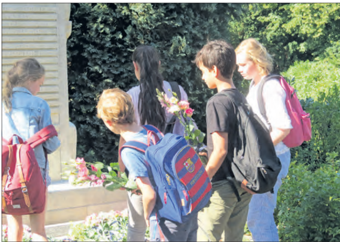
Jaarlijks wordt de zorg voor het herdenkingsmonument overgedragen door de kinderen van de Groen van Prinstererschool.

De gemeente De Bilt geeft aan deze bijzondere lustrumviering lokaal vorm door met enkele bijzondere evenementen en vieringen aan te sluiten op het nationale programma; op een manier die nieuwe tradities stimuleert, passend bij de tijd en de nieuwe generatie. Dat