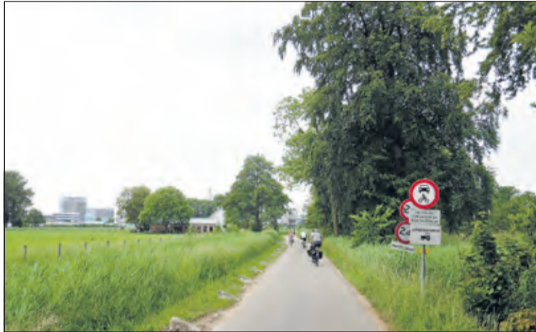
Vlak voor de Uithof bereikt wordt, buigt de grens via de Bunnikseweg (deze foto) naar het noordwesten tot opnieuw de A28 wordt bereikt.

Op dit stukje grens waar de Bisschopweg op uitkomt, passeren we de Tolakkerlaan.