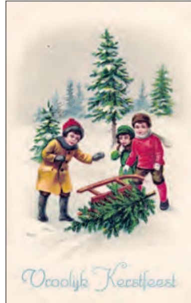
Een kerstkaart uit het Westbroek van 1935/ dertiger jaren. De kerstboom was er wel, maar niet overal even zichtbaar. ...

tere kinderen en werd besloten daar geen boom meer te plaatsen.