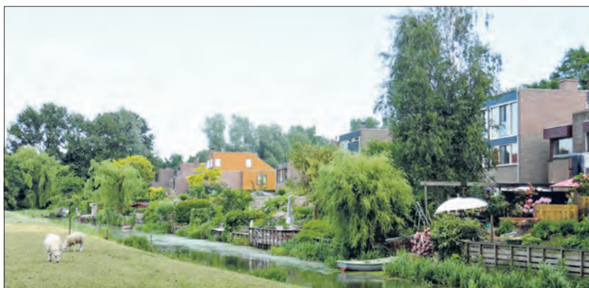
We eindigden (in week 44) bij het westelijk puntje van de wijk Brugakker in Zeist. Vervolgens loopt de grens ongeveer een kilometer westwaarts richting Uithof.