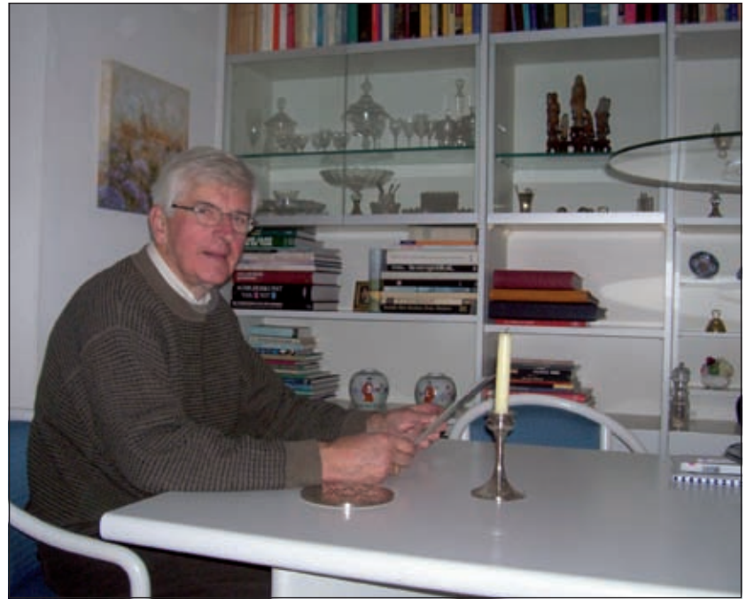
Oud burgemeester Panis: 'De manier waarop De Vierstee tot stand kwam is daarna nooit meer zo gebeurd. Het was immers geen project van de gemeente maar van de bewoners zelf'.

was goed. Maar vooral het werken met de vele actiegroepen van de dorpen vond ik bijzonder. De manier waarop De Vierstee tot stand kwam is daarna nooit meer zo gebeurd. Voor die tijd trouwens ook niet. Het was immers geen project van de gemeente maar van de bewoners zelf. Zo snel als dat ging. Dat was heel apart. Ik zag hoeveel mensen er actief bij betrokken waren. Ik vond dat geweldig. Zelf had ik ook nog de ervaring dat het contact met de provincie en andere instellingen ook heel soepel en snel ging. Het liep als een trein. En wat een prachtige opening van De Vierstee. Ja, dat is allemaal alweer dertig jaar geleden. Ik heb daar hele goede herinneringen aan en hoop dat het allen goed zal gaan.'