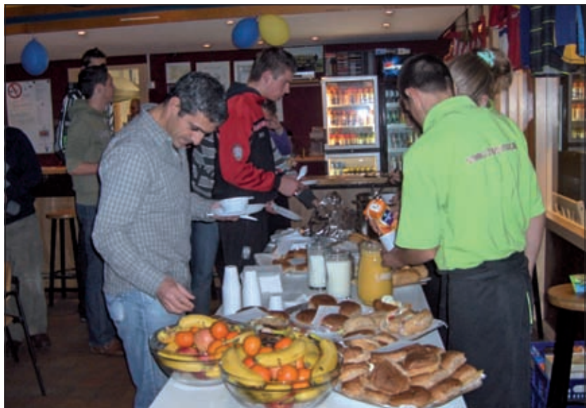
Vanaf vijf uur werd er in de kantine door allen genoeglijk een lichte maaltijd genuttigd.

De wedstrijd begon om 19.00 uur op het grasveld voor de kantine. Het werd een leuke pot tot plezier van een flink aantal toeschouwers langs