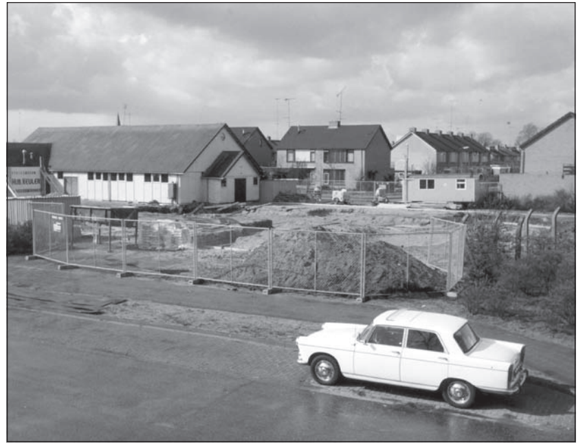
'Die bijeenkomst was nog in het oude, kleine houten kerkje, op de plaats waar later Dijkstate is gebouwd. Daar werd vergaderd, gefeest, gesport en de bibliotheek verzorgde er de uitleen. Dat was toen ons dorps huis.