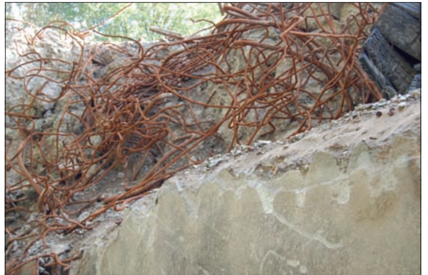
Herstellen, slopen of zand erover, alle opties staan open.

'Bij het college bestaat het volste begrip voor de angst, zorg en boosheid die de avond van de zevende