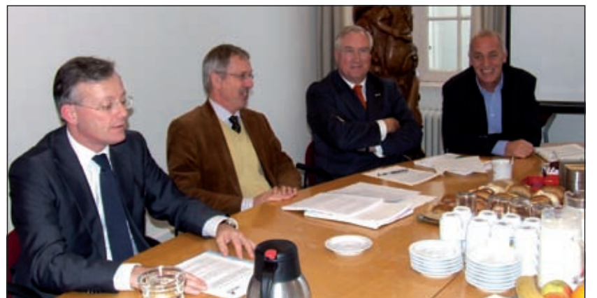
Het college van Burgemeester en Wethouders bij de presentatie van de begroting

bedoeling is dat we onderzoek gaan doen naar een draagvlak voor de golfbaan en de bevindingen daarvan begin volgend jaar voorleggen aan de raad. Tegelijkertijd worden dan ook de resultaten van een onderzoek naar ecologische aspecten, planologische visie en economische elementen voorgelegd. Alles wat nodig is om een goede beslissing te nemen ligt in februari 2009 op tafel. De financiële aspecten van een golfbaan zijn voor de gemeente te verwaarlozen. De vereniging heeft het initiatief genomen en zal zelf eventueel de gronden verwerven. Ook gaan ze een eventuele golfbaan zelf aanleggen en exploiteren.' De gemeente betaalt de ongeveer 30.000 euro van het onderzoek.