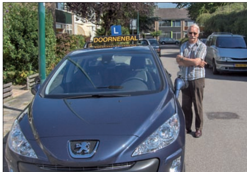
Autorijschool Doornenbal te Maartensdijk is medeorganisator van en betrokken bij de trainingsochtend voor automobilisten van 6 jaar of ouder.

GR Maartensdijk, tel: 0346 214161, e-mail info-m@swodebilt.nl of bij het secretariaat van de Biltse vestiging van SWO De Zes Kernen De Bilt, Jasmijnstraat 6, 3732 EC De Bilt; tel. 030 2203490; e-mail info@swodebilt.nl . De aanmelding sluit zodra het maximum aantal deelnemers is bereikt, doch uiterlijk op 14 november 2008 [HvdB].