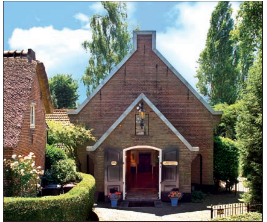
Dick van Vlaardingen: 'Dat was de mooiste plek, die ik mij maar wensen kon om een atelier in te richten'.

In het boek is eveneens aandacht besteed aan streek- en tijdgenoten,