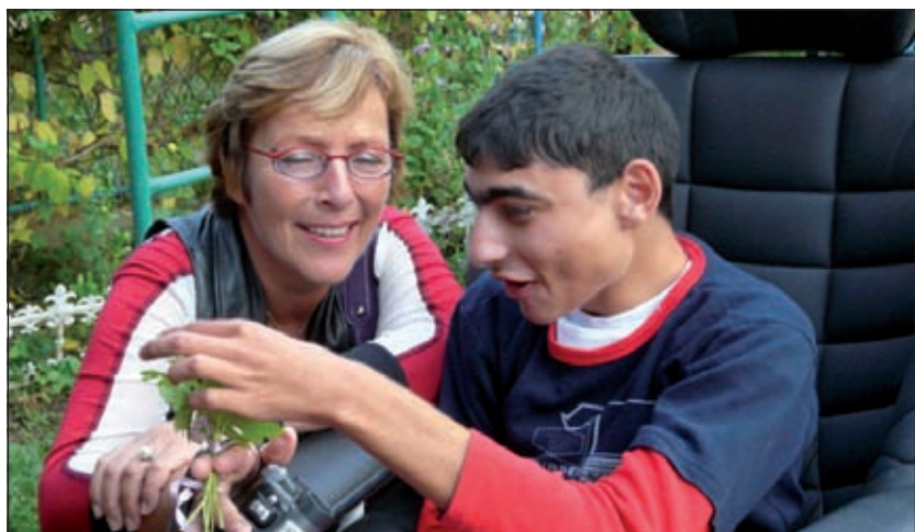
'Dat was het moment, dat we bij het kindertehuis aankwamen en de kinderen ons buiten in het zonnetje zittend in deze rolstoelen zaten op te wachten'.

Voor verdere informatie zie website www.stichtingkiro.nl .