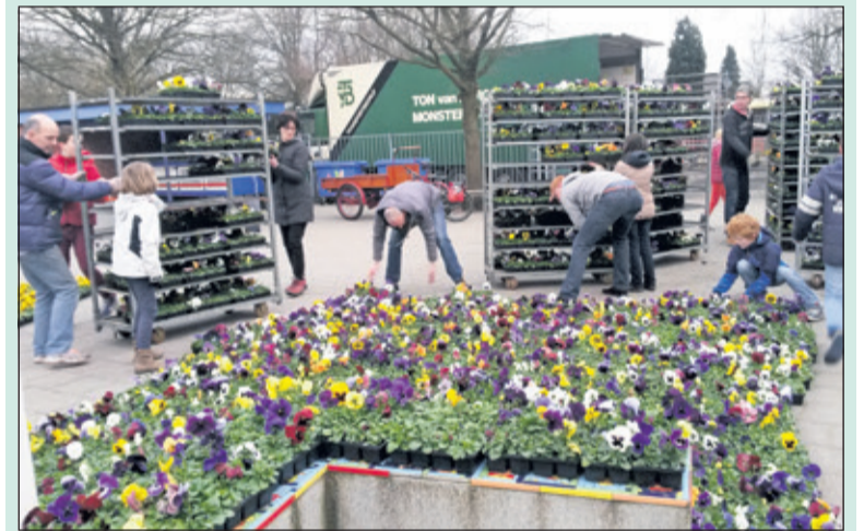
Binnenkort staat het schoolplein weer vol met viooltjes om te bezorgen.