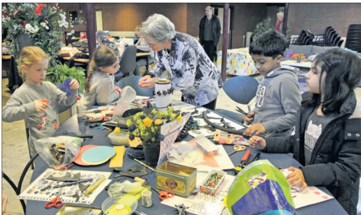
Kinderen vermaken zich uitstekend in het Repair Café en aan de knutseltafel van Truus.