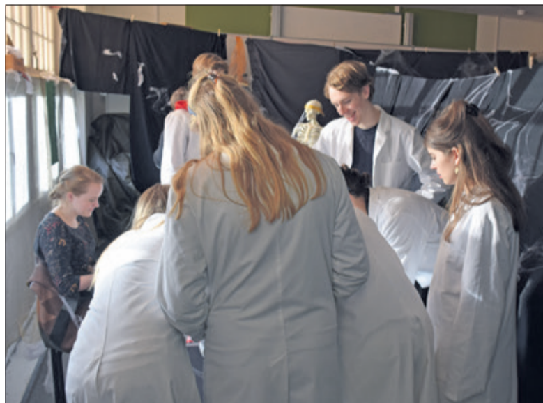
Het oplossen van de codes viel nog niet mee.

Ieder jaar wordt een Science Fair georganiseerd op scholen voor Havo en VWO om interesse te kweken voor Bètavakken in het onderwijs. U-talent draagt bij aan de kwaliteitsverhoging van het bèta- en techniekonderwijs in Havo en VWO en probeert een goede aansluiting te realiseren met het hoger onderwijs (HBO en Universiteit). Leerlingen in de bovenbouw van Havo en VWO kunnen masterclasses volgen aan de Hogeschool Utrecht en bij de Universiteit