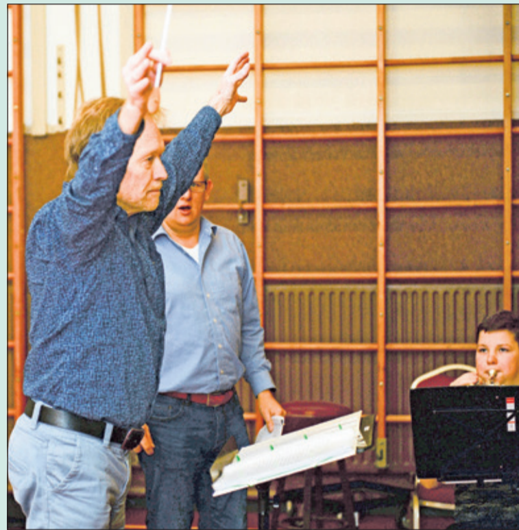
Er wordt al veel geoefend in Westbroek.

Ze hebben mooie, maar ook lastige, muziekstukken voor hun kiezen gekregen. Gaat hen het lukken de orkestleden goed aan te sturen en onder de duim te houden? Wordt het chaos of klasse? Ze worden beoordeeld door een vakjury en door het publiek. Ga genieten van een mooie en gezellige muzikale avond en stem mee op uw favoriete kandidaat. De toegang is gratis, in de pauze worden er stroopwafels verkocht. (Arie de Bree)