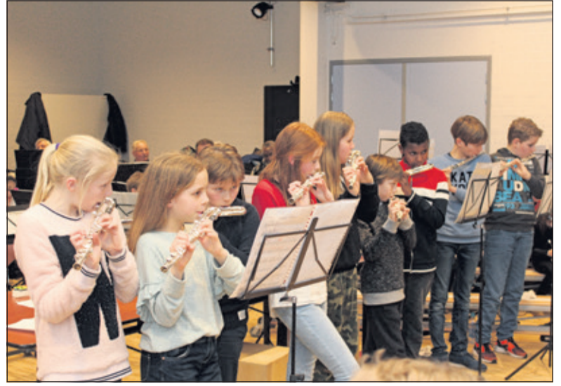
De dwarsfluitgroep maakte het helemaal waar.