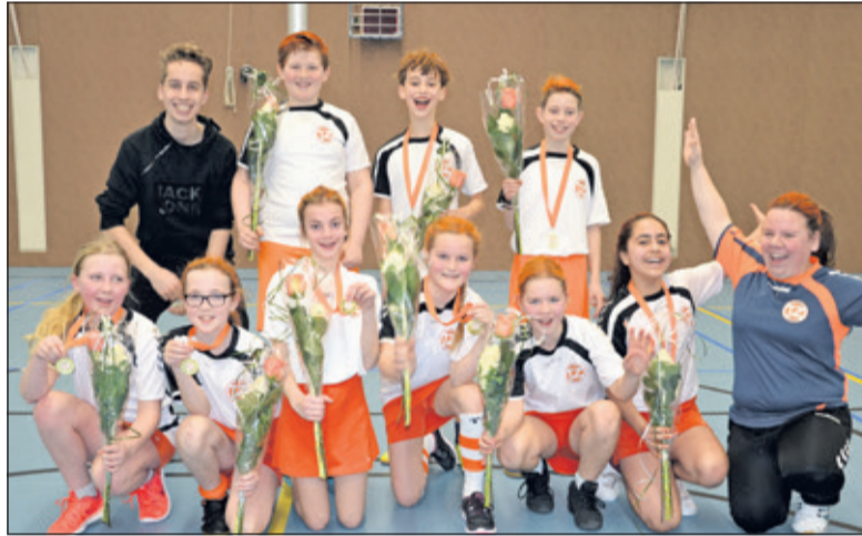
TZ3 is een terechte kampioen met maar 1 verlies partij.