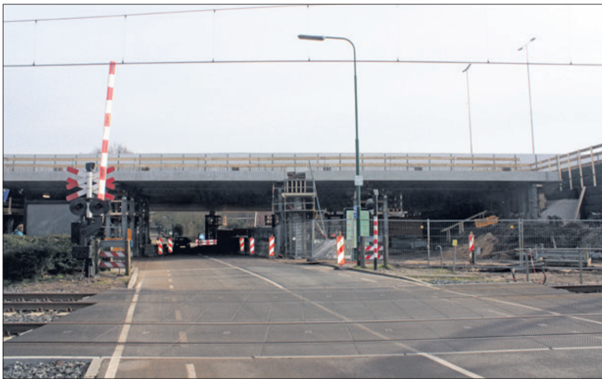
De klus (aan de westzijde van het viaduct) is geklaard.

Van 14 op 15 februari en van 15 op 16 februari werden de laatste prefab betonnen liggers van het project aan de westzijde van het viaduct Egelshoek in Hollandsche Rading geplaatst. Deze prefab liggers werden vanaf de A27 geplaatst met 2 grote kranen die om 19.00 uur werden opgebouwd. Vanaf middernacht werden de liggers op hun plek gehesen. Tijdens het hijsen werden er enkele verkeersstops op de Vuurse Dreef ingesteld met een duur van maximaal 20 minuten.