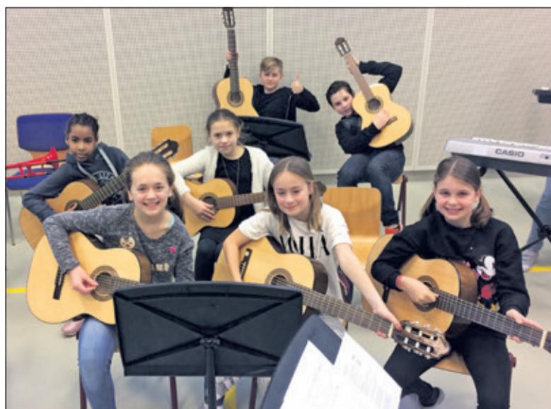
De leerlingen wachten ontspannen af wanneer zij mogen optreden.

Hoofddoel is om het muziekonderwijs op De Regenboog te verbeteren en naar een hoger plan te trekken. De komende jaren zullen er nog veel muzikale activiteiten volgen.