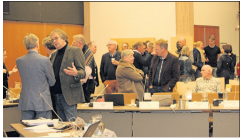
Tijdens de schorsing wordt druk overleg gevoerd.

De omwonenden toonden dinsdagavond niet alleen emoties, ze waren ook deskundig. Het plan zoals het nu ligt, voldoet volgens de omwonenden niet aan de eisen die voor de realisatie van nieuwe landgoederen geldt en er worden bovendien verouderde en onvolledige rapporten op het gebied van flora en fauna gebruikt. Alle omwonenden stellen dat de gemeente de verkeerde weg bewandelt door Beyleveldt een verklaring van geen bedenkingen te geven. Daarmee worden er te weinig ga-