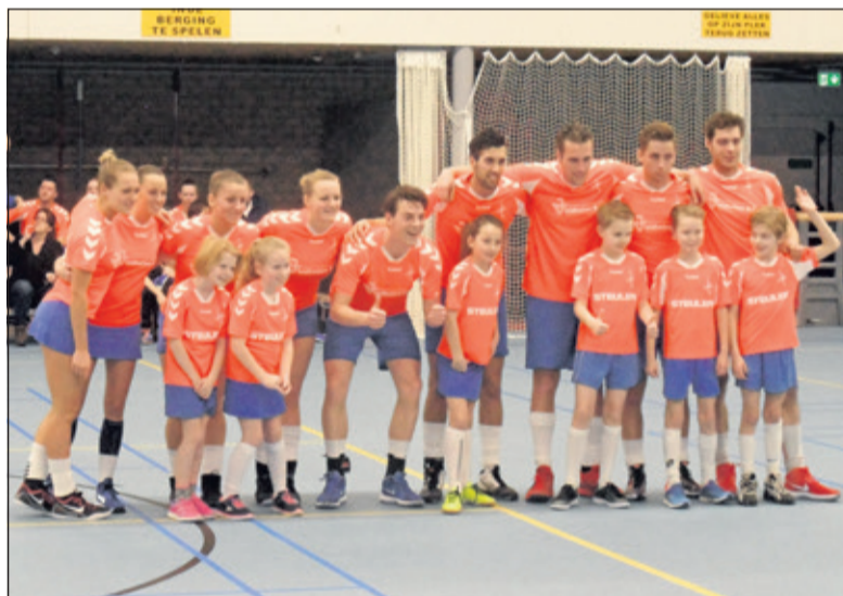
De E1 na het oplopen met de spelers.