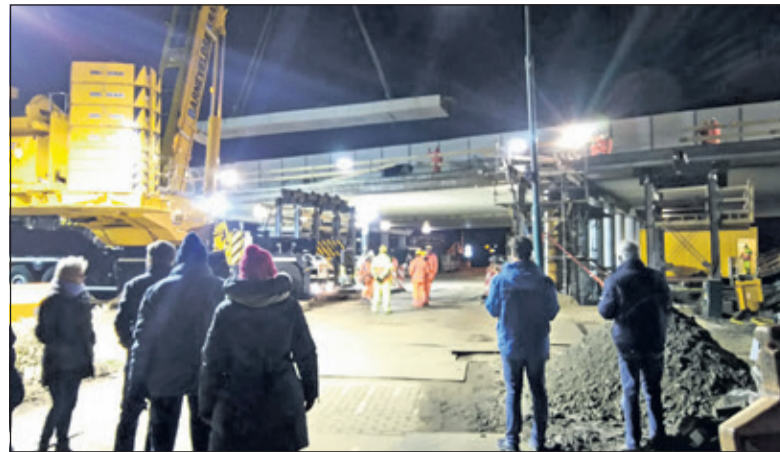
De burens in Hollandsche Rading kijken geïnteresseerd toe.

wapening, al het beton, etc.). Ook moet de aannemer dan een grote ondersteuning bouwen. Dit zou voor veel meer transport en hinder zorgen. De prefab liggers worden in een gecontroleerde omgeving gebouwd. Dit zorgt voor een hoge kwaliteit, omdat de bouw niet wordt beïnvloed door bijvoorbeeld weersomstandigheden en de prefab liggers hijst men 's nachts op hun plek. Er is dan minder verkeer en daarom minder hinderlijk voor de weggebruiker. Werken met prefab liggers zorgt voor een veiligere bouwomgeving. Er wordt minder