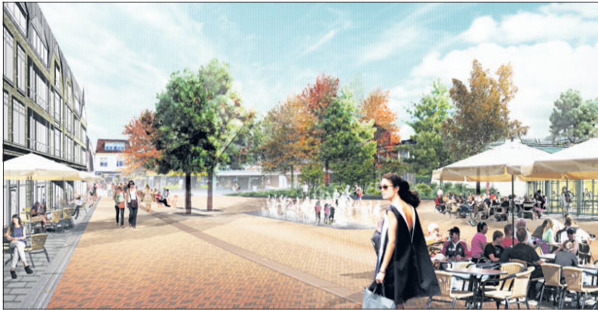
Impressie van een vernieuwd Vinkenplein.