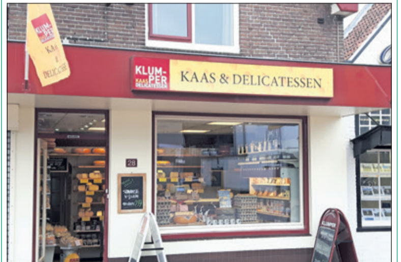
Bij Klumper Kaas ligt er een ruim assortiment op de plank.

Op www.klumperkaas.nl kunt u alvast een kijkje nemen in het ruime assortiment, maar voor de beleving moet u echt in de winkel zijn. En neem dan de kortingsbon mee om te profiteren van de aanbieding. Heeft u het kortingsbonnenboekje gemist? U kunt alsnog een exemplaar halen op o.a. het kantoor van De Vierklank. Kijk voor een volledig overzicht van de afhaaladressen op www.vierklank.nl