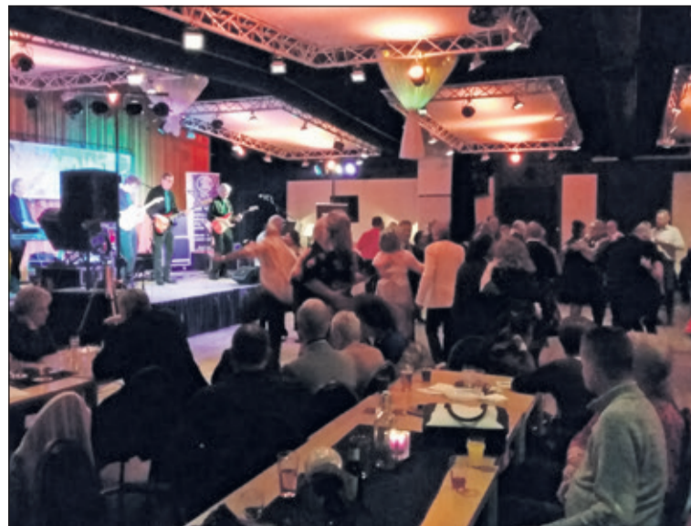
Voetjes van de vloer in het HF Witte Centrum in De Bilt.

Van de grote meester waren natuurlijk ook zijn 'Blue Suede Shoes' te horen en de van heinde en verre gekomen dansparen zwierven en zwaaiden, dat het een aard had, alles op de klanken van een zes koppige rock and roll-band, toepasselijk The Explosion Rockets geheten. Een gastoptreden van (blues-)harmonica-speler Ruud Wegman uit Maarssen completeerde deze gezellige dansavond. Om nooit te vergeten. (Peter Schlamilch)