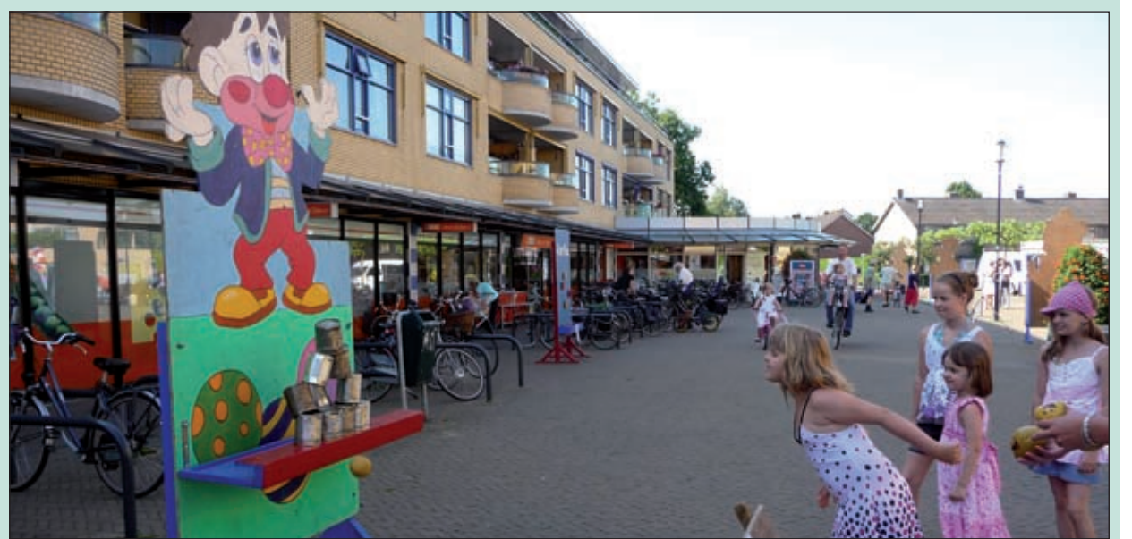
De activiteitencommissie van de winkeliersvereniging wenste voor afgelopen zaterdag vooral gezelligheid op het Maartensplein met de vele oud Hollandse spelletjes. Een grote toeloop van jongeren en ouderen ervoor was er niet, maar de gezelligheid wel. Aankomende zaterdag 11 juli is er een, niet door de activiteitencommissie georganiseerde, grote Funmarkt [MD].

kan aanvullen. In relatie tot de weersomstandigheden waren de meningen over de belangstelling divers: 'Misschien dat er nogal wat naar strand, bos of hei zijn gegaan; anderzijds was het natuurlijk een prachtdag om eens even goed te kunnen rondneuzen', aldus van den Berg, die gelijktijdig aankondigde op basis van de getoonde belangstelling aan het einde van de vakantieperiode zo ergens eind augustus zo'n verkoopdag te willen gaan herhalen.