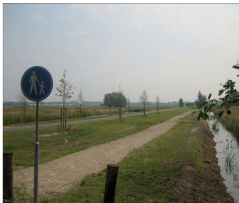
Er zijn verharde wandelpaden gemaakt.