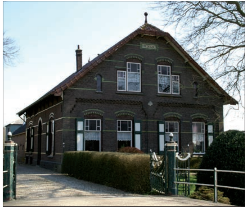
Boerderij Vredegoed aan de Heuvellaan is een prachtige locatie.