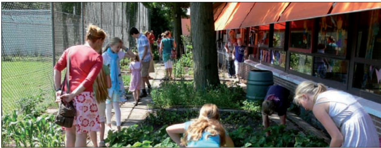
Leerlingen van de Bosbergschool kunnen tijdens het natuurproject gaan werken in de moestuin.

schelpen, een deel van een kaakje met tanden van een ree, slakken, allemaal soorten vogelnestjes (winterkoninkje, kwikstaartjes, meesjes) al dan niet gevuld met eitjes en een dood klein vogeltje (mereltje) in een glazen kistje. Alle kinderen en ouders brachten dan ook veel tijd door bij de tentoonstelling met het bewonderen van de natuurwonderen van andere kinderen. De producten uit de moestuin werden goed verkocht. Er werd brandnetelsoep gemaakt, popcorn verkocht en ook de beschuiten met verse aardbeien vonden gretig aftrek. Er waren mensen die gereedschap voor de school hadden meegenomen, dat niet meer door henzelf gebruikt werd. Ook is er geld bijeengebracht, waar weer nieuwe zaden en spullen (zoals o.a. tuinslangen, gereedschap) voor de moestuin mee kunnen worden aangeschaft. Het initiatief vraagt gezien het succes om herhaling! Er zijn alweer veel nieuwe ideeën voor volgend schooljaar. Aan het enthousiasme van iedereen zal het niet lig-