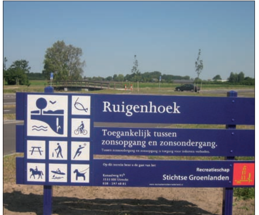
Aan de Kon. Wilhelminaweg in Groenekan, ongeveer tegenover zwembad Blaukapel staat aan het begin van de grote parkeerplaats een informatiebord.

legd voor het geteisem uit Overvecht dat hier in de buurt inbraken pleegt. We zien ze op hun brommers elke avond loerend rijden op zoek naar buit. Er is wel beloofd dat brommers op het terrein zullen worden geweerd en dat daar streng toezicht op zal worden gehouden. Maar hoe willen ze dat in het donker doen? Daar moet je een heel stel Boa's voor aannemen. Dat zou dan betaald moeten worden uit de opbrengst van de golfbaan en die is er voorlopig niet.'