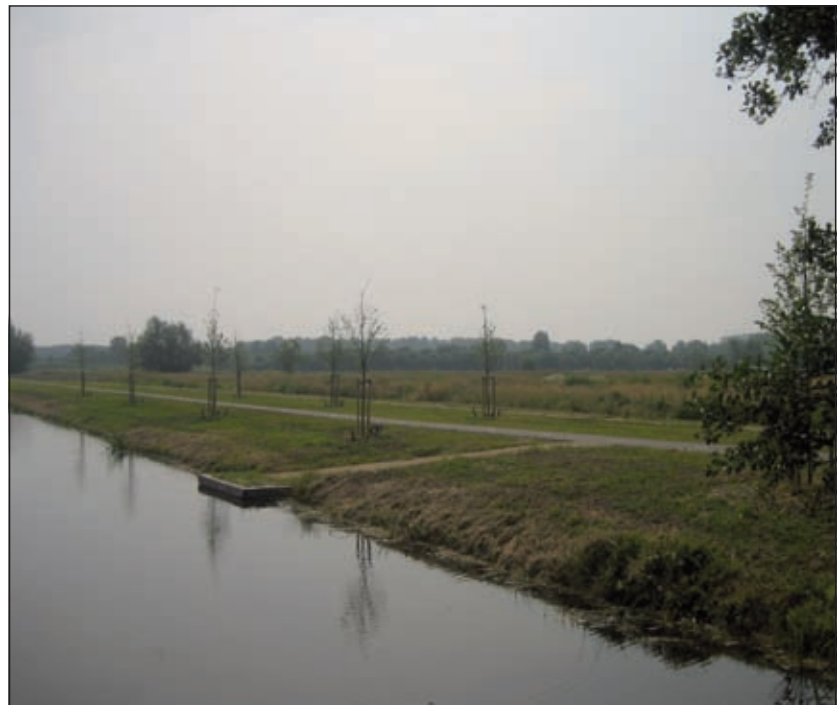
Er ligt een wijs gebied in totale stilte met waterpartijen en bruggetjes.

De bewonerscommissie is al heel lang fel tegen vooral de golfbaan die door een particuliere ondernemer zou worden geëxploiteerd. Maar de eerste geïnteresseerde heeft al afgezegd. Bewoners zijn ook tegen die mooie geasfalteerde wegen en vertellen: 'Ze hebben prachtige vluchtwegen aange-