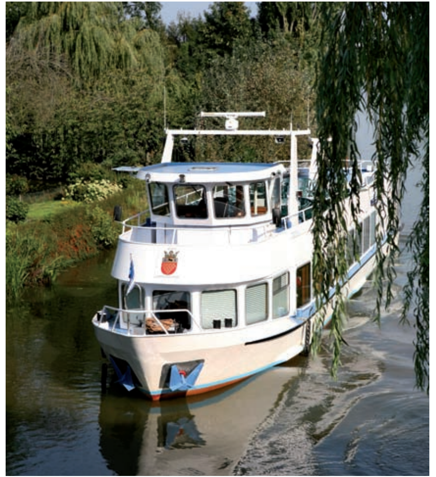
Oudere U-pashouders in de gemeente De Bilt konden op 16 juni deelnemen aan een fantastische boottocht over de rivier De Linge in de Betuwe.

Wilt u informatie over De Bilthuysen UITbureau voor Ouderen, neem dan contact op met: 090- 001020 (€ 0,10 per minuut) of heeft u vragen over de U-pas, belt u dan met 030-2865050.