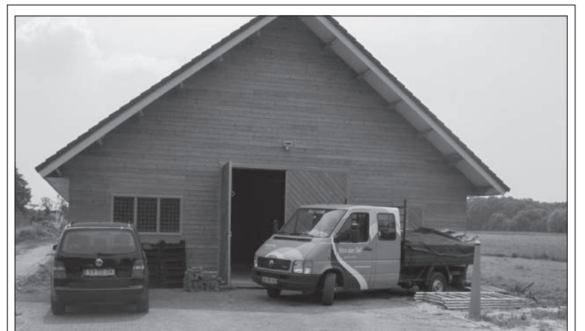
Hoveniersbedrijf Van der Tol opende maandag 29 juni een nieuwe bedrijfslocatie aan de Tolakkerweg 118 in Hollandsche Rading. De nieuwe vestigingslocatie zal de vestiging in Nieuwegein vervangen. De werkzaamheden worden thans uitgevoerd vanuit drie regio's; Noord-Holland (vestiging Amsterdam), Zuid-Holland (vestiging Benthuizen) en Midden Nederland (vestiging Hollandsche Rading) [HvdB].