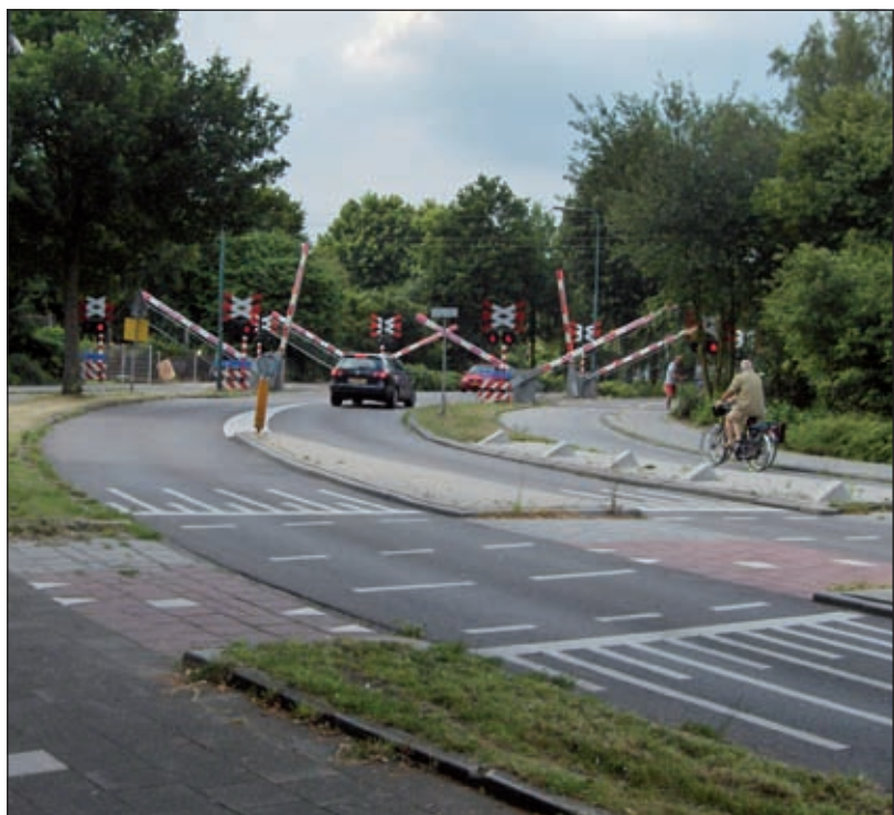
En weer gingen de spoorbomen bij de spoorwegovergang in de Leijenseweg te Bilthoven neer.

De opdracht is in afwijking van het gemeentelijk inkoop - en aanbestedingsbeleid, vanwege de voorkeur van het college voor Movares. Het bureau is bekend met de specifieke problematiek rondom de beide spoorwegovergangen in Bilthoven en was ook nauw betrokken bij het plan voor de spoortunnels in de Soestdijkseweg. Het college verwacht de raad in het vierde kwartaal van 2009 nader te informeren over de uitkomsten van het onderzoek en over de subsidieaanvraag [HvdB].