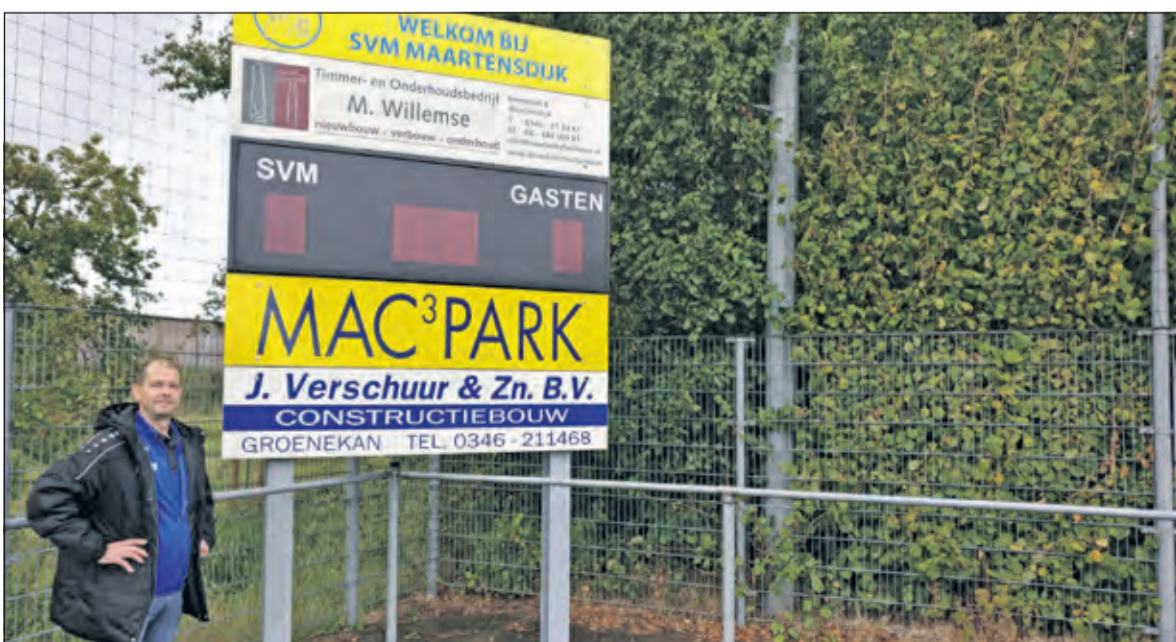
Timmer- en onderhoudsbedrijf M(arco) Willemse tekende onlangs een nieuw driejarig contract als subsponsor van de SVM selectie.