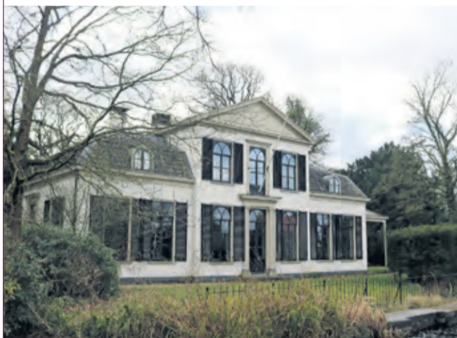
Landhuis Sluishoef in De Bilt.