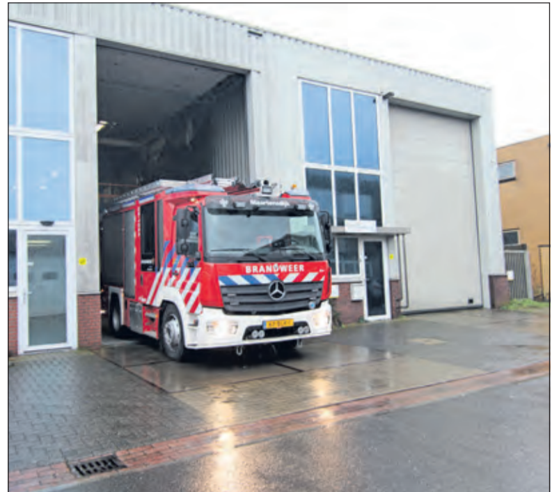
De brandweerauto's in Maartensdijk staat elders geparkeerd omdat ze niet in de huidige kazerne passen.