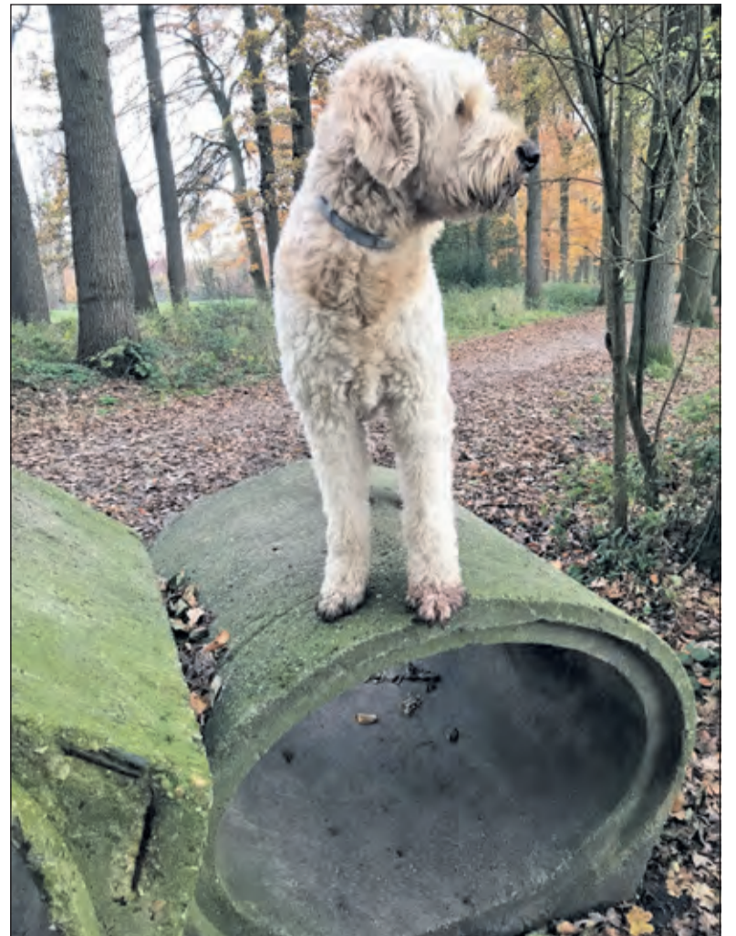
Hulphonden verblijven eerst ca. 1 jaar in een gastgezin om te socialiseren.

Dinsdag 3 maart komen Wietske Stap en Patricia Skene vertellen over hun ervaringen met hulphonden. Westbroek Ontmoet u graag van 14.30 tot 16.30 uur in Het Dorpshuis van Westbroek. De kosten zijn 3,50 euro, inclusief koffie of thee. Wanneer u wél wilt komen, maar niet weet hoe, kan vervoer geregeld worden via de familie Kalisvaart, tel: 0346-281181. Ook wanneer u niet in Westbroek woont, bent u van harte welkom. [HvdB]