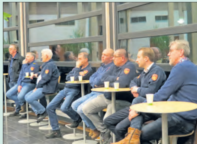
Brandweerlieden op de publieke tribune luisteren mee naar de antwoorden van de burgemeester op vragen over een redvoertuig.