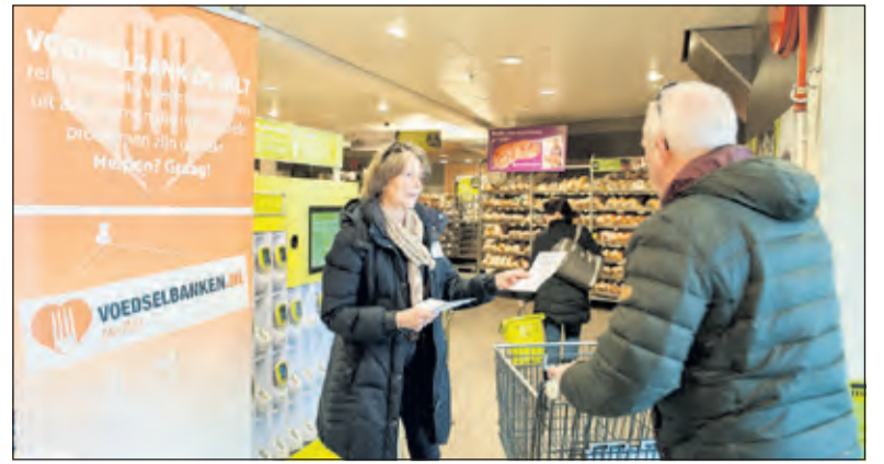
Al vele jaren is de Voedselbank van vrijwilligers afhankelijk, zoals hier in De Bilt in 2016.