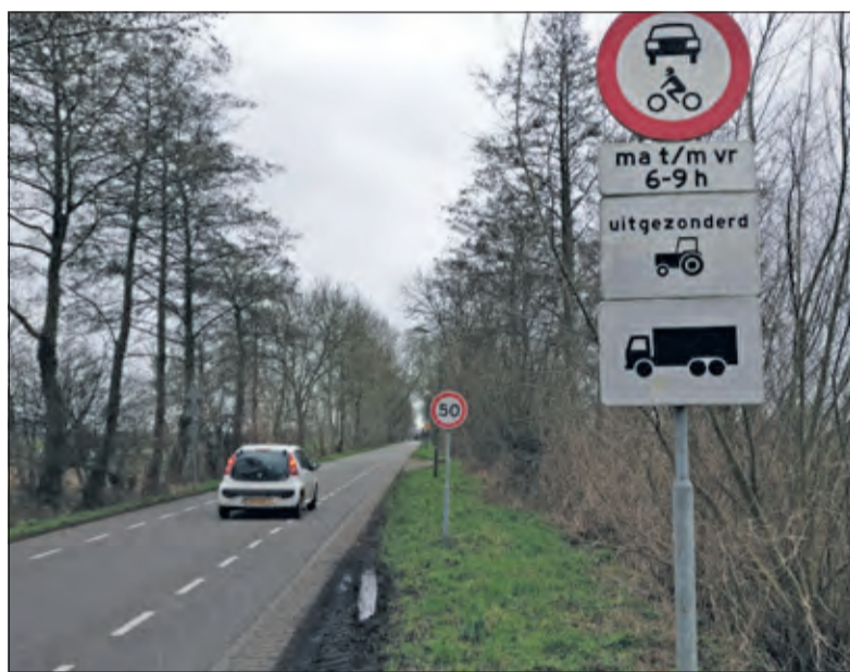
Ook op de Korssesteeg richting Westbroek is 'het piano aan gaan'.

Op grond van voorgaande overwegingen is de gemeente tot het besluit gekomen om de 60 km/u zone te vervangen door het instellen van een limiet van 50 km/u. Dit door het vervangen van de borden op de dr. Welfferweg ter hoogte van de komgrens van Westbroek, rondom de driesprong met de Korssesteeg én op de Achterweteringseweg aan de zijde van de rotonde met de N417. Het besluit is in werking getreden nu de borden zijn aangebracht.