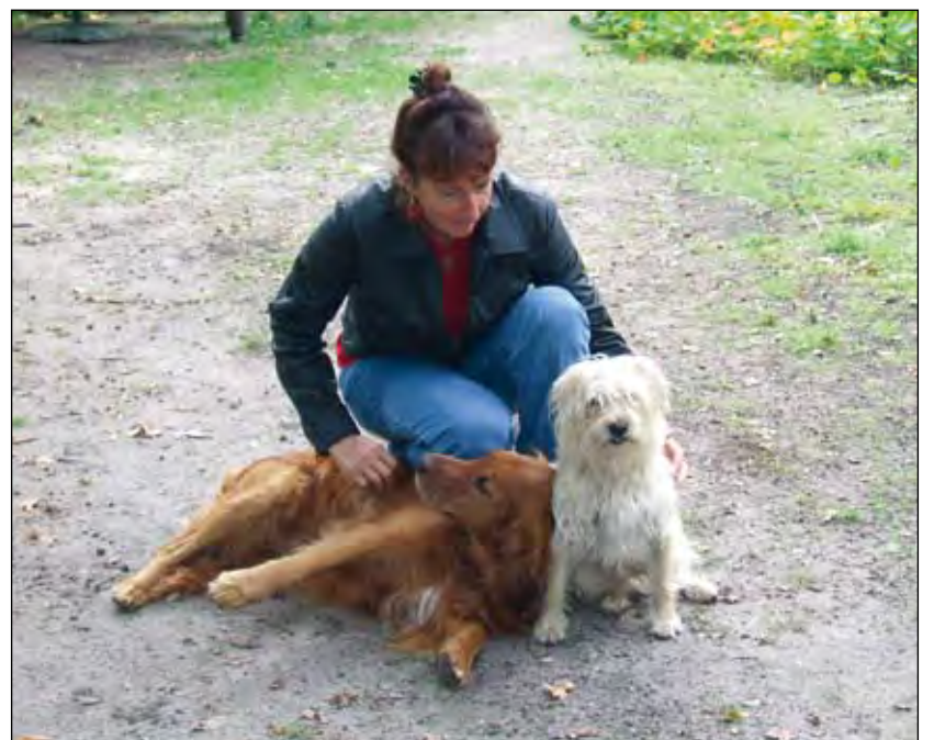
Bij aankomst zorgen honden altijd voor een warm onthaal.