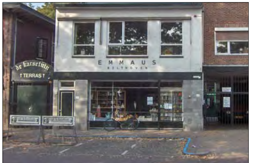
Zaterdag 4 oktober 2008 van 13.00 tot 16.00 uur zal Emmaüs aan de Julianaalaan te Bilthoven haar seizoenmarkt houden.

Neem gerust contact op met Emmaüs, Julianalaan 27, 3722 GD Bilthoven. Tel. 030 2253126 of 030 2292470. E-mail: emmausbilthoven@casema.nl of www.winkeleninbilthoven.nl