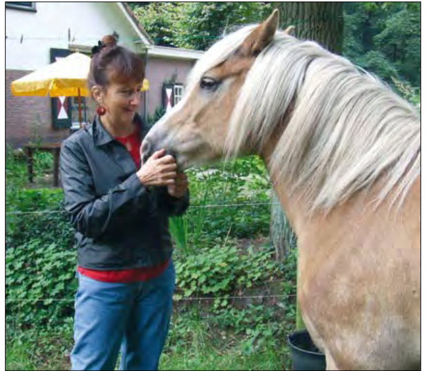
Dieren spelen een grote rol bij Ruimte om te spelen.

Jeannette werkt niet alleen met kinderen met een lichamelijke of een verstandelijke beperking, maar ook met autistische kinderen. 'Die leren