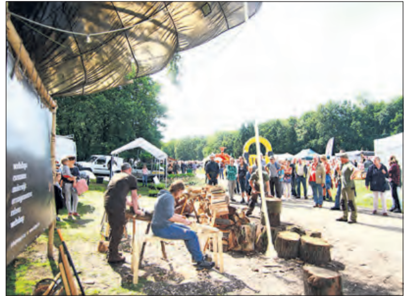
Tijdens het Houthakkersfeest in Lage Vuursche is altijd veel te zien.

Staatsbosbeheer biedt allerlei activiteiten voor jong en oud: leuke kennis quizjes, wedstrijdje boom-schrijven stapelen en brandhout stapelen, bijlwerpen, je eigen broodje bakken, leer houtsnijden van een echte bushmaster en natuurlijk kun je de aanwezige boswachters alle vragen stellen. De Jack Russell racetrack, pijl en boogschieten