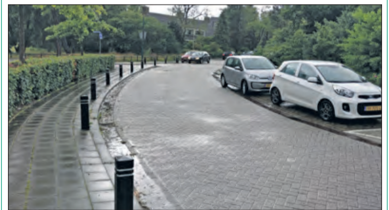
Ter verhoging van de veiligheid rond de Theresiaschool in Bilthoven zijn geleidingspaaltjes aangebracht.

Onze overall conclusie van het rapport is, dat het over het algemeen wel goed zit met de subjectieve en objectieve verkeersveiligheid van en naar school. Maar we moeten er samen aandacht voor blijven vragen, want er komen steeds nieuwe, jonge verkeersdeelnemertjes bij.'