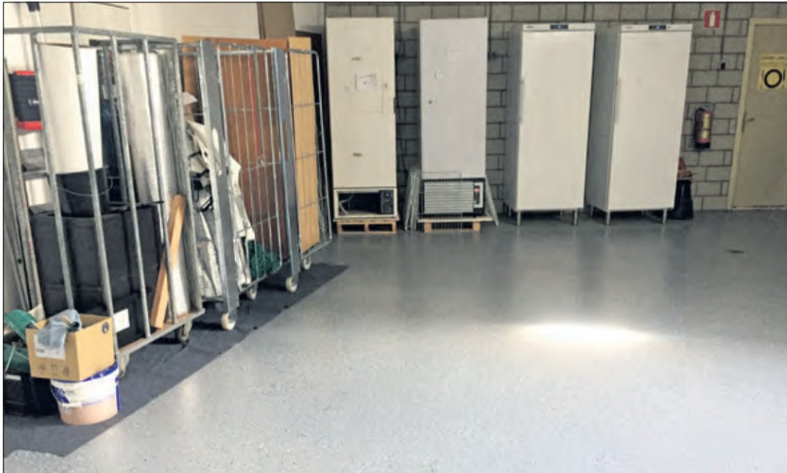
De grote garage transformeert langzaam tot winkel.

uitzoeken en aanschaf van winkel-inventaris en er wordt nog druk overlegd over de laatste details. Voedselbank de Bilt houdt belanghebbenden via de lokale pers hiervan op de hoogte. Later dit jaar is iedereen hartelijk welkom een kijkje te komen nemen tijdens de open dag. (Lucy Duindam)