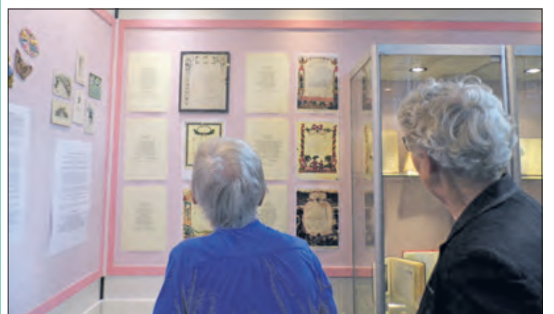
Naast de vitrines hangen gelegenheidsgedichten.