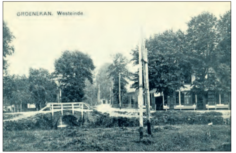
De 'hoek' in Groenekan omstreeks 1920. Rechts de genoemde herberg - later café - en vervolgens kapperszaak. In 1961 afgebroken. Achter een der zware linden is de voordeur met gevelsteen erboven.

Het onderhavige etablissement brandde in 1842 af, werd echter herbouwd. Naar wordt aangenomen bleef de gevelsteen met de fameuze kan behouden, ook bij de partiële afbraak in 1961. Het onverwoestbaar kleinood werd in later jaren opnieuw gevoegd in wat nu de westelijke zijgevel is van het hoekhuis. Het overgeleverd verhaal bevat de suggestie dat ook een alledaags breekbaar voorwerp een plaatsnaam kan bewerkstelligen. Weliswaar niet als zodanig, maar in de vorm van een afbeelding op een ingemetselde gevelsteen van een herberg met een opzienbarend vertelsel. Met zo'n achtergrond kan toch ook een kan 'relatief blijvend en saillant' zijn.