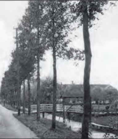
De nog stille dorpsweg 'De Maartensdijk', ter hoogte van Dorpsweg 158. Rechts de Wetering, vroeger ook wel Praamgracht genoemd.

een plaatsnaam dankt zijn ontstaan veelal aan een relatief blijvend, saillant gegeven in de historie van de betreffende omgeving. Veelal, want om te beginnen lijkt deze stelling niet zozeer van toepassing op de naam Groenekan. Een kan is volgens Van Dale een handzaam vaatwerk met oor en tuit. In hoeverre kan een kan blijvend zijn en ook nog saillant 'in het oog springend'? De plaatselijke overlevering weet wel raad met deze beide vragen.