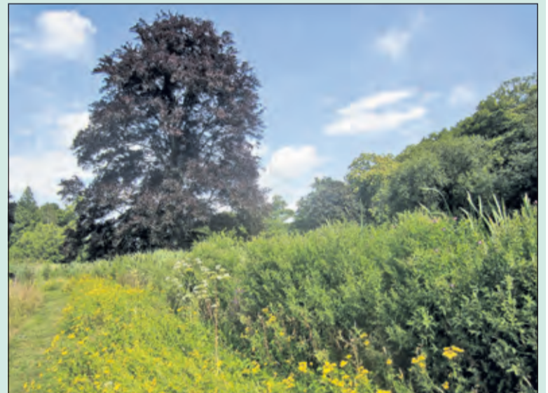
Sandwijkstraat laat zich op z'n mooist zien in de zomer.

Op zondag 18 augustus organiseert de Werkgroep Sandwijkstraat samen met Utrechts Landschap een rondleiding over het landgoed Sandwijkstraat.