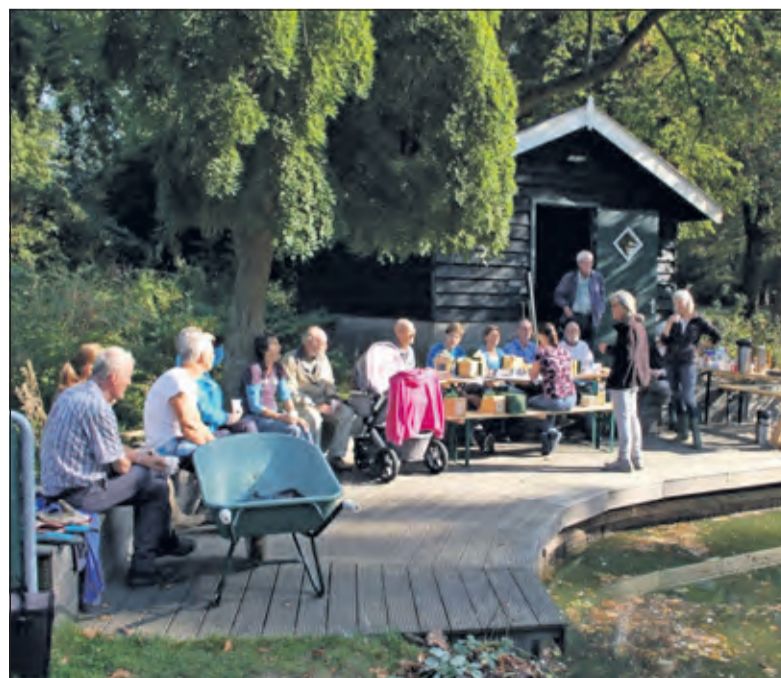
Vrijwilligers werken maandelijks mee.