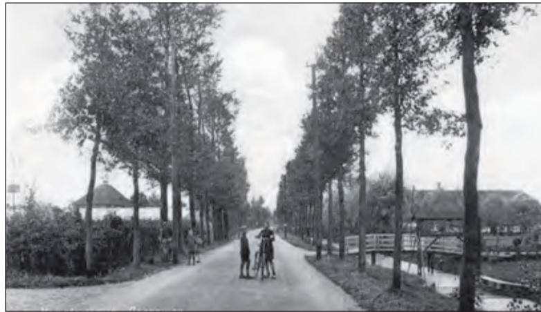
De nog stille dorpsweg 'De Maartensdijk', ter hoogte van Dorpsweg 158. Rechts de Wetering, vroeger ook wel Praamgracht genoemd.

Ten noorden van Westbroek en Achttienhoven lag in de Middeleeuwen de grens tussen het bisdom Utrecht en het graafschap Holland. Aan die vermaarde bestandslijn