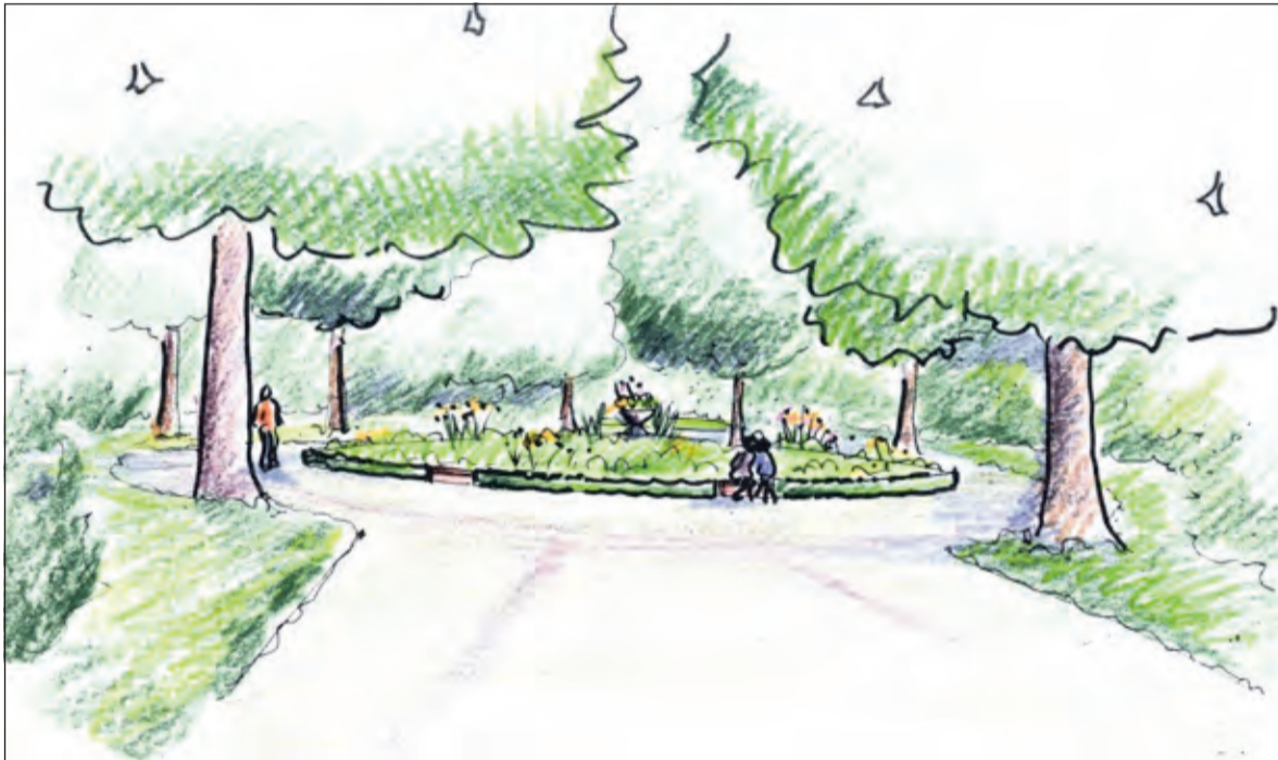
Eerste schets van het cirkelplantsoen (onderdeel van het totale plan).

Ruim 10 jaar geleden is de Vereniging Vrienden van het Van Boetzelaerpark ontstaan uit zorg voor de steeds slechter wordende situatie in het Van Boetzelaerpark. Preventief onderhoud bleef achterwege. Overal groeide onkruid, zaailingen werden volwassen bomen, raakten paden en lanen in verval, banken en prullenbakken waren vernield.