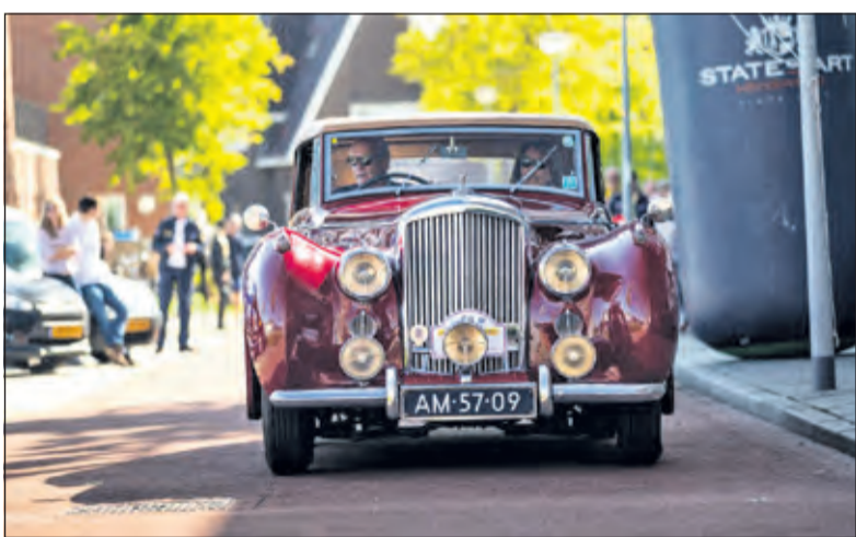
Tijdens de Gijs van Lennep Legend valt er weer voldoende fraais te bekijken.