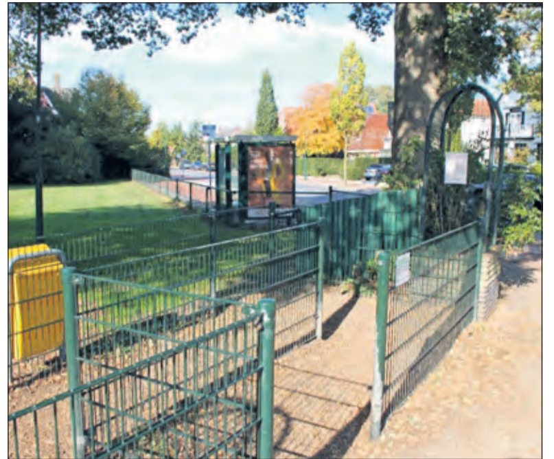
Toegangssituatie bij de rotonde Blauwkapelse- en Hessenweg.

Het plan met de meeste stemmen krijgt die bijdrage. De Stichting Vrienden van het Van Boetzelaerpark wil het park toegankelijk maken voor mindervaliden en mensen met een kinderwagen. Nu is het park slecht toegankelijk voor hen, terwijl het park zoveel te bieden heeft. Zo geeft het park volop gelegenheid om te bewegen over de mooie lanen, genietend van het mooie uitzicht op de imposante bomen, kuierend in de zon, zittend in het gras of op de vlonder of bankje. In de vroege ochtend, tijdens de middagpauze van het werk, of na school- of werkdag. Voor mindervaliden en mensen met een kinderwagen is dan wel een onbelemmerde en droge (plassenvrije) toegang nodig. De huidige gazen hekwerkconstructie en omgeving daarvan verhinderen dat en daar-