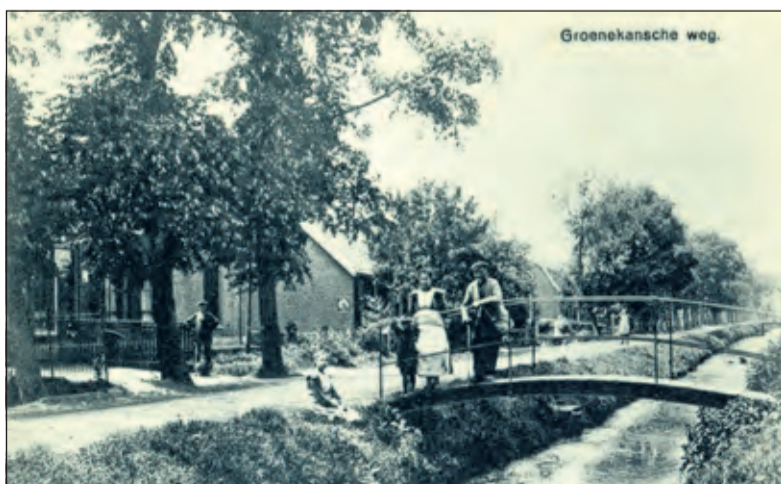
Achter in Groenekan: Rechts de Bisschopswetering, het boogbruggetje is er nog. [foto uit de digitale verzameling van Rienk Miedema]