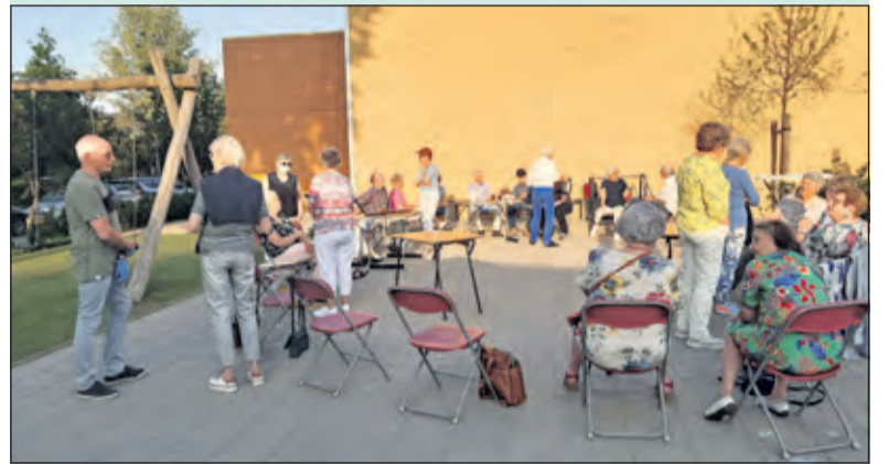
Zang Veredelt is donderdagavond 3 juni na lange tijd weer even bij elkaar geweest om bij te praten onder het genot van een kopje koffie of thee.