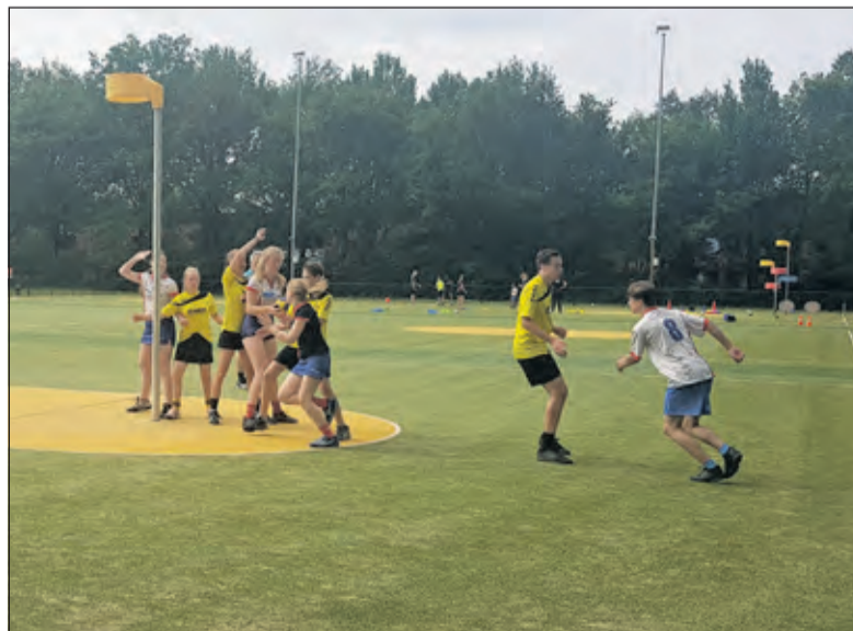
De jeugdteams van Nova spelen een kleine officiële competitie voor de zomer.