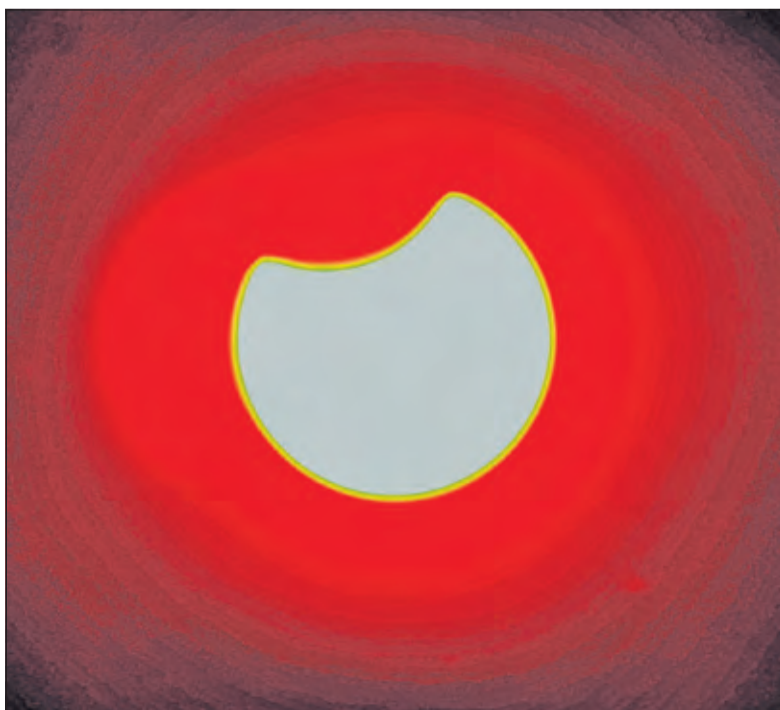
Tijdens de zonsverduistering neemt de maan een hapje uit de zon.