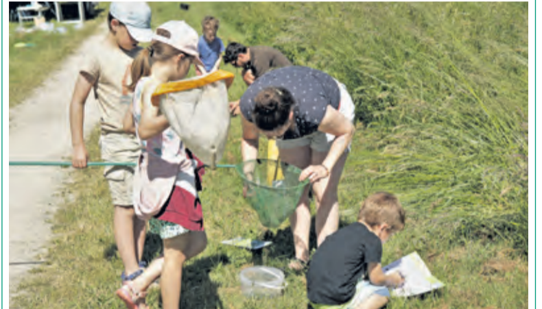
De vangst van het schepnet wordt nauwkeurig bekeken.