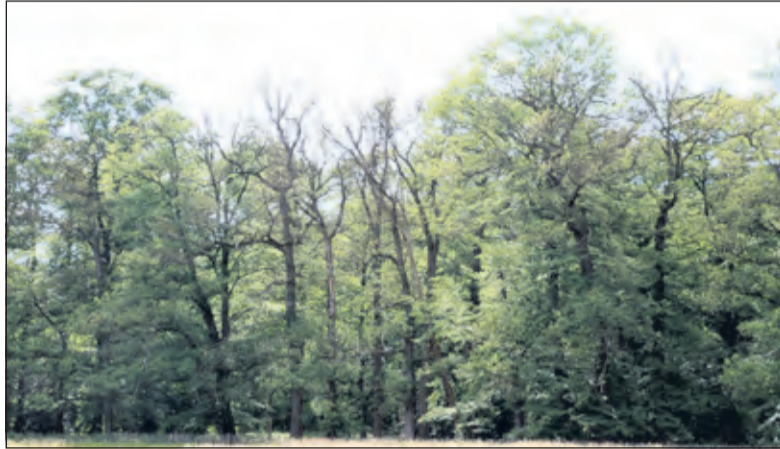
Aangetaste eiken op landgoed Beerschoten.

In de periode mei-juni komen hieruit spanrupen tevoorschijn. Dit zijn rupsen die zich verplaatsen door lus-