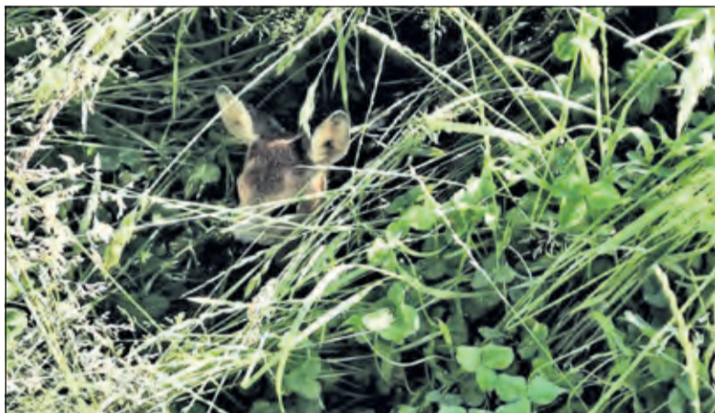
Het reekalfje richt zich op om enkele ogenblikken hierna op te springen en zich veilig uit de voeten te maken.

Om 18.30 uur ging onder de bezielende leiding van boswachter Diederik de avond van start. Vooral om zich tegen teken te wapenen droegen de meeste deelnemers een lange broek met laarzen en overhemden met lange mouwen. Ook hadden ze een stok bij zich om het lange gras wat opzij te kunnen slaan. Reekalfjes liggen bij gevaar doorgaans dicht tegen de grond aangedrukt en zijn daarom vaak moeilijk te zien. Om zo zorgvuldig mogelijk het terrein af te speuren werd er in colonne op 1,5 meter naast elkaar door de weilanden gelopen.