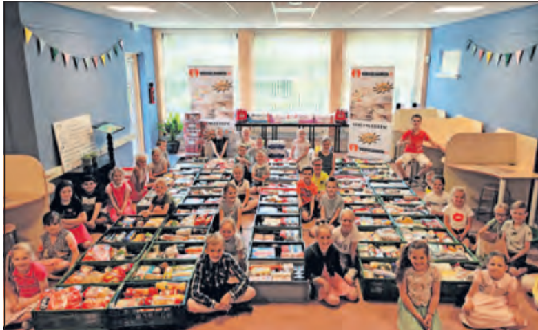
Een deel van de kratten wordt door zo'n 30 leerlingen bewaakt.

'Ook werden er diverse mensen uit ons dorp via een Facebookpagina bij de actie betrokken. Prachtig dat er spontaan zoveel boodschappen werden afgegeven voor dit doel. Donderdagavond was er nog een veiling en de opbrengst daarvan is opnieuw bij de Jumbo besteed. Vrijdag werden de laatste artikelen door de leerlingen mee naar school genomen en diezelfde middag kwamen de medewerkers van de Voedselbank alles weer ophalen'.