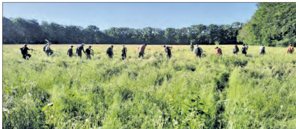
Nauwkeurig in colonne worden de weilanden uitgekamd op zoek naar reekalfjes.

worden. Echter de verwachting is wel dat de inzet hiervan 's morgens vroeg verreweg het meest effectief zal zijn. Er valt dan namelijk nog een duidelijk onderscheid waar te nemen tussen de koelte van de