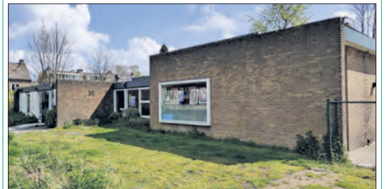
In week 26 zijn er kijkdagen bij de voormalige Kinderopvang aan de Aeolusweg 14 in De Bilt.

Circulair (duurzaam) slopen is het zodanig slopen van gebouwen om de materialen, die vrijkomen voor nieuwe doeleinden te kunnen gebruiken. Het leegstandsbeheer wordt voor de sloop beëindigd. Voorafgaand aan de sloop krijgen omwonenden een informatiebrief van het sloopbedrijf met een toelichting over de werkzaamheden, aanrijroutes werkverkeer en overige informatie. De hoofduitvoerder is tijdens de gehele duur van de werkzaamheden op de slooplocatie aanwezig. Omwonenden die tijdens de werkzaamheden vragen of klachten hebben kunnen naar hem toegaan, hem bellen (06 52348335) of het sloopbedrijf bellen (071 3030500).