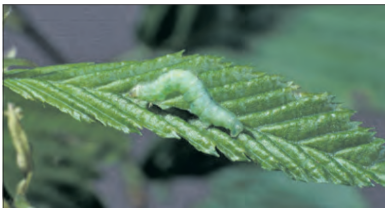
Rups van kleine wintervlinder:66

Jacqueline van Dam Boswachter Publiek Utrechts Landschap