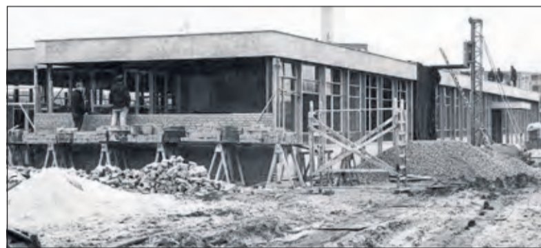
Het atelier startte in 2014 in de voormalige Jan Lighthartschool aan de Orionlaan in Bilthoven. (foto - van de bouw ervan in de vorige eeuw - van Ad Kon in het Utrechts archief)

staan en waar een spatje niet meteen voor een groot probleem zorgde. Er was goed licht, verwarming en een toilet. Antikraak of leegstandsbeheer heet dat. Wel met het risico dat de huur met een maand opgezegd kon worden'.