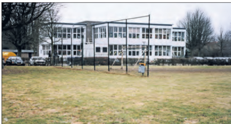
De voormalige Buys Ballot-school bood ook onderdak. (foto maart 1996 Historische Kring De Bilt)

'Dat hebben we geweten. Zo verhuisden we van de Orionlaan naar voormalig buurthuis Het Hoekje aan de dr. Asscherweg, een ideale plek waar we drie jaar zijn gebleven. Daarna naar de Regenboogschool (ooit Buijs Ballotschool) aan de Buijs Ballotweg, waar in de winter geen verwarming was, toen naar De Breul in Zeist en tenslotte eindigden we in het (inmiddels oude) zwembad Brandenburg. Daar valt binnenkort de sloophamer.