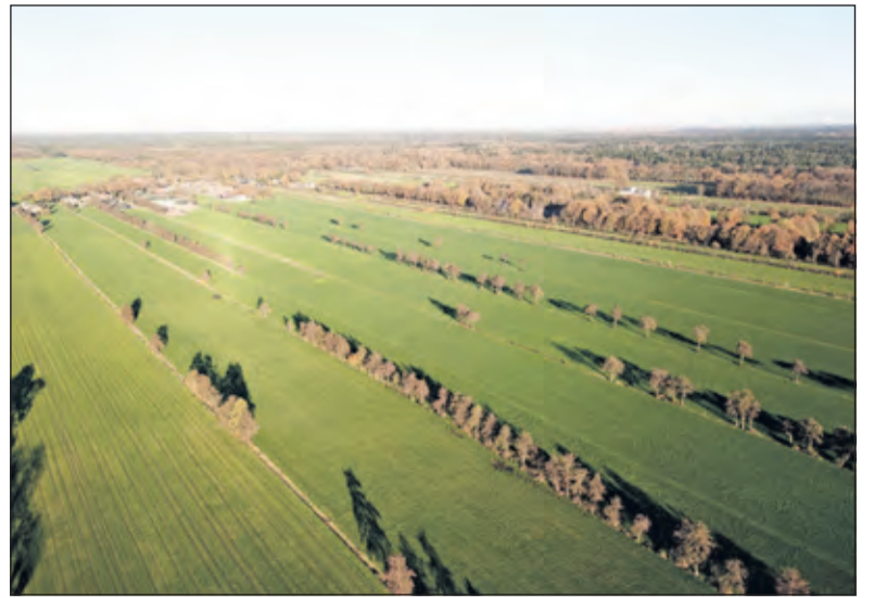
Een deel van het slagenlandschap; Landerijen ten oosten van de Julianalaan en de Prinsenaan en ten zuiden van de Dorpsweg in Maartensdijk.