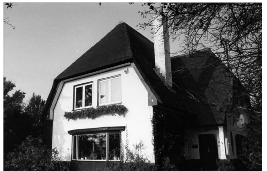
Het huis van mevrouw Knopius aan de Groenekaneweg 137.