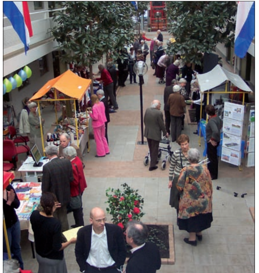
De Informatiemarkt kon zich, gezien het grote aantal belangstellenden, verheugen op veel aanloop. Folders werden uitgedeeld en vragen beantwoord.