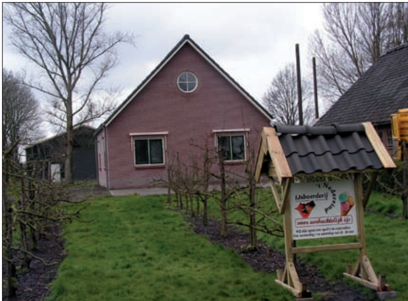
Ijsboerderij 't Nedereind wacht op de klanten.