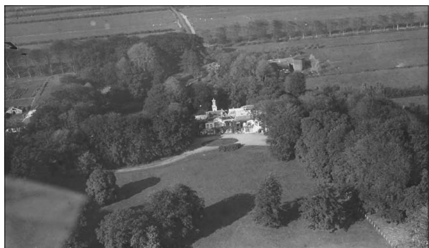
Zeldzame luchtfoto van het in 1925 afgebroken grote huis Beukenburg.

Op de Nieuwe Caerte van de provincie Utrecht, in 1696 door Bernard de Roy getekend, komt het oorspronkelijk ruim 45 ha grote landgoed Beukenburg al voor. Het strekte zich vanaf de huidige Groenekaneweg uit tot aan de huidige Dorpsweg in Maartensdijk. In 1696 is de Beukenburgerlaan al ingetekend. Aan de Beukenburgerlaan stond aan de noordzijde ter hoogte van de Nieuweweteringseweg een groot, 45 kamers tellend huis. Oorspronkelijk was dit een uit de 18de eeuw stammende boerderij, die vanaf 1890 in fasen is vergroot tot een landhuis. In 1925 is dit niet meer te onderhouden huis afgebroken. Alleen