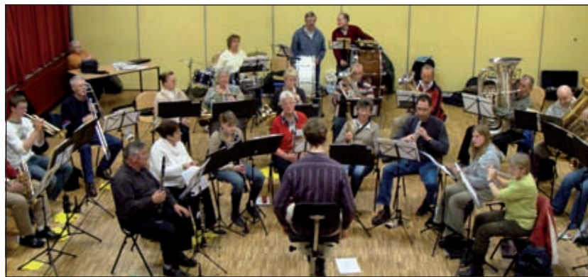
Het harmonieorkest Kunst en Genoegen concerteert op vrijdag 28 maart a.s.