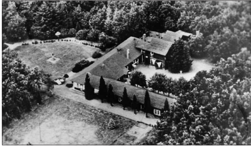
Luchtfoto van het houten Jachthuis.