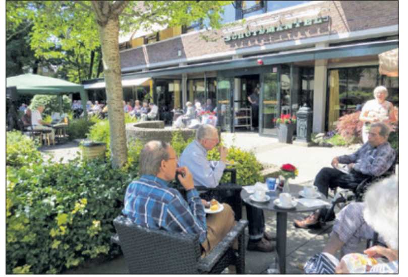
De Schutsmantel organiseerde op woensdag 14 juni een muzikale high tea voor de naaste burens. Zo'n zeventig mensen, bewoners en burens hadden een zeer geslaagde middag.