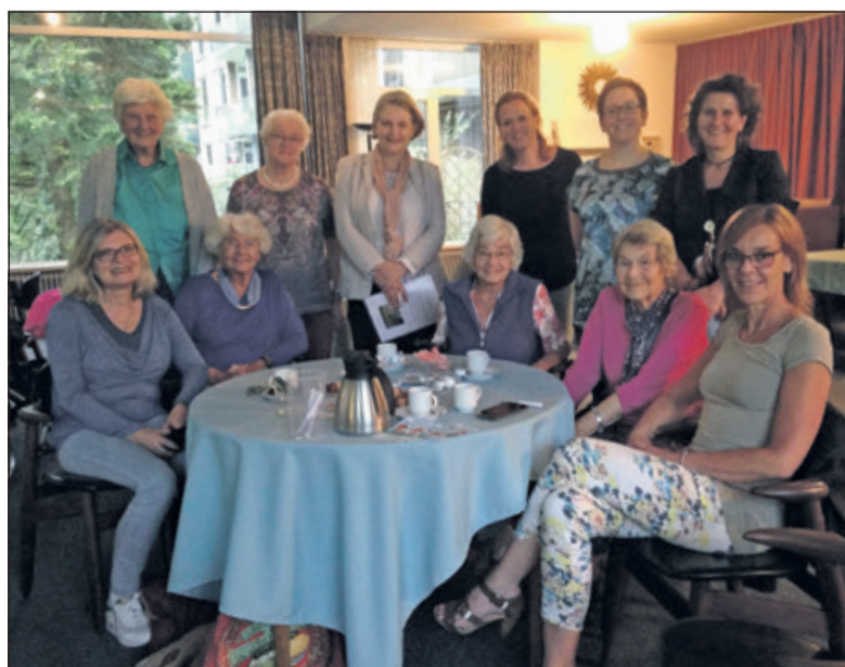
De deelnemers aan de eerste Hallo Buur-bijeenkomst.

Ook belangstelling voor zo'n avond? Neem contact op met info@hallobuur.nl