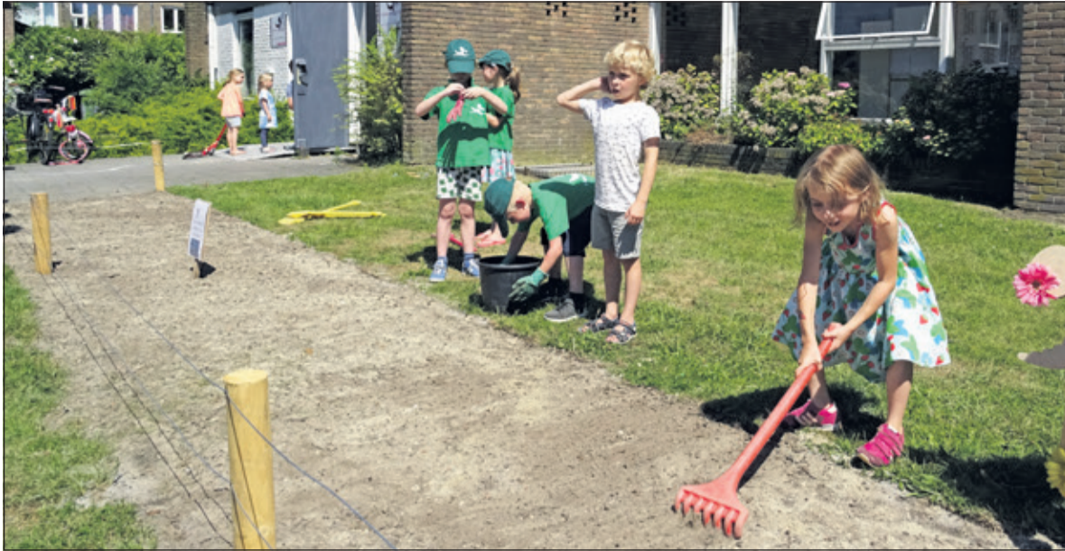
De kinderen van de BSO doen hun uiterste best om het bloemenzaad gelijkmatig te verdelen en in te harken in het grote bloembed dat honden moet tegenhouden en bijen moet aantrekken.