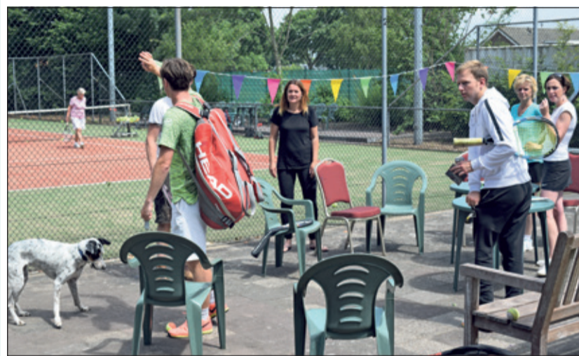
Zaterdag 17 juni was de open dag voor TV het Kraaienveld in Westbroek. Zo'n 25 deelnemers speelden gedurende de dag wedstrijdje met en tegen elkaar.