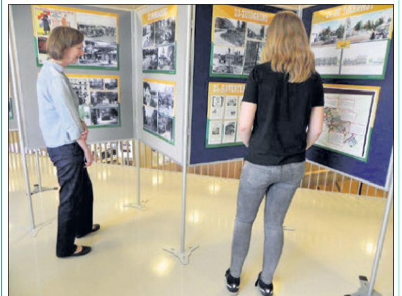
De tentoonstelling in het Lichtruim wordt regelmatig bezocht.

Vanaf maandag 12 juni t/m zaterdag 8 juli staat de tentoonstelling gepland in de bibliotheek van het Lichtruim, Planetenbaan 2 in Bilthoven. Daarna in de Mathildezaal van het gemeentehuis vanaf 11 juli tot 11 augustus. Na de zomer zal de tentoonstelling te zien zijn van dinsdag 29 augustus t/m zaterdag 2 september bij Schutsmantel Warande Wooncentrum, Gregoriuslaan 35 in Bilthoven en daarna nog van zondag 17 september t/m zondag 15 oktober in de Centrumkerk (voormalige Julianakerk aan de Julianalaan) in Bilthoven.