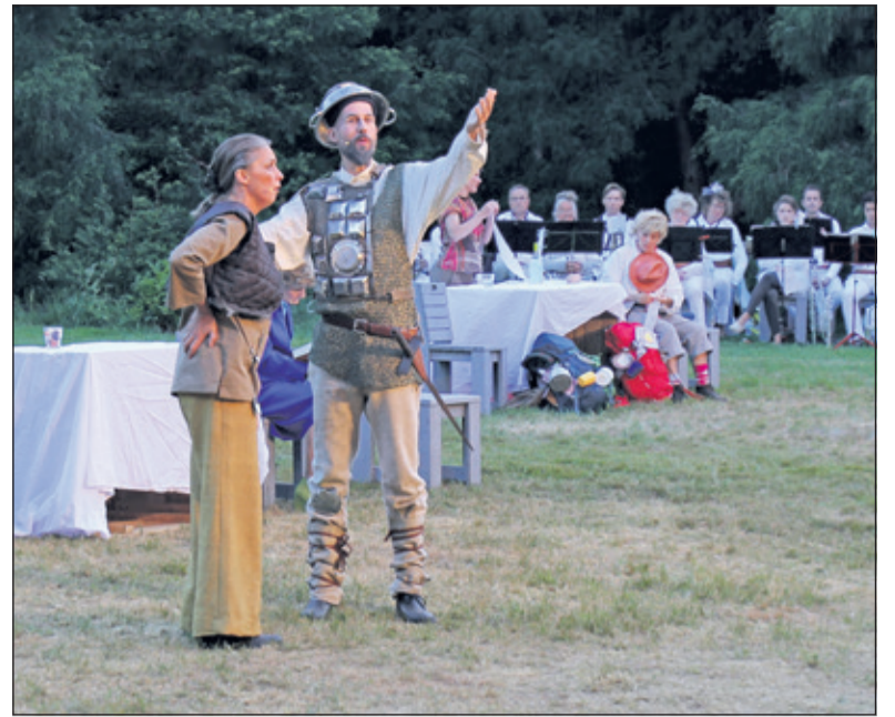
Don Quichot en Sancho Panza op Landgoed Eyckenstein met op de achtergrond muzikanten van de KBH.