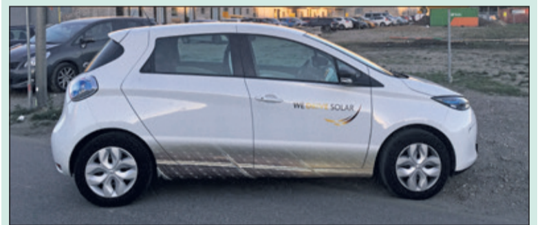
De elektrische deelauto bij De Veemarkt in Utrecht.

Woensdagavond 28 juni organiseert energiecoöperatie BENG! samen met de vereniging voor samenlevingsopbouw WVT een informatieavond over 'We drive Solar' in het WVT-gebouw aan de Talinglaan 10 in Bilthoven. Inwoners van gemeente De Bilt zijn welkom vanaf 19.30 uur. De presentatie over 'elektrisch rijden met de kracht van de zon' start om 20.00 uur.