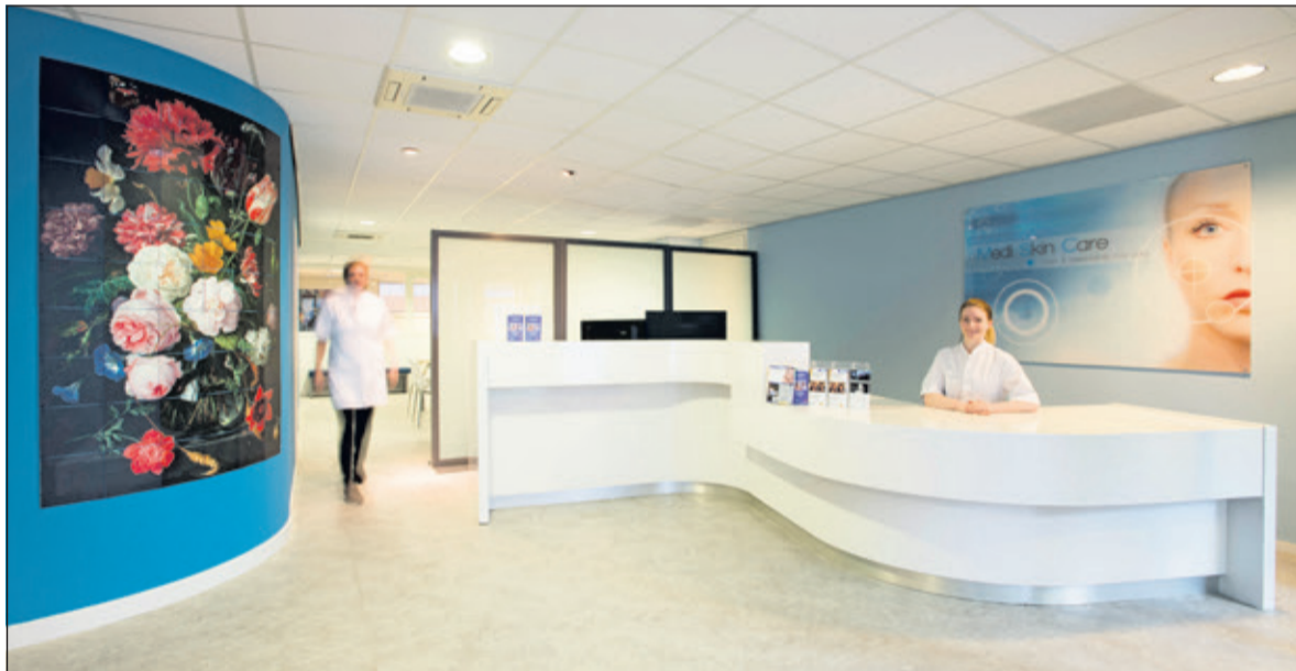
Medi Skin Care is gevestigd in de voormalige apotheek aan de Hessenweg.

Maak een afspraak voor een gratis consult via 030-2203600 of bezoek het huidcentrum aan de Hessenweg 192, 3731 JN in De Bilt. Of bezoek www.mediskincare.nl