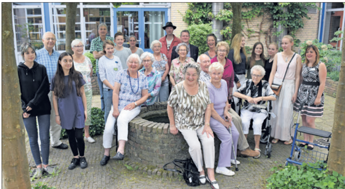
Leerlingen van het Groenhorst College nodigden 11 ouderen uit voor een rondleiding op school en een lunch.