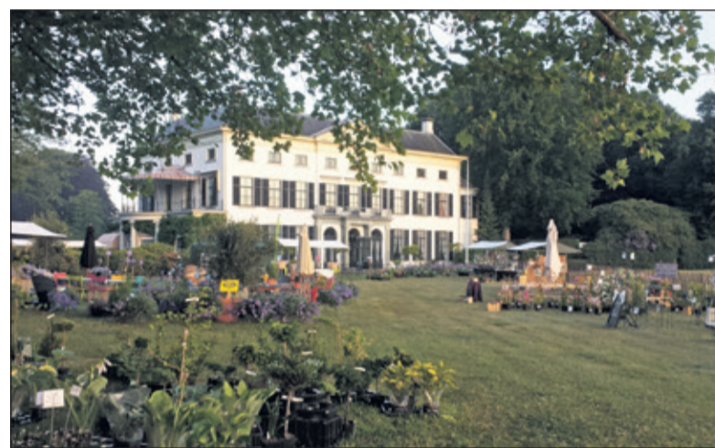
Voor de laatste keer de cultuurhistorie van het landgoed beleven.

De tuindagen zijn op Landgoed Vollenhoven, Utrechtseweg 59 te De Bilt op vrijdag 23, zaterdag 24 en zondag 25 juni 2017 van 10.00 tot 17.00 u. Honden zijn welkom mits aangelijnd. Info www.landgoedvollenhoven.nl of info@landgoedvollenhoven.nl