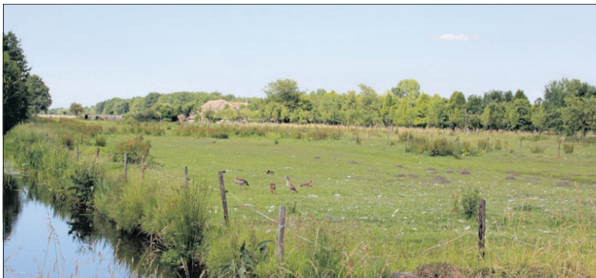
Een deel van het gebied; zuid-noord-lopend en met één kavel er tussen ten westen grenzend aan de Veldlaan.

raad voor te leggen. Zij vond, dat het bouwplan voorzien was van een goede ruimtelijke onderbouwing. Ook was het College van mening, dat het voorziet op een kwaliteitsverbetering ten opzichte van de huidige feitelijke en planologische situatie. Ook de commissie voor ruimtelijke kwaliteit had positief geadviseerd. Tenslotte meldde het College, dat de Provincie positief was over de planopzet en de definitieve afweging aan de gemeente zou overlaten.