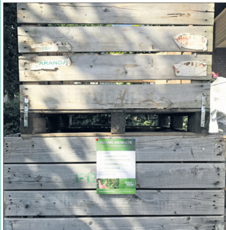
De bakken voor het taxussnoeiwerk staan bij Hoveniersbedrijf Cor van Vliet al klaar om gevuld te worden.

Het snoeiwerk moet zo snel mogelijk nadat het is gesnoeid worden verwerkt, om er zo voor te zorgen dat de werkzame stoffen behouden blijven. Dertig meter heg levert één kubieke meter jong snoeiwerk op, genoeg voor één chemotherapie sessie. Er is dus heel wat snoeiafval nodig. Daarbij gaat het om jonge takjes. Hoveniersbedrijf Cor van Vliet aan de Dierenriem 7 is een van de hoveniers waar taxussnoeiwerk ingeleverd kan worden. En mocht u zelf geen zin of tijd hebben om te snoeien dan willen ze u daar uiteraard bij helpen. Zie www.vanvliethoveniersbedrijf.nl