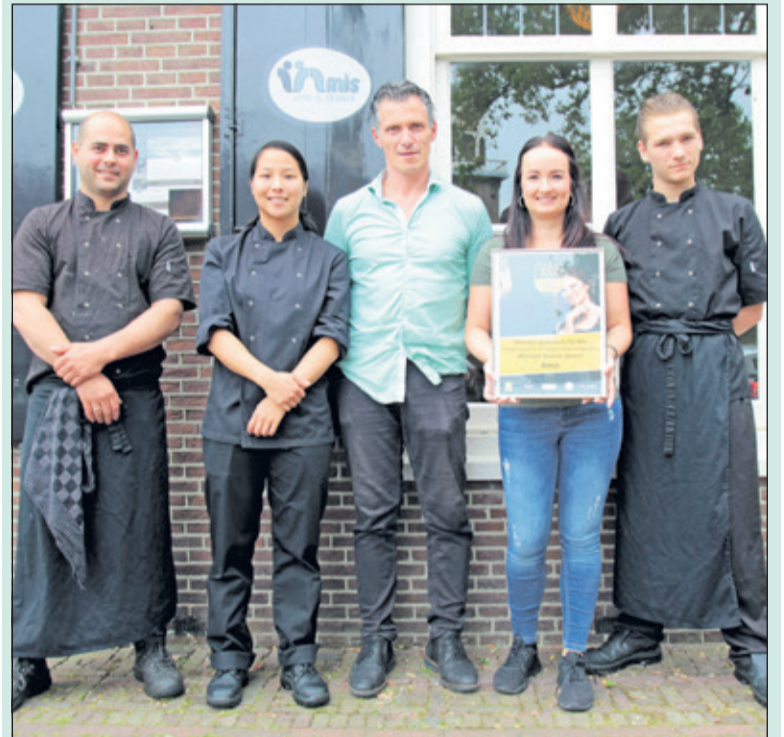
Amis is Frans voor vrienden. En dat willen ze graag met je zijn of worden.

In deze gemeente waren er zeven kandidaten. In iedere gemeente zijn er twee winnaars: het restaurant met het hoogste gemiddelde cijfer en het restaurant met de meeste stemmen. Dit kan natuurlijk ook hetzelfde restaurant zijn, dan is dat de enige winnaar in de gemeente. En Amis eten & drinken ging met beide prijzen naar huis. [HvdB]