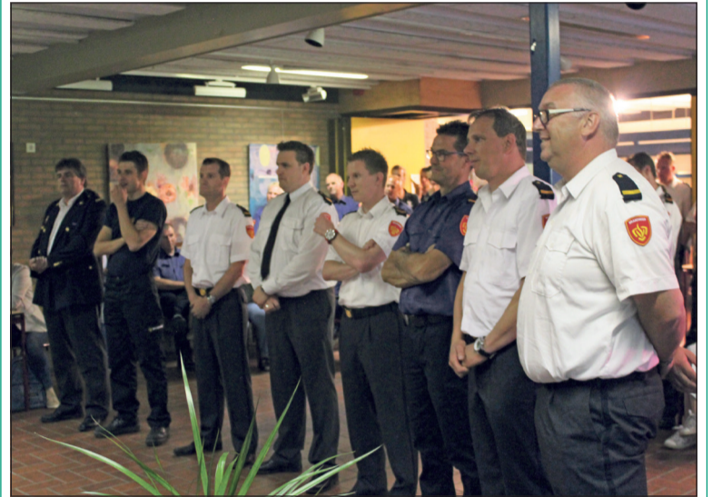
De negen post- c.q. groepscommandanten wachten in spanning de uitslag af.

Zaterdag 17 juni organiseerde de Groenekanse Brandweer een wedstrijd waarvoor brandweerploegen uit het hele land zich via voorrondes wisten te plaatsen. De 3 besten gaan door naar de landelijke finale in september.