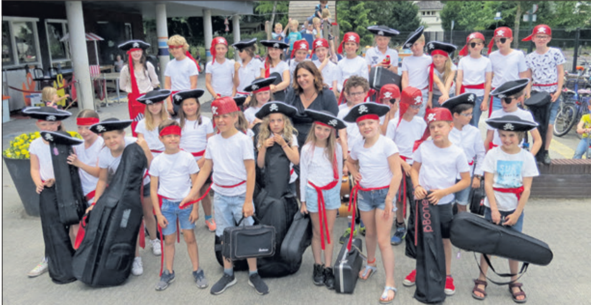
De muzikanten vlak voor het vertrek naar TivoliVredenburg in Utrecht.

Ook dit jaar is er weer een spectaculaire muzikale wedstrijd voor basisschoolleerlingen met als doel meer muziek in de klas te krijgen. Ruim 4000 kinderen strijden de komende tijd om een plek in de allergrootste schoolband van Nederland. Op basis van een ingezonden filmpje werden 109 klassen uitgenodigd hiervoor auditie te komen doen. Zij kregen bij het verfijnen van hun act hulp van een professionele vakleerkracht.