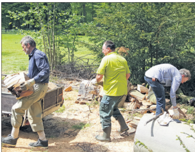
Een gesneuveld zware beuk wordt afgevoerd.