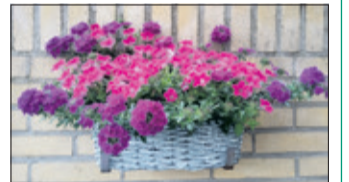
Wat rest is de foto.

De rieten bloembak die wij van onze dochter hadden gekregen en die mijn vrouw tot volle wasdom had gebracht (zoals uit bijgevoegde foto blijkt), kon daar wellicht uitkomst in brengen. Degene met lichte broek en grijs T-shirt, die rond 04.30 uur ter plekke was zag dat als de oplossing voor zijn probleem en wandelde met bak en al de tuin uit. Wij hopen dat zijn vader een fijne dag heeft gehad.