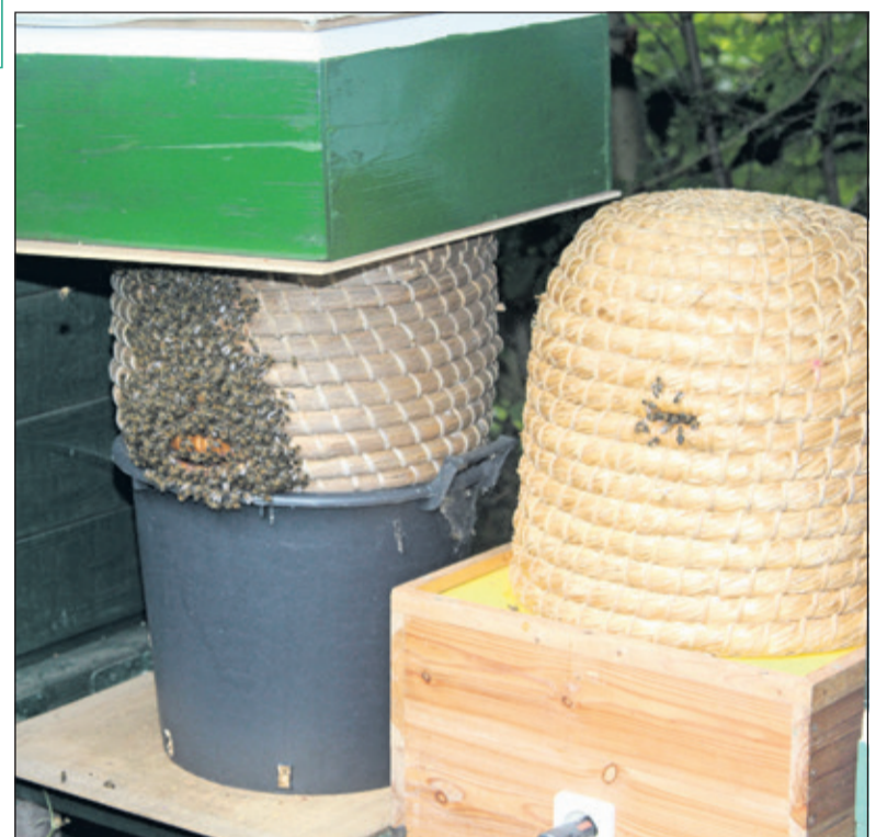
De bijen weten Kastanjelaan 1 in Groenekan goed te vinden.

Een vrouw met groene vingers die haar uiterste best doet om het leefgebied in haar buurt groener en kleurrijker te maken.