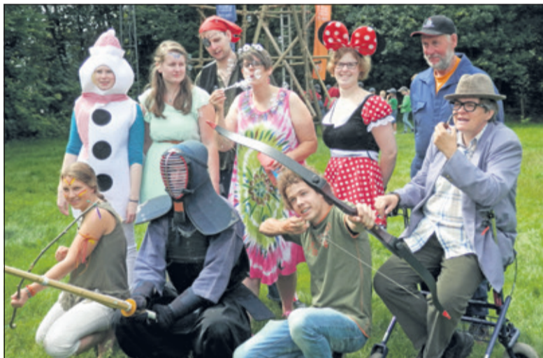
De vossen van 2016.

Tijdens de vossenjacht zoeken de kinderen naar verklede mensen die op het Maartensplein en de straten daaromheen lopen. Heb je een vos gevonden, dan krijg je een handtekening op je lijst en kun je op zoek naar de volgende. Sommige vossen zijn heel opvallend gekleed (zo heeft er wel eens een smurf en een draak door het dorp gelopen), maar soms vraag je je ook af of iemand nou een vos is of gewoon iemand die in een overall aan zijn auto aan het sleutelen is.