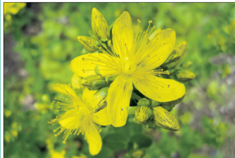
Sint-janskruid ( Hypericum perforatum ) bloeit rond het Sint-Jansfeest op 24 juni, de tijd dat de zon op zijn hoogst staat.