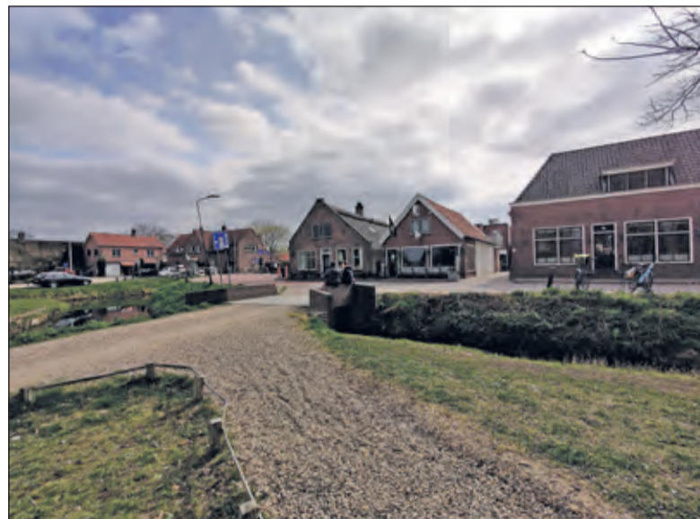
Veiligheid, leefbaarheid en onderlinge verbondenheid zijn belangrijke aandachtspunten in Westbroek.

bedreiging. Hierbij wordt voornamelijk het bouwen buiten de rode contouren als bedreiging gezien. Daarnaast wordt door een vijfde (20%) van de inwoners de afname of aantasting van de natuur genoemd. Tevens werd open gevraagd wat de inwoners als de grootste kans voor de toekomstige ontwikkeling van de leefomgeving zien. De grootste kansen liggen volgens de inwoners op het gebied van groen en natuur (22%). Het gaat hierbij met name om het behoud hiervan. Verder noemt een vijfde (20%) van de inwoners het inzetten op duurzaamheid en milieubescherming. Het behoud (en de uitbreiding) van groen en natuur wordt bovendien het vaakst (25%) als grootste wens voor de toekomst van de gemeente genoemd. Wensen met betrekking tot voorzieningen en het centrum, goede en betaalbare woningen en duurzaamheid en milieubescherming worden door ruim een tiende van de inwoners genoemd (elk aspect wordt door 11% genoemd).