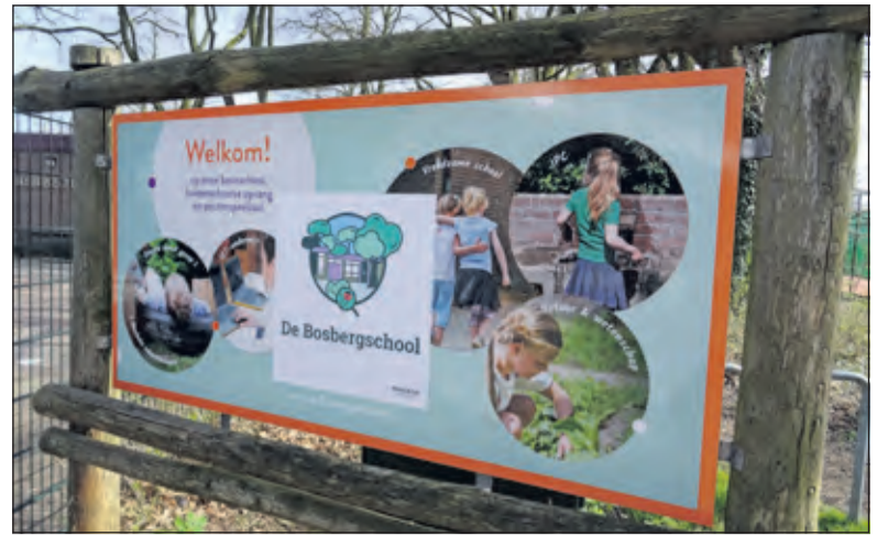
Het bord met nieuw logo bij de ingang van de school geeft duidelijk weer waar de school voor staat.

actieve oudergroep wordt er een thema bedacht zoals het werken in de moestuin van de school die door dorpsgenoten inclusief ouders wordt onderhouden. Derde onderwerp waar de school voor staat is - naast reguliere lesstof - werken met het vernieuwende internationale onderwijsconcept IPC (International Primary Curriculum). Kinderen leren op hun best door boeiende, actieve en zinvolle lessen en werken zo aan hun zelfvertrouwen, ze ontdekken volop hun eigen talenten en er is aandacht voor burger-