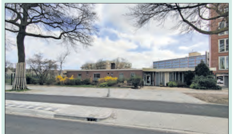
Op het perceel Melkweg 3 - gelegen tussen appartementencomplex La Luna (rechts) en de voetbalcourt - zijn plannen voor de bouw van een appartementencomplex.

Gedurende bovengenoemde termijn kan iedereen schriftelijk of mondeling zienswijzen omtrent het ontwerpbestemmingsplan indienen. De zienswijzennota maakt deel uit van het door de gemeenteraad te nemen besluit tot vaststelling van het bestemmingsplan. Ingediende zienswijzen kunnen aanleiding geven tot aanpassingen. Het ontwerpbestemmingsplan wordt dan gewijzigd vastgesteld. [HvdB]