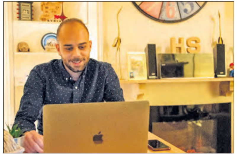
Met een video-entje komen gezelligheid en taal oefenen samen.

Sinds het begin van de coronapandemie is het mogelijk om via het Eet Mee platform video-entjes te organiseren. Een gezellig en veilig alternatief voor de entjes thuis waar Eet Mee om bekend om staat. Je kookt voor jezelf, maar zit toch een soort samen aan tafel. Ook voor Taal aan Tafel biedt de mogelijkheid om samen te eten op afstand uitkomst. Zodra de coronamaatregelen het weer toelaten is het doel om ook Taal aan Tafel entjes bij mensen thuis te gaan organiseren.