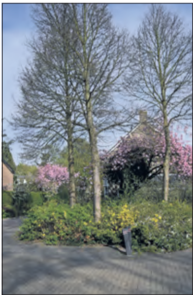
Een van de vele foto's die er van wijk Noord-Oost te maken zijn.

de wijk nog altijd bepaald door elementen uit dit landschap van welter. Met prachtige bomen en struiken die kleur aan de straten geven en met kleine stukjes groen tussen de huizen en flats. Maar ook hier staan de leefbaarheid en veiligheid in de wijk onder druk.