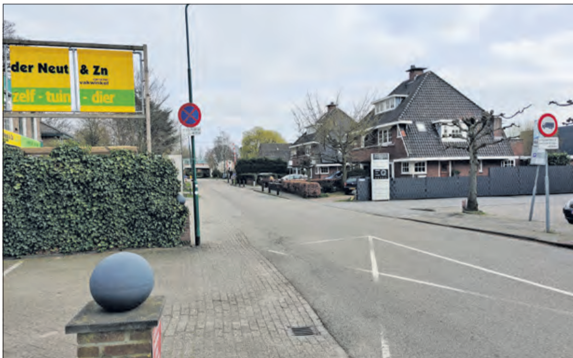
Veel inwoners van Groenekan noemen het gemis van voorzieningen in de buurt.