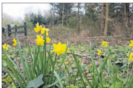
Narcissen in de bossen rond Bilthoven.

En zo is de narcis, die op Pasen her en der in de bossen rond Bilthoven uitbundig bloeide, ook teken van de Opstanding van Christus: een nieuwe lente, maar vooral hernieuwde hoop voor de stervelingen die haar wonder mogen aanschouwen.