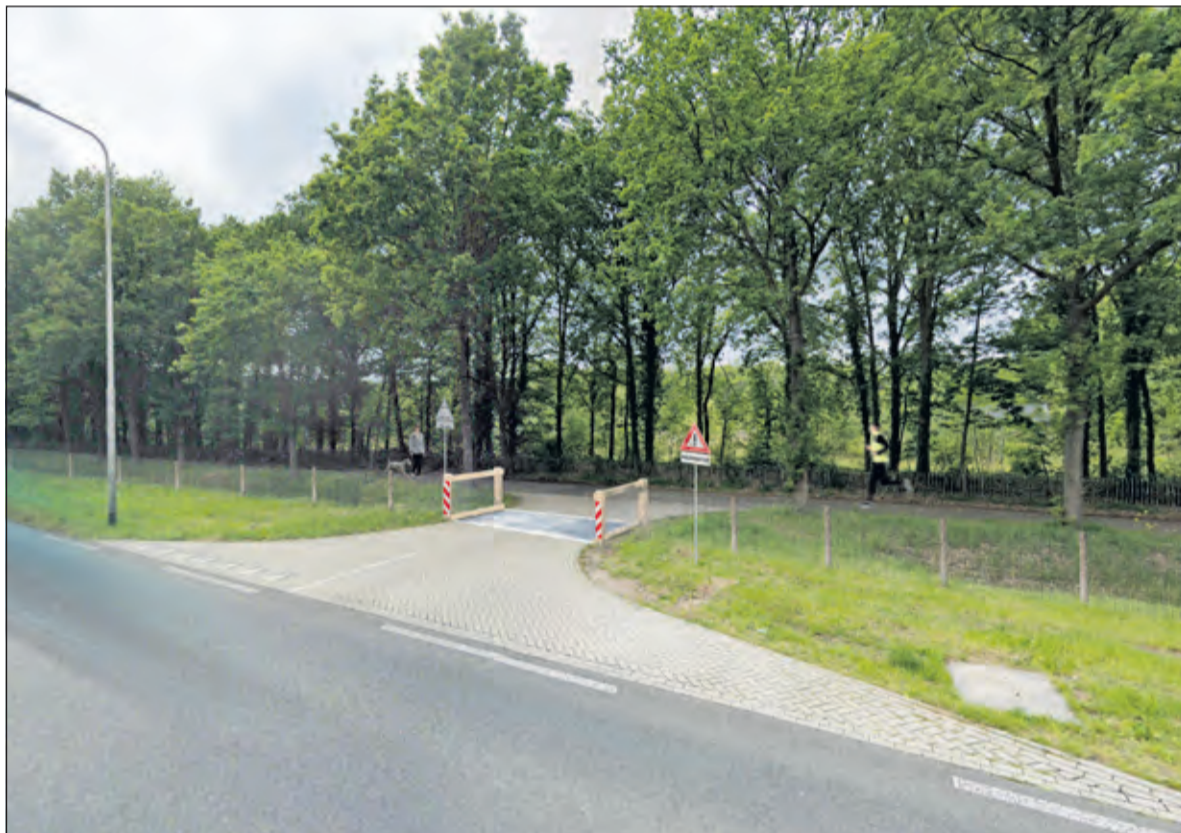
Beeldimpresie van een wildraster bij de N237. (Clara van Foreest)