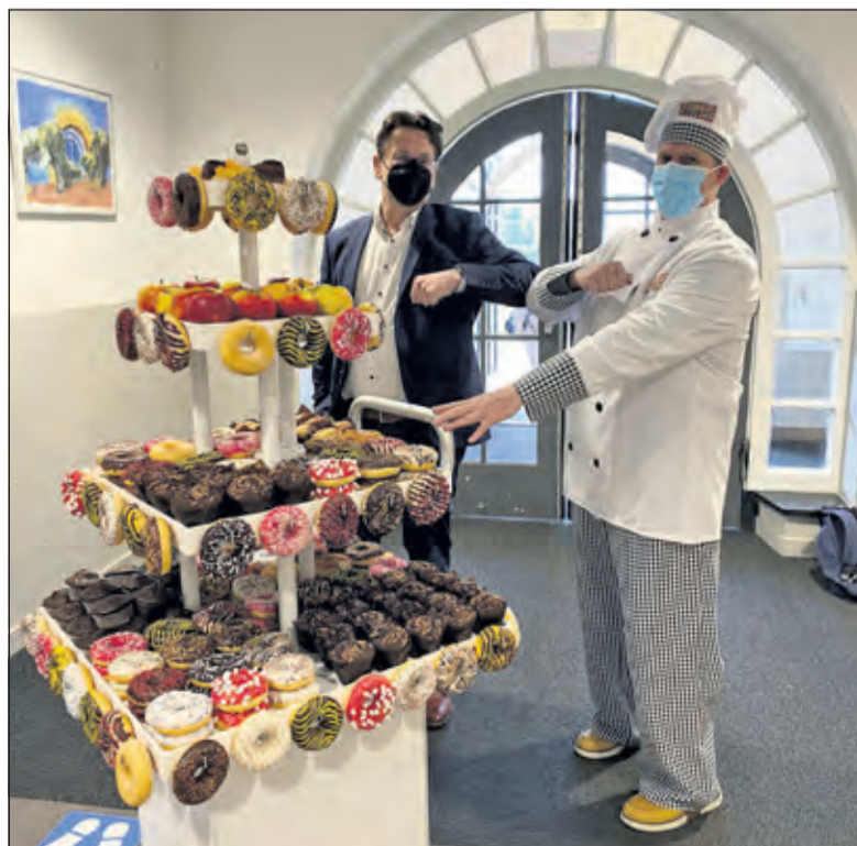
De 'voldoende' wordt gevierd met taart.

Dinsdag 30 maart was het zover, de inspectie stond weer aan de deur. 'Net als bij een ISO-9001 controle, werden diverse leerlingen, docenten, mentoren en leden van de schoolleiding gevraagd iets te vertellen over de kwaliteit van het on-