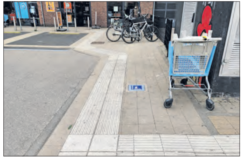
Bij de Biltse supermarkt wordt gebruik van de blindengeleide-strook vaak belemmerd.

Misschien zijn ook hier nog wel melders die snuffelend op zolders of in kelders met heel veel plezier werk vinden voor hier of wellicht ook voor een functie elders