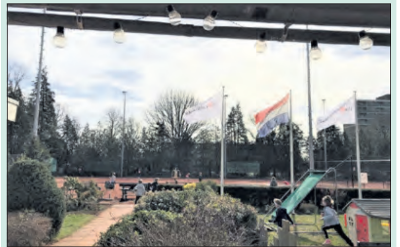
Leeg terras, maar volle velden bij de opening van het jeugdseizoen.