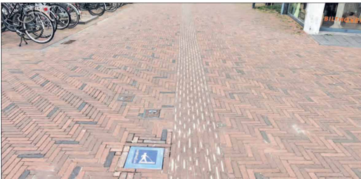
In Bilthoven begint de blindengeleide-strook bij de Julianalaan ter hoogte van de boekhandel.