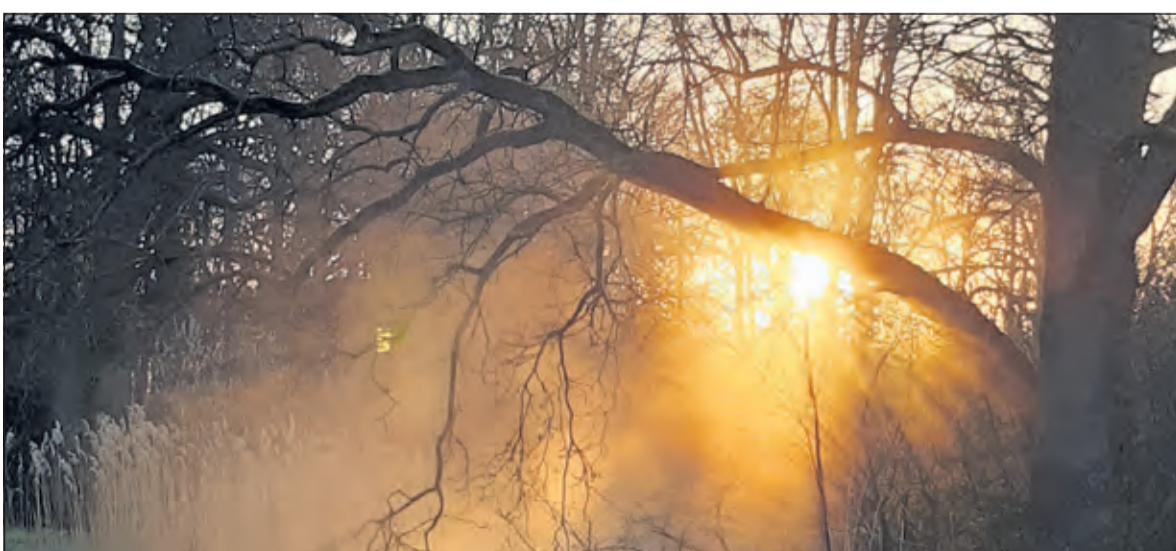
Tegenover landgoed Beerschoten piept de zon op vrijdagmorgen 2 april tussen de bomen door.