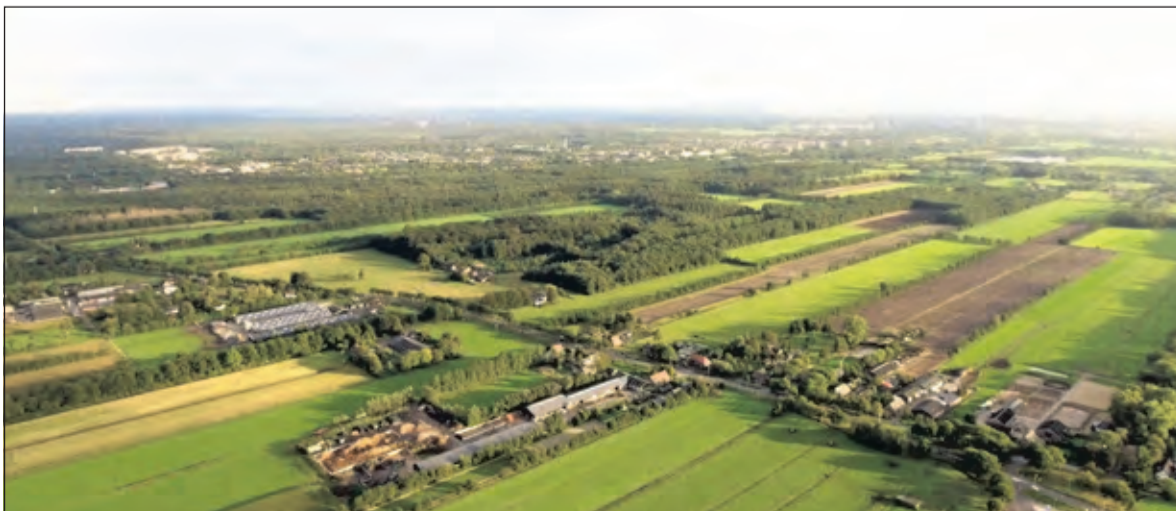
Een droneopname: onze gemeente gezien vanaf 240 meter hoogte.