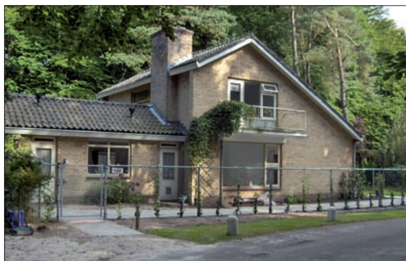
Op het terrein van verpleeghuis St. Elisabeth wordt de laatste hand gelegd aan 'Boshuis Buitenhof'.

Het steunpunt Mantelzorg van SWO De Zes Kernen De Bilt organiseert, in samenwerking met Indigo, voorlichtingsbijeenkomsten over dementie, bedoeld voor familieleden en partners van mensen met dementie. Ook de dementerende partner of ouder is van harte welkom! Naast informatie krijgt u uitgebreid de mogelijkheid om met de andere gasten van gedachten te wisselen. Alle bijeenkomsten zijn van 17.30 uur tot 20.00 uur. Er wordt om 17.30 uur gestart met een eenvoudige broodmaaltijd. Om 18.00 uur begint het inhoudelijke gedeelte. Het thema van de eerste bijeenkomst is 'Omgaan met moeilijk gedrag'. In de omgang met uw dementerende partner of ouder komt u wel eens voor moeilijk gedrag te staan. Bijvoorbeeld als de dementerende agressief of onrustig wordt. Hoe ga je daar dan mee om? De bijeenkomst is dinsdag 7 oktober 2008 van 17.30 tot 20.00 uur in de Maartensdijkse vestiging van SWO aan het Maartensplein 96, te Maartensdijk. De kosten bedragen 4,6 euro (incl. broodmaaltijd). U kunt zich vóór 30 september 2008 aanmelden bij het Steunpunt Mantelzorg De Bilt tel.nr. 030 2203490 of bij SWO-vestiging Maartensdijk. Dit kan ook per e-mail: mantelzorg@swodebilt.nl . Aanmelding is gewenst i.v.m. broodmaaltijd. De volgende bijeenkomsten zijn: Dinsdag 4 november en dinsdag 2 december a.s.