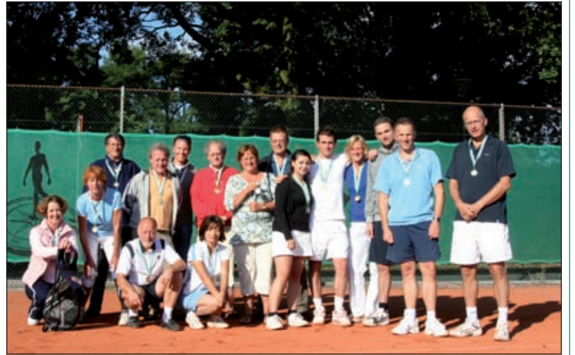
Van 6 t/m 14 september jl. werden bij tennisvereniging Hollandsche Rading de jaarlijkse clubkampioenschappen voor senioren georganiseerd. In totaal streden ruim 50 deelnemers om de diverse titels. Ondanks een aantal 'regendagen' konden de finales op zondag worden afgewerkt onder prima omstandigheden. Op de foto een groot deel van de prijswinnaars.