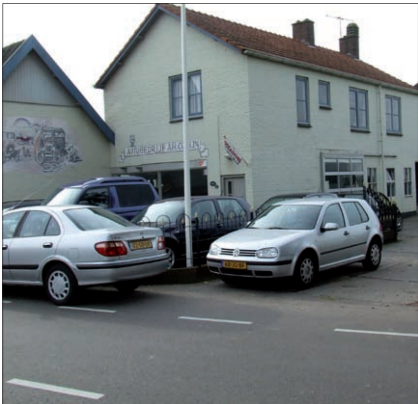
Garagebedrijf Colijn dreigt door de afsluiting klanten te verliezen.

Wethouder Ditewig deelt mee dat het college, voor het verkeersbesluit in werking treedt, voor de ondernemers een oplossing gevonden wil hebben.