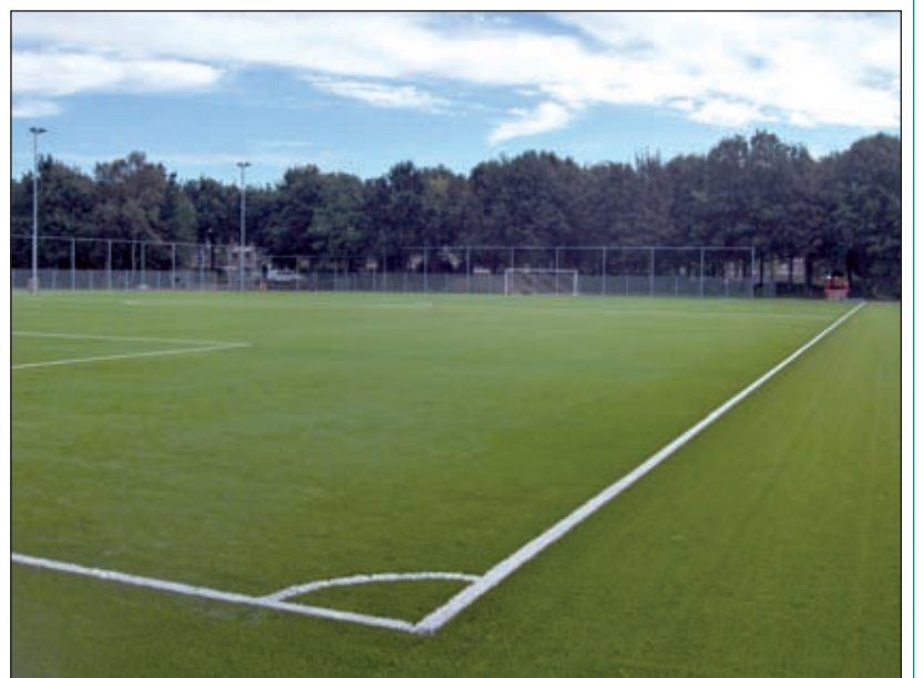
Alhoewel er vanwege veldentekort al verschillende voetbalwedstrijden op zijn gespeeld zal wethouder Herman Mittendorff a.s. zaterdag 2 september om 13:00 uur de officiële opening van het kunstgrasveld van de Maartensdijkse voetbalvereniging SVM aan de Dierenriem verrichten. Hier aansluitend zullen er enkele jeugdwedstrijden gespeeld worden en om 14:00 uur speelt het hoogste jeugdteam (A1) de competitiewedstrijd tegen Hoograven A1.