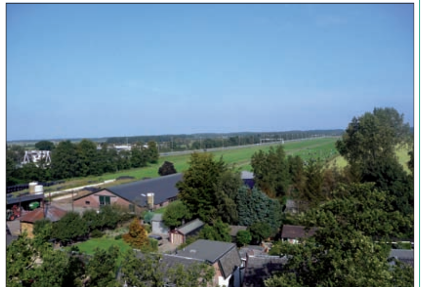
Door alle bomen lijkt het dorp Maartensdijk van bovenaf op een compleet bos.

Afgelopen zaterdag was er ook een grote verkoping bij de Hersteld Hervormde Kerk in Maartensdijk. Er waren zowel binnen als buiten veel kramen waar mooie spullen verkocht werden. Horloges, fietsen, kleding, hoeden en heel veel boeken. Ook was er genoeg voor de inwendige mens: patat, ijs, vis, fruit, noten, snoep en vis. Het was mogelijk om onder deskundige begeleiding de gemeentelijke toren van de kerk te beklimmen.