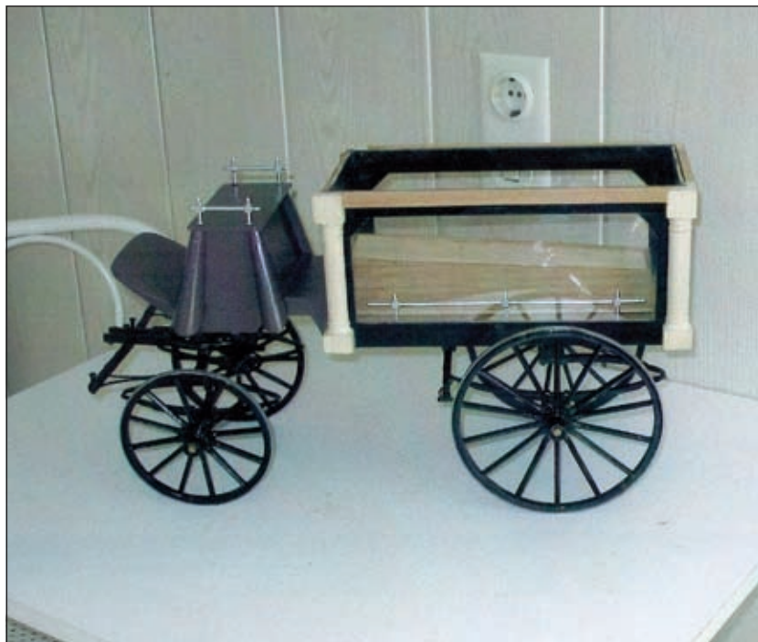
Het nog niet voltooide model.

ken van de koets zijn bekroond met zilverkleurige engeltjes. De koetsier ment de paarden met zwarte leidsels