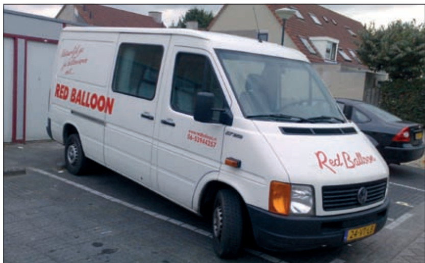
De Volkswagen LT waaruit de ballon gestolen werd.