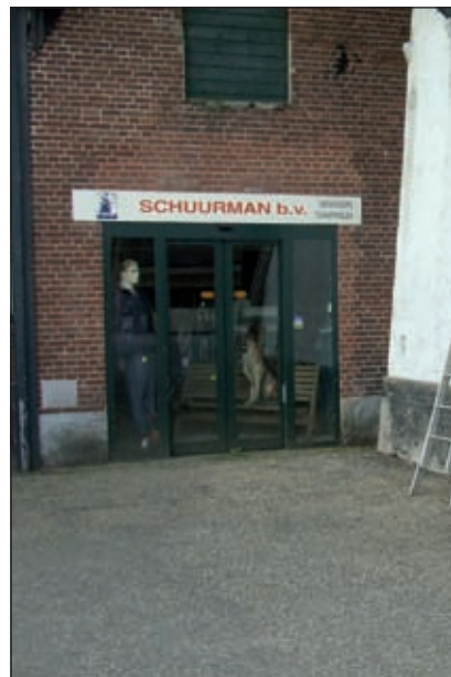
Schuurman b.v. voor diervoeders en tuinartikelen bij molen De Kraai.