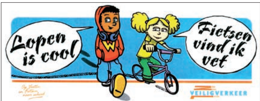
De actie 'Op Voeten en Fietsen naar school' is een oproep aan ouders de auto te laten staan en hun kind te voet of op de fiets naar school te brengen.

De actie 'Op Voeten en Fietsen naar school' is een oproep aan ouders de auto te laten staan en hun kind voortaan te voet of op de fiets naar school te brengen. Af en aan rijdende auto's zorgen voor verkeersonveilige situaties rond de school. Hoe meer ouders de auto laten staan, des te veiliger de schoolomgeving wordt. Door de schoolroute en schoolomgeving veiliger te maken, kunnen kinderen meer fietservaring opdoen. En dat is, zoals het onderzoek laat zien, hard nodig.