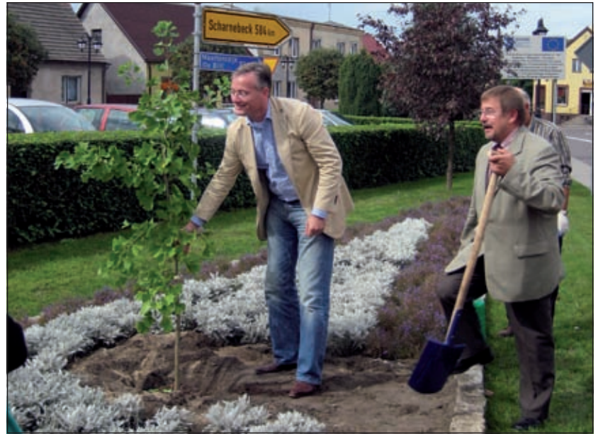
Beide burgemeesters hebben tegenover het gemeentehuis van Miescisko een boom geplant.

'Maar waar het vooral om ging was de St. Michaelsmarkt die nu voor de dertigste keer werd gehouden en