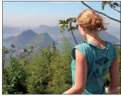
Prachtige natuur, mooie stranden maar ook armoede, knokkelkoorts en kinderen die naar aandacht en liefde verlangen.