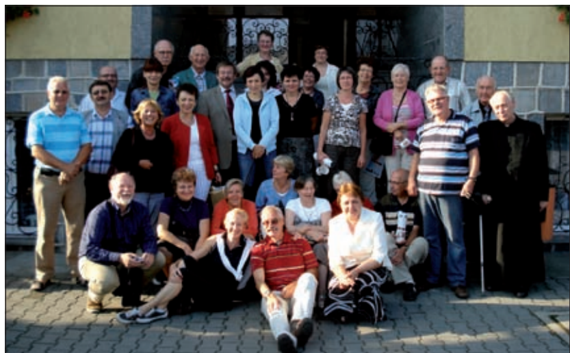
Vorige week dinsdag is het gezelschap teruggekeerd dat voor de dertigste maal een bezoek bracht aan de Biltse zuster gemeente Miescisko in Polen.