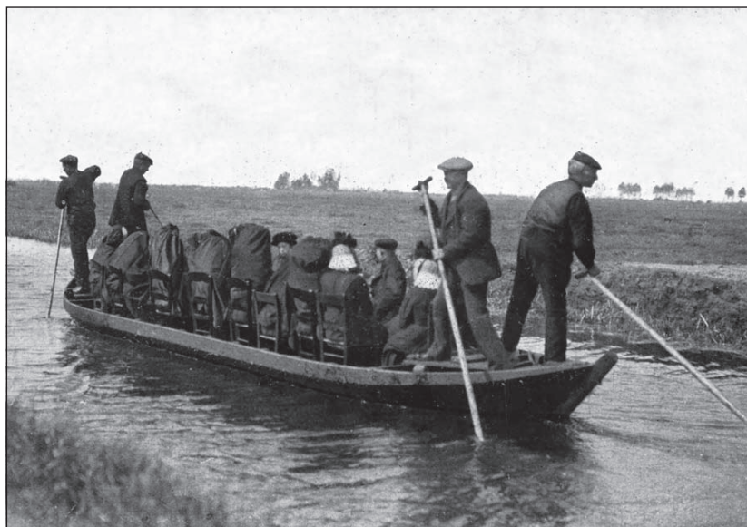
Foto van een uit-'vaart' per punter in Giethoorn.

en een zwarte zweep. De paarden zijn omhangen met zwarte kleden waarbij hoofd, hals en romp bedekt