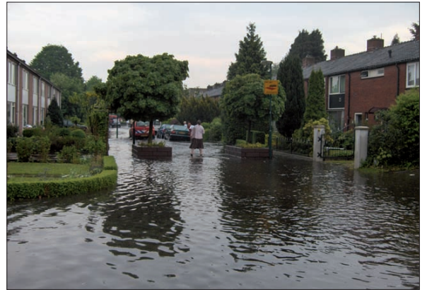
Soms is een regenbui zo heftig dat overstroming het resultaat is, maar bij een normale regenbui moet het water goed afgevoerd kunnen worden. In Maartensdijk is dat niet overal het geval, zoals deze foto van mei 2008 aantoont.

Voor de hoofdingang van Dijkstate, langs het lage muurtje aan de rand van de verzonken parkeerruimte, zijn