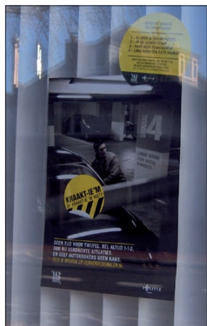
Via onder andere buitenreclame, radiospots en een campagnewebsite zet de campagne aan om niet te twijfelen, maar bij verdacht gedrag direct 1-1-2 te bellen. Na lang zoeken vonden wij alleen maar deze affiche in de 'etalage' van het politiebureau aan de Hessenweg in De Bilt.

• Iemand komt een paar keer terug naar een auto. • Er hangt iemand verdacht lang rond bij een of meer auto's. • Iemand gluurt in auto's. Hangt er soms zelf tegen aan. Kortom: Je ziet iemand staan bij een auto. Je voelt dat er iets niet klopt. Volg dan je intuïtie. Bel direct 1-1-2 want ook bij verdachte situaties komt de politie direct in actie.