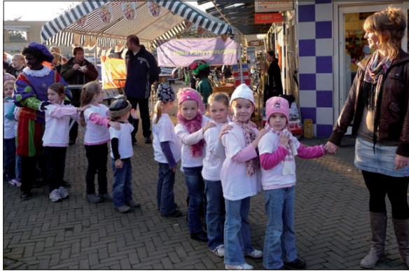
Op een mooi versierd podium dansten meiden van Gymma: de allerkleinsten, maar ook de selectiegroep en de meiden van de Twirlafdeling.

De gehele zaterdagmiddag was het feest op het Maartensplein. Veel Pieten deelden lekkers uit en op een mooi versierd podium dansten meiden van Gymma: de allerkleinsten, maar ook de selectiegroep en de meiden van de Twirlafdeling. De Brandweer moest oproepen worden om enige Pie-