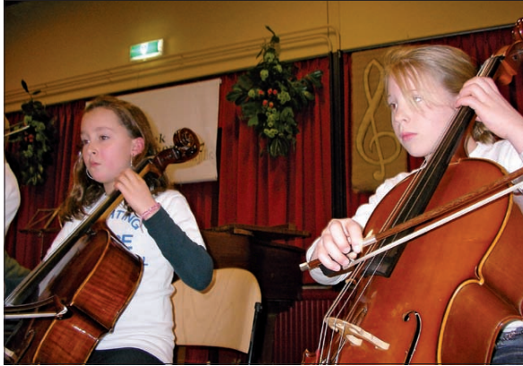
Een optreden uit een vorige jaargang.

De Muziek Marathon Maartensdijk wordt mede mogelijk gemaakt dankzij een bijdrage van diverse sponsors. Ook de gemeente De Bilt maakte dit door een speciale financiële bijdrage mogelijk. In de pauze tijdens