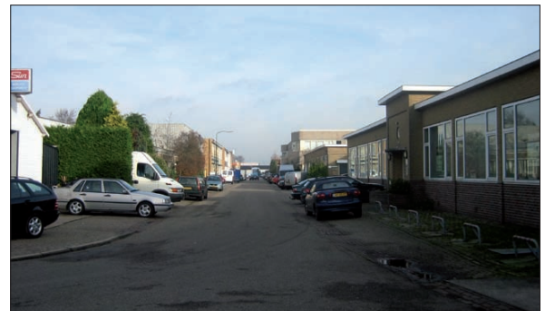
Inmiddels blijkt dat het plan tot verbetering van het industrierrein Maartensdijk al vijf jaar geleden door de provincie in overleg met de gemeente De Bilt is bekeken en opgezet, maar nooit is afgerond. Het plan heeft vijf jaar stil gelegen.

gemeente De Bilt gevraagd het plan af te maken. Uit informatie van het projectbureau op het gemeentehuis blijkt eerst dat dit plan inderdaad zal worden opgepakt maar dat nog niet is besloten wie er aan gaat werken. Bij verder navraag komt de mededeling dat er inmiddels een financieringsvoorstel is opgezet waarvoor door B en W nog een beslissing moet worden genomen. Naast de provincie moet de gemeente namelijk mee betalen. Na goedkeuring van het ontwikkelde voorstel zal via De Kring Ondernemers Maartensdijk (KOM) overleg worden gepleegd met de bedrijven in Maartensdijk. De verwachting is nu dat het parkmanagementplan in 2010 zal worden uitgevoerd.