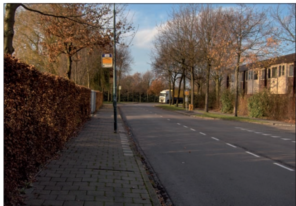
Bij het Groenhorstcollege aan de Dierenriem staan al twee bushaltes. Om de leerlingen uit Utrecht komend een 'ronde Maartensdijk te besparen, wordt geplleid voor een uitstaphalte bijv. onder het viaduct met de A27

Belangrijkste bron van geluid in het dorp is de A27. Het geluidsscherm aan de oostzijde van de weg is in 1982 of daaromtrent geplaatst en is maar in beperkte mate effectief. Het scherm is ter hoogte van het viaduct te laag en het is aan de zuidzijde te kort, waardoor bij zuidwestenwind - de meest voorkomende windrichting - het dorp door het A27 geluid wordt overspoeld. Het scherm is eigendom van de gemeente De Bilt, maar is sterk in verval geraakt. Er bestaan daarnaast allerlei verbredingsplannen. Wanneer die verbreding resulteert in 2 x 4 rijstroken dan zal het huidige scherm waarschijnlijk niet gehandhaafd kunnen blijven en is er een goede gelegenheid een nieuw en beter scherm te realiseren en het eigendom en de onderhoudsplicht bij Rijkswaterstaat te leggen.