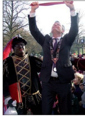
De burgemeester moet met een paar oefeningen bewijzen dat ook hij sportief is.

bestemming voor gezocht wordt heeft hij wel een idee. 'Ik kan de ruimte heel goed gebruiken om pakjes op te slaan.' [GG]