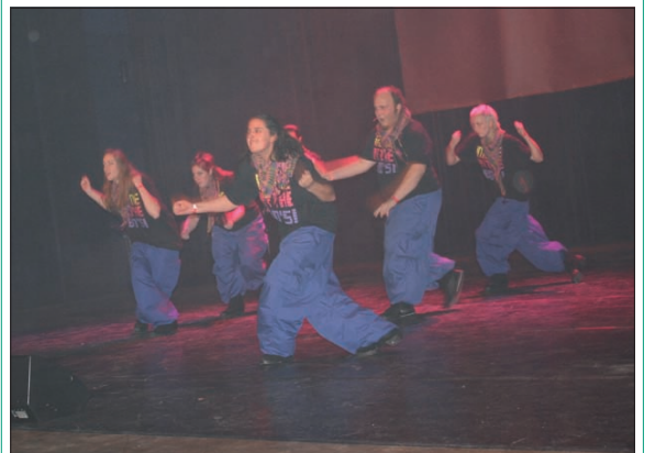
Afgelopen zondag deden maar liefst 9 teams van Femtastic mee aan de danswedstrijd 'Shell we Dance' in Oosterwijk. Dare 2B Diferent behaalde 's ochtends en 's middags de 3e prijs in categorie 4, niveau B.