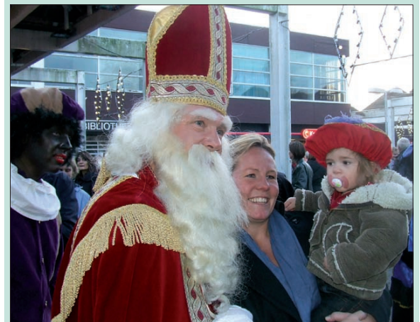
Ook in De Kwinkelier in Bilthoven liet Sinterklaas zich door enthousiaste kinderen verwelkomen.