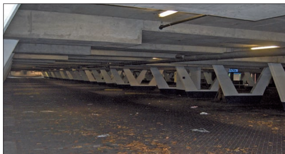
Hier hoeft de vraag 'kraakt-ie 'm of kraakt-ie 'm niet' deze dag niet gesteld te worden?