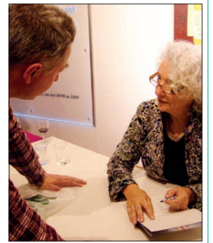
Een onderonsje met lezer en schrijfster.