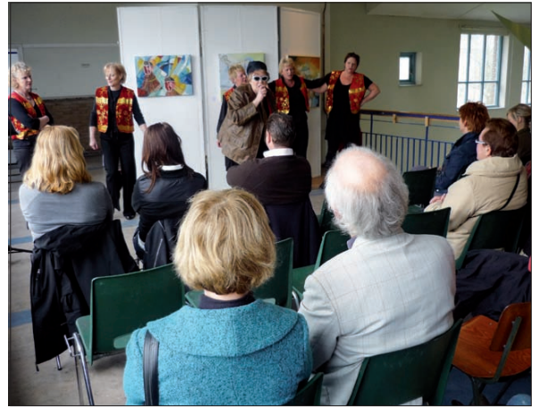
In maart 2009 werd er ook geglurd in/bij de buurt.

in de kosten. Gehoopt wordt dat het 13 en 14 maart 2010 weer een groot feest wordt met vele soorten muziek, optredens en veel kijkplezier. Geef u op als uw huis geschikt is om gasten te ontvangen en optredens te verzorgen of door zelf op te treden. Om te zien hoe het vorig jaar was: ga naar website www.glurenbijdeburens.punt.nl Wat betreft beeldende kunst zijn er al teveel aanmeldingen en is er voor een enkeling nog slechts plaats. De sluitingsdatum voor aanmelding is 31 december 2009.