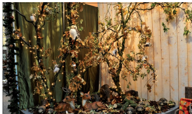
Bij de kerstshow bij GroenRijk Hollandsche Rading speelt de nieuwe herfst-trend in op de behoefte van mensen aan licht in donkere dagen. De herfstachtige tafereelen met uilen, hertjes en rendieren kunnen zonder enig schuldgevoel al in november worden toegepast. [AvZ]