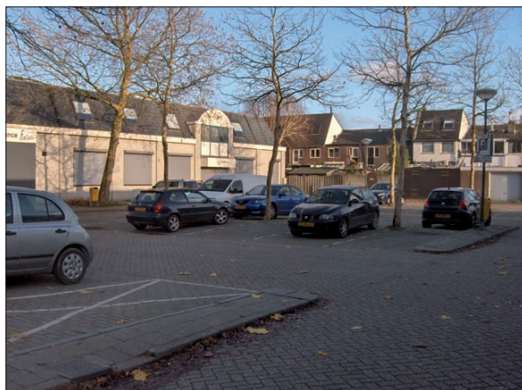
Om daders van autokraken op te sporen worden burgers opgeroepen om ook al bij verdachte situaties 1-1-2 te bellen. Vooral bij goede 'uitkijkmogelijkheden' is die hulp essentieel.

De signalen die ook op de campagnewebsite www.herkendesignalen.nl .