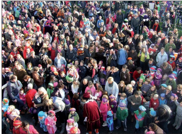
De vele toegestroomde kinderen zingen de Sint luid toe.