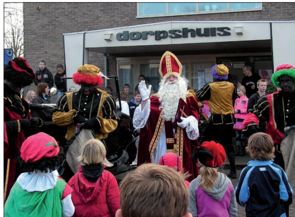
Sint arriveert bij het Dorpshuis van Westbroek.

Deze keer kwam de Sint niet zoals vorig jaar per koets maar in een prachtige oude Ford, bestuurd door de auto-Piet. Het paard had een dagje rust gekregen liet hij de kinderen en hun ouders weten. Opmerkelijk is trouwens dat steeds meer kinderen zich bij de intocht verkleeden als zwarte Piet. Nou ja, lang niet altijd