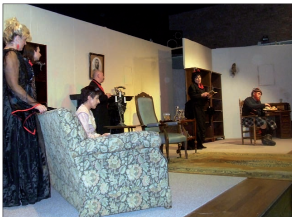
Een scène uit 'Het blijft in de familie'.

'Het blijft in de familie' speelt zich af op het familielandgoed Monument House waar de misdadige notaris Mortimer Crayle en zijn secretaresse Zoe Mapleton de laatst overgebleven leden van de familie Tomb uitnodigen om over de verdeling van hun erfenis te praten. Crayle is er echter op uit het landgoed zelf in zijn bezit te krijgen. Daarvoor moeten wel alle rechthebbenden uit de weg worden geruimd. De manier waarop, met gifdrankjes, verdwijningen en mysterieuze sterfgevallen, zorgt voor veel spanning, humor en een verrassende ontknoping.