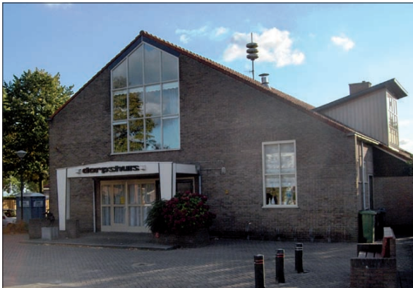
Zaterdag 28 november 2009 is het vijftig jaar geleden, dat het dorpshuis van Westbroek aan de Prinses Christinastraat werd geopend.