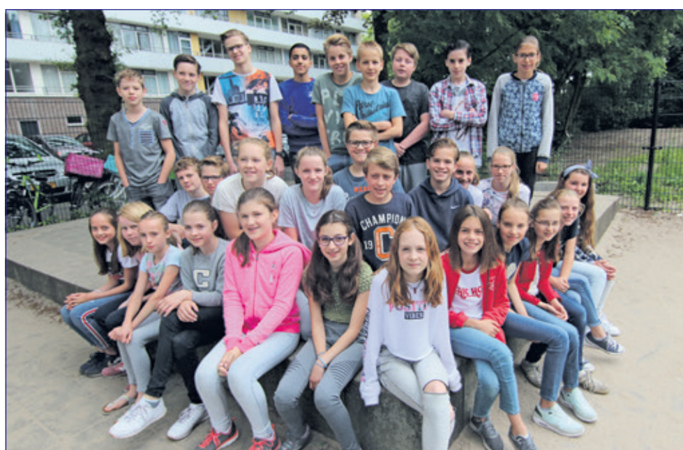
Groep 8B - Julianaschool