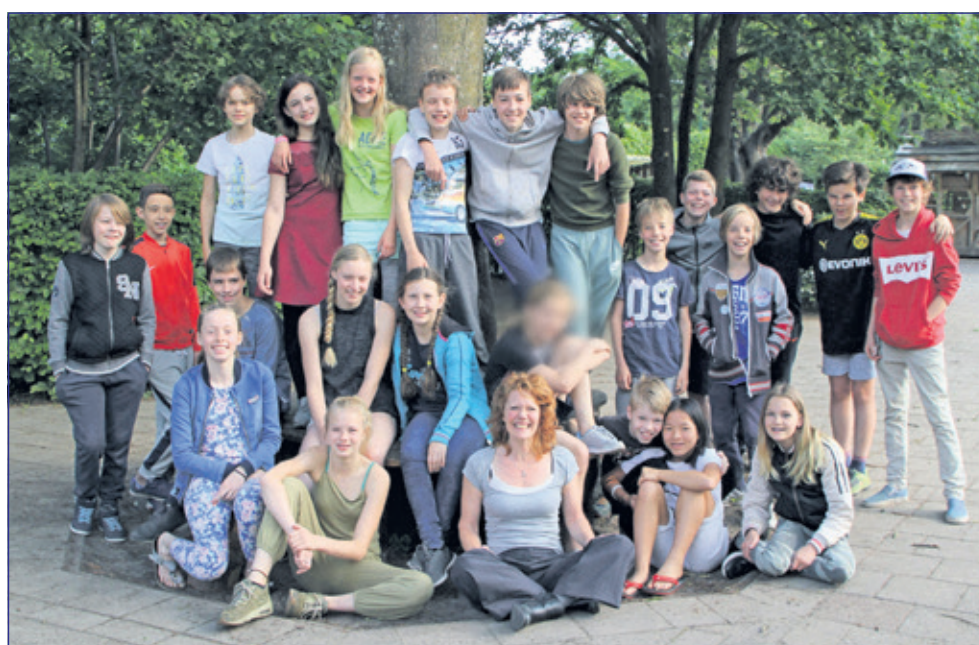
Groep 8 - Het Zonnewiel