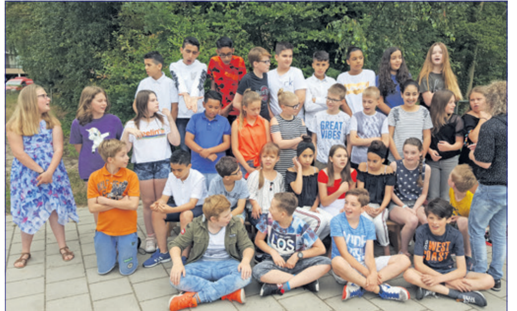
Groep 8 - Wereldwijs