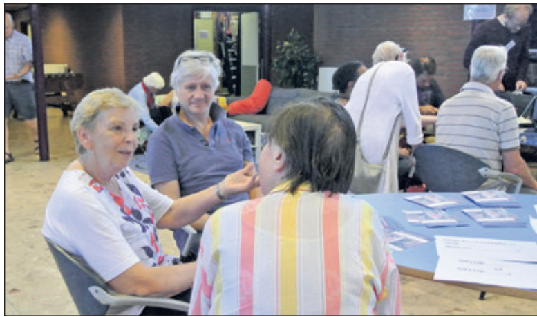
Medewerkers van Buurtbemiddeling in gesprek met een belangstellende.

Zaterdag 30 juni was het weer druk in het WVT-gebouw aan de Bilthovense Talinglaan. Er was ook de mogelijkheid om kennis te maken met Buurtbemiddeling. Buurtbemiddeling zet zich in om verstoorde relaties tussen burens te repareren. Het was een mooi initiatief om deze sessie in het Repair Café te houden. (Frans Poot)