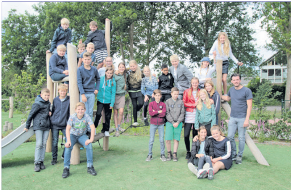
Groep 8 - Nijepoort