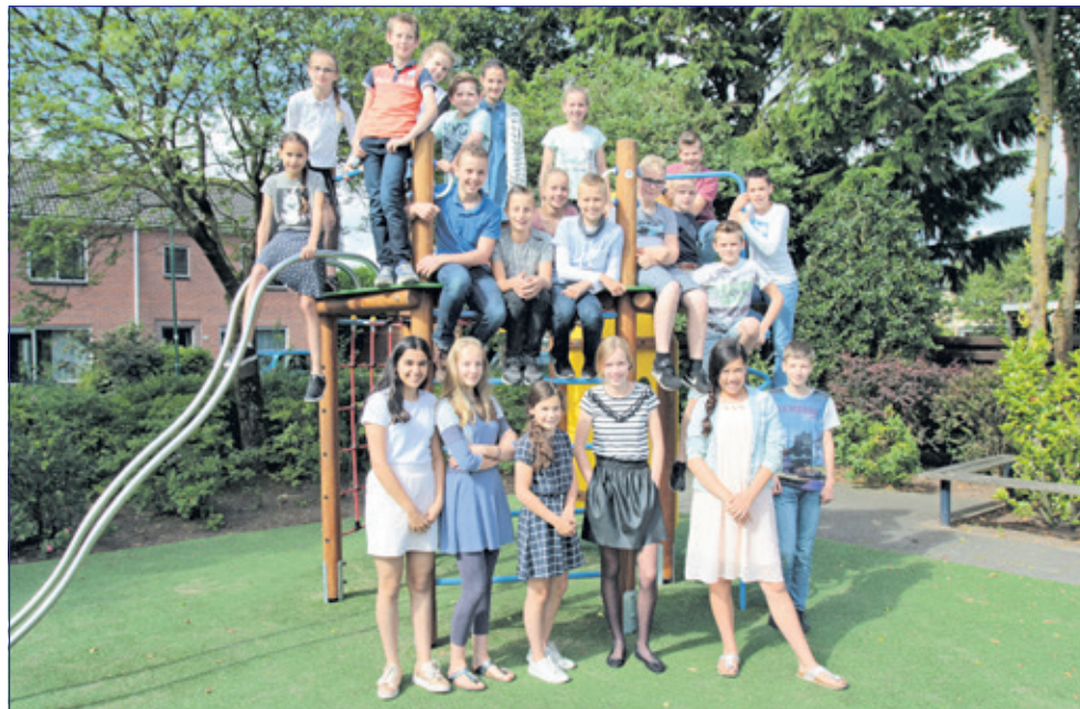
Groep 8 - School met de Bijbel