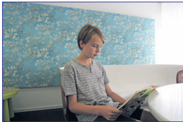
In de wachtkamer bij de tandarts, op zijn gemak, wacht de brugklasser totdat hij aan de beurt is.