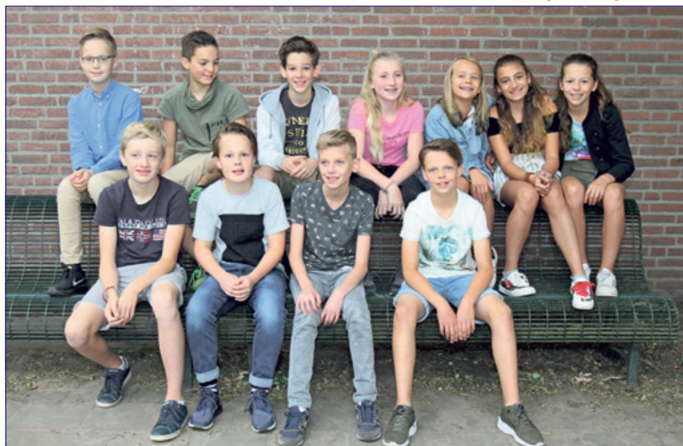
Groep 8 - Bosbergschool