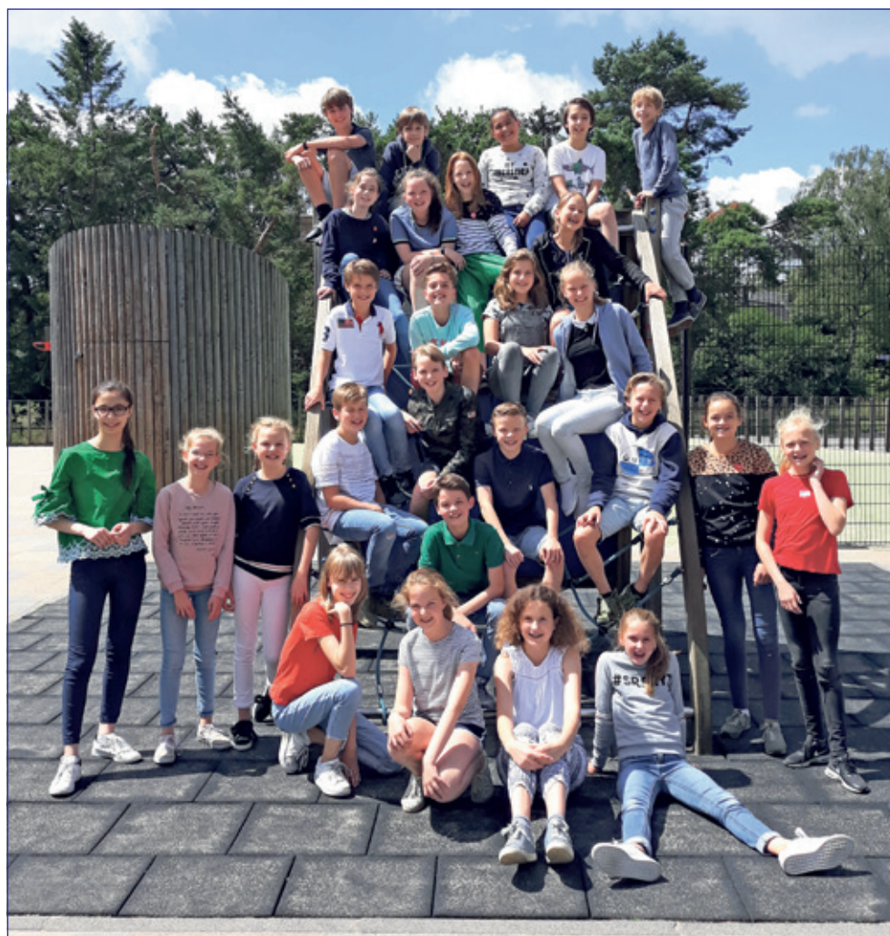
Groep 8B - St. Theresiaschool