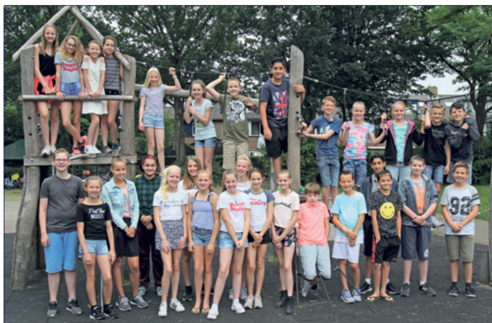
Groep 8 - Martin Luther Kingschool