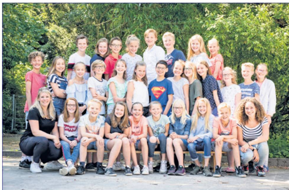
Groep 8 - Michaëlschool