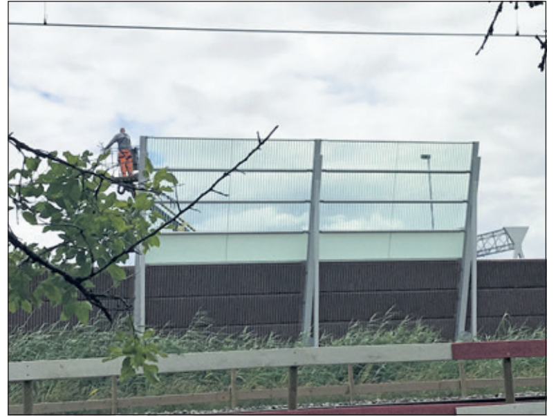
Het scherm wordt geplaatst achter het huis van Tonny.