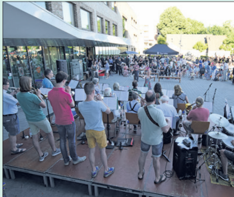
Vrijdag 29 juni gaven De Lichtruim Big Band en de KBH een spetterend openlucht concert, op het Planetenplein voor Het Lichtruim in De Bilt. Eten, drinken en muziek zorgden voor een swingend begin van de zomer. 'Het begin van een traditie', aldus Martin de Boer van Het Kunstenhuis.