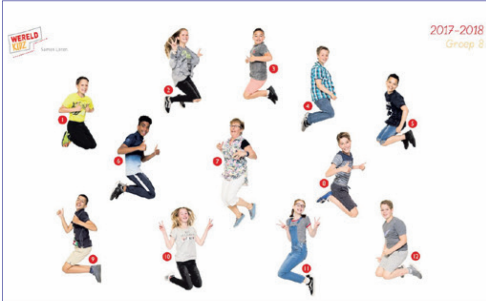
Groep 8 - Kievitschool