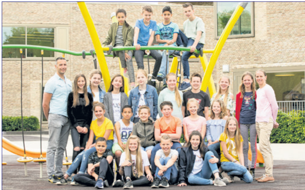
Groep 8 - De Regenboog