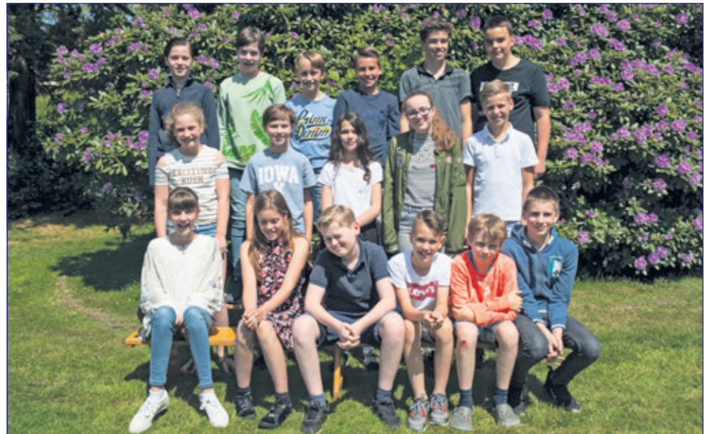
Groep 8 - Montessorischool