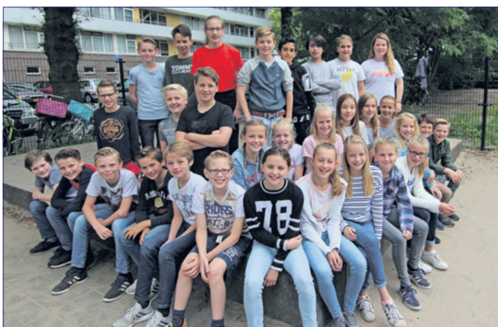
Groep 8A - Julianaschool