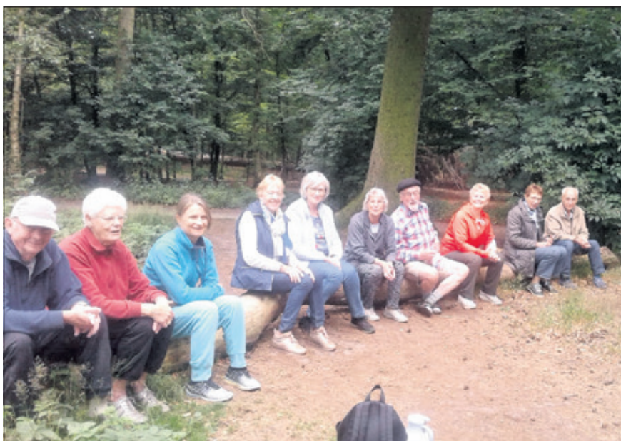
De laatste yogales van het seizoen in het bos.