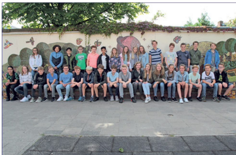
Groep 8 - Groen van Prinstererschool