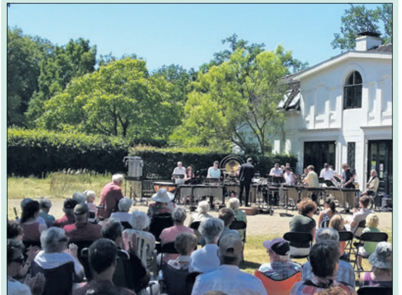
Zomerconcert op Beerschoten treft stralend weer.

Onder een strakblauwe hemel vond afgelopen zondagmiddag het tweede van de reeks Zomerconcerten bij Beerschoten plaats. Musici moesten hun bladmuziek goed vasthouden vanwege de stevige, maar verkoelende wind.