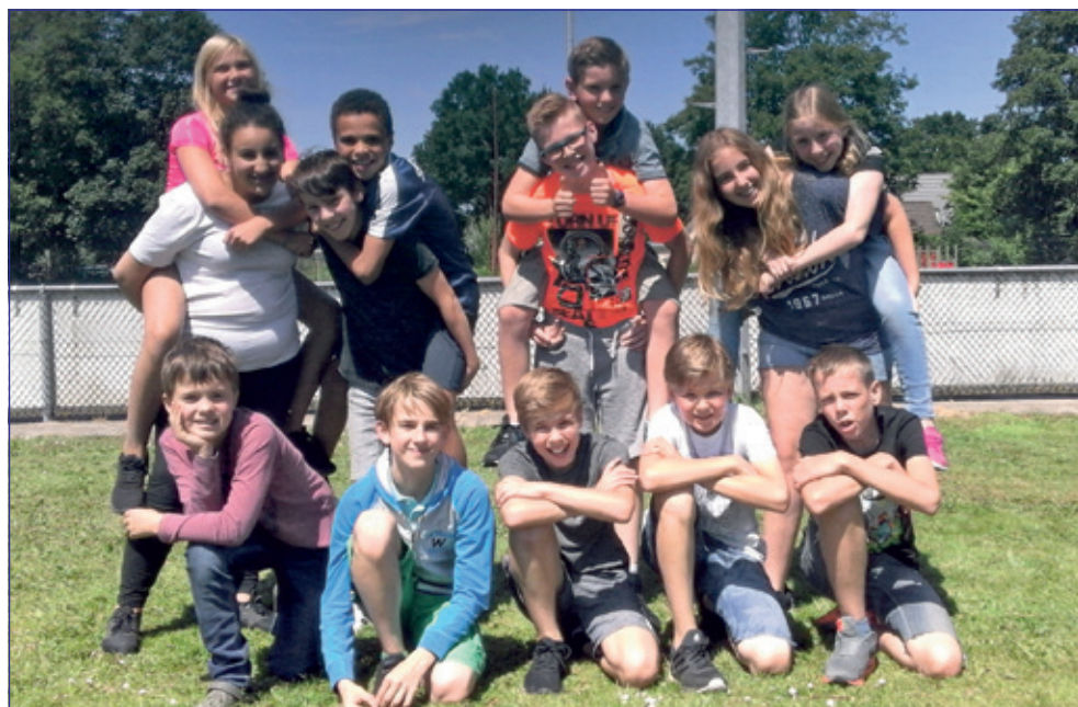
Groep 8 - 't Kompas