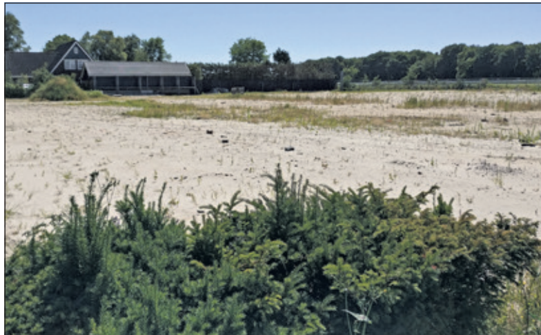
De ontwikkeling van het voormalige Groenrijkerrein komt dichterbij.

Het ontwerpbestemmingsplan bestaat uit een toelichting, planregels, verbeelding en bijlagen en kan met de daarbij behorende stukken digitaal worden ingezien op de landelijke voorziening http://www.ruimtelijkeplannen.nl . (Het planidentificatienummer is: NL.IMRO.0310.17003BP0002-ON01.)