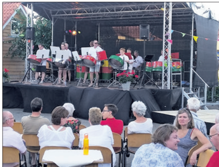
Westbroeks podium voor muziekverenigingen.

Daarnaast speelde Steelband Tavenu uit De Kwakel, bestaande uit een verzameling gestemde olievaten, aangevuld met percussie, de sterren van de hemel. Bij wijze van spreken, want de zon straalde net zo lustig als in Trinidad, het land waar deze muziekstijl vandaan komt. Afgesloten werd met De Vechtbloazers uit Weesp, waarna deze gezellige dag werd beëindigd met een afterparty. (Peter Schlamilch)