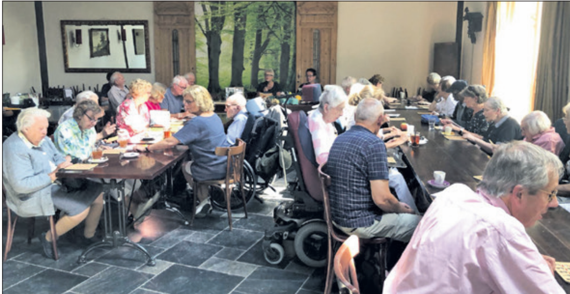
Ruim 40 personen bezoeken de inloopmiddag in Lage Vuursche.