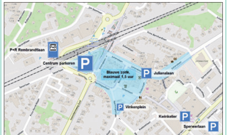
Zone maximaal 1,5 uur parkeren in Bilthoven.

Het gaat om de locaties in het centrum van Bilthoven: Driehoek en Emmaplein (Centrum parkeren), Vinkenplein, Vinkenlaan Nachtegaallaan en Julianalaan. Lang parkeren kan op P+R Rembrandtlaan, Kwinkelier en Sperwerlaan in de parkeergarage van de Kwinkelier en op het parkeerterrein aan de Sperwerlaan.