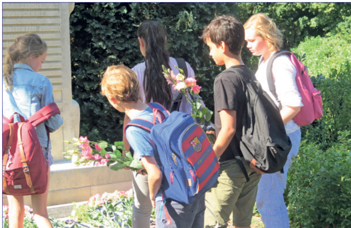
Leerlingen van de Groen van Prinstererschool leggen bloemen bij het monument.