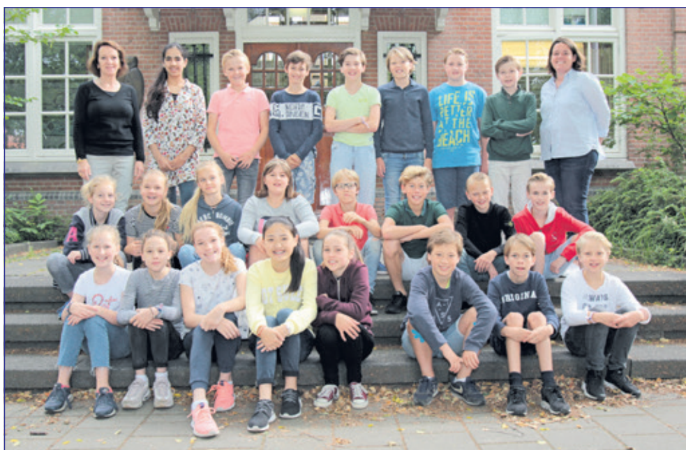
Groep 8 - Van Dijkschool