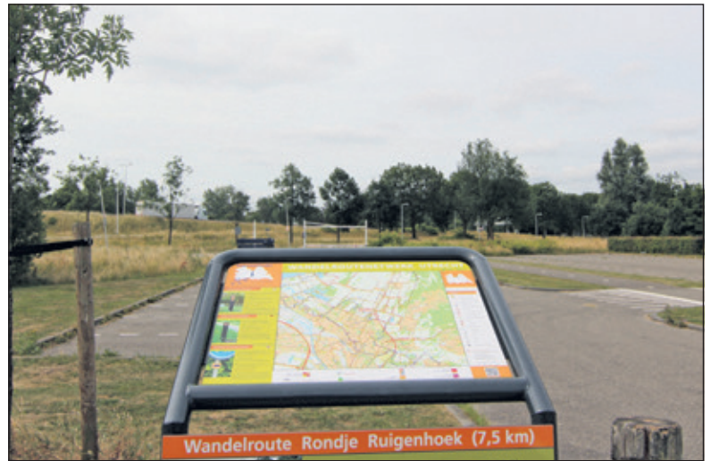
Het voorbije weekeinde was de belangstelling nog uiterst gering.

In 2018 is er speciale aandacht voor het erfgoed. Om het belang van ons cultureel erfgoed én het behoud ervan te benadrukken, heeft de Europese Commissie 2018 uitgeroepen tot het Europese Jaar van het Cultureel Erfgoed. Gedurende dit thema-jaar vinden er allerlei activiteiten en evenementen plaats om zoveel mogelijk mensen, van alle leeftijden en achtergronden het Europees cultureel erfgoed te laten ontdekken en ervan te genieten. Elke maand staat er een nieuw thema centraal. In juni is het thema: verdedigingslijnen.