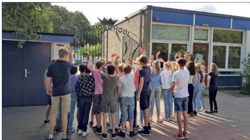
Groep 8 - Patioschool