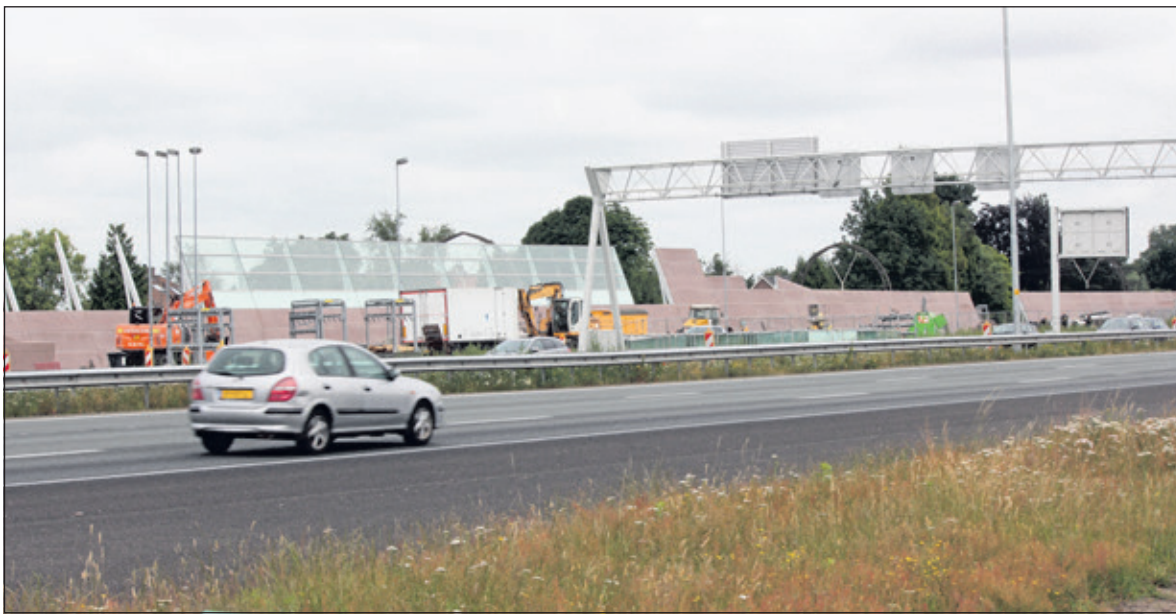
Schermen verzorgingsplaats Nijpoort in opbouw.