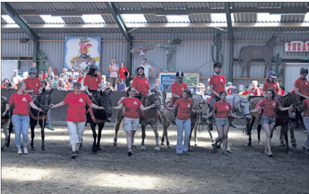
Ruiters en vrijwilligers showen hun kunsten en clowns brengen nog meer gezelligheid tijdens het jubileumfeest.