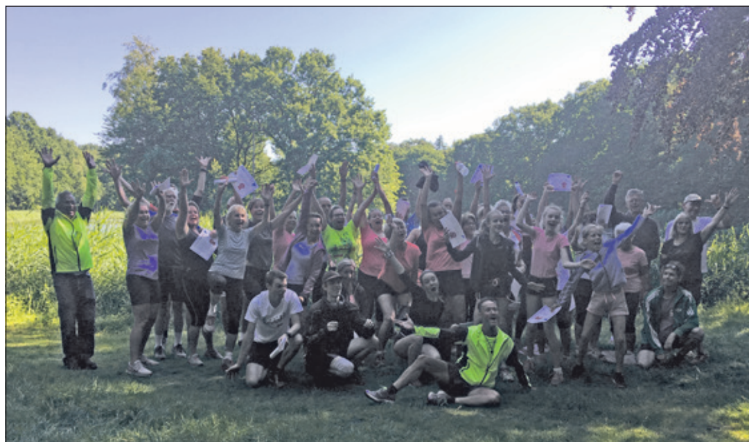
Na afloop worden de certificaten uitgedeeld.