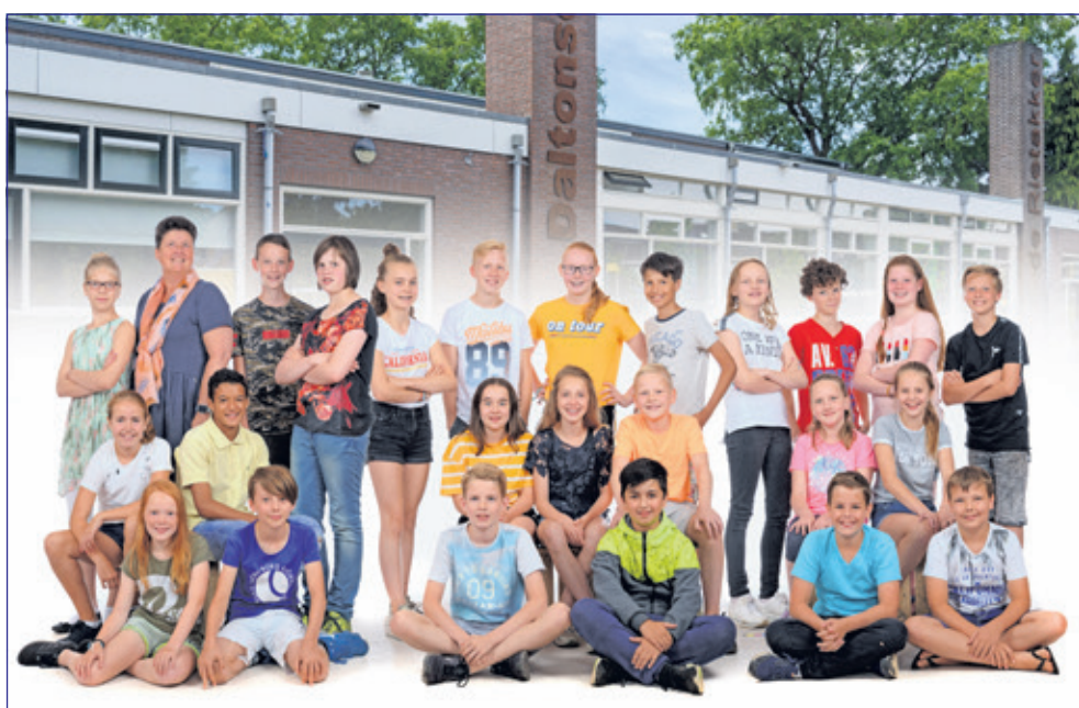
Groep 8 - De Rietakker