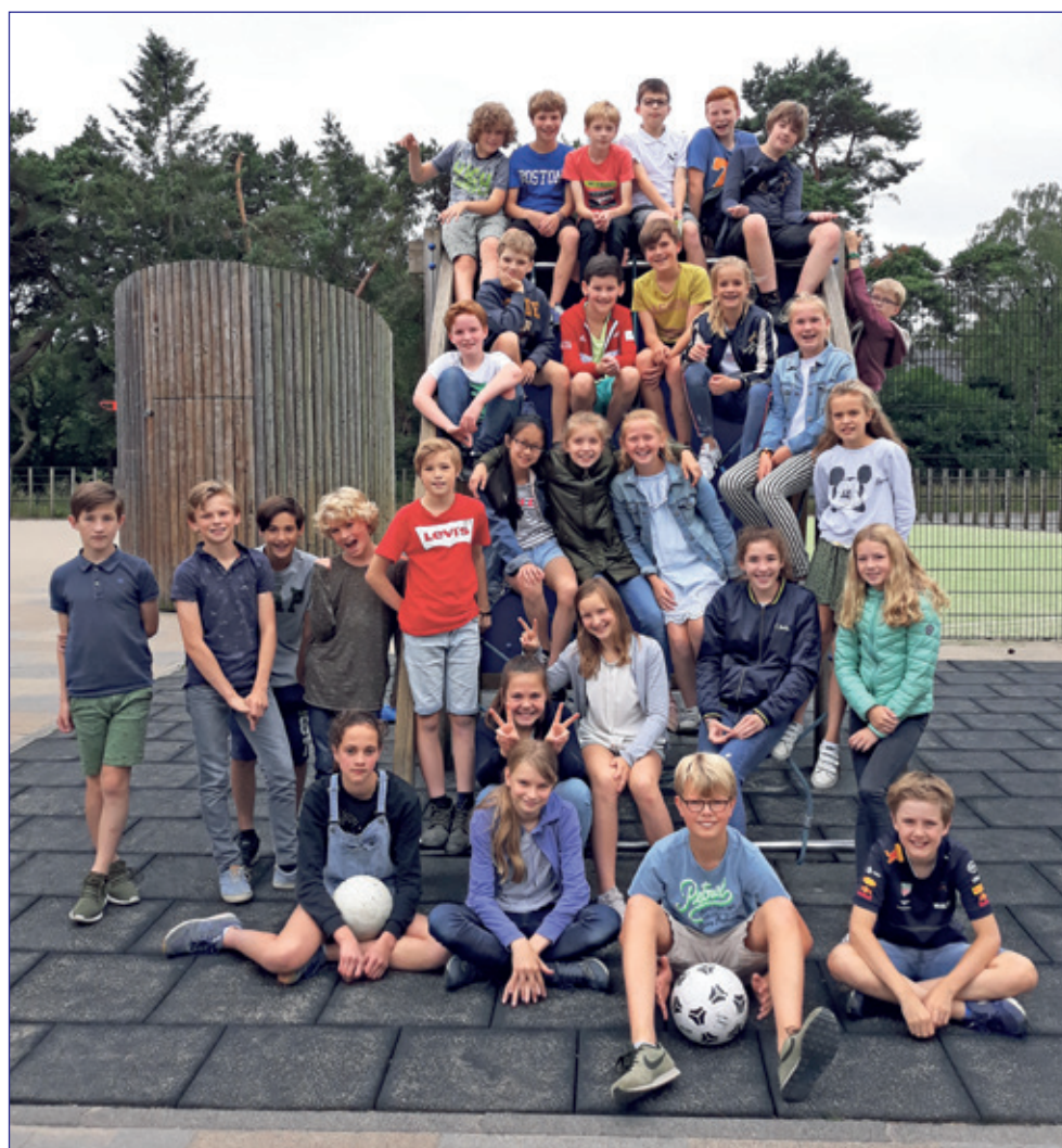
Groep 8A - St. Theresiaschool