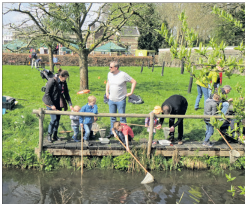
Op zoek naar waterdiertjes in de sloot.

Landgoed Oostbroek ligt verscholen achter het Prinses Maxima Centrum aan de Bunnikseweg 45a te De Bilt. Een oase van rust tussen drukke snelwegen en het stadsleven. De toegang is gratis. Ga bij voorkeur met de fiets. Parkeermogelijkheden zijn beperkt.