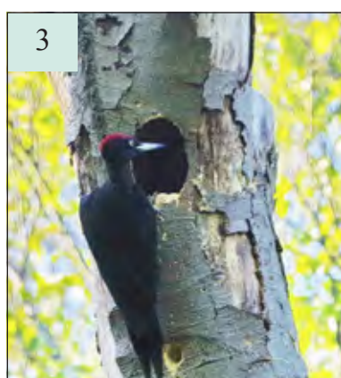
Het mannetje neemt de plaats weer in van het vrouwtje.