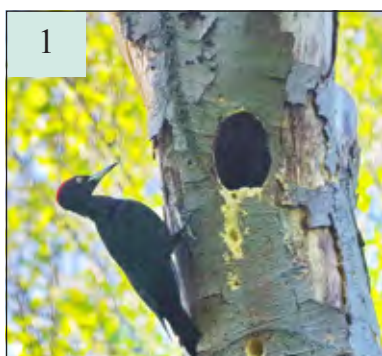
Het mannetje meldt zich bij het nest door enkele kreten te laten horen.

Eugène Jansen maakte in de Ridderoordse bossen op een afstand van circa 40 m van het nest vanuit een schuilplaats met een 450 mm lens deze foto's van zwarte spechten. Hij vertelt daarbij: ‘In deze periode van de lente kun je overal in onze bossen spechten zien broeden in een gat van voornamelijk dode beuken. De zwarte specht heeft zich o.a. genesteld in de Ridderoordse bossen, in Beerschoten en in Beukenburg. Bij het uitbroeden van de eieren lossen het mannetje en vrouwtje elkaar om de 20-30 minuten af.