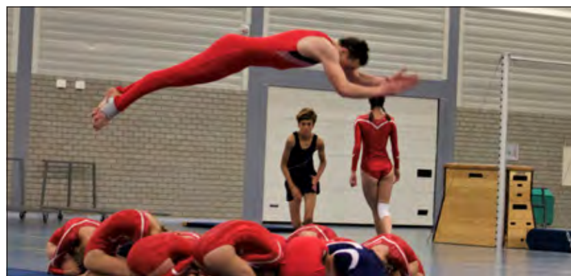
Een zweefsprong tijdens een uitvoering van de afdeling gymnastiek.

Inmiddels werd in 1972 de afdeling basketbal opgericht met een ledenaantal van 56 leden. De verwachting was dat in dat jaar het 1000e lid van de OMNI-vereniging kon worden ingeschreven. Dat liep toch anders. De afdeling basketbal is jaren opgeheven geweest en heeft geprobeerd terug te komen in 2013 met alleen jeugd. Helaas bleek de invulling van voldoende kader opnieuw problematisch en moest de afdeling het na 5 jaar opgeven.