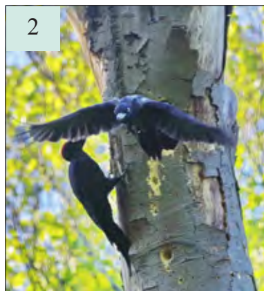
Het vrouwtje verlaat daarop het nest.