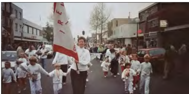
In de jaren 70 was de wandelafdeling actief. Hier als deelnemer aan een Avondvierdaagse in die periode in De Bilt

Ineke afrondend: 'Het was leuk om nog eens door het verleden te bladeren maar ik hoop dat in september de zaalsportverenigingen het seizoen weer kunnen opstarten'. Alle verenigingen hebben een eigen actuele website.