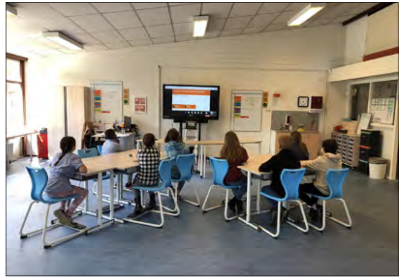
Leerlingen Wereldkidz De Kievit zitten er klaar voor.