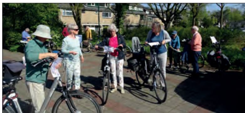
AZM leden bij de start van de fietstocht.

Wanneer de Korenbond en het RIVM het weer toestaan worden de repetities op de donderdagavond in de Vierstee hervat. Voor nieuwe leden is altijd een plek. Zij mogen de eerste 3 weken vrijblijvend meezingen en kunnen dan ervaren hoeveel plezier en ontspanning zingen geeft. Voor meer info en vragen over het koor: www.zangkoormaartensdijk.nl