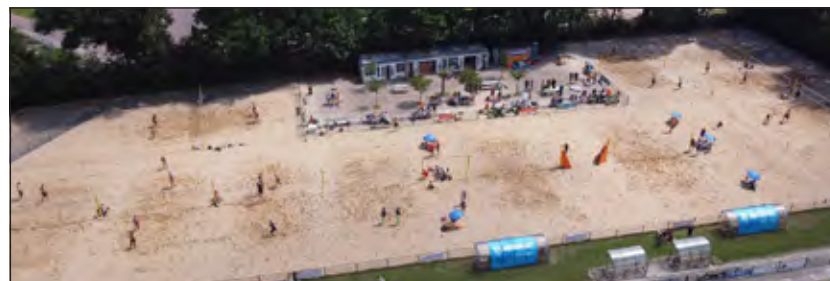
Luchtfoto van het Beachpark van Irene Beach in Bilthoven met 11 velden. Inmiddels beschikt Irene over 14 velden.