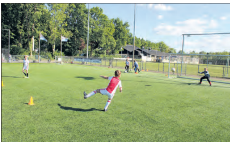
SVM heeft de jeugdtrainingen weer hervat.

'Als gemeente kiezen we nu voor een verantwoorde opstart om de kinderen weer veilig in beweging te krijgen' aldus Simon. 'Sportverenigingen binnen onze gemeente bieden hiervoor speciale 'Veilig Sporten'-activiteiten aan en plaatsen die op de website van Sjors Sportief van de gemeente De Bilt. Hier zullen nog veel activiteiten bij komen want als de verenigingen het veilig hebben geregeld met bestaande leden dan zijn ook niet-leden welkom. Zo houden wij als gemeente ook de controle op wat er allemaal (veilig) wordt aangeboden in onze gemeente en kunnen de kinderen veilig sporten.' Op de gemeentelijke website staat nog info over jeugdsport en Sjors Sportief.