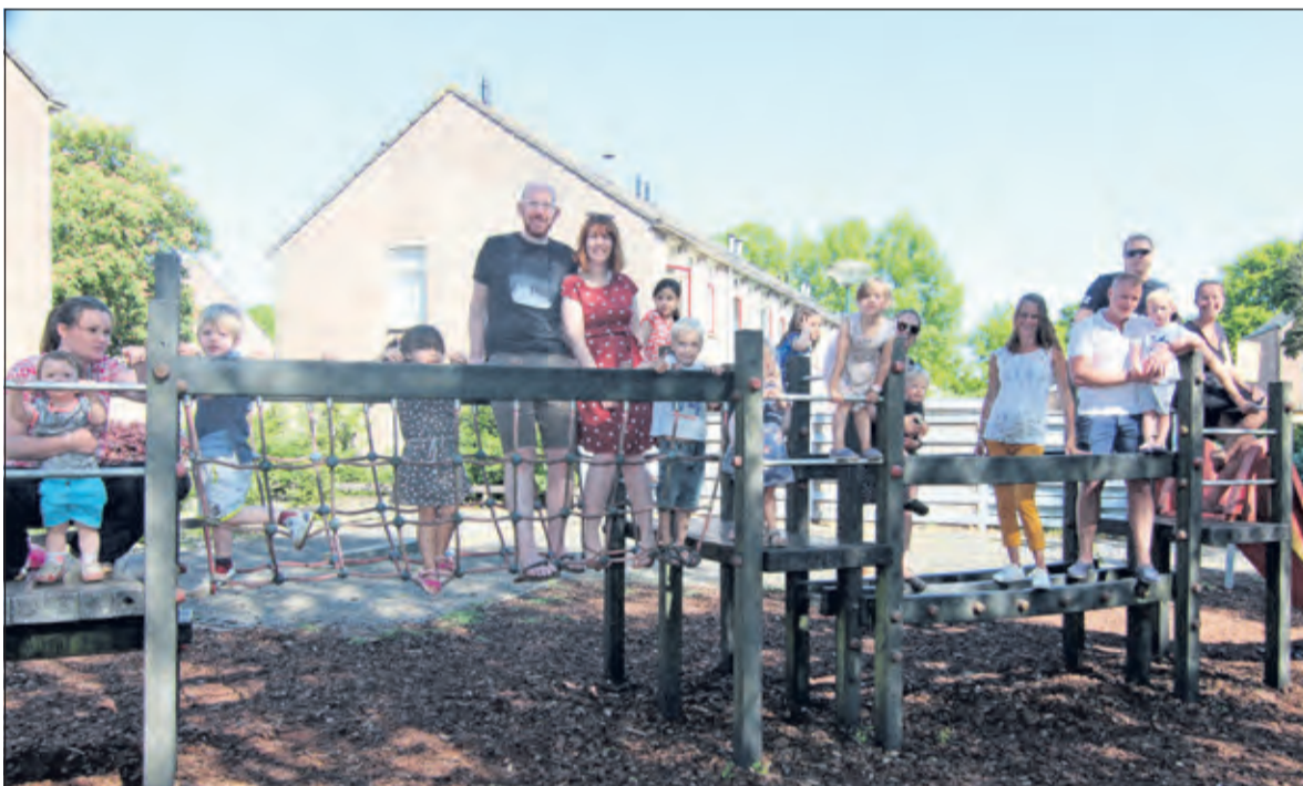
Iedereen zet zich in bij de inzamelactie voor een nieuwe speeltuin aan de Lindelaan in de Leijen.

Dorpsbewoners kunnen letterlijk een steentje bijdragen door aan de inzamelactie te doneren via http://www.speeltuinlindelaan.nl . Hier is ook meer informatie over de plannen te vinden. Geïnteresseerden kunnen de voortgang volgen via de Facebookpagina van het bewonerscomité: speeltuinlindelaan . Hijlkema tenslotte: 'Naast bewoners wordt ook lokale bedrijven gevraagd om een financiële bijdrage. Zo is het bijvoorbeeld mogelijk om een volledig speeltoestel te sponsoren. Het bewonerscomité zorgt voor een mooie vermelding van de bedrijfsnaam in de speeltuin en in verdere communicatie. Geïnteresseerde ondernemers kunnen voor meer informatie contact opnemen met de bewoners via info@speeltuinlindelaan.nl '.