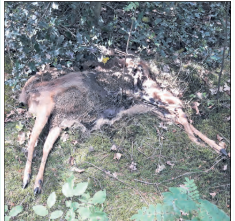
Onlangs werd een ree door honden doodgebeten.

Sommige wandelaars maken het helaas wel erg bont en reageren ronduit vijandig als ze op de aanlijnplicht wordt gewezen. 'Of de hond nu wel of niet jaagt, of de hond nu wel of niet gehoorzaam is, het is absoluut niet toegestaan dat honden op het landgoed loslopen. Men wordt dringend verzocht deze regel in acht te nemen', meldt de boswachter.