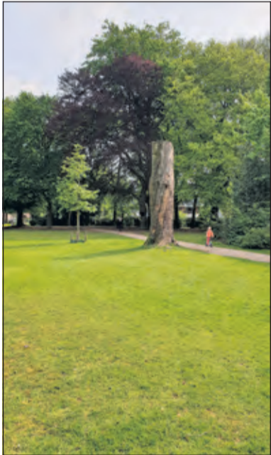
Een imposante beuk met iets verder een al even imposante stam van tien meter hoog.

Sven Gutker de Geus is initiatiefnemer van de vereniging in 1997. Als een gids enthousiasmeert hij zijn gehoor bij een rondleiding: 'Het park is in de jaren dertig van de vorige eeuw in de Engelse landschapsstijl aangelegd, onder supervisie van de firma Copijn, in de voortuin van de baron die op Sandwijck woonde. Jörn Copijn, boomchirurg en nazaat van de ontwerper, vertelde tien jaar geleden dat het park in goede conditie is en ongeveer op de helft van het parkleven verkeert. Maar net zoals bij mensen vraagt het park om goed onderhoud en moet het af en toe naar de kapper. Dat dit met hulp van de Stichting vrienden van het park goed lukt, is te zien. Het groen ligt er verzorgd bij. Ook kun je zien dat er de laatste jaren veel waarde is toegevoegd, voor alle doelgroepen'.