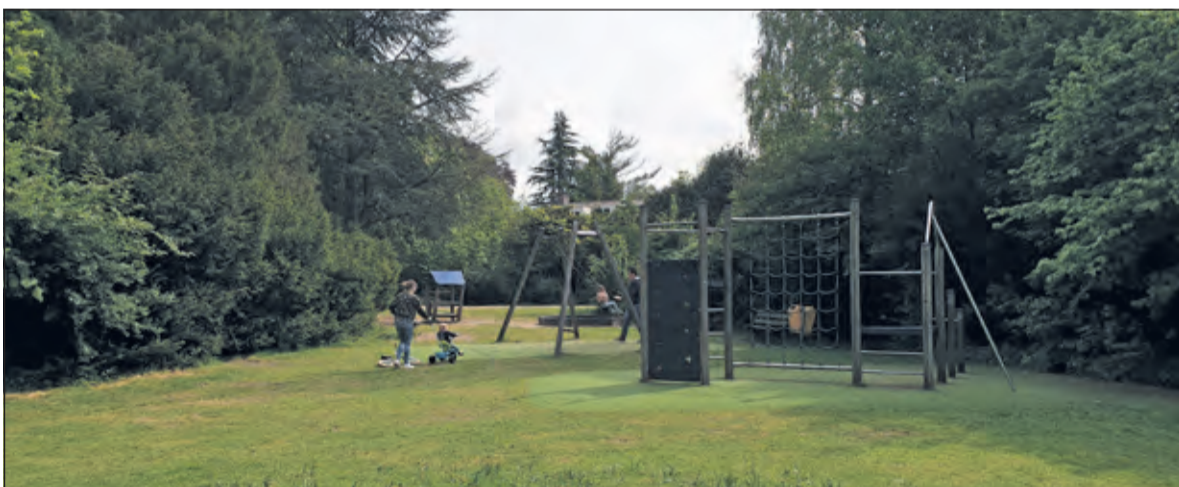
Een speeltuin voor de hele kleintjes.

'Een oude regel bij landgoederen is dat je een oude boom op tijd een opvolger moet gunnen. Op het veld met een imposante beuk zie je iets verder een even imposante stam van tien meter hoog. Met tien meter ervoor de opvolger. Prachtig om te zien hoe liefdevol hier met het park wordt meegedacht en meegewerkt. Het huisje aan de vijver is ook opgeknapt en doet dienst als werkschuur voor de leden van de vereniging. Bij alles kun je zien hoe goed de samenwerking tussen de omwonenden en de gemeente werkt. Het park is negentig jaar oud en leeft vast nog negentig jaar verder'.