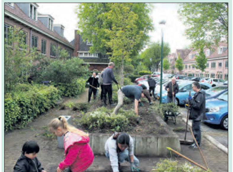
Jong en oud steekt de handen uit de mouwen om de bakken te schonen

'Die wildgroei is ontstaan, doordat SSW en de gemeente er maar niet uitkwamen wie verantwoordelijk was voor dit onderhoud. Het is een mooi deel van de buitenruimte en de bewoners ergerden zich al jaren aan dit getouwtrek. Na wat pogingen is het nu gelukt om de gemeente er bij te betrekken; de gemeente zorgde voor het gereedschap en nam de afvoer van het verwijderde groen voor haar rekening'.