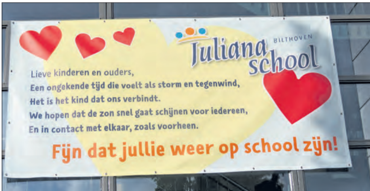
Met een gedicht boven de hoofdingang wordt iedereen warm welkom geheten.