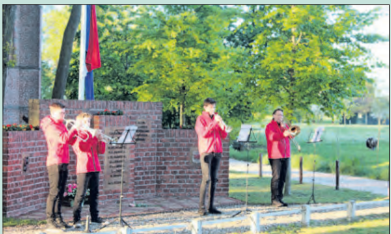
In Westbroek werd er in een kleine bijeenkomst koraalmuziek gespeeld door 4 muzikanten. Na de twee minuten stilte speelden zij vervolgens twee coupletten van Het Wilhelmus.

Elektrotechnisch Installatieburo van Woudenberg b.v.