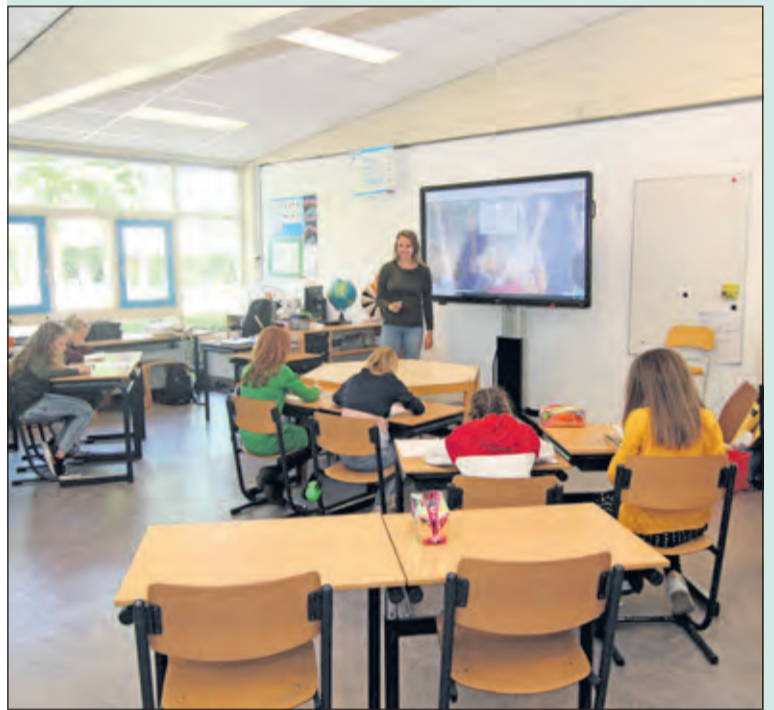
In de lokalen is extra ruimte gecreëerd zodat er zoveel mogelijk afstand gehouden kan worden