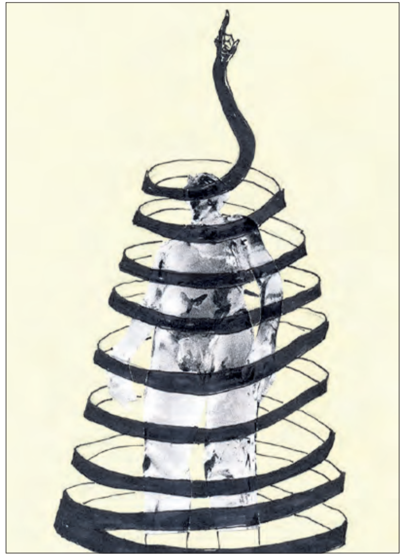
Het ontwerp van mevrouw Pijpers.

voor ouderen en verstandelijk gehandicapten, was het pleit snel beslecht. Kooos kwam eindelijk thuis.’