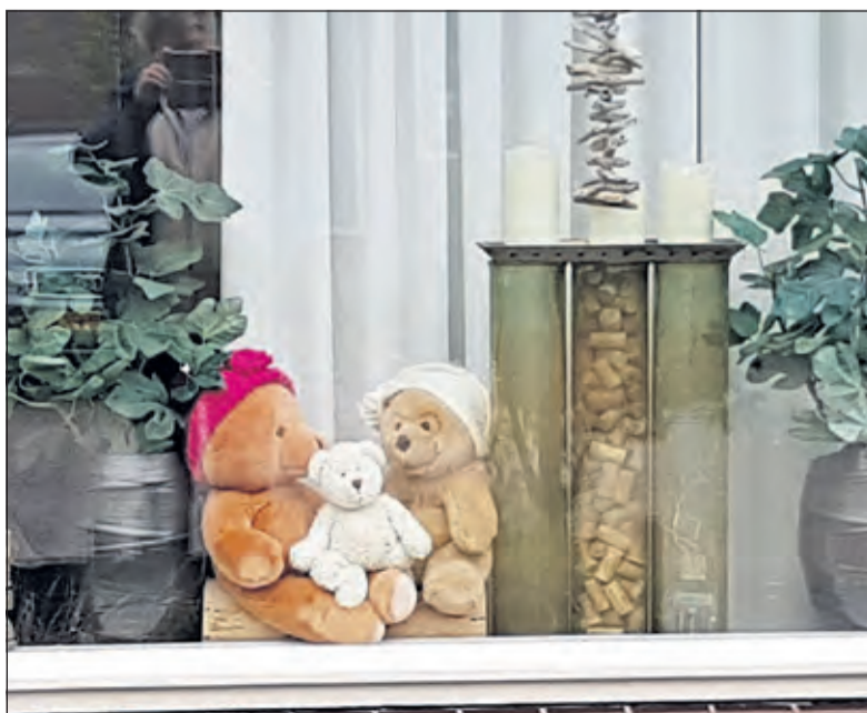
Een berenfamilie in De Leyen klaar om ontdekt te worden...