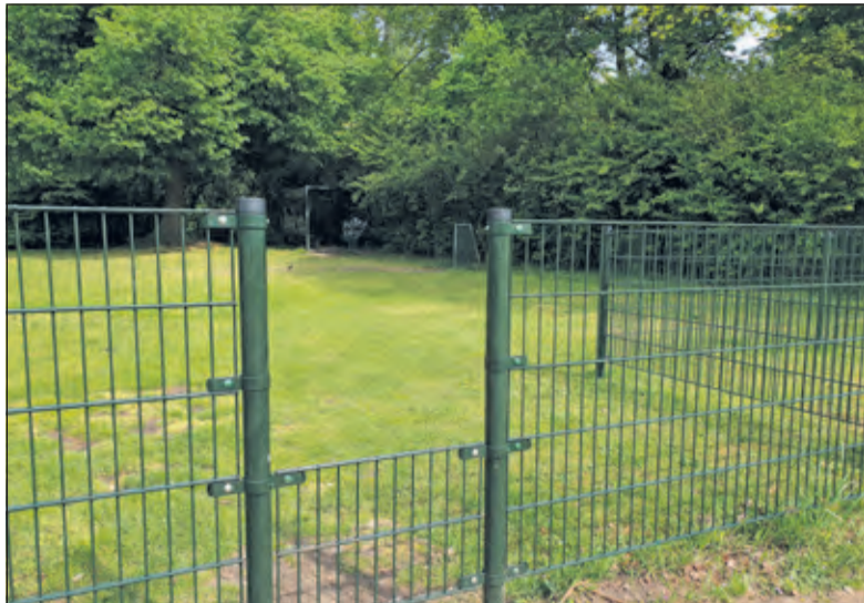
Het nieuwe hek met een doorgang.