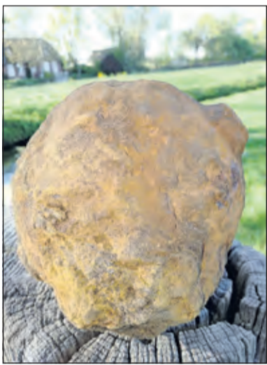
De gevonden pantservuistgranaat.

Nog meer kom je te weten als je met een metaaldetector de grond gaat afspeuren. Een metaaldetector, wellicht bekend van 'poortjes' in luchthavens, geeft de mogelijkheid om metalen voorwerpen onder de grond op te sporen. De meeste metaaldetector hobbyisten zoeken op een akker naar oude gebruiksvoorwerpen zoals vingerhoedjes, knopen, messen en munten. Veel voorwerpen zijn daar terecht gekomen met de stort van stadsafval in vroeger tijden. Interessant wordt het als de bodemvondsten gekoppeld kunnen worden aan de plaatselijke geschiedenis.