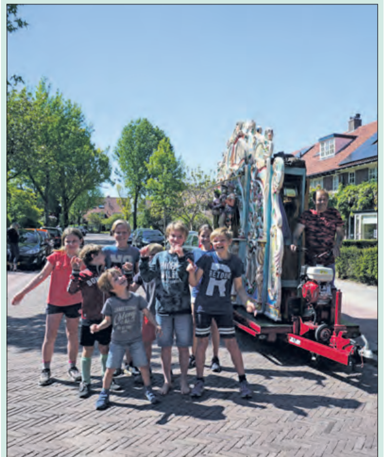
Zaterdag werden de bewoners van de Steenen Camer in Bilthoven verrast door een draaiorgel. Ook de kinderen genoten van de muziek. Het was een welkome afwisseling in deze tijd van noodzakelijke beperkingen van de bewegingsvrijheid.