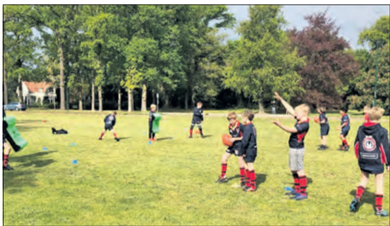
Rugby voor het gemeentehuis in Bilthoven onder Covid-19 regelgeving

Afgelopen week mochten de jeugdleden onder strenge regels en met extra schoonmaakmomenten voor ballen en materiaal weer hun spel spelen. Zaterdag stonden ruim 50 kinderen na lange tijd weer met een ovale bal in de handen om met veel plezier hun sport te beoefenen. Om de doelstelling van 100 leden deze zomer te halen nodigt de club kinderen uit om gratis een paar keer mee te doen. Zaterdag van 10 tot kwart over 11 is de training open voor jeugd van 5 tot 16 jaar die rugby eens wil proberen op een laagdrempelige manier. Kijk op de website voor meer informatie over de regels en aanmelding. www.srfc.nl