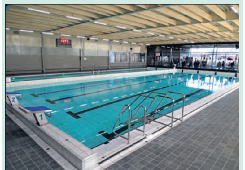
Binnenkort mag er weer gezwommen worden in Brandenburg.

Ook wordt er gewerkt aan aanpassingen in de routing van zwembad Brandenburg en het opstellen van aanvullende huisregels. 'We kunnen nog niet zeggen welke dag we weer opengaan. Zodra wij dit weten, informeren we onze vaste gasten via e-mail'. Voor actuele informatie zie www.zwembadbrandenburg.nl .