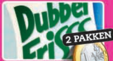
Dubbel Fris alle varianten 2 pakken à 1,5 liter naar keuze liter 0,33 2,10

De komende weken heeft C1000 iedere week 100 nieuwe aanbiedingen voor slechts 1 euro. Honderd topproducten, van zowel A-merken als ons huismerk, zijn stevig in prijs verlaagd. Begin het jaar dus extra voordelig en kom zakendoen bij C1000. Kijk voor de overige 70 aanbiedingen in de winkel of op c1000.nl .