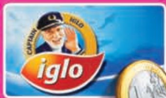
Iglo vissticks uit het vriesvak pak 10 stuks 1,99