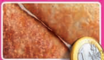
Abrikozen-, kersenroom- of appelflap driehoek vers uit eigen oven bak 2 stuks 1,50 - 1,58