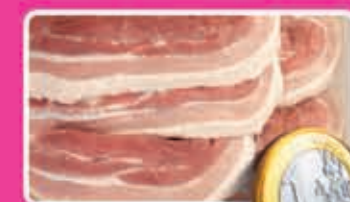
Speklappen zonder zwaard varkensvlees 300 gram kilo 3,33 1,79