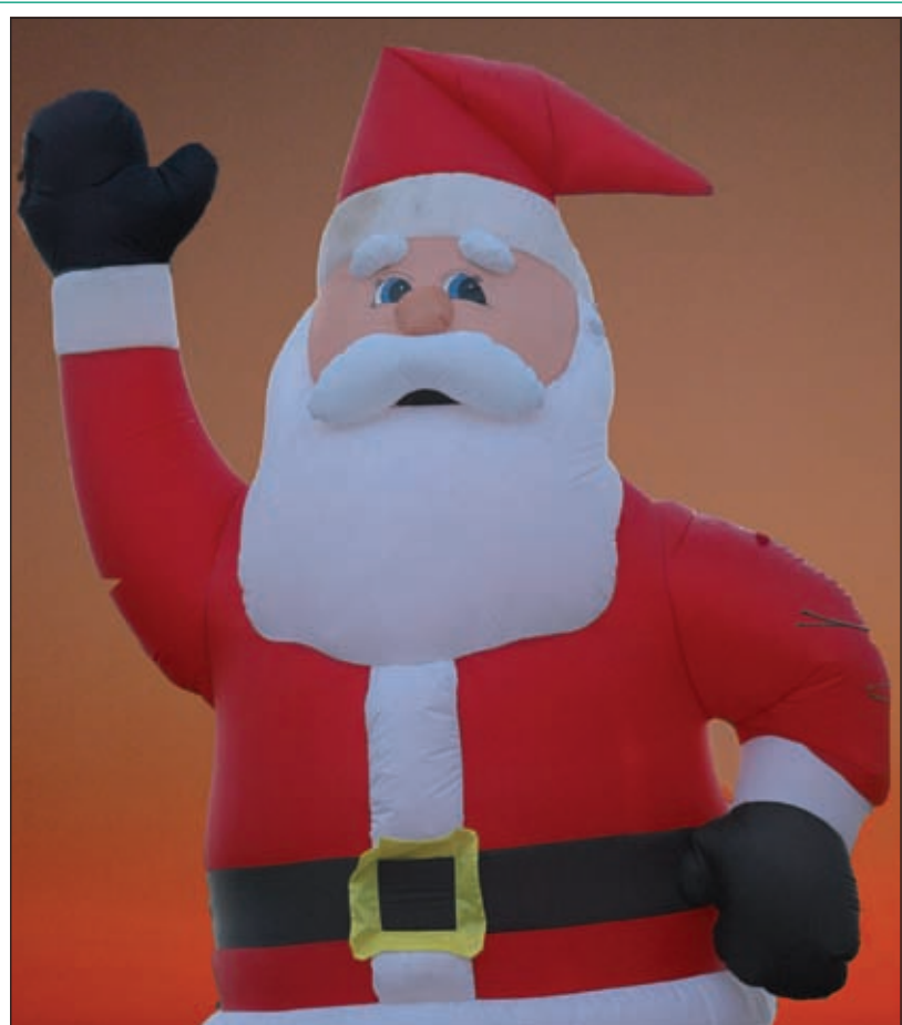
De kerstman langs de Tolakkerweg in Hollandsche Rading zwaait 0 van harte uit. Tot volgend jaar beste Vierklanklezers! Een veilige jaarwisseling toegewenst. (AvZ)