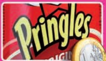
Pringles alle varianten bus 160 of 195 gram kilo 6,25/5,13 1,95 - 1,99