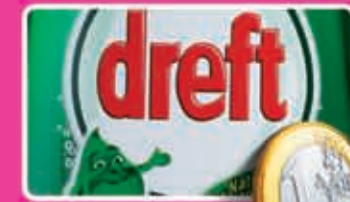
Dreft afwasmiddel alle varianten flacon 450 of 600 ml liter 2,22/1,67 1,99