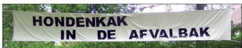
Geen tekst bij nodig.