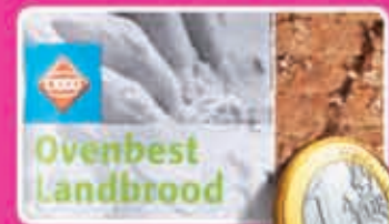
Ovenbest landbrood wit of bruin vers uit eigen oven heel 1,69