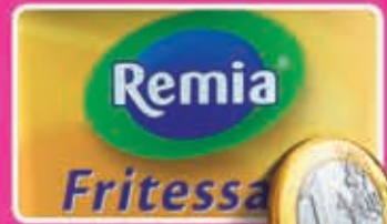
Remia fritessaus normaal of halfvol emmer 1 liter 1,65 - 1,92