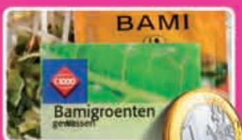
Bamigroenten met Conimexkruiden gewassen schaal 450 gram kilo 2,22 1,69