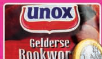
Unox Gelderse rookworst per stuk 275 gram kilo 3,64 1,89