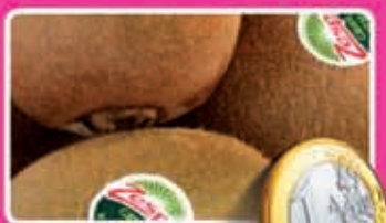
Zespri kiwi groen 500 gram kilo 2,00 1,89