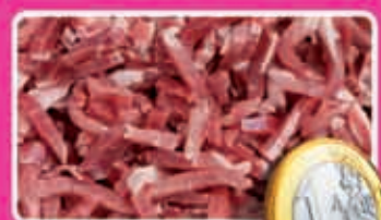
Varkensreepjes naturel 250 gram kilo 4,00 1,75