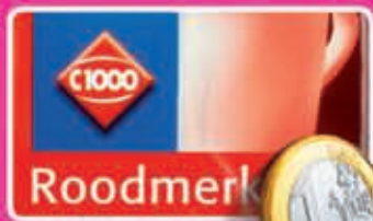
Roodmerk Koffie snelfiltermaling roodmerk of cafeinevrij pak 250 gram kilo 4,00 1,57 - 1,83