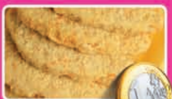
Kipschnitzels gekruid 200 gram kilo 5,00 1,69