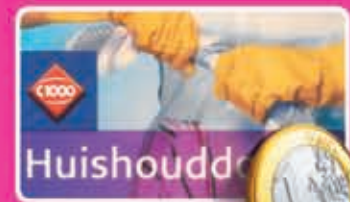
Huishouddoekjes pak 9 stuks 1,89