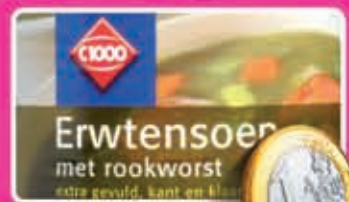
Erwtensoep blik 800 ml liter 1,25 1,18