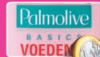
Palmolive crèmespoeling basics of anti-kill flacon 400 ml liter 2,50 2,05