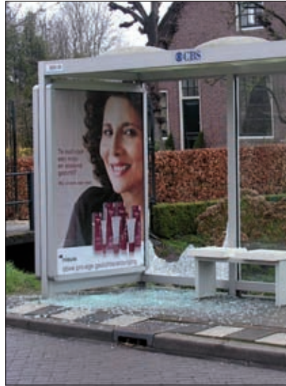
Zelfs in Westbroek worden bushokjes vernield.

uilenballen. Behalve dat, zijn er in Westbroek ook etterballen die bushokjes vernielen. Herman Doornen-