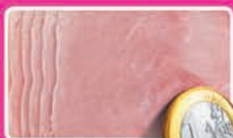
Slagersachterham vers van 1 mes 100 gram kilo 10,00 1,69