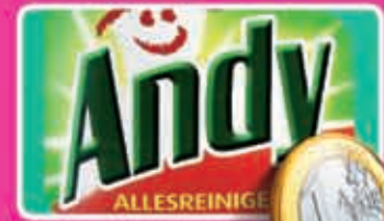
Andy allesreiniger alle varianten flacon 750 ml liter 1,33 1,34