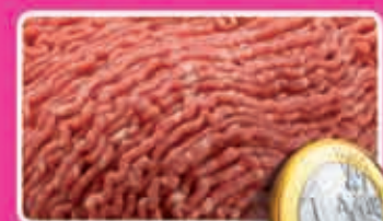
Mager rundergehakt 250 gram kilo 4,00 1,49