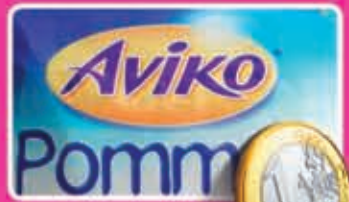
Aviko pommes frites uit het vriesvak zak 1 kilo 1,45