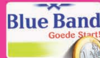
Blue Band goede start kuip 500 gram kilo 2,00 1,65