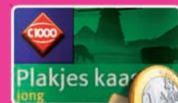
Plakjes Goudse kaas 48+ alle soorten bak 190 gram kilo 3,26 1,69 - 2,59