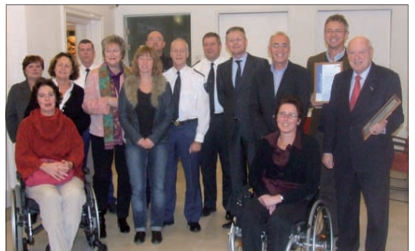
Zij allen zorgen voor een plezierig en veilig winkelgebied.

aan de Broemcursus krijgen een certificaat. De eerste contracten voor Bedrijvenpark Larenstein worden getekend. Vijf brandweermannen krijgen een Koninklijke Onderscheiding. Op het Maertensplein is een extra koopavond met Sterk Spul, glw en erwtensoepp. De Wilde Metaal koopt een kavel op Larenstein. De Hessenweg in de Bilt krijgt een derde ster. In de Nootjes staat voor tien euro een hometrainer te koop. Goed om af te vallen na de feestdagen.