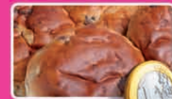
Reuze krentenbollen zak 4 stuks 1,57