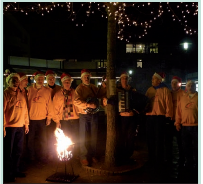
Dinsdagavond 3 december waren de winkels op het Maartensplein allemaal geopend. Er werd van deze extra mogelijkheid om kerstinkopen te doen, onder het genot van een glas glühwein, een kop erwtensoep en de muzikale aanwezigheid van Sterk Spul (foto) goed gebruik gemaakt [MD].

Intussen zijn de werkzaamheden in De Rietakker, de Jan Ligthartschool en het scholencomplex van de Kievit en Martin Luther Kingschool afgerond. De werkzaamheden in de overige scholen zijn gepland in de aanstaande voorjaarsvakantie en worden thans aanbesteed.