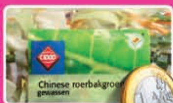
Chinese roerbakgroenten gewassen zak 400 gram kilo 2,50 1,89