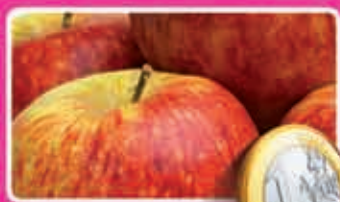
Jonagold appelen 2 kilo kilo 0,50 1,89