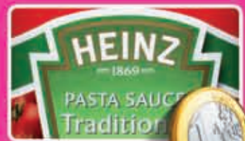
Heinz pasta sauce traditional, hot of lente-wit & zongedroogde tomaat pot 600 gram kilo 1,67 1,84 - 1,97