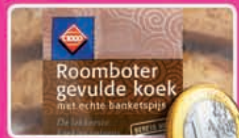
Koeken roomboter gevulde koeken, fondant cake, super mergpijpen of super bokkenpoten toefzak 175, 300 of 400 gram 1,89 - 1,99