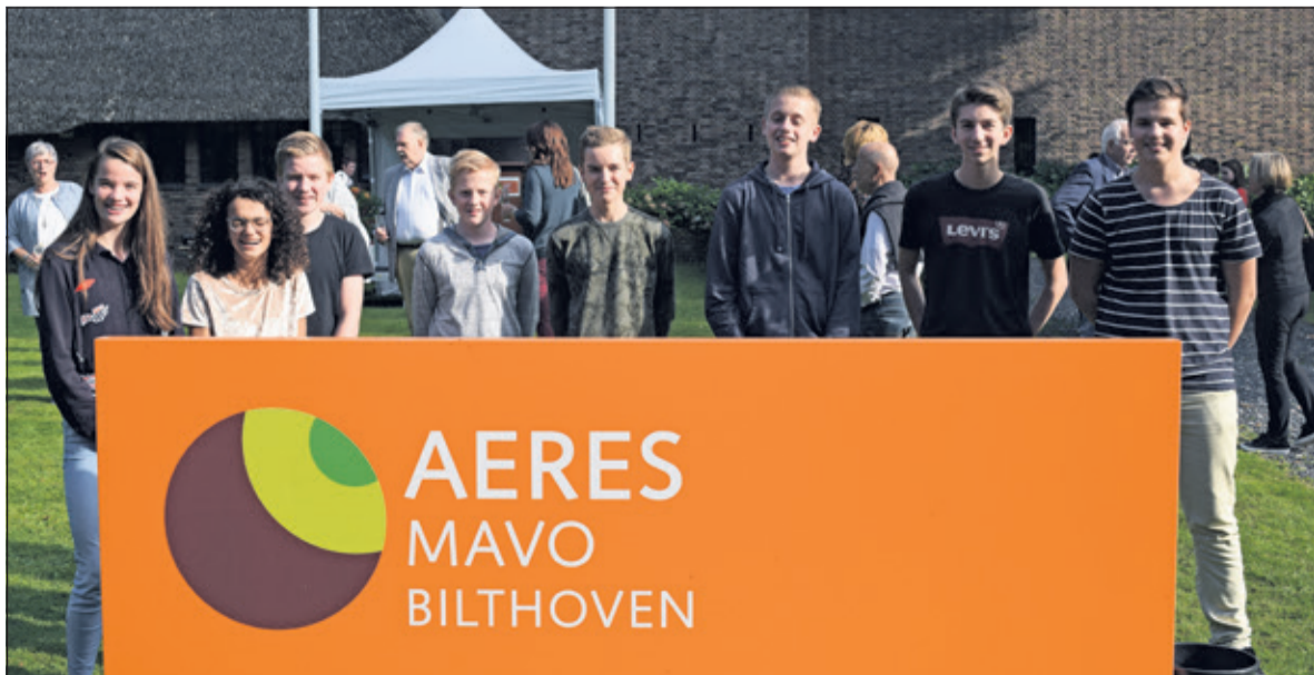
De naamsverandering is een feit.

verleden en voerden wij nadien diverse veranderingen door. Ook legden wij contacten met het lokale bedrijfsleven en vroegen hen of zij lessen wilden verzorgen aan onze leerlingen. Dat wilden zij graag, mits het geleerde ook getoetst zou worden'. Verandering op verandering voerde het bestuur door, tot de school aan alle eisen voldeed. En als kers op de taart heet ONS vanaf heden dan ook Aeres Mavo Bilthoven, een landelijke kennisinstelling van VMBO tot HBO, met landelijk ongeveer 10.000 leerlingen. Aeres Mavo Bilthoven is niet de enige school in gemeente De Bilt met een naamwijziging. Ook het Groenhorst College in Maartensdijk is nu onderdeel van Aeres en heet vanaf dit schooljaar Aeres VMBO Maartensdijk.