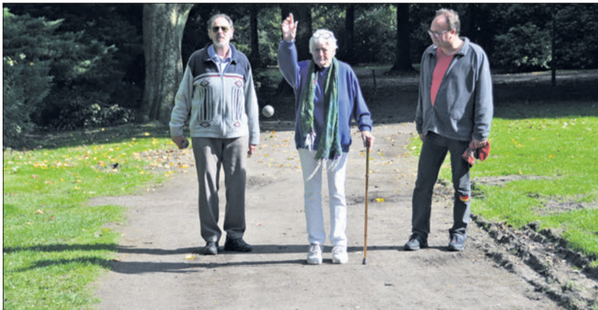
Leden van Kets up aan het jeu de boulen