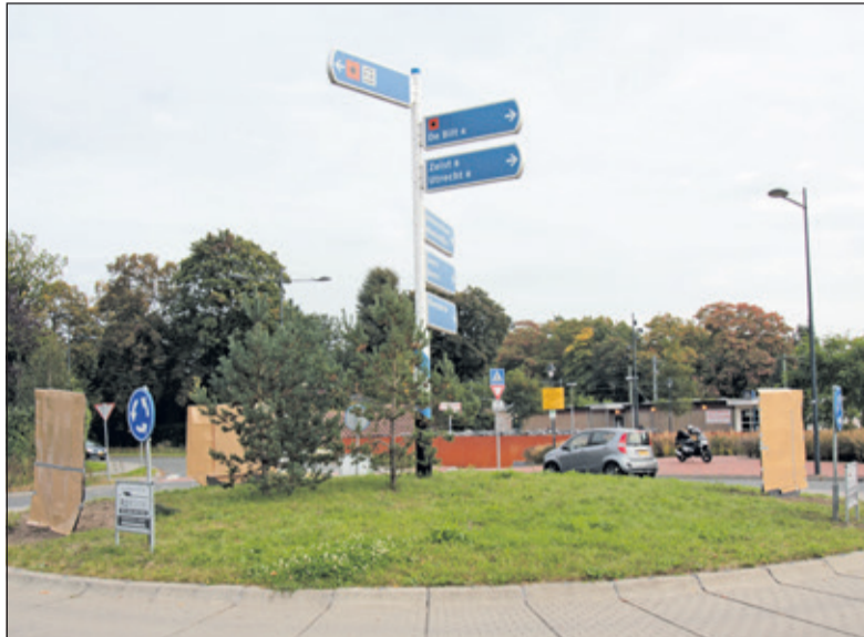
Het monument wacht op onthulling.

De feestelijkheden starten om 15.00 uur in Huize Het Oosten, ingang Rubenslaan 1. Gezamenlijk zal er naar de rotonde gelopen worden alwaar om 16.00 uur de onthulling van het monument plaatsvindt. Met dit gebaar krijgt de lang bestaande en hechte verbinding tussen het dorp en de vrijmetselarij een zichtbare vorm. Inwoners van de gemeente zijn van harte uitgenodigd de feestelijkheden bij te wonen. Voor de schenkingsbijeenkomst geldt een verplichte aanmelding, de onthulling op de rotonde is vrij te bezichtigen. Men kan zich als gast aanmelden via: www.logedester.nu