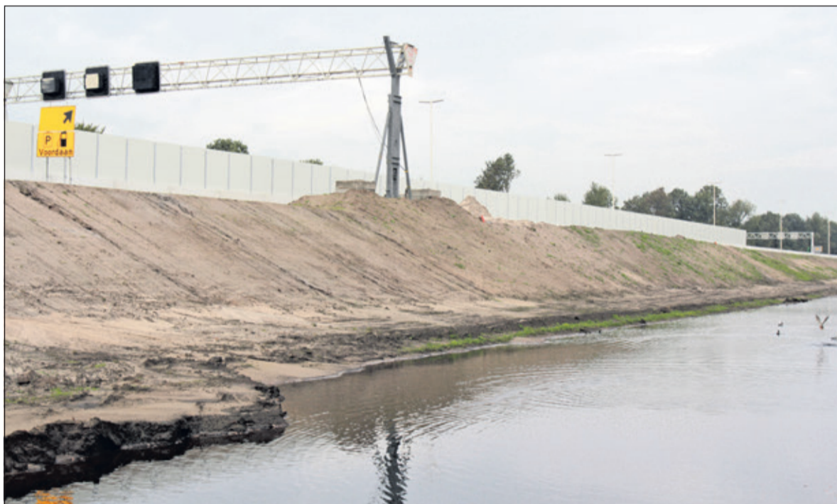
Gelezen op www.klompennaden.nl : 'Wegens werkzaamheden aan de A27 kan het zijn dat er bij het startpunt van de Klompenpad-wandelroute aan de Groenekanseweg in Groenekan geen of weinig parkeergelegenheid is. Dit kan tot eind 2018 duren'. Fotograaf Reyn Schuurman constateerde daar ter plaatse, kijkend richting Hilversum, een geheel nieuw gegraven sloot naast een deel van de tijdelijk geplaatste schermen. Dit beeld is voor de snelweggebruiker totaal aan het gezichtsveld onttrokken.