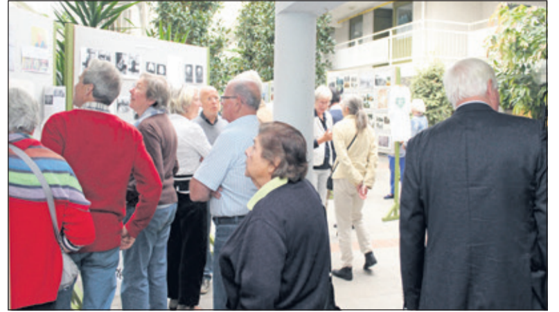
De tentoonstelling in Dijkstate trekt aardig wat bezoekers.