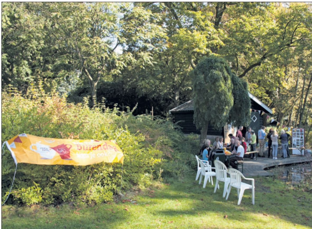
Buren en vrienden genieten van een prachtige herfstdag.

van de maand gaat in september vanwege onze activiteit met de Burendag niet door, maar op zaterdagochtend 28 oktober is iedereen weer van harte welkom om met ons koffie te drinken en aan de slag te gaan'