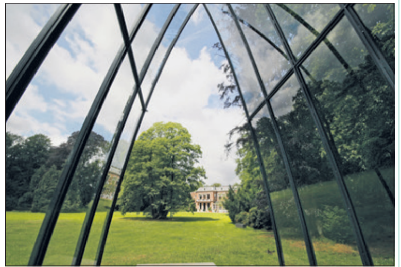
Landgoed Oostbroek.