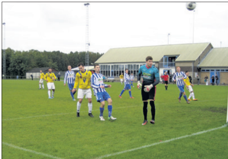
Deze bal van Maartensdijkse voet gaat over het Lopikse doel.

Aanstaande zaterdag speelt SVM om 14.30 uur thuis tegen promovendus Voorwaarts.