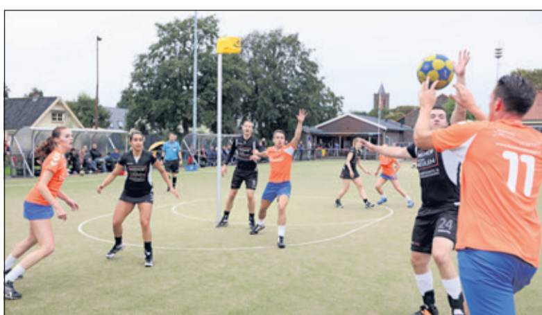
Dos is gebrand op een overwinning.

Na een 9-13 ruststand zette de thuisploeg dan ook een inhaalrace in. De Westbroekers geven niet snel op en zagen nog voldoende mogelijkheden op een goed resultaat. Lisanne Groot was in deze fase