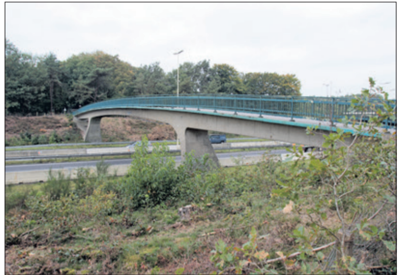
Het slopen van de fietsbrug is nodig omdat de brug te smal is voor de straks verbrede A27.

verbreding ontstonden veel files vanwege de wegversmalling tussen Utrecht-Noord en Bilthoven. Het zorgde voor een knelpunt aan de oostzijde van Utrecht en vormde een bron van frustratie. Tijdens de werkzaamheden waren er al 3 smallere rijstroken met een maximumsnelheid van 90 km/h, de 3x90-maatregel. Dit is een manier om de doorstroming al tijdens werkzaamheden te bevorderen. Nu kunnen weggebruikers 120 km/h op 3 rijstroken rijden en daardoor sneller doorrijden. De werkzaamheden zijn echter nog niet geheel afgerond. Weggebruikers moeten dus op blijven letten.