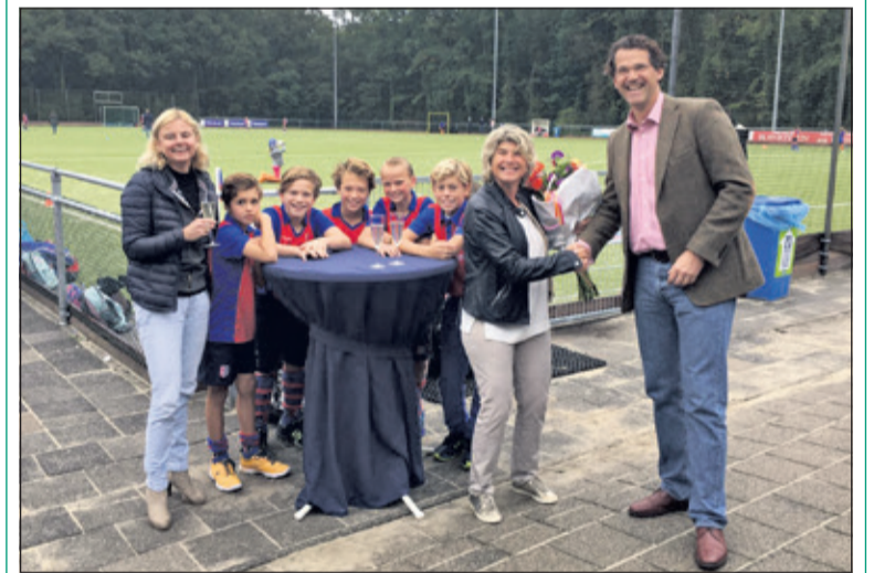
Jeugdspelers van SCHC flankeren de voorzitter en wethouder bij de officiële opening.