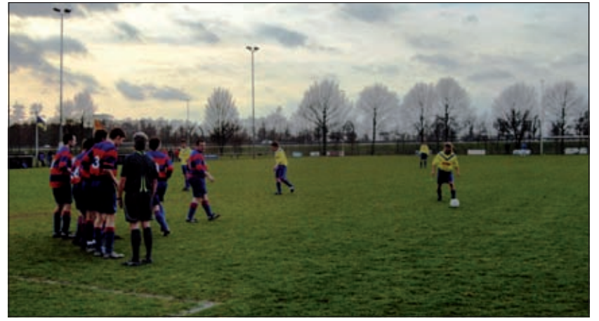
Donkere wolken pakken zich samen boven SVM en niet alleen bij het nemen van deze vrije schop.