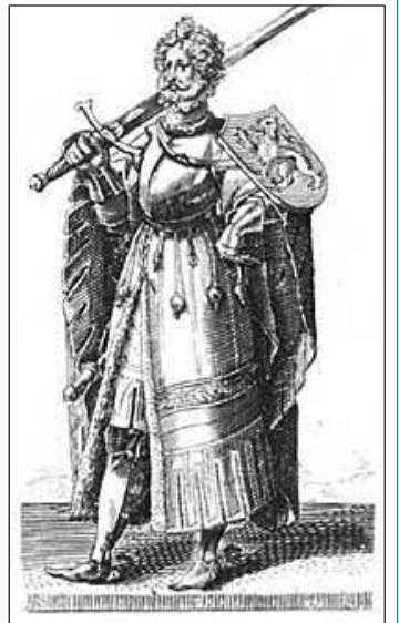
Graaf Floris V

Dit jaar staan op het programma weer bekende punten, zoals de opening door de burgemeester, de gezamenlijke optocht van ouders en kinderen, de vele speelmogelijkheden voor kinderen, de rommelmarkt en het voetbaltoernooi voor jongeren. De dag wordt traditioneel afgesloten met heerlijke warme snacks met een verloting van prijzen, die door lokale sponsors ter beschikking zijn gesteld. Als nieuw element wil het comité dit jaar op 30 april een open podium houden, waarin jong en oud talent het publiek verrast met een eigen voorstelling. Het gaat meer om de durf van het doen dan om een topprestatie. Gedacht wordt o.a. aan een troubadour zoals die in de middeleeuwen zijn liederen zong. Zo herleven oude tijden.