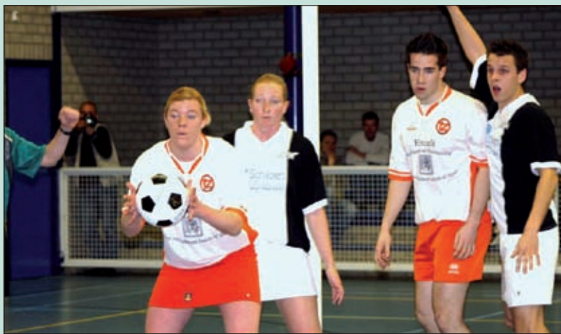
Een spelmoment uit de eenvoudig gewonnen wedstrijd van TZ tegen het reeds gedegradeerde ZKV (24-11).

Na twee competitie-loze zaterdagen kwam dit weekend ZKV op bezoek in De Vierstee. De ploeg uit Zaandam, hekkensluiter met één behaald punt, is al gedegradeerd. Voor Tweemaal Zes was het zaak om de eerste van drie belangrijke wedstrijden winnend af te sluiten. De eerste ontmoeting in Zaandam eindigde in 11-26 voor Tweemaal Zes.