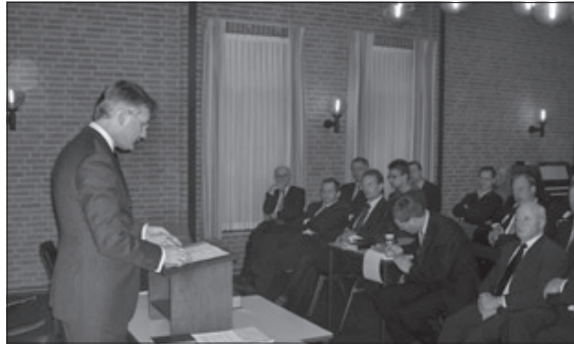
In het Hervormd Centrum in Maartensdijk waren ongeveer 50 aanwezigen een en al oor voor de woorden van de voorzitter van de Biltse Gemeenteraad.

Gerritsen vertelde zijn 'rol' als burgemeester op maar liefs vier velden te 'spelen'. Als eerste burger van een gemeente is hij er natuurlijk voor de burgers, waar mee hij graag en veelvuldig contact onderhoudt. Hij