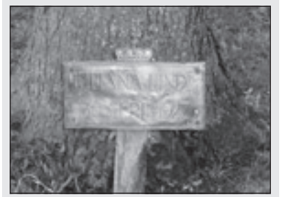
In de rondvraag werd aandacht gevraagd voor het onderhouden van de ruimte rondom de op 30 april 1927 op de hoek van de Koningin Wilhelminaweg en de Dorpsweg geplaatste 'Julianalinde'. Bij navraag bleek niet meer informatie bekend over het ontstaan en de betekenis van deze linde, dan dat deze vermoedelijk is geplant op of ter gelegenheid van de 18de verjaardag van de toenmalige prinses Juliana. Beschikt u over meer informatie, neem dan contact op met De Vierklank, vierklank@jvand.nl.