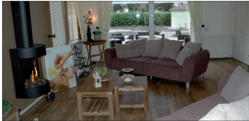
De ruime relaxruimte oogt knus door het gebruik van natuurlijke materialen.