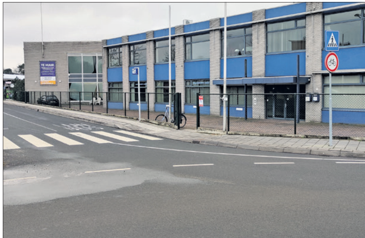
Volgens het college is Spoorzone Bilthoven een ideale locatie voor het bouwen van woningen.