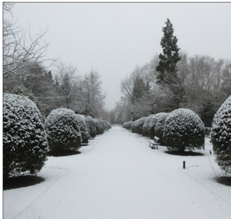
Begraafplaats Brandenburg.

Wil je zonnepanelen laten installeren maar weet je niet waar je moet beginnen? De energieambassadeurs van Beng! vertellen je graag meer over de mogelijkheden van zonnepanelen. Een goede start om zelf energie op te gaan wekken. Op donderdag 2 febr. is er een info-avond bij De Rinnebeek in De Bilt. Je bent van harte welkom vanaf 19:30 uur. Meld je aan via www.bengdebilt.nl/aanmelden-informatieavonden/