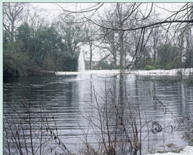
Ook in het Van Boetzelaerspark is het opeens winter.