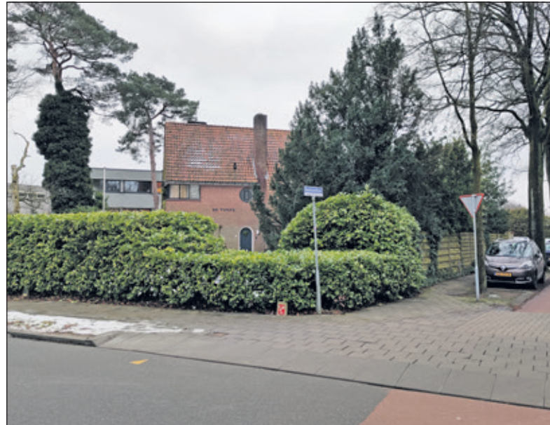
De Timpe ligt in het voorste terrein op de hoek van de Rembrandt- en Jan Steenlaan.

mens de Lakenvelder Investment Group: 'Er ligt een concreet en mooi plan klaar waarin de wensen vanuit het reeds gedane participatieonderzoek onder inwoners en belanghebbenden zijn meegenomen. Wij kunnen volgend jaar starten met de bouw en daarmee voorzien in de zo nodige woningen voor diverse doelgroepen, waaronder zowel senioren uit de gemeente die willen doorstromen als voor starters. Echter als de grond niet meer beschikbaar is zal dit doordachte plan nooit ten uitvoer worden gebracht'.