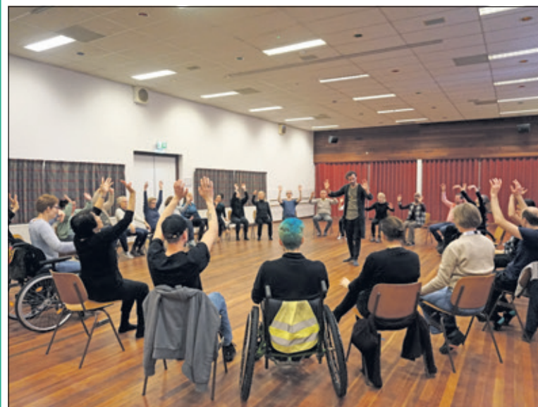
Er was zaterdag ruime belangstelling en de deelnemers genoten zichtbaar van deze nieuwe ervaring van bewegen en dansen.

Zaterdag organiseerde de Stichting RediscoverMe een groepsles dansen en bewegen voor mensen met de ziekte MS (Multiple Sclerose). Het DansLab voert in samenwerking met de Stichting RediscoverMe en de MS vereniging regio Utrecht deze beweeglessen uit met als doel mensen met deze chronische ziekte in contact te brengen met dansen en nieuwe vormen van bewegen onder begeleiding van muziek. Deze lessen worden op veel plaatsen in ons land gegeven. (Frans Poot)