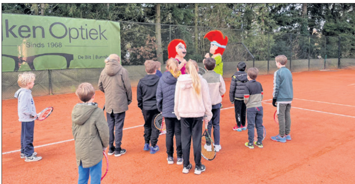
2 mascottes van de Nederlandse tennisbond KNLTB, Ace en Love, verzorgen de warming-up voor de kleinste kids.

ten. Al lange tijd wordt er gespeeld met ballen die zijn aangepast aan de leeftijd en ervaring van het kind. Dus iedereen kan het daardoor leren en blessures komen nauwelijks voor bij de jeugd. Verder kun je spelen en trainen wanneer jij wilt, een sport met veel flexibiliteit. Heb je ook interesse om het te leren, meld je dan aan bij een tennisclub in De Bilt. (Friso Hennings Backer)