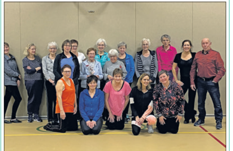
De laatste les van de dames werd afgesloten met een groepsfoto.

Ondanks hun hoge leeftijd kwamen zij trouw elke week op les, bijna 60 en 43 jaar lang. En in al die jaren zijn zij ook heel betrokken geweest bij de club en hebben zij vele hand- en spandiensten verricht. Gymo!nt De Bilt is dan ook heel trots dat zij zolang hebben mogen en kunnen gymmen. Ook zo fit blijven? Er is nog volop plaats. Meld je aan voor een gratis proefles van Blij (f) Fit, en kijk op de site van www.gympoint.nl/gympoint-de-bilt . Bellen kan natuurlijk ook; 030 2203164. (Lisette van Wijk)