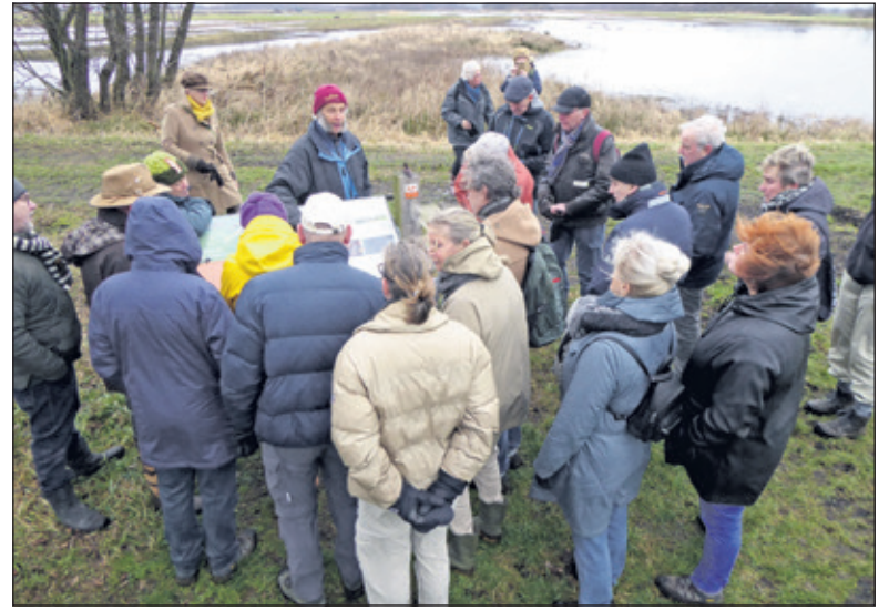
De winterwandeling wordt altijd druk bezocht.

Deelname is gratis voor leden van de Agrarische Natuurvereniging Noorderpark.. Lid worden is ook ter plaatse mogelijk. Parkeren kan op het terrein van de museumboerderij.