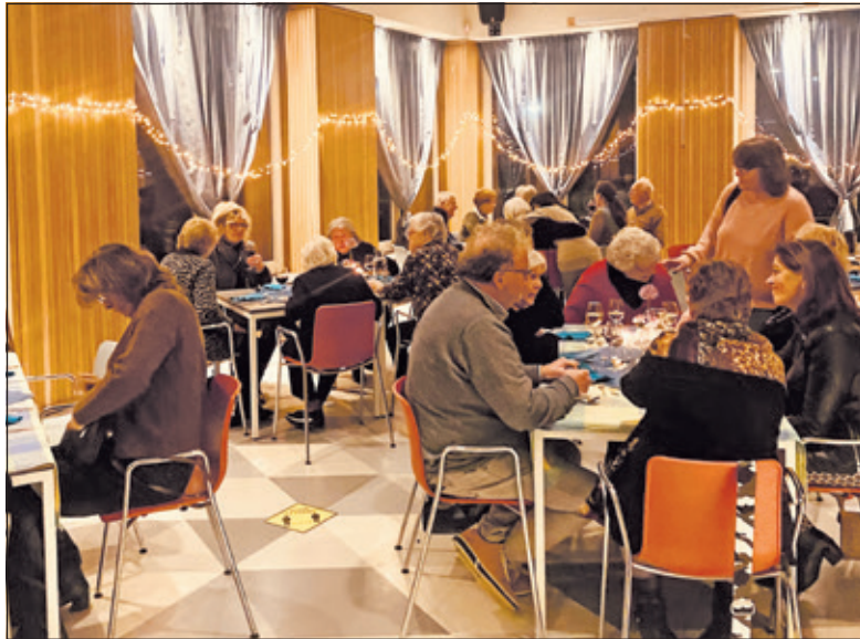
Alle tafelgasten genieten van de sfeer en de heerlijke maaltijd die door de vrijwilligers is verzorgd.

Medewerkers en vrijwilligers van Mens De Bilt hebben het nieuwe concept bedacht en wilden een start maken in Hollandsche Rading. Huis aan huis werden flyers rondgebracht om de behoefte te peilen. Doel was om mensen op een laagdrempelige manier te verbinden en sociale cohesie op gang te brengen. Binnen twee dagen hadden zich 30 mensen aangemeld. De vrijwilligers die zich aan dit project verbonden hadden konden het menu gaan samenstellen om de bezoekers te verrassen met een gevarieerd winters drie gangen menu.