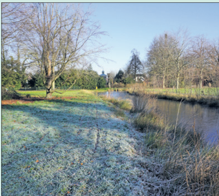
Het Van Boetzelaerspark in wintertooi.