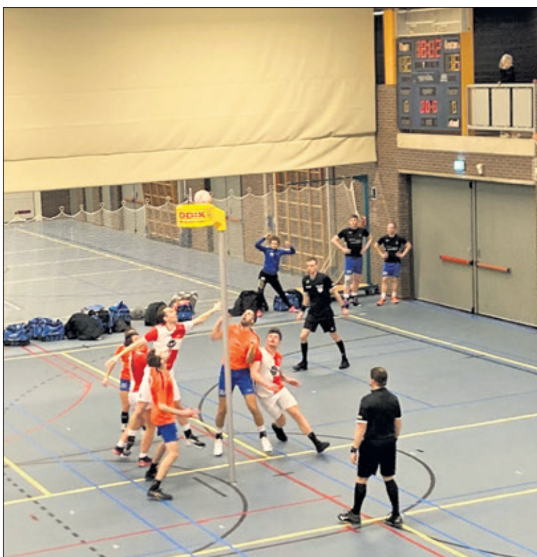
Ook van bovenaf een goed beeld van een eenzijdige wedstrijd.

Hierdoor, met volgende week zaterdag om 18:10 uur in Maartensdijk, de topper tegen de nummer 1 Avanti op het programma. Toch nog wat werk aan de winkel in Westbroek. (Fred van Ettikhoven)