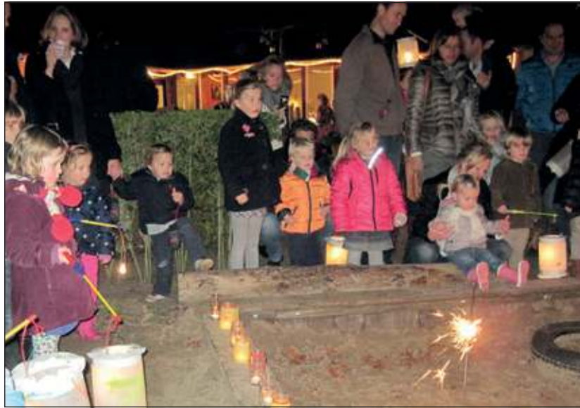
Het lichtjesfeest wordt spetterend afgesloten met 'vuurwerk' in de zandbak.

Om half 5 beginnen de feestkriebels toe te slaan als de geur van warme chocolademelk en glühwein de ruimte begint te vullen en de eerste ouders arriveren op het kinderdagverblijf. Want ook de kinderen die op donderdag niet op het kinderdagverblijf worden opgevangen, komen het feest meevieren.