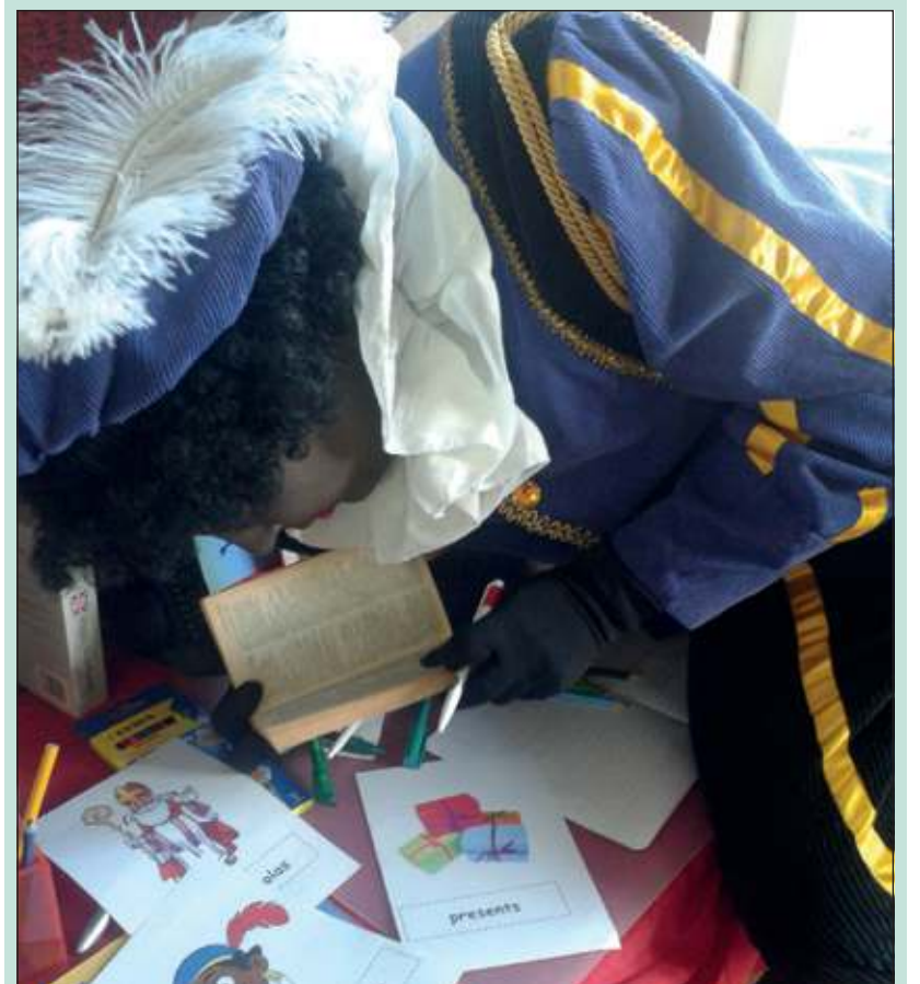
Piet wordt overstelpt met werk op de Van Dijkschool.

Het kantoor wordt steeds voller en voller. Kinderen helpen Piet enorm door allerlei werk voor hem neer te leggen en op te hangen. Engelse Sinterklaasliedjes, Engelse woordjes die met Sinterklaas te maken hebben, etc. En Piet maar studeren. Af en toe houdt hij een korte strooipauze om daarna weer hard verder te gaan leren in zijn eigen kantoor. Ook Sinterklaas heeft per gedicht laten weten dat hij heel graag Engels wil leren. Hij overweegt om zeer binnenkort een reisje naar Engeland te maken. Hopelijk pas ná 5 december.