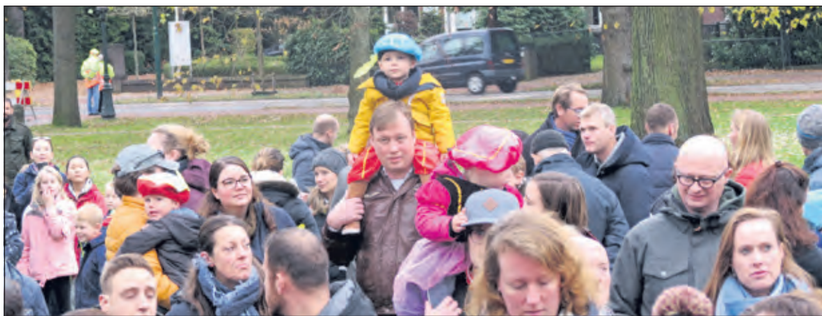
Op schouders van ouders kunnen de kleintjes alles goed zien.