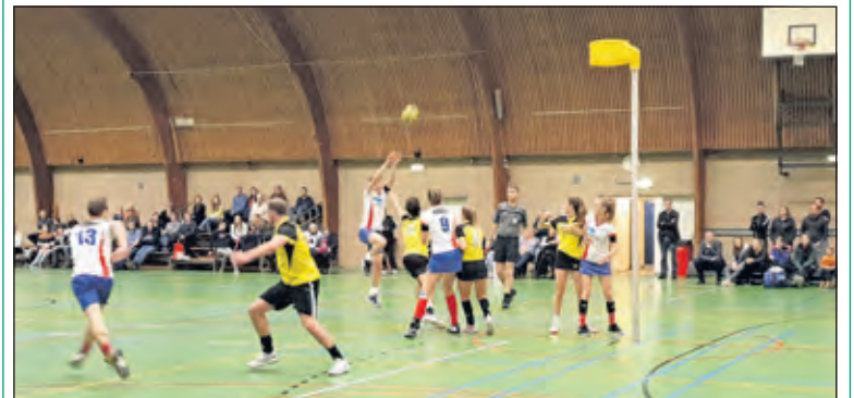
Nova speelt een pittige wedstrijd tegen de ploeg uit Den Haag.

Volgende week speelt Nova in Amersfoort tegen MIA. Daar zullen de spelers een paar oude bekenden van de Nova treffen.