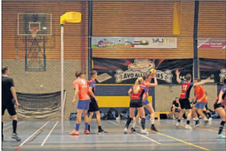
In de sporthal in Assen speelt AVO in een hal met een andere ondergrond dan gebruikelijk.

In de sporthal in Assen speelt tegenstander AVO in een hal met een