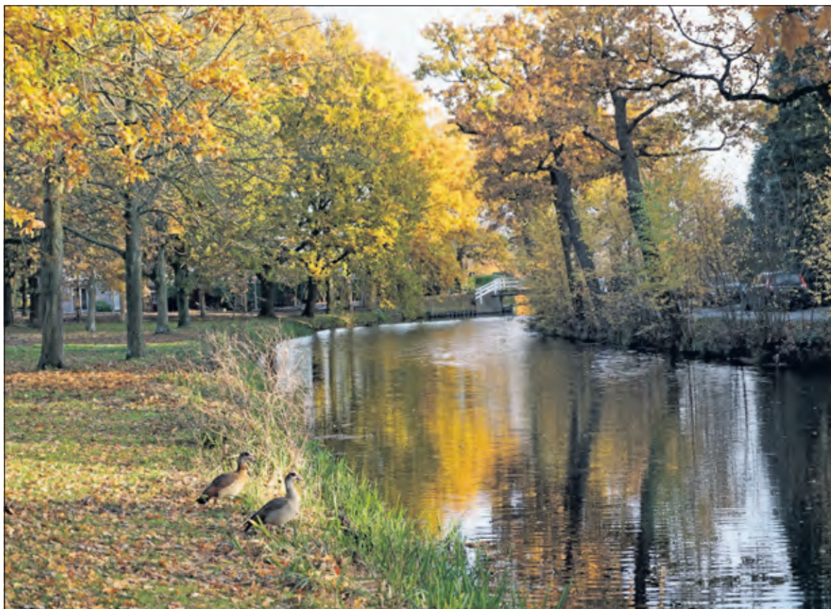
Rijdend langs de Emmalaan in De Bilt valt dit mooie plaatje te zien.