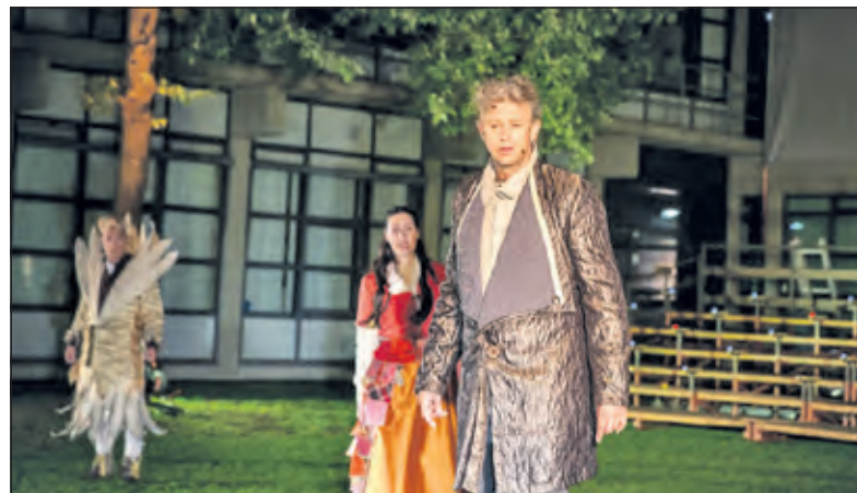
Beeld uit de voorstelling 'Mariecken uit Nijmegen'.

Voor een beeld van Theater in 't Groen, kijk op de website www.theaterinhetgroen.nl . Aanmelden kan via info@theaterinhetgroen.nl en informatie kan worden verkregen via 06 51604554.