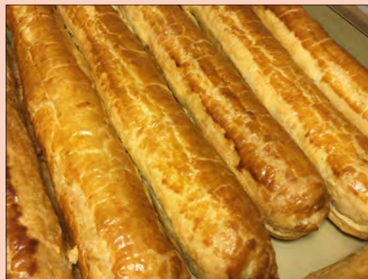
Als de staven uit de oven komen, ruikt het heerlijk in de winkel.

Bij Johns is alleen het allerlekkerste goed genoeg. En dat geldt niet alleen voor de zoetheid. Johns staat bekend om zijn heerlijke brood en broodjes die de hele dag door vers uit de oven komen, het enorme assortiment van meer dan 150 kaassoorten en een vergelijkbaar aantal wijnen. Verder is er ruime keus aan vers gebrande noten, mooie tapenades, olijven, veel soorten toast De vers gebrande koffiebonen vinden gretig aftrek en voor losse thee ben je aan het juiste adres met keuze uit ruim 60 soorten. Ook voor een heerlijk belegd broodje ben je bij Johns aan het juiste adres want een ding is zeker, het wordt daar met de beste ingrediënten en met liefde bereid.