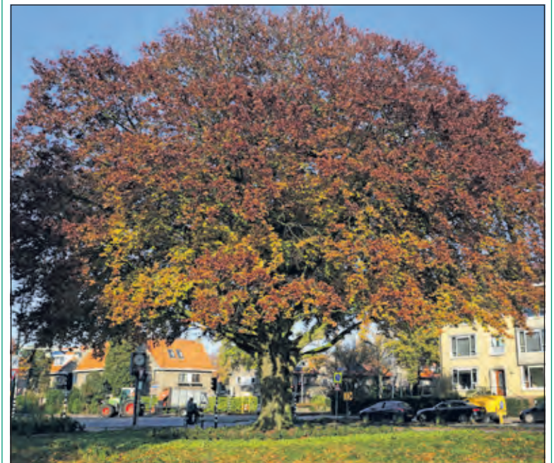
Het Dr. Letteplein (De Bilt) in een herfstkleed.