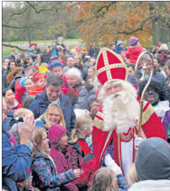
Na zijn aankomst baant de Sint zich een weg door de enthousiaste kinderen.