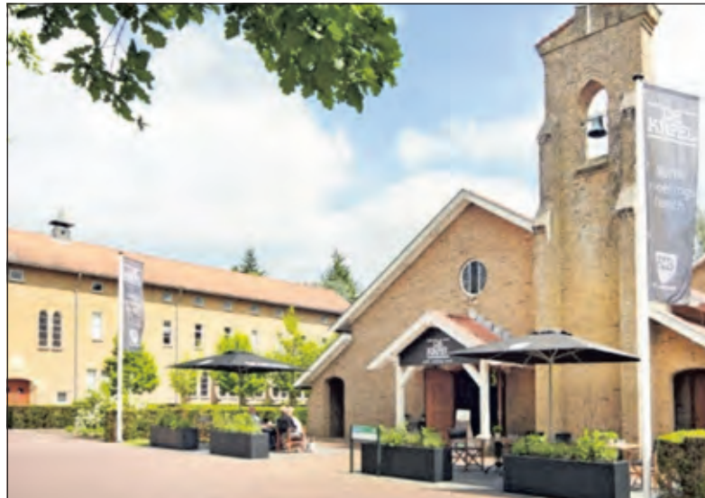
De Kapel heeft meer dan 80 jaar historie. Het gebouw was begin jaren dertig een prominent onderdeel van het toenmalige sanatorium Berg en Bosch.

De lunchroom op Berg en Bosch is iedere maandag t/m vrijdag open van 9.00-17.00 uur. Daarvoor en daarna staat de cateringservice ook tot uw beschikking. In het weekend is De Kapel beschikbaar voor feesten en partijen. Voor meer informatie: www.bergenbosch.com