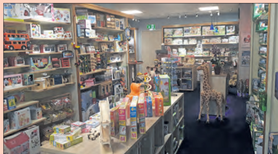
De speelgoedcollectie van Wiesje heeft in de recent verbouwde winkel een prachtige plek.

Black Friday geldt er een kortingsactie op de hele collectie (m.u.v. Reborn). Een uitstekend moment om eens binnen te lopen.