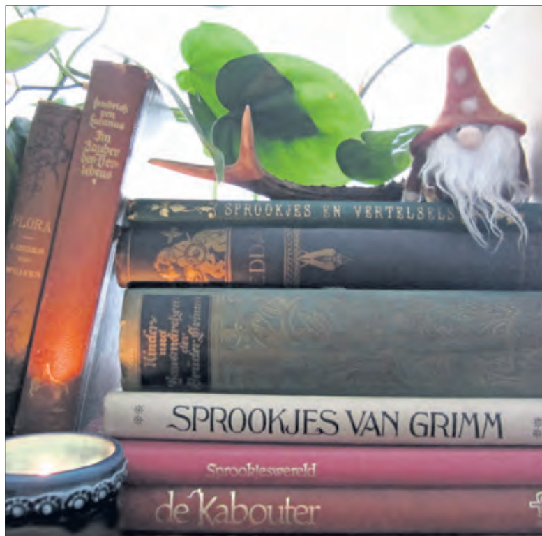
Op Beerschoten komen sprookjes tot leven.

KinderNatuurActiviteiten organiseert activiteiten voor kinderen in en over de natuur; dit wordt gedaan door vrijwilligers van Utrechts Landschap en IVN De Bilt. Woensdag 4 december wordt er in het bos van Beerschoten gezocht naar voorwerpen die daar niet thuishoren (of toch wel?). Aan elk voorwerp is een sprookje, mythe of ander verhaal verbonden. Je maakt kennis met oude natuurgoden en natuurrijke sprookjes. Je leert waarom de Grote Bonte Specht een rode broek draagt, waarom een hamer voor regen zorgde en hoe een dappere jongen een trol in een steen veranderde. Je gaat naar huis met een hoop mooie verhalen en leuke natuurweetjes. Leeftijd: 6 t/m 10 jaar. Tijd: 14.30 tot 16.30 uur. Plaats: Paviljoen Beerschoten, De Holle Bilt 6 in De Bilt. Aanmelden kan tot zondag 1 december via kindernatuuractiviteiten@gmail.com.