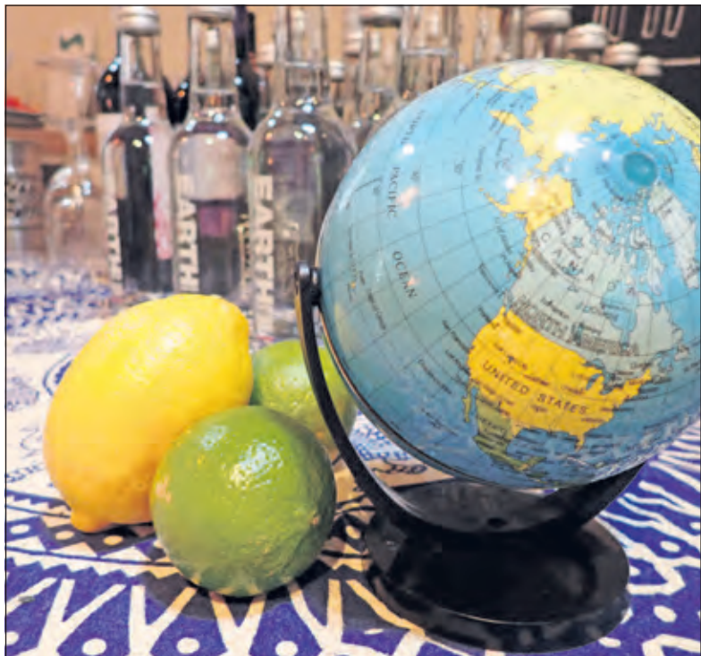
Schuif aan bij de culinaire wereldreis in Groenekan.

Interesse om mee te reizen? Kijk voor meer informatie en boeken op Instagram en Facebookpagina van BAPAHO.