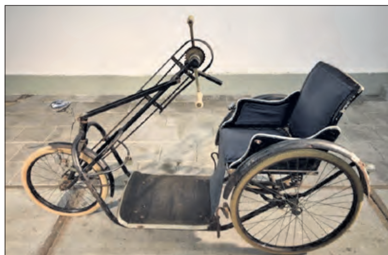
Nostalgie ten top. Wie heeft er in zo'n scootmobiel gezeten.

Als rode lijn bij de gesprekken op die middag wordt aan iedereen gevraagd iets mee te brengen. Dat kan een gebruiksvoorwerp zijn of gereedschap uit uw eigen omgeving of uit die van uw (groot) ouders. Gebruiken zijn veranderd en voorwerpen overbodig geworden, maar ze hebben allemaal een geschiedenis om niet te vergeten. Misschien hebt u een foto van een gebeurtenis van toen om herinneringen mee op te halen. Zoals van de eerste auto in de familie, een bijzonder dagje uit, kleding van