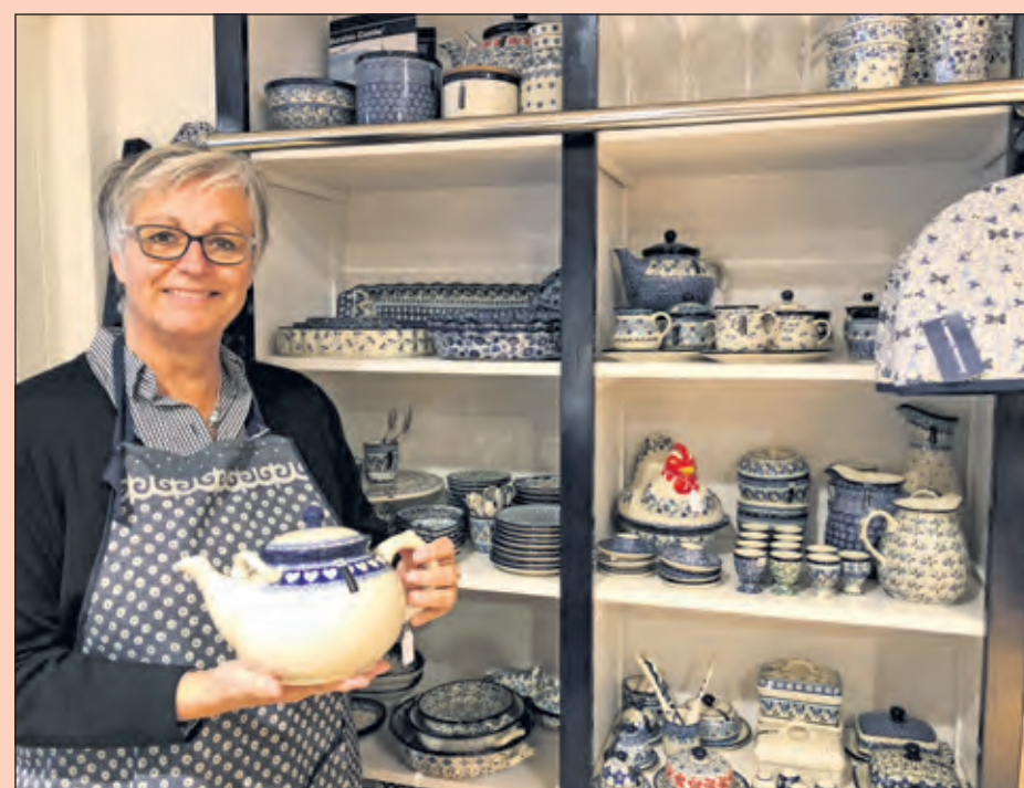
Bij Kooklust vind je het grootste assortiment Bunzlau Castle van de regio.

In aanloop naar de feestdagen is de serie van Blond Amsterdam uitgebreid met een Sint en Kerstcollectie en is er een keur aan kaasfondue-pannen te vinden. Verder blijft het natuurlijk heerlijk shoppen voor de leukste kookcadeautjes op de Hessenweg 155.