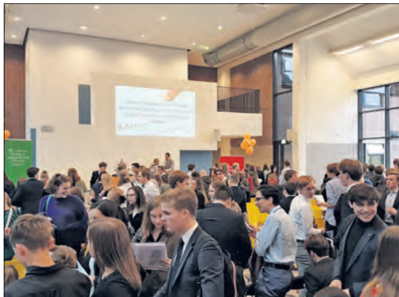
Een overvol Lyceum debatteert er op los.

In een serieuze en respectvolle sfeer traden de scholieren tegen elkaar in het strijdperk, waarbij steeds 4 kandidaten per team het woord voerden en beoordeeld werden door een