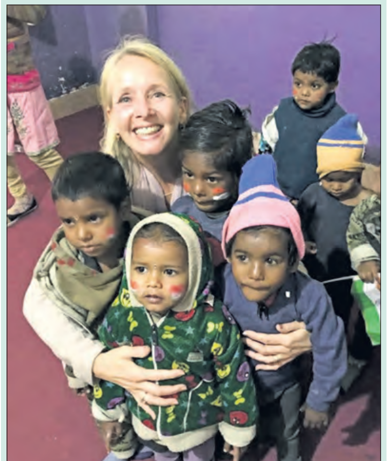
Zandzegge leden reisden naar India om het contact persoonlijker te maken en zagen de impact en betekenis van de gift.