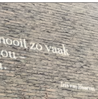
In De Bilt landden een paar zinnen van een gedicht van kunstenaar Iris van Haaren zomaar op een blinde muur in Laan 1813.

hoe een ieder de gemeente niets vindt...er zijn mensen die de burger vertegenwoordigen en die spreken elkaar in een openbare vergadering. Ik kijk nu al jaren naar die vergaderingen. Ik begrijp er niets van...de een na de ander probeert te scoren...soms liefst ten koste van een ander. En als ik dan weer eens de draad kwijt ben gaat het niet meer om de inhoud, maar om hoe de regels moeten in zo een bijeenkomst. Het lijkt wel een slecht toneelstuk waar ik dan naar zit te kijken. ‘Alles wat er mooi is wordt om zeep geholpen...en nu doel ik eens niet op het groen...ik doel op de medemenselijkheid...wij allen zijn kwetsbare mensjes, ook mensen in grote huizen met grote tuinen. Niemand is sterker dan de ander, niemand is belangrijker dan een ander. Wij gaan allemaal dood, de een met een vol leven achter de rug met veel liefde gegeven en de ander zuur en verdrietig zittend op zijn of haar comfortabele stoel met geldkist als voetenbank. En alles wat daar tussen zit’.