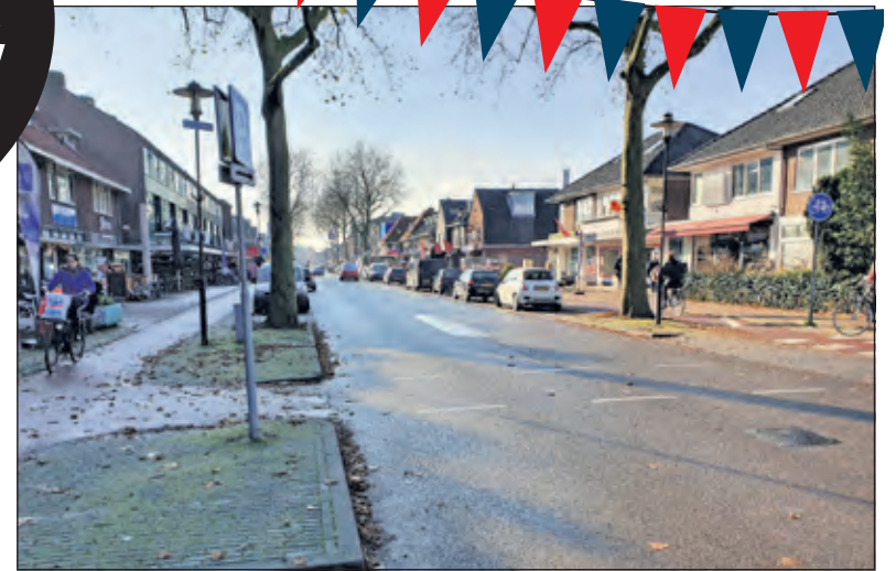
De winkeliers op de Hessenweg heten iedereen van harte welkom tijdens Black Friday.

Meer informatie over alle deelnemende winkels in De Bilt: blackfridaydiscounts.nl