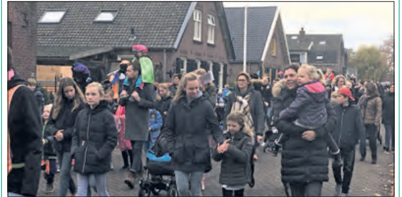
Kleine kinderen, grotere kinderen, ouders, opa en oma's: heel Westbroek leek wel uitgelopen om Sint en zijn Pieten welkom te heten. Na het inhalen volgde nog een fijn kinderfeest in het Dorps huis.

Sint werd binnengereden door Takel en kon daarna – samen met de wethouder – aan het hoofd van de optocht plaatsnemen voor een ritje naar het dorps huis. Daar werden de kinderen de rest van de middag aangenaam bezig gehouden.