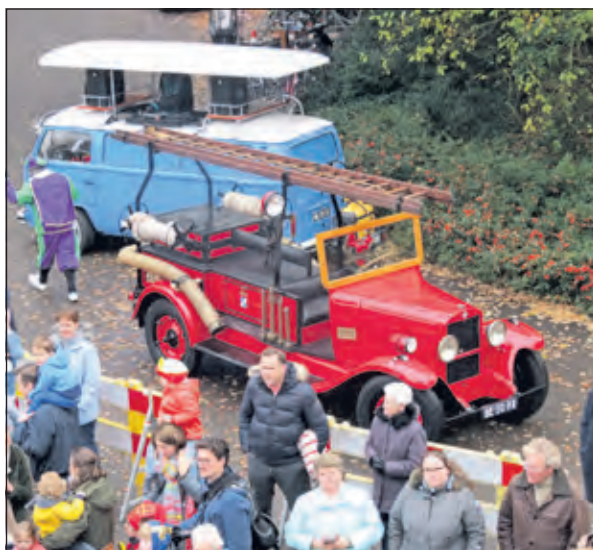
De oude brandweerauto waarmee Sinterklaas naar Jagtlust kwam.