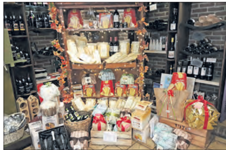
Bij Ploeger hangt er volop kerstsfeer.

'Maar als je op Black Friday niet in de gelegenheid bent, kan je in december altijd nog profiteren van leuke cash-back acties. De komende weken blijft het leuk shoppen', meldt Berry tot slot.