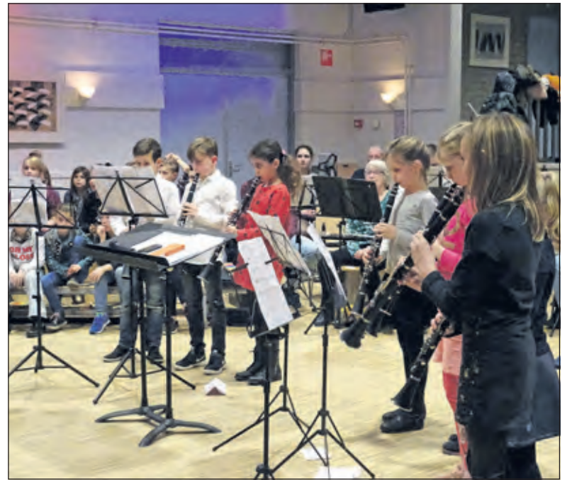
Geconcentreerd spelen de kinderen van de klarinetgroep hun oefennoten voor zij met het harmonieorkest gaan spelen.

leerling eerst een noot spelen en vervolgens een aantal noten met elkaar. Daarna werd met het harmonieorkest een bekend nummer gespeeld. Zo ook met slagwerkgroepen waar noten en ritmes vooraf gespeeld werden. Bekende nummers als: Happy, I feel good, Big big world en Havanna werden met veel enthousiasme door de kinderen meegespeeld met het orkest. In de Finale speelden alle kinderen mee met bekende nummers als: We will rock you en We are the champions. Een mooi optreden voor alle kinderen en bezoekers.