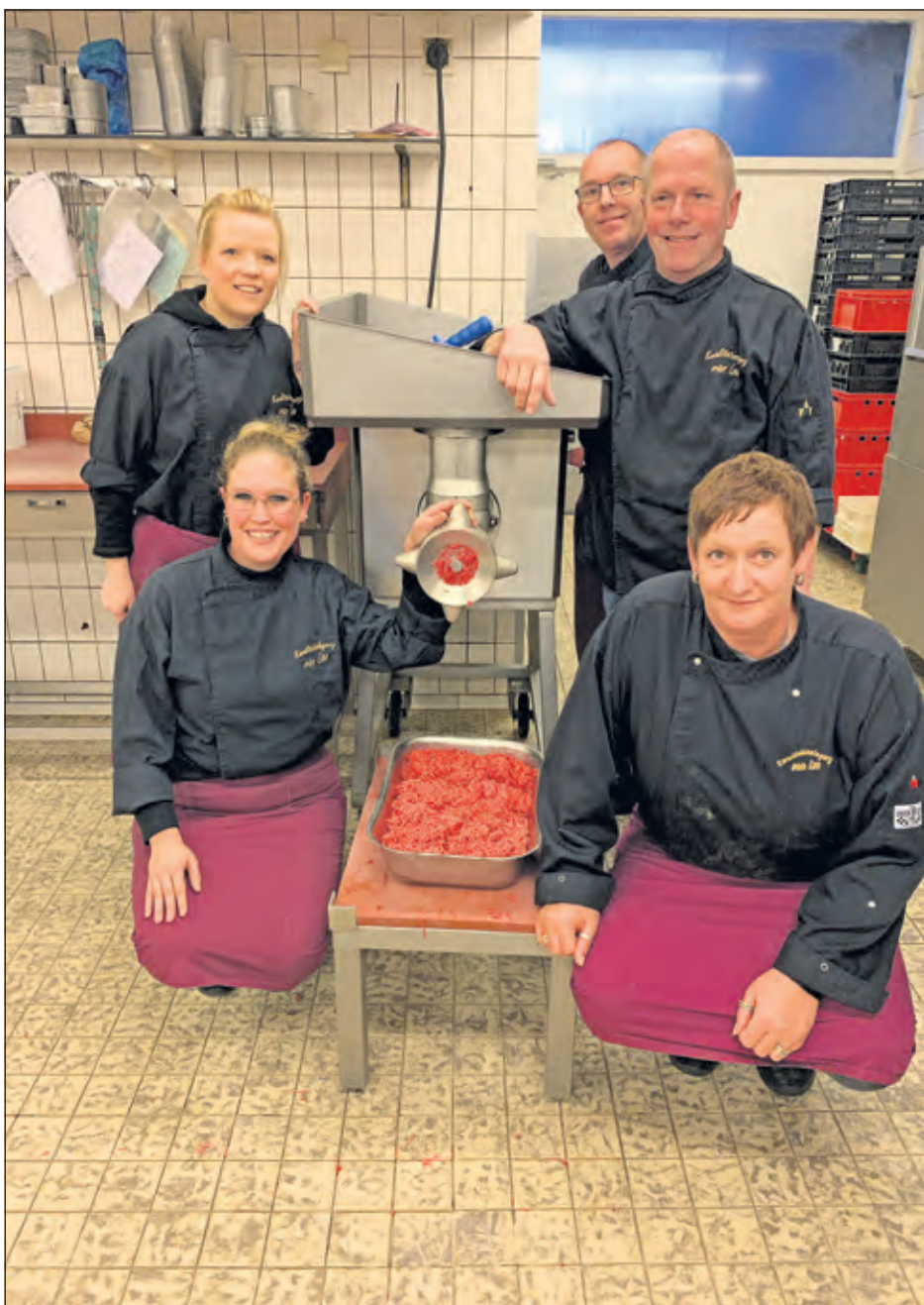
Het rundergehakt van Van Loo wordt met zorg gedraaid.

Het aantal mogelijkheden met gehakt is onbeperkt en nodigt uit tot creativiteit. De standaard bal is natuurlijk heerlijk in combinatie met groenten of lekker bij stampot, het kan verwerkt worden in een ovenschotel met aardappels en groente of in de lasagne maar is ook heerlijk om paprika's mee te vullen, enchilada's of nachos mee te maken. Super snel en makkelijk is een gevuld stokbrood: je holt een afbakstokbrood uit en vult dat met een mengsel van geruld gehakt, bosui, paprika, mais en knoflook. Schep er 3 eetlepels saus doorheen (bijvoorbeeld bbq saus), vul het stokbrood en bak het af in de oven tot het brood bruin is en de kaas gesmolten. Eet smakelijk.