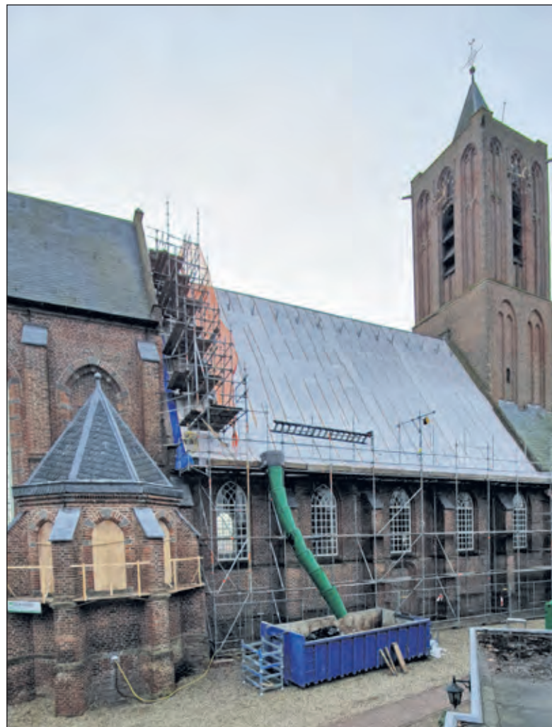
De restauratie van het dak is eind september begonnen en wordt naar verwachting in februari afgerond.