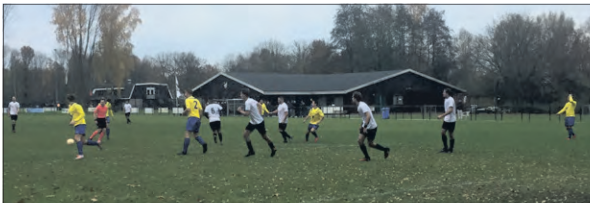
SVM overklast de gastheren.

Roy Wijman vrij die met een verwoestend schot binnen een kwartier voor de 0-2 tekende. Goaltjesdief Jordy van der Lee maakte 0-3. Met wat meer nauwkeurigheid had de uitslag nog hoger uit kunnen uitvallen. Het moegestreden BZC 31 probeerde het nog wel, maar moest ook nog met 10 man verder door een rode kaart. SVM toonde de tweede helft de juiste mentaliteit. De volgende week komt het Utrechtse HMS op bezoek.