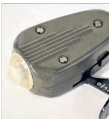
Wie kan zich nog spannende verhalen bij een knijpkat herinneren.