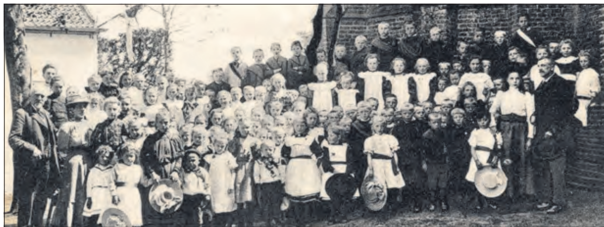
Eeuwenlang heeft de kosterswoning achter de kerk als school gediend voor Westbroek en Achttienhoven.

een rijkssubsidie, die alleen benut kon worden als alles voor het eind van 2020 klaar zou zijn. Eind september zijn we aan de slag gegaan met gespecialiseerde aannemers en we hopen in februari dit deel van de restauratie afgerond te kunnen hebben'. De eeuwenoude kerk van Westbroek heeft dan weer gedeeltelijk een nieuw leidendak, maar ook is de houtconstructie van het dak waar nodig vervangen. Er is dan wat metsel-