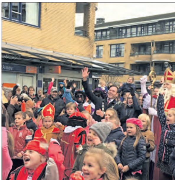
Na een rondje door het dorp werd het pas echt feest op het Maartensplein in Maartensdijk. Daar zorgde enthousiaste Pieten en muziek voor een vrolijk feest waaraan ook de Sint en de burgemeester en de kinderborgemeester plezier aan beleefde.