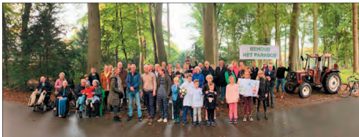
Groenekan protesteerde in oktober 2019 tegen de geopperde bouwlocatie.

vergroten en gezamenlijk te werken aan woningbouw indachtig een duurzame woon- en leefomgevingskwaliteit. Daarnaast is het nodig dat trajecten als Participatie, Woononderzoek, Redactie Opbrengst Gebiedsbijeenkomsten en Digitale Kanskaart in samenhang worden uitgewerkt en uitgevoerd en dat er geen 'cherry-picking' (discussietactiek waarbij bewijzen, uitspraken of feiten selectief genoemd worden om een standpunt te verdedigen) plaatsvindt: 'niet het recht van de sterkste geldt of dat beslissingen op de ene plek nadelige gevolgen hebben voor een andere plek'.