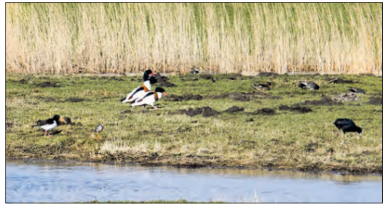
Bergeend man en vrouw.

je nu zo mogelijk nog meer. Dat doen ze om hun territorium aan te duiden. Op 15 maart begint het officiële broedseizoen. Dat betekent voor natuurbeheerders dat er niet meer gezaagd en gesnoeid mag worden in bomen en heesters. Maar het betekent ook dat het nu nóg belangrijker is dat bezoekers van natuurgebieden op de paden blijven. Want het opvliegen bij verstoring kost vogels veel energie. Energie, die ze nu hard nodig hebben voor het bouwen van nesten en het vinden van een partner. Bovendien, als grondbroedende vogels, zoals veldleeuwerik, nachtzwaluw, boompieper en roodborsttapuit op Heidestein, worden verstoord, kan dit betekenen dat ze niet meer terugkeren naar het nest. De eieren worden niet meer uitgebroed of de jongen worden niet meer gevoed.