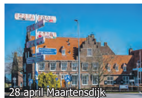
28 april Maartensdijk