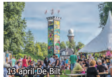
13 april De Bilt

Reserveer de datum en meld u alvast aan. Dat kan via de website doemeedebilt.nl (bij Agenda); of via mailadres omgevingsvisie@debilt.nl . Vermeld svp ook de kern waar u woont en/of werkt.