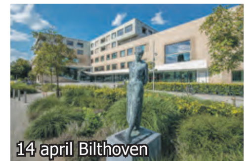
14 april Bilthoven