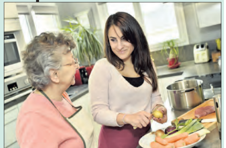
Samen koken kan met een beetje extra hulp van UWassistent.

'UWassistent' is een nog niet zo bekende naam in De Bilt. UWassistent regelt ondersteuning voor die inwoners van onze gemeente, die nét een beetje extra hulp nodig hebben om zelfstandig te blijven wonen. Van huishoudelijke hulp tot een kookmaatje, van tuinklus tot gezelschap. En mantelzorgondersteuning, niet te vergeten! UWassistent doet wat nodig is.