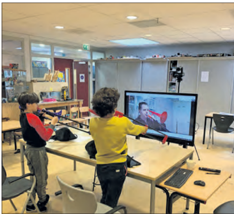
Kinderen bespelen interactief hun instrumenten.

Een bijzonder initiatief is Creatief Digitaal, het online platform van Kunst Centraal met een aanbod om zowel thuis als in de klas, met ouders of eigen leerkrachten, te genieten van verschillende kunstvormen. Het KunstenHuis voorzag de Juliana-school en Wereldwijs van filmpjes waarin de muzikanten van het Kunst Orkest de ingestudeerde liedjes voorspeelden, zodat de leerlingen er thuis of op school mee aan de slag konden. Op deze manier konden de leerlingen verder spelen zolang er nog geen ruimte was om externe muzikanten in de scholen te ontvangen. Inmiddels worden de lessen live online gegeven en is er direct interactie mogelijk tussen de kunstdocent en de leerling. 'Hoe geweldig iedereen inzet ook is, het is te hopen dat alle leerlingen zo gauw mogelijk weer kunnen genieten