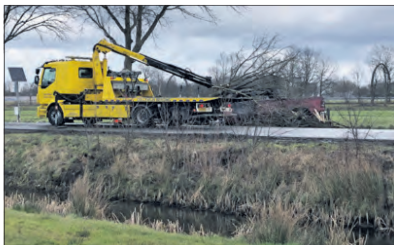
De brandweer heeft de boom die over de auto lag, afgezaagd waarna de berger de auto kon afvoeren.

De boom brak af en werd door de auto nog zo'n meter of 10 meegevoerd. Vervolgens vloog de auto in brand. De chauffeur en de passagier konden op tijd uit de auto komen, maar waren beide licht gewond. Uiteindelijk zijn ze met een ambulance naar het ziekenhuis gebracht. De Pick-up leverde een gevaar voor de snel gearriveerde brandweer, want er zat een LPG installatie in de achterbak. Het duurde geruime tijd voor de brand onder controle was. De rookpluim was van vanaf de A27 duidelijk zichtbaar. (zie video op www.vierklank.nl )