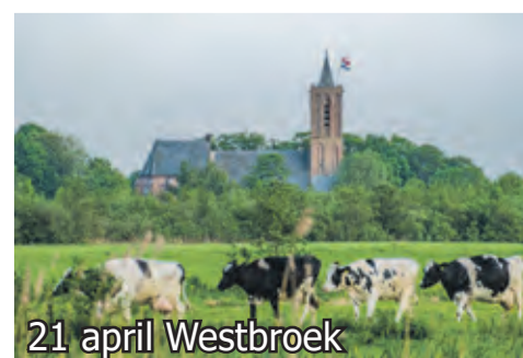
21 april Westbroek