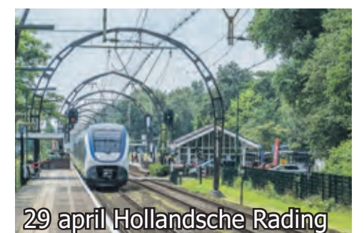
29 april Hollandsche Rading