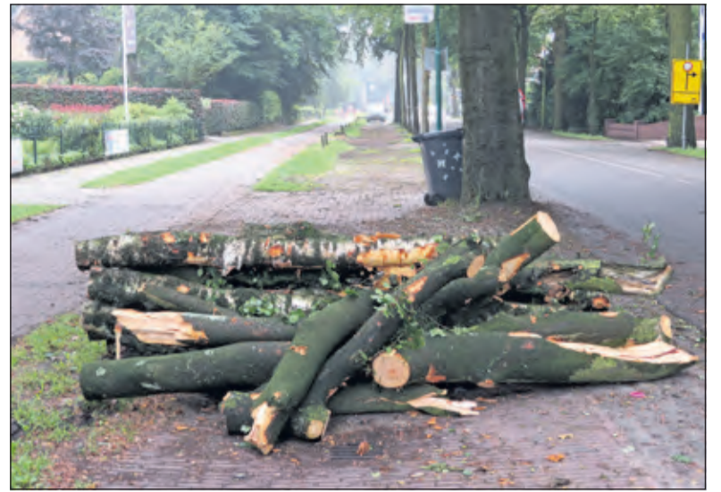
Uitgebreid debatteren over bomenkap.

De burgemeester zegt bomen heel belangrijk te vinden en een warm hart toe te dragen, zeker ook om de