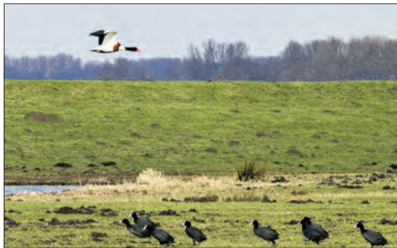
Bergeend man in vlucht.

Ook op Park Vliegbasis Soesterberg is het een vrolijke boel. Je hoort de veldleeuweriken hun hoogste lied zingen. En dat letterlijk! Eerst vliegen de mannetjes al zingend