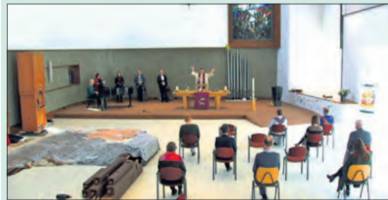
Dienst vanuit eigen huis.

Vanwege de coronamaatregelen zijn de diensten voorlopig alleen online te volgen. Tijdens de verbouwing werden de diensten opgenomen in de Katholieke Michaëlkerk aan de Kerklaan. (Rob Jastrzebski)