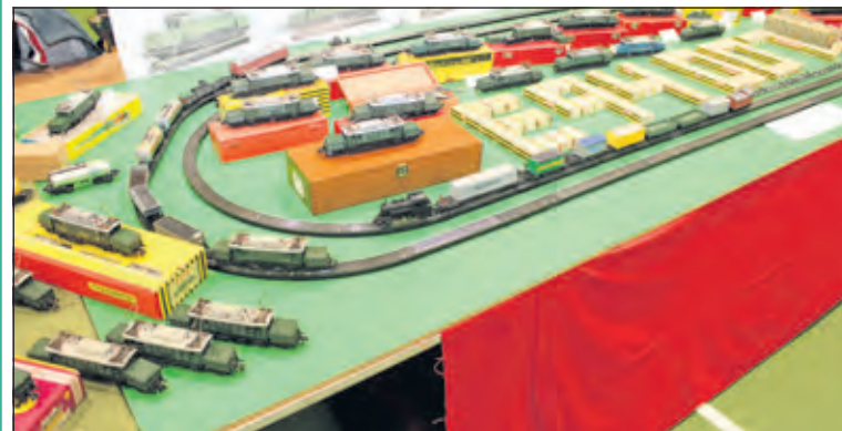
Op de tafels was er voldoende te zien.

Op de tafels lag er een keur aan kleine en grote 'zoldervondsten' die misschien wel via Sint Nicolaas een nieuwe eigenaar kregen. Een deskundige reparatieploeg gaf advies en voerde ter plekke kleine reparaties uit aan meegebracht materieel.