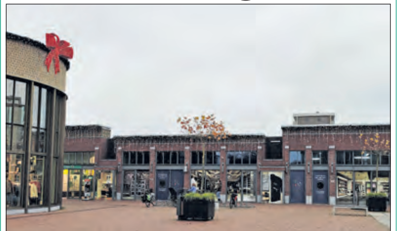
Het is zaterdag 20 november; Sint Nicolaas heeft zojuist op het Vinkenplein in Bilthoven een corona-persconferentie gegeven. Ik ga nog even vlug naar de Kwinkelier en vraag mij of ik nu toch al in Kersttijd ben gearriveerd. [Henk van de Bunt]