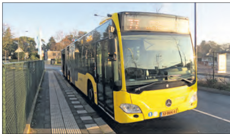
Lijn 77 rijdt nu nog langs station Bilthoven.

Op korte termijn verandert voor busreizigers in Bilthoven toch één en ander. Lijn 78 (Bilthoven-Noord) wordt vanaf 12 december door de provincie Utrecht uit de dienstregeling genomen, omdat er te weinig gebruik van wordt gemaakt. Er komt U-flex voor terug, een soort belbus waarmee gebruikers naar het station kunnen reizen. Daar kan worden overstapt op de trein, op lijn 77 of op andere buslijnen. Daarnaast kunnen gebruikers van U-flex ook rechtstreeks naar andere bestemmingen in Bilthoven reizen.