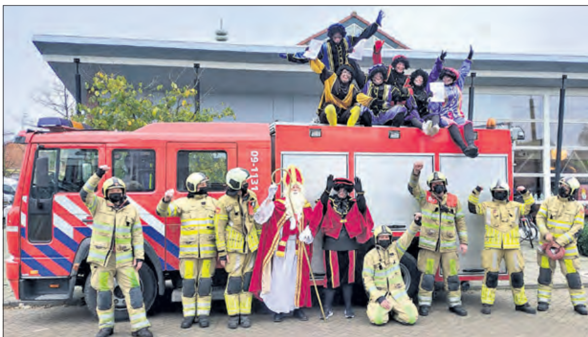
Sint werd op een veilige manier onthaald in Westbroek.

Alleen bij de groepsfoto na afloop werd de anderhalve meter even vergeten, maar gelukkig hadden alle vrijwilligers en organisatoren die ochtend vrijwillig een zelftest gedaan. Met dank aan de eigenaar en de omwonenden van Molen de Kraai, het Dorpshuis, de Vriendenkring, de vrijwillige Brandweer van Westbroek en Tienhoven, de verkeersregelaars en andere helpers én de ondernemers, die hebben bijgedragen in de kosten. (Jan Maasen)