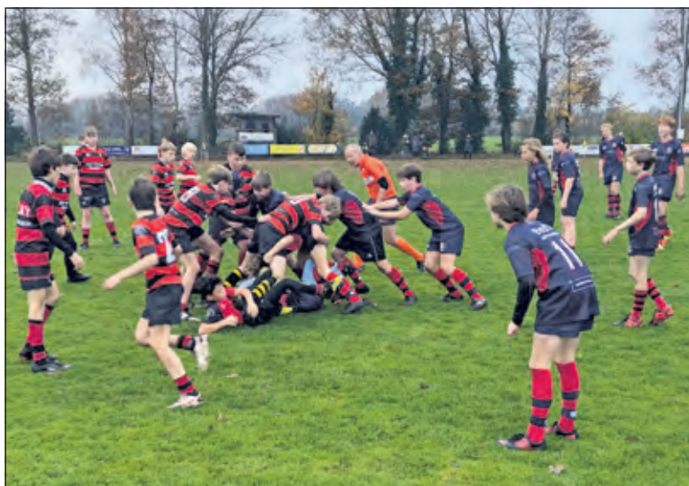
Stichtsche zet een aanval in tegen het team uit Drenthe wat goed verdedigt.

Afgelopen weekend waren de Stichtsche jongens, na een lange rit en vroeg opstaan, om 11 uur klaar voor hun partij in Drenthe tegen een mixed team van Dwingeloo/Havelte. Dat ze er zin in hadden bleek al snel. Na nog geen 10 minuten waren er al 2 Tries gemaakt en een conversie waardoor de stand 0-12 was voor SRFC. De tegenstanders waren goed maar misten de snelheid in de verdediging en de aanval, waardoor het Stichtsche met regelmaat lukte om punten te scoren. Snelle passes, goede aanvallen en stevige tackels met balwinst zorgden ervoor dat het voor de rust met 22 punten voorstond op