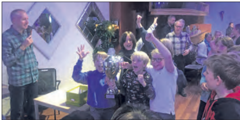
Montessori 1 overtuigend winnaar van het schoolschaaktoernooi.

men. Montessori1 kreeg daarnaast de wisselbeker en de vijf spelers mogen vijf maanden lang gratis bij schaakvereniging DBC komen meespelen. (Joop Faber)