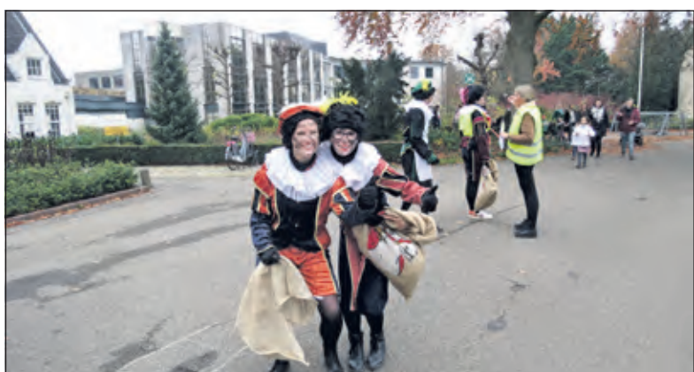
Roetveegpieten vermaken de in de rij staande kinderen.