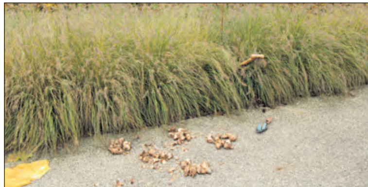
Grote hoeveelheden bollen wachten om gepoot te worden.