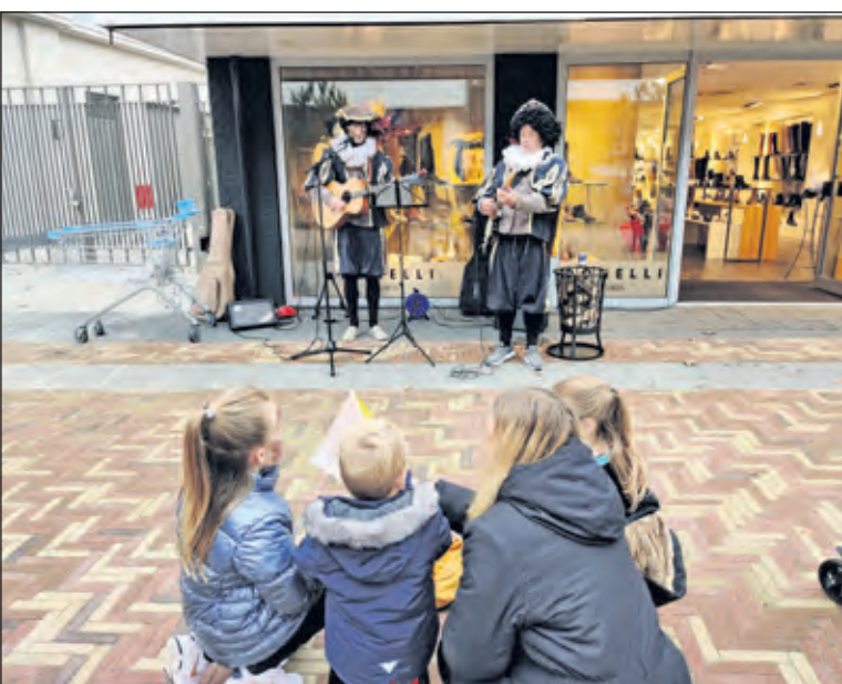
Terwijl Sinterklaas een videoboodschap voor RTV De Bilt insprak speelden en zongen twee van zijn Pieten moderne Sinterklaasliedjes in de Vinkenlaan in Bilthoven. [HvdB]