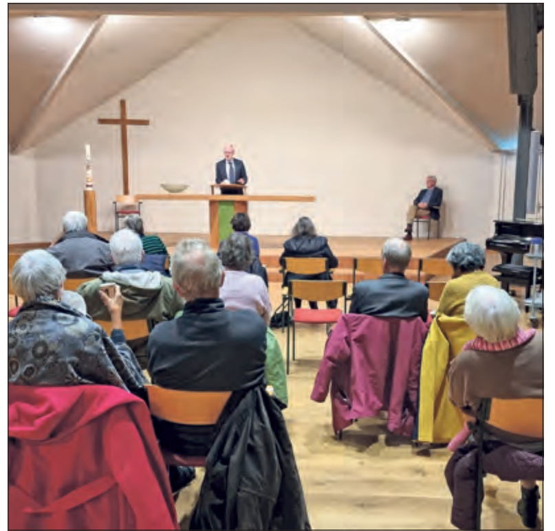
Het publiek volgt de voorlichting aandachtig.

Hierover was Maarseveen duidelijk. 'Door het massale wereldwijde gebruik van het vaccin tot nu toe, konden bijwerkingen op deze termijn heel goed worden geïnventariseerd', vertelt hij. 'Deze blijken