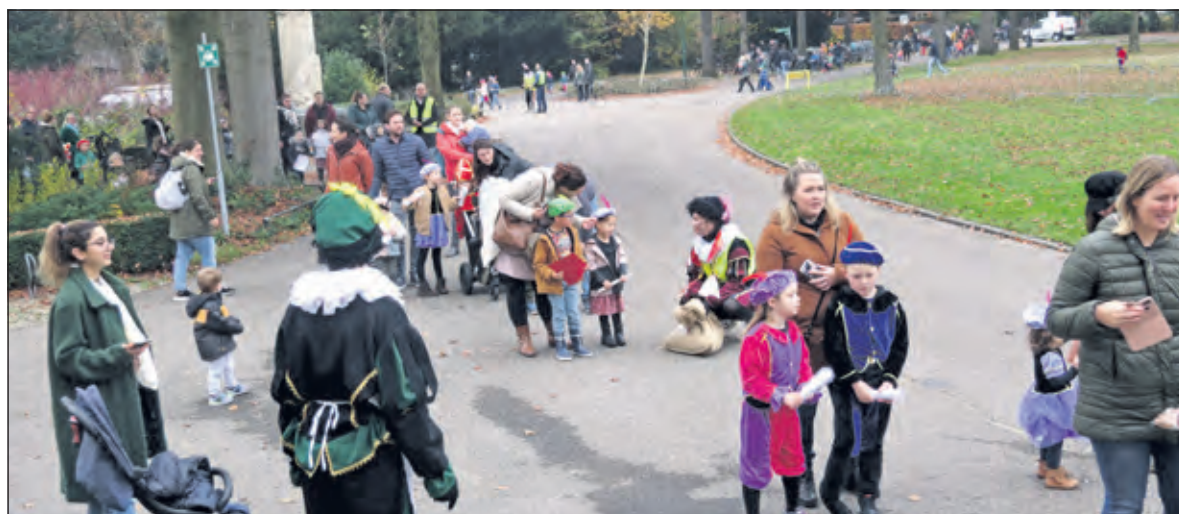
In groepjes worden de kinderen naar de Sint geleid.