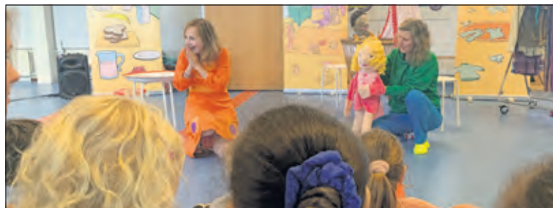
Les in gebarentaal is helemaal niet moeilijk maar juist heel erg leuk en super aandoenlijk.

Vorig jaar startte Stichting Duco dus met de ultieme vorm van inclusief onderwijs voor kinderen in de leeftijd van 4 tot 12 jaar met een ontwikkelingsachterstand en/of een (meer-voudige) beperking. Wanneer kinderen mét en zonder handicap samen leren en spelen op dezelfde school, leggen we het fundament voor een inclusieve samenleving. Op school begint bewustwording en contact. Door het wegnemen van drempels in het onderwijs, bevorderen we contact met iedereen. Zo leren kinderen dat mensen met een beperking niet ‘raar’ zijn. Iedereen is anders, iedereen hoort erbij.