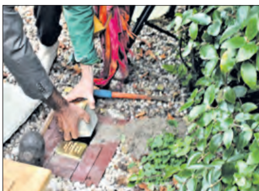
Eerder werden er al 15 struikelstenen gelegd in De Bilt.

Demnig noemt ze Stolpersteine omdat je er, in figuurlijke zin, over 'struikelt' met je hoofd en je hart en omdat je je moet bukken om de tekst te kunnen lezen. Alles vanuit de gedachte 'Zolang wij hen ge-