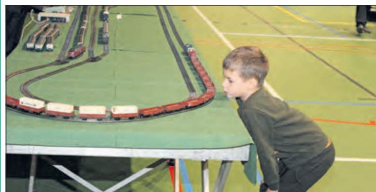
Voor kinderen smullen geblazen omdat alles zich op normale tafelhoogte afspeelt.