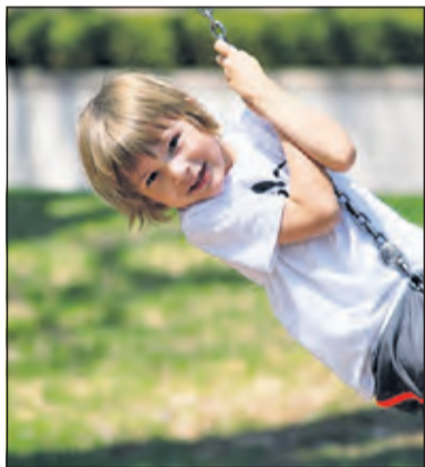
Speelplekken in de gemeente worden aantrekkelijker.