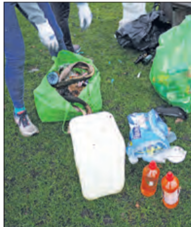
Ploggen: afval rapen en hardlopen tegelijk. Goed voor de conditie en het ruimt op.