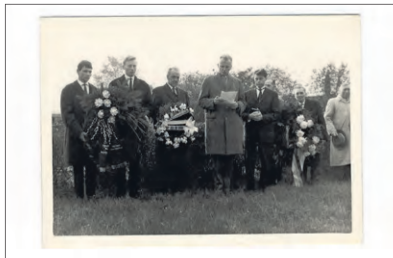
Het dorpje Ladelund (ansicht).