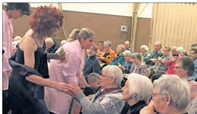
Tot ieders genoegen trakteerden acteurs en medewerkers van de toneelvereniging de Zonnebloemgasten in de pauze op koffie met wat lekkers. Na afloop was er nog een drankje waaronder het bekende glaasje advocaat.

gewoon doordraaien en is er wel personeel nodig. En dan is er nog een probleem. Zijn zij wel de enige erfgenamen? Nap: 'Al met al zijn er problemen genoeg voor Berend en Willem. De problemen in deze klucht veroorzaken weer de meest absurde situaties'.