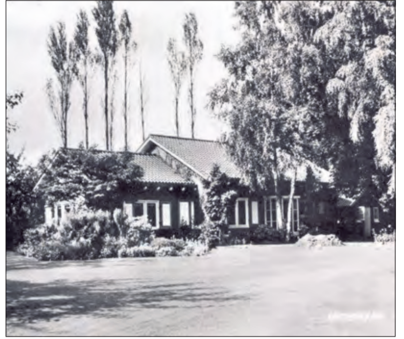
Kastanjelaan 1 ('t Eiland) uit 1965 te Groenekan.