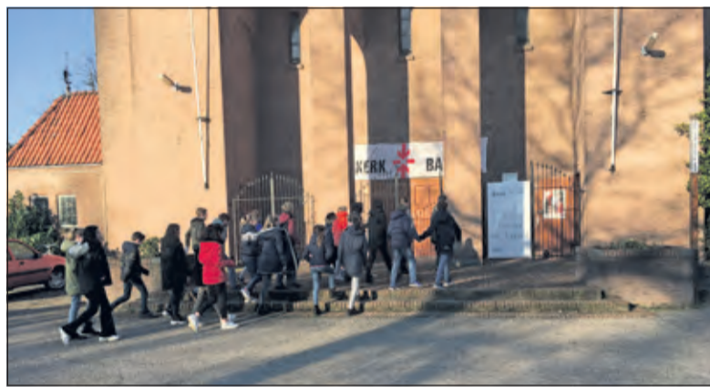
Schoolkinderen betreden de Michaelkerk om de film Blue Bird - een leerzame film over pesten - te zien.

Op de vrijdagochtend werd Blue Bird door meer dan 240 schoolkinderen en enkele volwassenen ademloos bekeken. Dat het thema van deze film, pesten, tijdloos is, bleek wel uit de reactie van de volwassen bezoekers die ochtend. Een bezoeker van 90 jaar oud vertelt: 'Ik werd vroeger altijd als laatste gekozen met de gym. Het heeft lang geduurd voordat ik het pesten achter mij kon laten. Het heeft mij gevormd voor de rest van mijn leven.'