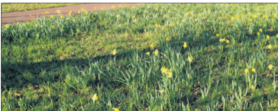
Op een grasveld langs de Soestdijkseweg in De Bilt kondigen de narcissen het naderend voorjaar nu al aan.