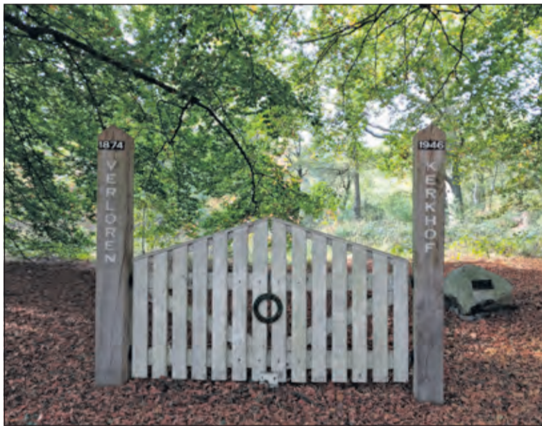
Het Verloren Kerkhof ligt aan de rand van Bilthoven, naast de parkeerplaats van Recreatieterein De Leijen, aan de Eijckensteinselaan.

Op zaterdag en zondag 18 en 19 april kan iedereen zelf deze reis maken door de gemeente De Bilt. Kaarten voor muziektheaterfestival HiStories zijn vanaf 2 maart verkrijgbaar via online ticketverkoop. Kijk ook op de Facebookpagina.