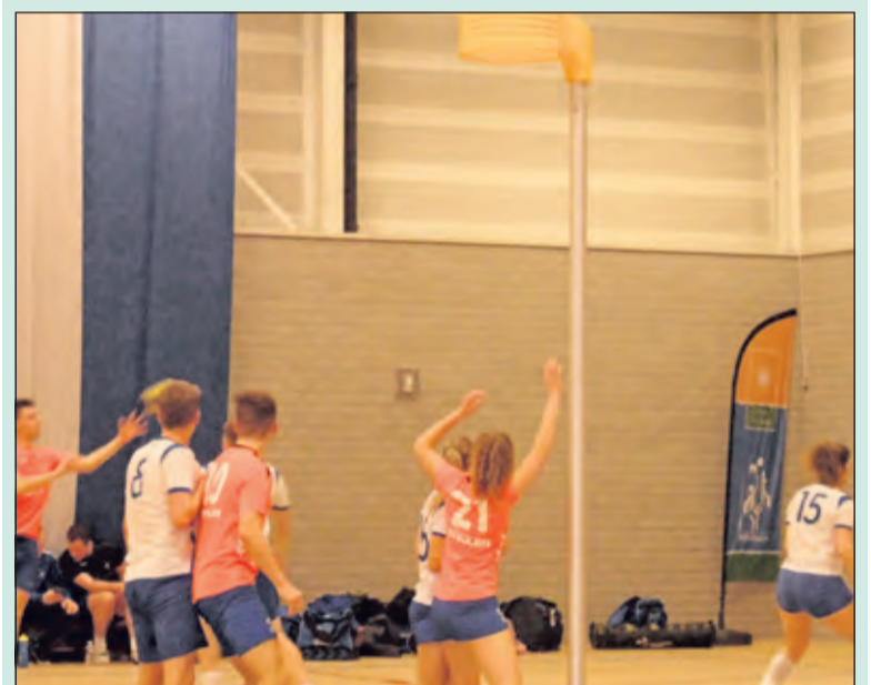
DOS was in Kampen niet bij de les.

Volgende week speelt DOS tegen De Meeuwen; zij staan op de tweede plek, net een plaatsje hoger dan DOS. De wedstrijd in Putten begint om 20.00 uur