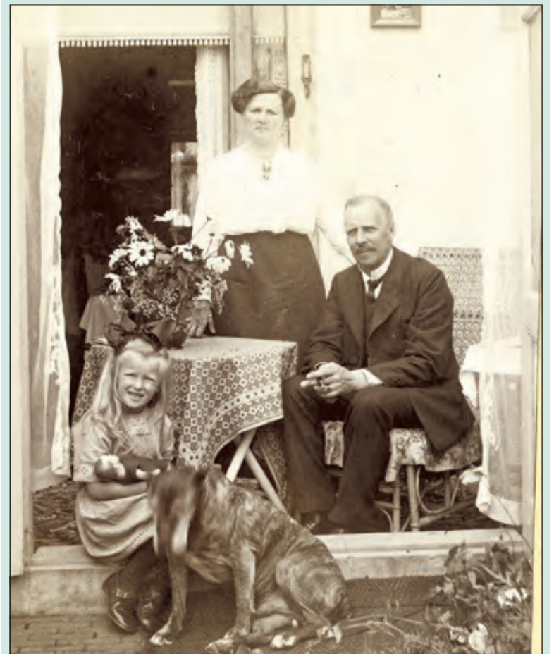
Zoeken naar voorouders wordt makkelijker dankzij gedigitaliseerde informatie. (ca. 1915)

Vanwege de grote belangstelling voor zo'n cursus stamboomonderzoek wordt er nu een tweede groep opgestart vanaf vrijdag 13 maart. Informatie daarover en aanmelden kan via aanmelden@rhcvechtenvenen.nl . Komen voorouders niet uit deze regio? Geen probleem. Juist omdat er met veel digitale bronnen aan de slag gegaan wordt, is er ook toegang tot veel informatie in het hele land. De cursus wordt afgesloten met een rondleiding door het archiefdepot.