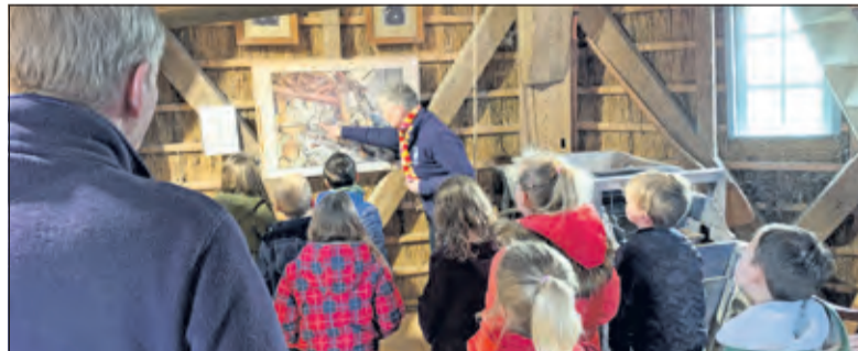
Kinderen volgen binnen aandachtig de uitleg via een oude plaat.

De leerlingen hebben geleerd hoe de molen werkt en ze heb-