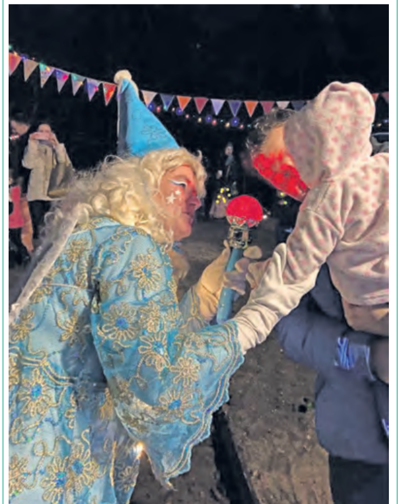
Op 30 januari vierde kinderopvang De Bilt het Winterfeest. Een traditie die in samenwerking met de oudercommissie is voortgezet. Om het feest compleet te maken kwam de Winterfee langs met licht en warmte in deze donkere dagen. (Erika Roodenburg)