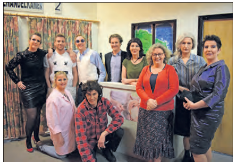
De cast zorgt weer voor veel plezier tijdens de uitvoering.

De tante, tante Bella van Berend en Willem is overleden. Berend en Willem hebben hier niet zo erg om gerouwd, want een band met tante hadden zij niet. Sterker nog, eigenlijk zijn zij wel blij met haar overlijden, want zij hebben nu een erfenis. Deze erfenis bestaat uit een verpauperde beautysalon. Berend is ervan overtuigd dat de beautysalon met een likje verf en wat kleine aanpassingen voor goud geld te verkopen is. Maar is dit wel een goed plan? Immers, tot de verkoop moet de beautysalon wel