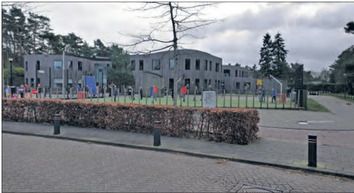
De nieuwe Theresiaschool (bouw 2008) had met de opbrengst van de oude school gefinancierd moeten worden.

dingsoverleg. We gaan toetsen om daarna een reële en structurele begroting 2021-2024 vast te kunnen stellen, dat wil zeggen dat structurele lasten gedekt worden door baten. Onzekere factoren zijn de uitkering van het Rijk aan de gemeente en ontwikkelingen rond het sociaal domein. Richting het Rijk geven wij aan dat door met name