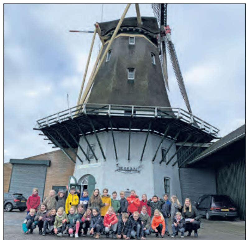
Leerlingen uit groep 4 bij molen De Kraai in Westbroek.

Buiten op de omloop is er aandacht voor de werking van de wieken. Er stond te weinig wind om de molen echt te laten draaien.