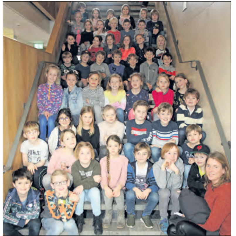
Leerlingen van de Julianaschool en Werkplaats Kindergemeenschap op de trap in Het Lichtruim.

De roep om creatieve mensen wordt in de toekomst alleen maar groter en daarom willen scholen en gemeenten de creativiteit van kinderen stimuleren. En wie kunnen dat beter dan kunstenaars zelf? Daarom organiseert Kunst Centraal ook in De Bilt voor basisscholen ontmoetingen tussen kinderen en kunstenaars. De theatrale muziekvoorstelling Caravan is een voorbeeld van zo'n ontmoeting waarbij kinderen verleid worden buiten de lijnen te denken en ze te stimuleren om op een andere manier naar de wereld te kijken. [HvdB]