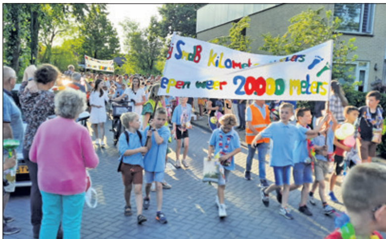
Scholen achter de muziek op het laatste stuk aan de Dierenriem in Maartensdijk.