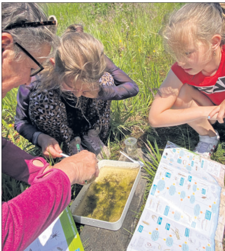
De geschepte diertjes worden in een bakje gedaan.

De werkgroep hoopt dat de waterplanten zich uitbreiden en dat er volgend jaar meer en meer verschillende waterdiertjes aanwezig zullen zijn. (Yvonne Mathot)