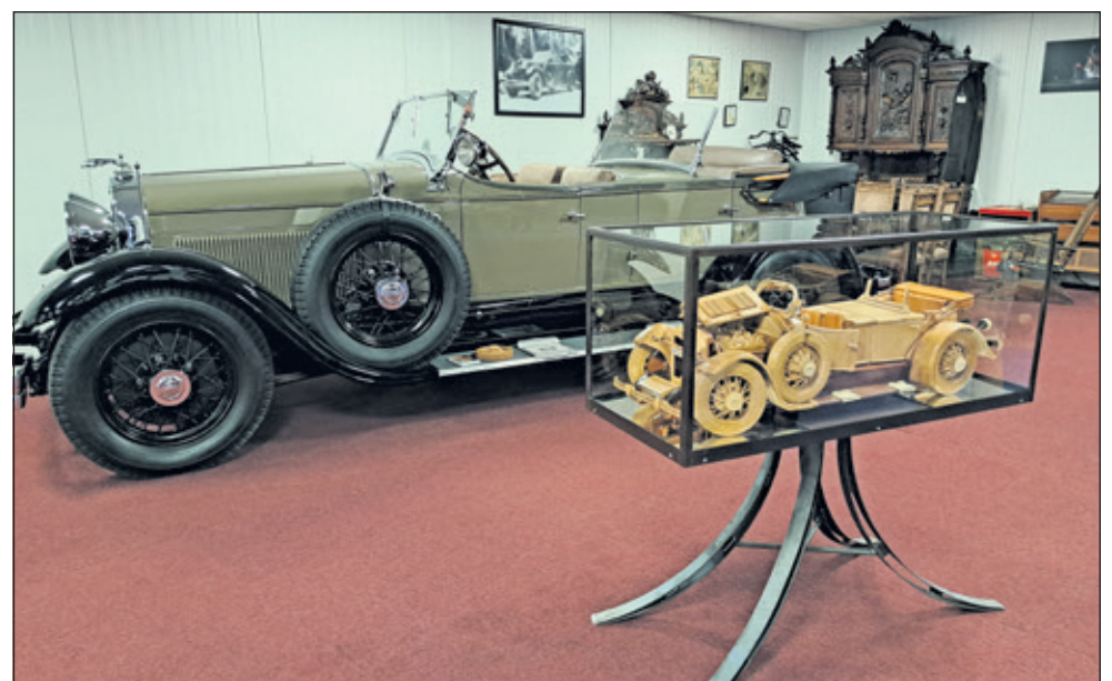
De Lincoln heeft een plek in een op maat gemaakte vitrinekast gekregen.