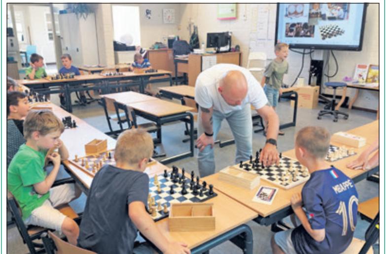
Afgelopen vrijdag namen de kinderen het op tegen een van de vaders tijdens de schaaksimultaanseaanse. Van deze schaakmeester ontvingen zij allemaal het Martin Luther King Schoolschaakdiploma.

Op de Martin Luther Kingschool in Maartensdijk hebben de leerlingen de afgelopen weken dagelijks schaakles gehad van hun eigen juf. Aan de hand van het boek 'lang leve de koningin' en bijbehorende film leerden de kinderen over de verschillende schaakstukken en hoe deze over het bord mogen bewegen. Zelfs de codes zijn bekend en een uitspraak als 'het paard van b8 naar c6' is in het lokaal van de 7-jarigen dus ook niet gek. (Kim de Mos)