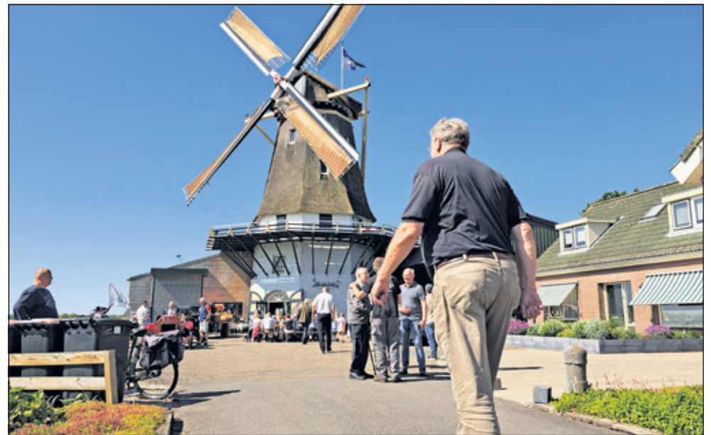
Drukte bij de molen tijdens het evenement.