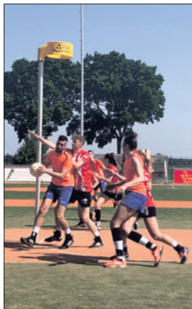
DOS wint uiteindelijk met 9-7.

Maar dan komt het bericht dat Sporting/Delta de wedstrijd tegen Fiks ook winnend heeft afgesloten en zo hebben de laatste wedstrijd maar liefst 4 teams nog kans op een extra potje; DOS moet dus a.s. zaterdag in Pijnacker, tegen Avanti (1 van die 4) sowieso winnen. (Fred van Ettikhoven)