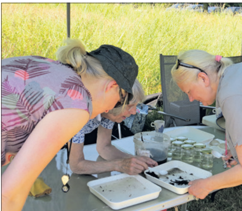
Alles wordt aan een nauwgezet onderzoek onderworpen.