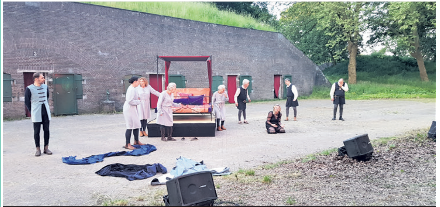
Als prinses Restituta (op de grond) is afgewezen door haar minnaar (geheel links), beschuldigt ze hem valselijk van aanranding.