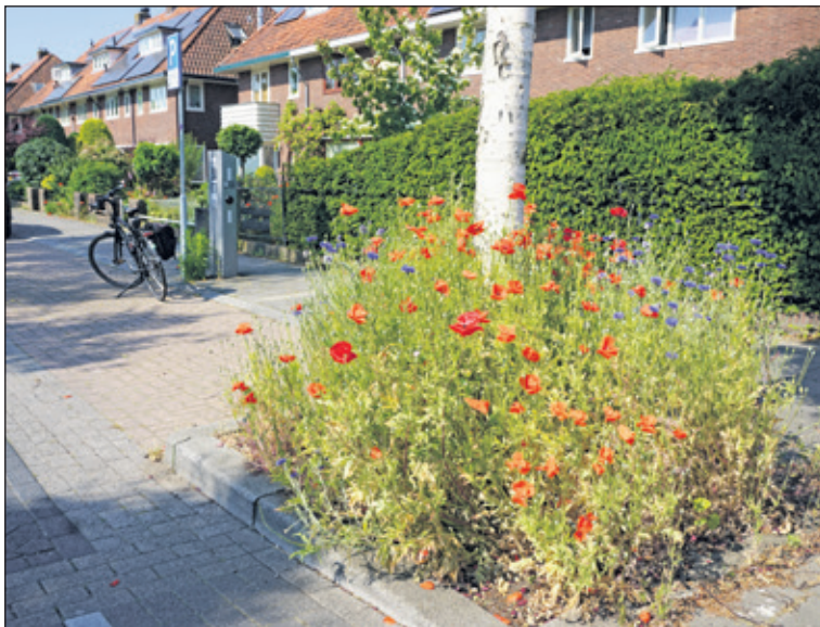
Langs de Waterweg in De Bilt staat deze bloemenzee in de boomspiegel van een berkenboom; de stam van de berk is fraai omringd door klapprozen.