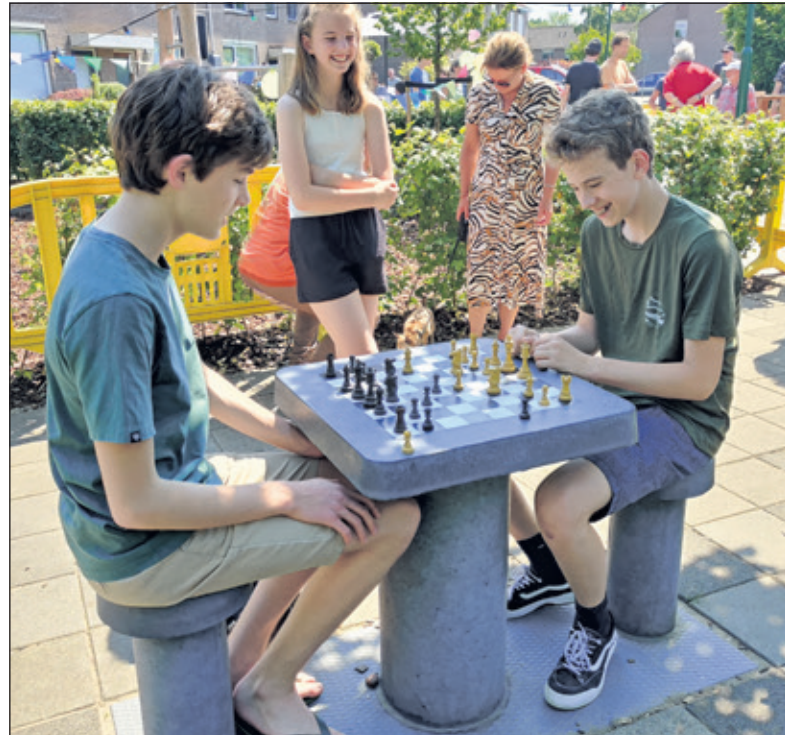
Tijdens de opening wordt al direct van de tafels gebruik gemaakt.

satie: 'Het schaken heeft positieve effecten op de concentratie, op het brein en de schoolprestaties van kinderen. Niet alle kinderen krijgen het schaken van huis uit mee, ook wordt schaken nog niet op alle scholen aangeboden, laat staan dat kinderen lid zijn van een schaakclub. De publieke schaaktafels in de openbare ruimte maken het schaken zichtbaarder en toegankelijker voor kinderen. De schaaktafels in de openbare ruimte helpen om eenzaamheid tegen te gaan. Ook dragen de schaaktafels bij aan het fit houden van het brein. De schaaktafels zorgen voor