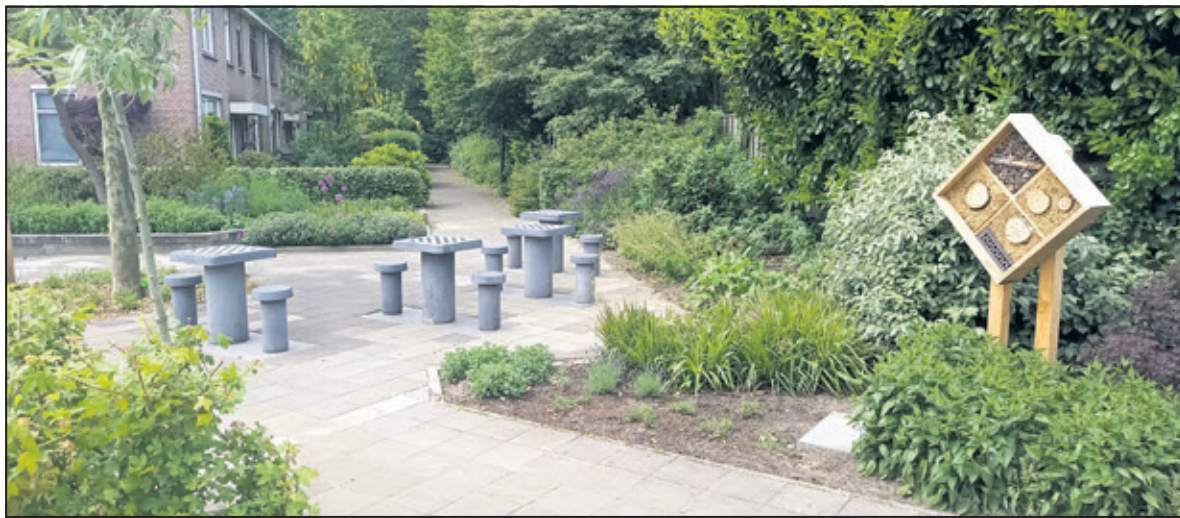
De speeltuin met de schaaktafels die door Univé Buurtfonds gefinancierd zijn.