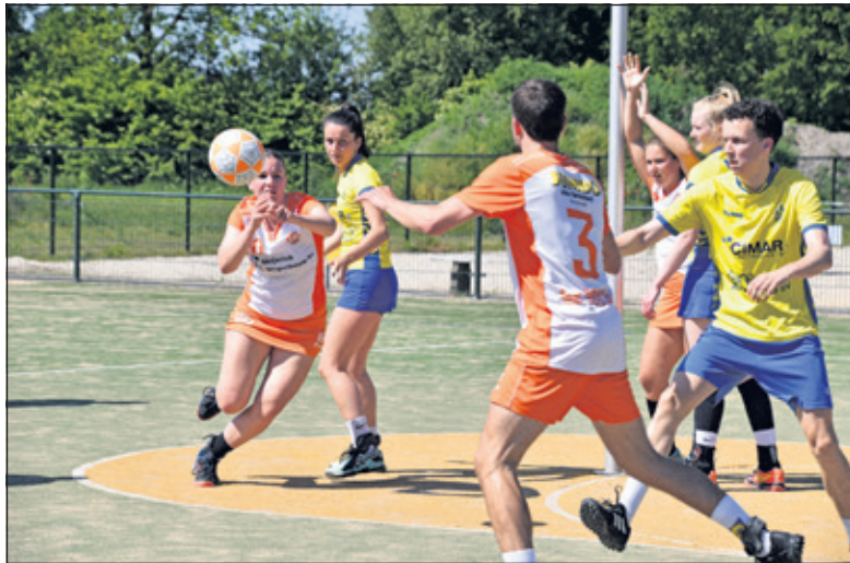
TZ verliest opnieuw van SKF.

De periode na rust was voor SKF. Zij gaven duidelijk iets meer gas en wisten voor te komen. Dit gat is uiteindelijk niet meer gedicht, ondanks het gelijkwaardige spel. De wedstrijd eindigde in 15-17. Er kan teruggekeken worden op een sterke wedstrijd waar TZ echt als team hun kracht toonde. Helaas net niet