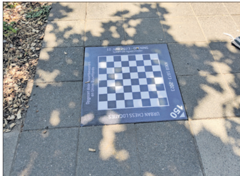
Het bewijs van de ingebruikname is in steen en in de grond verankerd.

en ouderen biedt Urban Chess elke zondag om 11 uur de mogelijkheid aan om in de speeltuin te komen schaken. Als het regent gaat het niet door. Natuurlijk is het ook mogelijk om zelf af te spreken met iemand. Verder is er ook een WhatsApp groep waarin je kunt vragen om met iemand te schaken. Als je een berichtje stuurt naar Bauke Sangers op 06 10897034, kan je toegevoegd worden aan de groep en zo word je ook op de hoogte gehouden van nieuwtjes, workshops en bijeenkomsten.