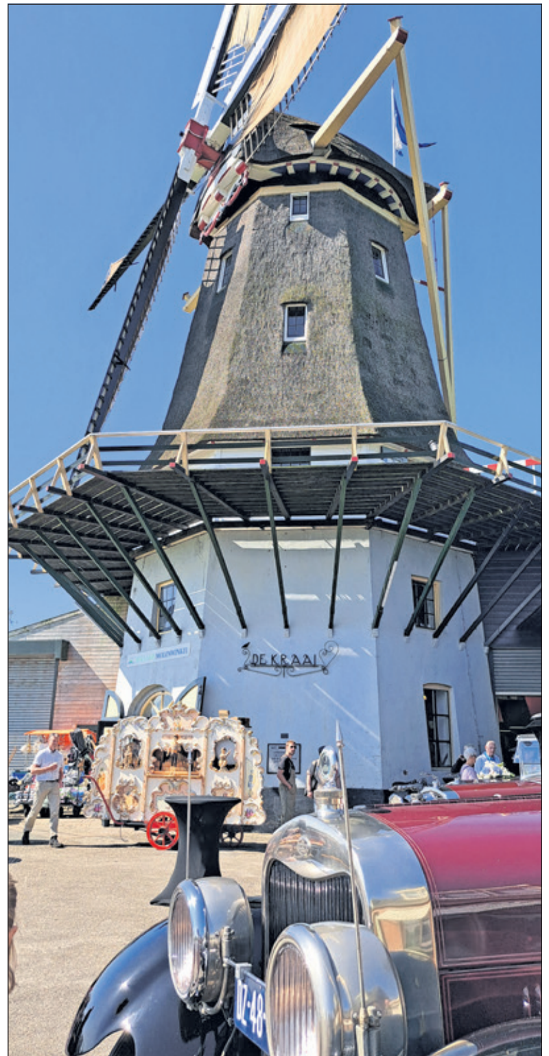
Met het draaiorgel erbij is het nostalgie ten top.

Kijk voor meer foto's op www.vierklank.nl