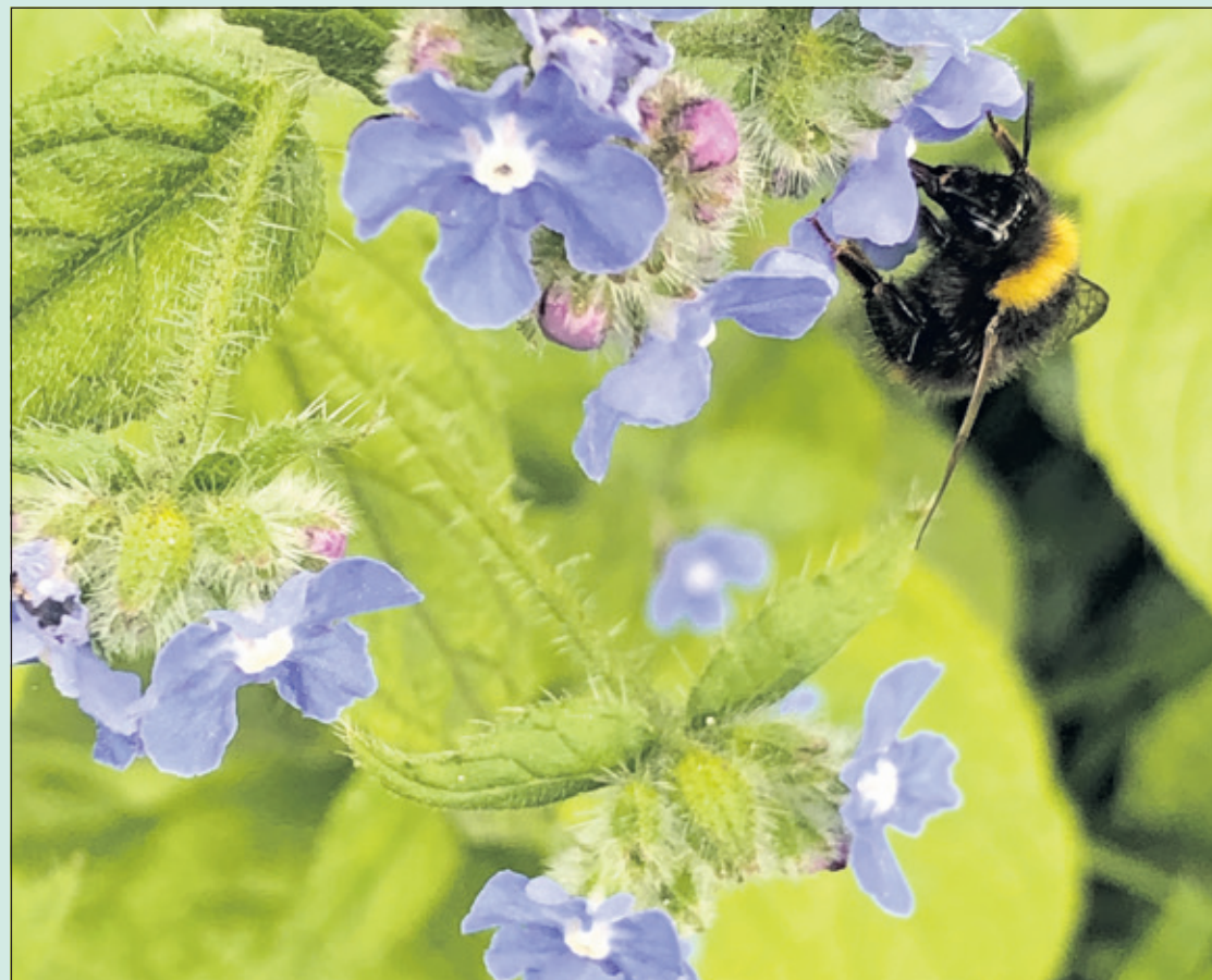
De overblijvende ossentong is geliefd bij insecten. Bijen, vlinders en hommels komen graag snoepen van de nectar. Zo ook deze Weidehommel.

Op woensdagavond 21 juni organiseert IVN De Bilt onder begeleiding van gidsen een wandeling door de wijk de Leyen. Tijdens de wandeling komen verschillende aspecten aan bod o.a. ten aanzien van het beheer, verschillende standplaatsen en wetenswaardigheden rondom diverse planten die we tegen zullen komen. De wandeling start om 20.00 uur vanaf verzamelpunt Plus Supermarkt in Bilthoven (Donsvlinder 2). De wandeling zal ongeveer anderhalf uur duren. Graag aanmelden via www.ivndebilt.nl . (Roel Maas-Bakker)