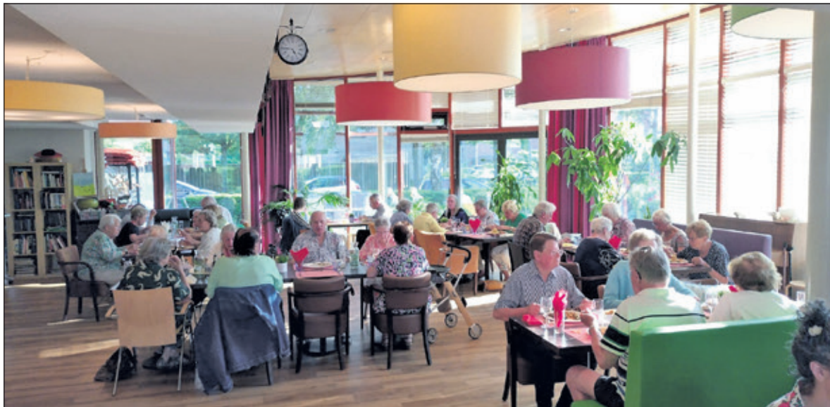
Samen eten verbindt.