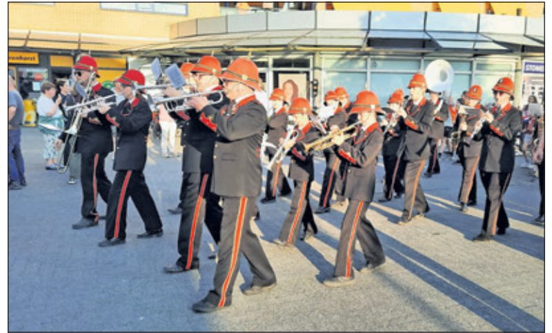
Het muziekkorps Vriendenkring arriveert op het Maertensplein.