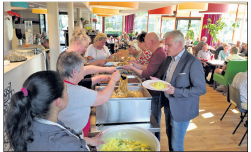
Wethouder laat zich opscheppen.