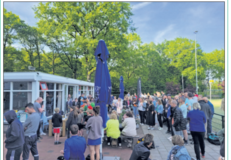
24 juni hoopt Nova het terras en de velden vol te hebben met zoveel mogelijk leden en oud-leden. (foto Renske van Kempen)

Korfbalvereniging Nova werd op 30 maart 1990 opgericht. Het is een fusie tussen de verenigingen Biko uit Bilthoven en Kameo uit Groenekan. Oud leden van deze clubs (en Nova natuurlijk) worden verzocht zich aan te melden voor deze dag. (Renske van Kempen)