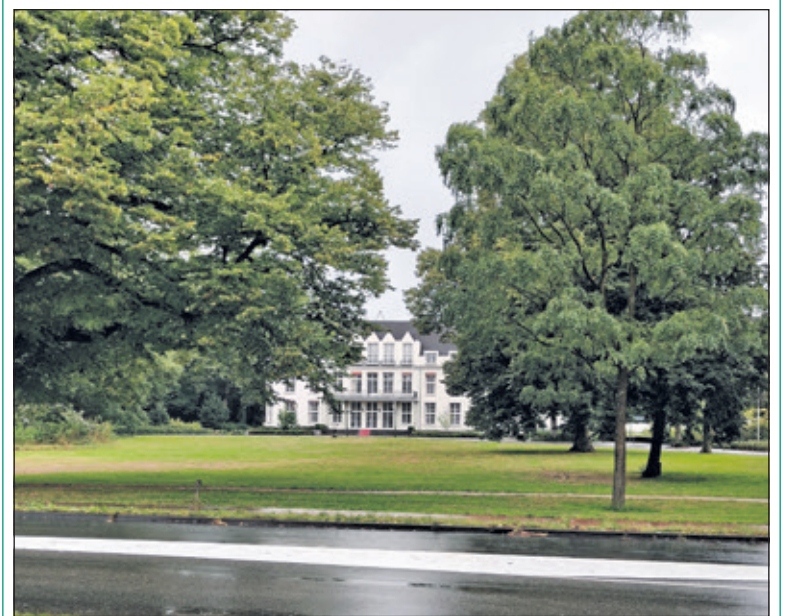
Volgens het Voorontwerp Omgevingsvisie De Bilt is voormalig Landgoed Jagtlust een rijksmonument.

Verantwoordelijk wethouder Hagedoorn verklaarde eind vorig jaar in de gemeenteraad dat hij 'Jagtlust liefheeft', maar toch bleef zoeken naar een andere bestemming. Hij ontried een aanwijzing tot monumentenstatus en ook sloot hij verkoop niet uit. Een voor januari 2023 aangekondigd raadsgesprek over een participatietraject is verschoven naar begin januari 2024. Anne de Boer van de Werkgroep Behoud Jagtlust is bevreesd dat ondertussen feiten geschapen worden, dat het college het pand gaat verlaten, het pand verder leeg komt te staan en dat een participatietraject niet veel meer voor kan stellen. 'Wie op de site van de gemeente of de gemeenteraad probeert uit te vinden wat de inhoud is van dit collegeproject Jagtlust, die komt van een koude kermis thuis. Misschien is het er, maar door ons niet te vinden.' De Werkgroep zamelt nu ondersteuning in om het college op haar schreden te laten terugkomen. 'Misschien was het een Freudiaanse vergissing, en wil het college Jagtlust echt liefhebben en beschermen. We zullen het gaan ondervinden' aldus de Boer.