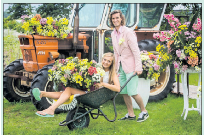
Lokale helden worden in de bloemetjes gezet.

Stichting Chryson reikt dit jaar voor het eerst een Local Hero Award uit. Voor deze award zoeken ze personen of groepen die, net als chrysanten, het leven van anderen kleur geven en zorgen voor een portie geluk. De eerste vijf lokale helden mogen wonen in de provincie Utrecht. Nomineren is heel eenvoudig. Ga naar de website van Stichting Chryson en vul de naam van jouw lokale held, contactgegevens en de reden van nominatie in. Aanmelden kan nog tot en met 23 juni via https://www.justchrys.com/nl .