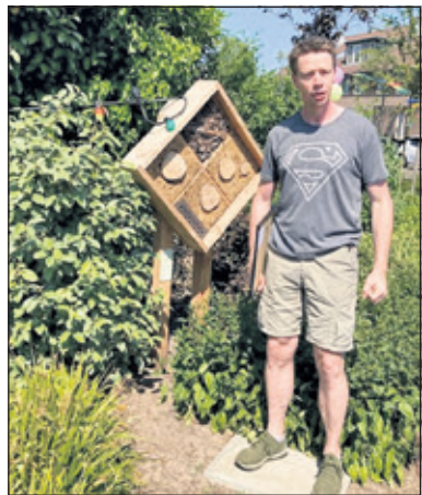
Een diervriendelijk en druk bezocht insectenhotel in de zaterdag geopende speelplaats Agaatvlinder.

tisch afgenomen. Maar er zijn ook positieve ontwikkelingen. Volgens Dierenbescherming Nederland kan door de juiste beplanting en schuilplaatsen voor dieren overall een paradijsje ontstaan. Tuinen zijn verbindingswegen voor tal van dieren, zoals bijen belangrijk. Maar ook watervoorzieningen in steeds drogere tijden.