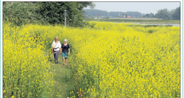
De Beleefkaart van Utrechts Landschap is een handig hulpmiddel om de komende zomer op ideeën te komen voor een uitstapje in de buurt.

Al meer dan 95 jaar beschermt Utrechts Landschap natuur en erfgoed in de provincie Utrecht. De stichting stelt een grootste deel van haar eigendommen open voor publiek, zodat iedereen ervan kan genieten. Van een molenbezoek tot een rondleiding in Kasteel Loenersloot en van een vaarexcursie over de Kromme Rijn tot een wandeling door een natuurgebied: er is dicht bij huis veel moois te ontdekken. De Beleefkaart is aan te vragen via www.utrechtslandschap.nl/beleefkaart .