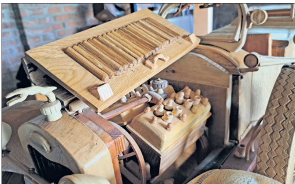
De V8 motor in detail.