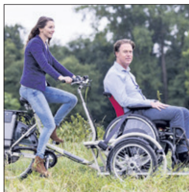
Met de rolstoelfiets worden fietstochtes weer mogelijk.

Met de rolstoelfiets kunnen mooie fietstochtes gemaakt worden. Hoe lang, wanneer en waarheen in overleg met de vrijwilliger. Er zijn geen kosten aan verbonden. Wie belangstelling heeft kan bellen met 030 2080211 of contact zoeken per email zonnebloem.debilt.bilthoven@hotmail.com.