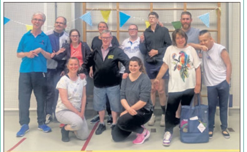
De laatste les werd feestelijk afgesloten.

Het aantal deelnemers dat in een sportzaal wil sporten loopt al jaren terug. Ook bleek het moeilijk om begeleiding te vinden. De laatste keer werd, zoals het bij deze club hoort, toch feestelijk afgesloten en alle deelnemers kregen een mooie tas gevuld met sportattributen zodat ze nu zelf kunnen proberen om de conditie op peil te houden. Zaterdag 27 mei was er nog het jaarlijkse uitje, dit keer naar de Apenheul. Daar werd met de vrijwilligers genoten van het samenzijn en de apen. (Marijke Drieënhuizen)