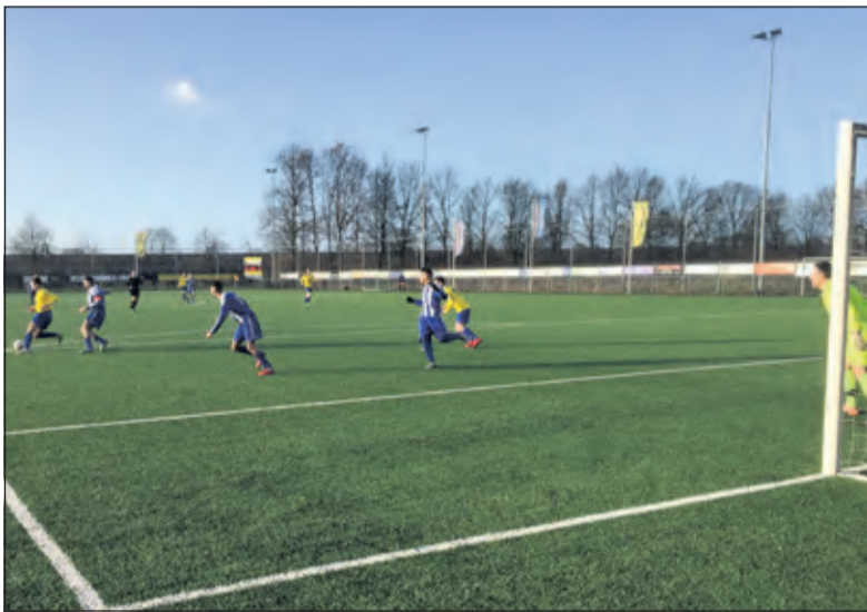
SVM was in de tweede helft beter op dreef.

De concurrenten EDO en Elinkwijk wonnen ook. De strijd om de bovenste plaatsen blijft zo (buiten-) gewoon spannend. A.s. zaterdag gaat SVM op bezoek bij SV Vechtzoom dat met 2-1 won op bezoek bij Vianen.