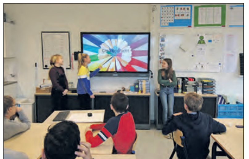
Leerlingen uit groep 8 geven een crea-les aan hun eigen groep.

De bijeenkomst is gratis; aanmelden s.v.p. via info@bilthovenseboekhandel.nl . Bezoekers ontvangen bij inschrijving een link naar een prijsvraag; iedereen die zich vooraf heeft aangemeld ontvangt bij vertrek een goedgevulde goodiebag.