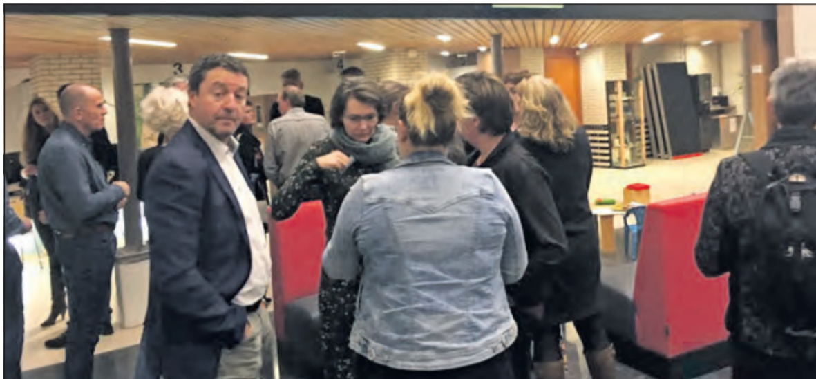
Er werd nog lang doorgepraat.

De gemeente gaat alle aangeleverde informatie bundelen en terugkoppelen. Met de Startbijeenkomst Wonen, Samen werken aan bouwen is een nieuwe start gemaakt om te komen tot plannen voor het bouwen van koop en huurwoningen in de gemeente De Bilt. Bij het vervolg zullen, zo is toegezegd, ook weer de burgers worden betrokken. Er werd nog lang doorgepraat.