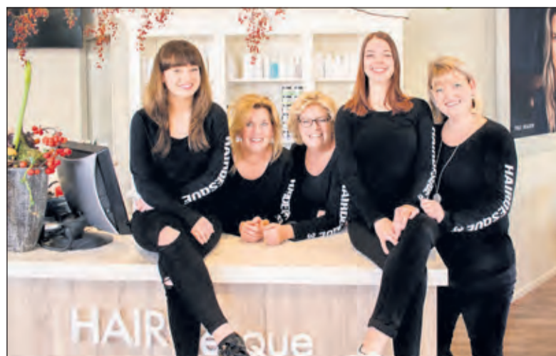
Team Hairdesque is altijd als eerste op de hoogte van nieuwe ontwikkeling op hun vakgebied.

Meer informatie over Hairdesque kunt u vinden op hun website: www.hairdesque.nl