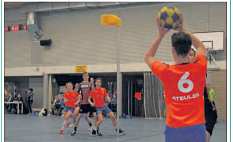
Eén van de 28 treffers in de maak.

Na rust zakte de wedstrijd een beetje in. AVO geloofde het wel en gooide de handdoek in de ring. Bij DOS werd ook de concentratie iets minder en lukte het niet om het zeer hoge niveau van voor rust nog een helft vol te houden. Coach Maarten van Brenk wisselde nog enkele spelers, die ook nog tot scoren kwamen. Hij was vooral tevreden over de verdedigende aanpak van zijn team. Door veel druk te geven werd AVO tot foute keuzes gedwongen. DOS sloot deze wedstrijd af met een 28-11 overwinning, waardoor het team de derde plek op de ranglijst behoudt. Komende zaterdag speelt DOS om 20.30 uur in Kampen tegen Wit Blauw.