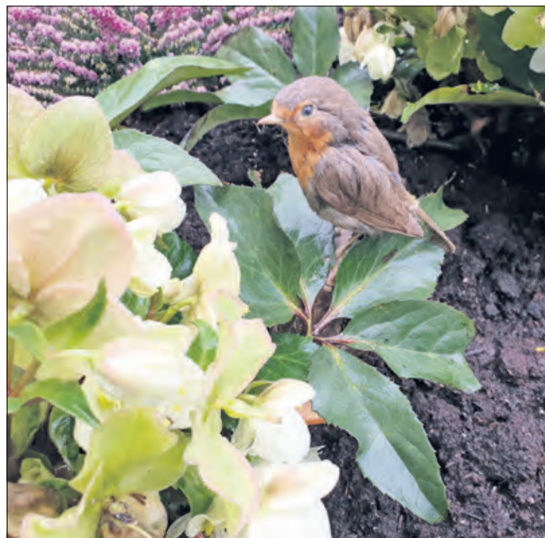
Roodborsten komen in bijna elke tuin voor.

Wie geïnteresseerd is in tuinvogels tellen, kan zich opgeven bij de Stichting Ornithologisch Veldonderzoek Nederland (SOVON). Het hele jaar door kunnen vogelsoorten, maar ook vlinders, libellen, zoogdieren, insecten, amfibieën en reptielen worden doorgegeven. Voor meer informatie: www.sovon.nl . Voor meer informatie over het weekend: www.tuinvogeltelling.nl