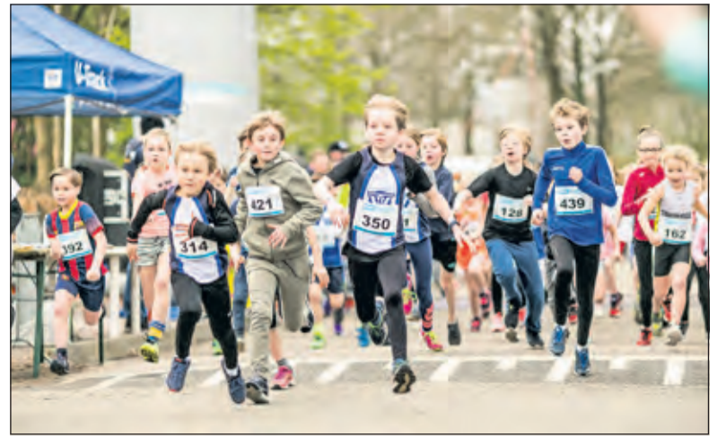
De jeugdloop maakt onderdeel uit van het programma. Er wordt fanatiek gestreden om de winst.

De organisatie is nog op zoek naar vrijwilligers die willen helpen op de dag zelf. Deelnemers kunnen zich aanmelden via www.runningdebilt.nl . Vrijwilligers kunnen zich melden door een mail te sturen naar info@runningdebilt.nl .