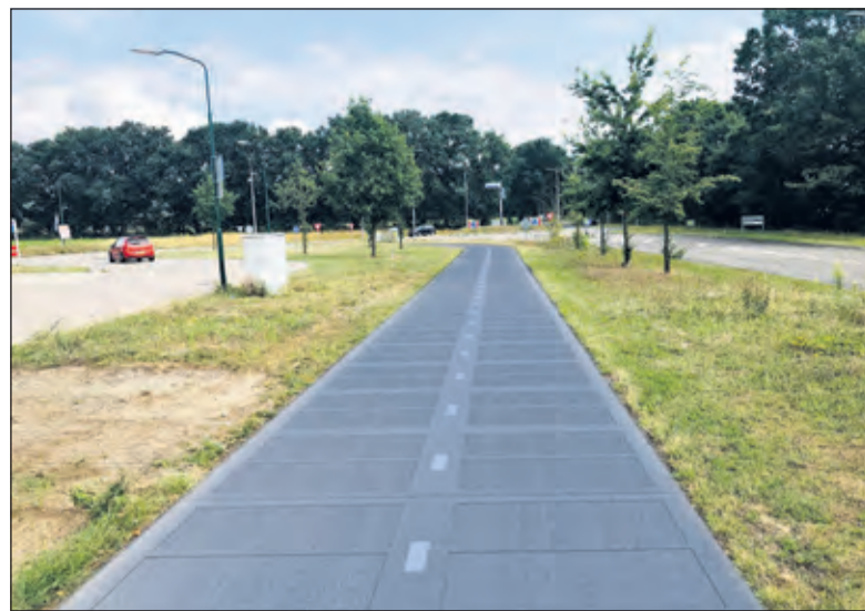
Een beeldimpresie van het zonnepanelenfietspad bij Remmerden.