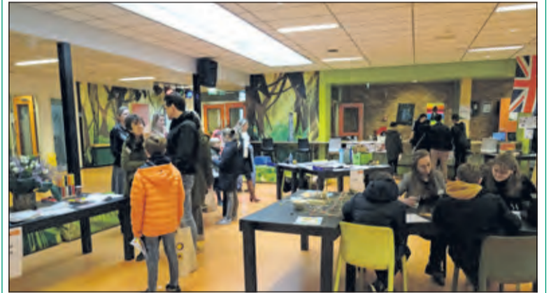
De Open Dag van Aeres wordt goed bezocht.