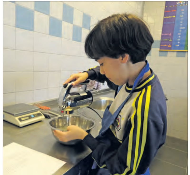
Een leerling bezig in het kooklokaal met het bereiden van ijs.

Op www.aeresvmbo-maartensdijk.nl staat meer informatie over de Food & Cookingklas