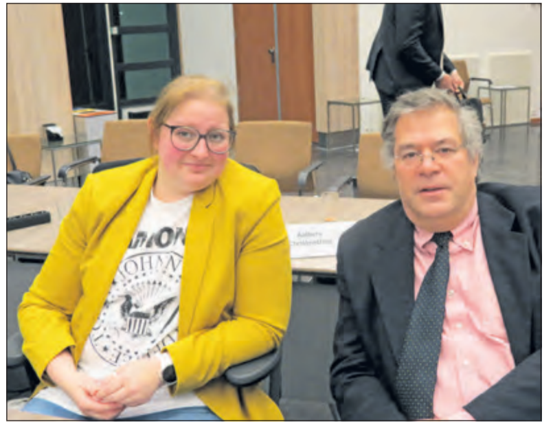
De fractie Forza De Bilt diende een motie van wantrouwen in die verder geen steun kreeg.