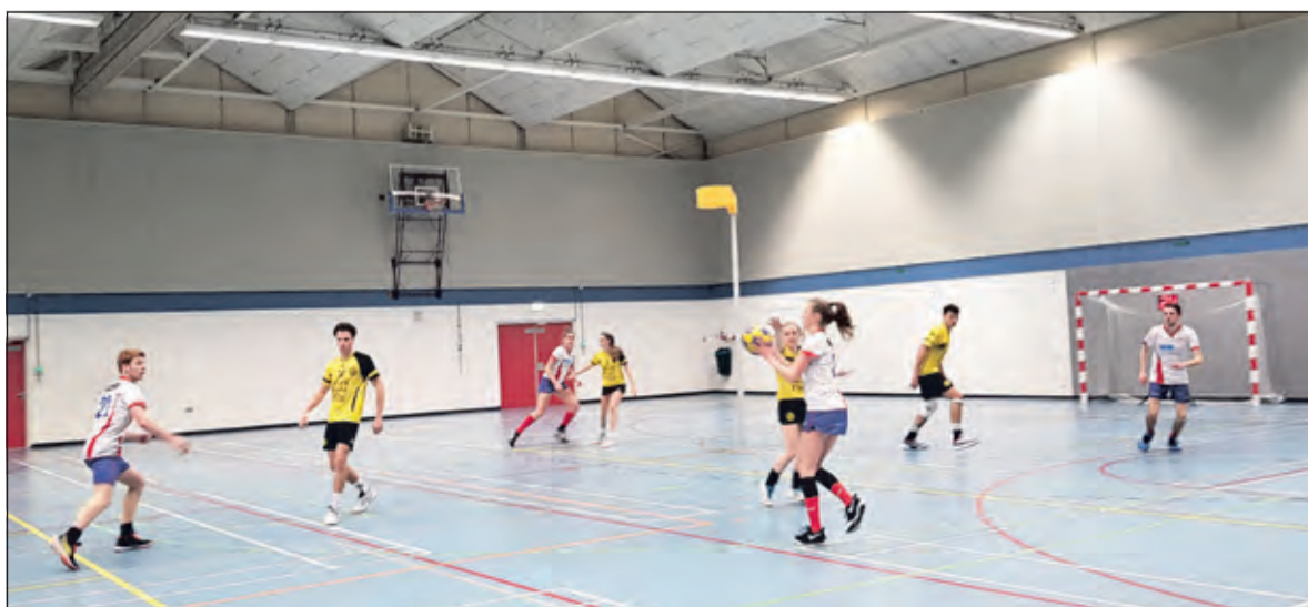
Nova kwam niet altijd tot de gewenste aanvallen.