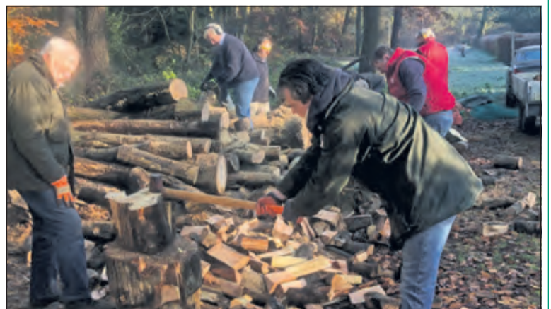
Met de verkoop van hardhout steunen de Lions goede doelen.

Elke twee jaar kiest Lions Club De Bilt - Bilthoven nieuwe goede doelen om te steunen. Wie een suggestie heeft voor een lokaal goed doel binnen de gemeente De Bilt dat steun van de Lions verdient, kan dit kenbaar maken via de website lionsclubdebiltbilthoven.nl.