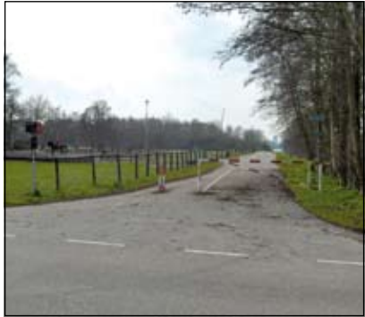
Wigle omringd door de aspirantvogelaars.

In en om de plas blijken vele vogelsoorten te spotten. Sommige leven er permanent, ander zijn er tijdelijk om te fourageren op doortrek of ze worden er als dwaalgast soms of regelmatig gesignaleerd. Een beperkte opsomming van de vogels die Wigle, op zeer inspirerende wijze, aan de orde stelde: onder (veel) meer passeerden Fuut, Nijlgans, zwarte Stern, IJsvogel, Oeverzwaluw, Boerenzwaluw, Slobeend, Kuifeend, Smient, Scholtekster en Taling (zomer- en winter!) de revue. Niet alleen visueel en auditief leerde men een aantal vogels op en rond de plas te herkennen, maar Wigle stoffeerde de waarnemingen