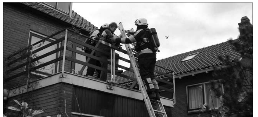
De Groenekanse brandweer in hoger sferen.

Door het behalen van de 2de plaats mag de Groenekanse brandweer door naar de volgende ronde op zaterdag 7 juni. Dit zijn gewestelijke wedstrijden.