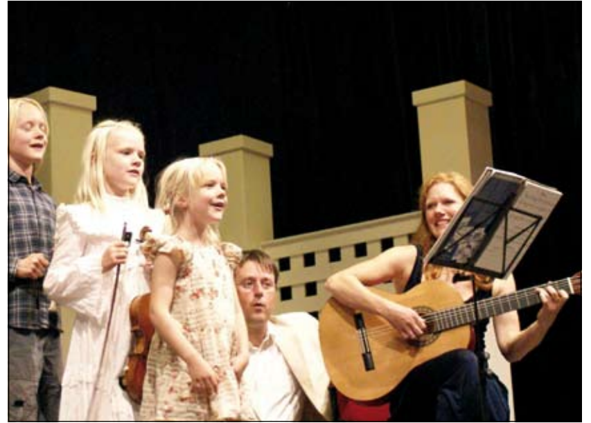
Aanbod: Concert aan huis door de Groenekanse familie 'Von Trapp'.