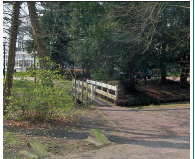
Deze brug zal vernieuwd en verbreed worden.

Bij de verkoop door de gemeente Maartensdijk van huize Voordaan in december 1999 is onder meer overeengekomen dat de koper zou zorgen voor een nieuwe en bredere brug aan de achterzijde. Deze nieuwe brug is bedoeld voor een toegang tot het parkeerterrein bij het dorps huis 'De Groene Daan' vanaf de Grothelaan. Daarmee komt een einde aan de toegang voor auto's die nu vanaf de Groenekansweg door de tuin naar het dorps huis moeten rijden. De huidige situatie leidt tot irritatie en de nieuwe brug biedt een goede oplossing voor de toegang van het dorps huis. De eigenaar van huize Voordaan dringt aan op realisering van de brug. De gemeente kan de gevraagde medewerking feitelijk niet weigeren omdat daarvoor in de koopovereenkomst duidelijke afspraken zijn gemaakt. De voorgestelde verbreding van de brug is in het verleden reeds afgestemd met alle betrokken partijen. Het college van Burgemeester en Wethouders bericht nu aan de raad, dat zij hebben besloten medewerking te verlenen aan de realisering van deze brug. Belanghebbenden zullen via de dorpsraad worden geïnformeerd [HvdB].