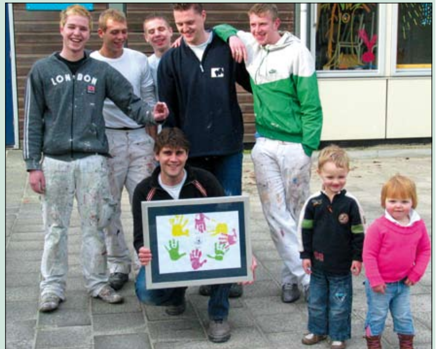
De peuters waren zo blij met hun nieuwe onderkomen dat ze een toepasselijk cadeau hadden voor de schilders.

Enkele weken geleden was het een drukke bedoening in Peuterspeelzaal 't Bruggetje in Maartensdijk. Schilders in opleiding van het Schildersvakcentrum Centraal Nederland (SCN) waren bezig met het schilderen van de Peuterspeelzaal. Deze leerlingen volgen een vakgerichte opleiding. Het opdoen van praktische ervaring is een van de belangrijkste onderdelen. De opleiding is verdeeld in drie niveaus. Juist in dit project konden de leerlingen onder begeleiding van een coördinator hun opgedane kennis in de praktijk ten uitvoer brengen. Voor de leerlingen was dit een onderdeel van hun opleiding en zij kregen hiervoor dan ook een beoordeling. Peuterspeelzaal 't Bruggetje was erg blij met de geboden helpende handen en het resultaat is naar volle tevredenheid.