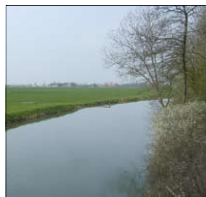
De Kromme Rijn bij Odijk. De rivier was eens de grens van het Romeinse Rijk.

De Cultuurhistorische waardenkaart zal verder worden gebruikt bij het afwegen en beoordelen van ruimtelijke plannen.