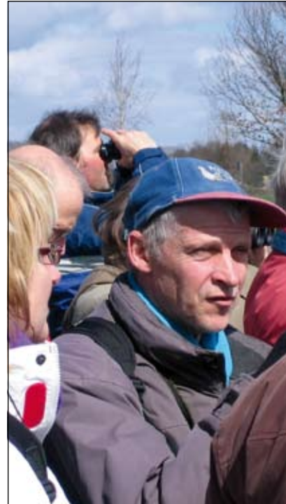
Zondag 6 april verzamelden zich een 20-tal (aspirant-)vogelaars zich bij het Hoogekampse Pad (hoek Groenekanseweg) voor een bezoek aan de Hoogekampseplas.

den deze wandelingen verplichte kost moeten zijn voor onze bestuurders en politici opdat zij bij het nemen van beslissingen (nog) beter weten wat ze doen. De initiatiefnemers en de deelnemers kunnen terugkijken op een zeer geslaagde middag en de vogelorganisaties hebben er, zeker weten, 20 gemotiveerde supporters bij!