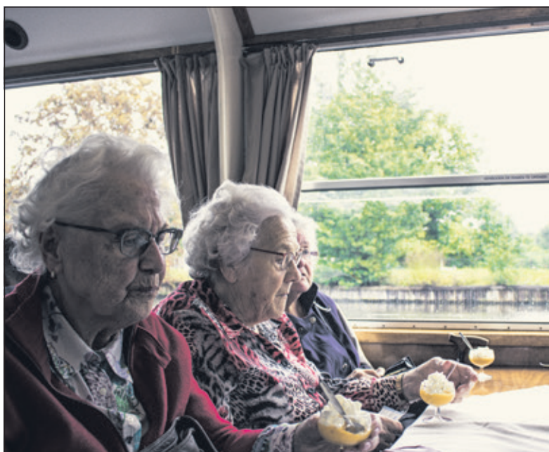
De Maartensdijkse Zonnebloemgasten genieten van een advocaatje met slagroom.

Zaterdag 16 september gingen zo'n 60 gasten en vrijwilligers met de Maartensdijkse Zonnebloem met een grote touringcar naar Maarsse en naar de daar aangemeerde rondvaartboot voor een middagje varen op de Vecht. Tijdens het varen werd er nog een lekker borreltje geschonken waar uiteraard ook weer heerlijk van werd genoten. Ter hoogte van Nieuwersluis bij het restaurant 't Stoute Soldaatje keerde de schipper de boot en werd er weer huiswaarts gevaren. Ook dit jaar was het mogelijk dit uitstapje te organiseren door sponsoring van Syscon projectmanagement training en coaching uit Westbroek en een bedrag, verkregen uit de opbrengst van de rommelmarkt van de Ontmoetingskerk in Maartensdijk. (Joop Vesters)