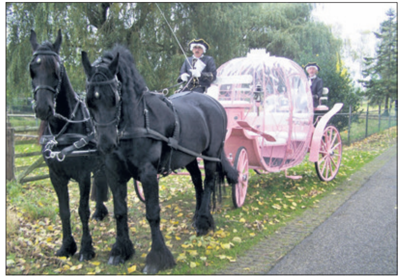
Even terug in de tijd door zaterdag een rondje door het centrum van Bilthoven in deze koets te maken.