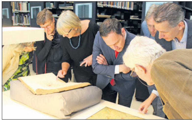
Het College neemt kennis van de eerste van negen eeuwen De Bilt.

'Met dit museum wordt een hiaat gevuld', aldus Doedens bij de start. Een voorproefje van de collectie van het museum bestaat uit 54 afbeeldingen, die alle zijn voorzien van toelichtingen. 'De kernen van De Bilt hebben een geschiedenis die alleen in schrift al teruggaat tot de achttiende eeuw. Wat van die geschiedenis restte kwam vaak terecht in archieven en musea buiten de gemeente en verdween soms naar het buitenland. Zo hangt een schilderij van Jan van Goyen van een dorpsgezicht met Petronellakapel in De Bilt uit 1623 in het Duitse Braunschweig, een zeventiende-eeuwse afbeelding van het Maartensdijkse jachtslot Toutenburg in een New Yorks museum en staat het beeld van de achttiende-eeuwse Groenekanner Joan Gideon