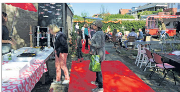
Het Hoekie heeft de rode loper uitgelegd voor Het Weeshuis.

Zaterdag was de feestelijke opening van de nieuwe locatie van het Weeshuis in het Hoekie in De Bilt. Het voormalige buurthuis krijgt hiermee een nieuwe bestemming. De bezoekers konden een kijkje nemen in de huiskamer, met de vertrouwde sfeer die het Weeshuis eigen is. Op het pleintje voor het gebouw was het goed toeven met een hapje en een drankje. Ook kon je er recycling kunst maken en genieten van live muziek. Het Weeshuis biedt een gevarieerd programma met muziek, verhalenvertellers en allerlei andere activiteiten, ook voor kinderen. Door de gemakkelijke toegankelijkheid en kleinschaligheid kan dit gebouw een sociale en culturele meerwaarde zijn voor de wijk. (Frans Poot)