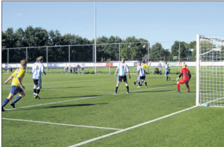
SVM op jacht naar een doelpunt.

de Maartensdijkse gelederen; Jelle de Bree en Sjoerd Burgers hopen binnenkort weer in de selectie te kunnen terugkeren. Aanstaaende zaterdag is in Utrecht het gepromoveerde Utrechtse Voorwaarts de volgende tegenstander.