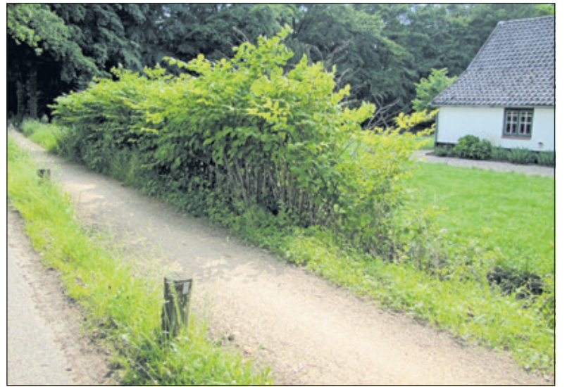
In 2014 staat er een muur Japanse Duizendknoop langs de Eikensteeg.

De coördinatie van de ploeg wordt georganiseerd door vrijwilliger Bert Tuinzaad: 'Intussen zijn na vijf maanden met de ploeg behoorlijke resultaten bereikt zoals het verwijderen van opslag op de flanken van een historische 'zinksloot' (door de 'vier keer per jaar'-vrijwilligersgroep o.l.v. Lex van Boetzelaer), het vrijmaken van een zichtas over ca. 2 km., het verwijderen van afgevallen hout en snoeihout en het vrijmaken van slootkanten langs de Eikensteeg richting Lage Vuursche. De ploeg werkt elke dinsdag van 9.00 tot 15.30 uur. Er is ruimte om de ploeg met enkele personen uit te breiden. Het werken in de natuur levert ook synergie in de ploeg en betrokkenheid bij het landgoed. Bovendien is het goed voor lijf en geest. Matthias van Boetzelaer begeleidt de werkploeg. Belangstellenden kunnen contact opnemen met Bert Tuinzaad, Bilthoven, tel. 06 22459961 of e-mail berttuinzaad@kpnmail.nl'.