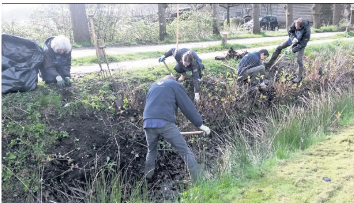
In 2016 wordt de Japanse Duizendknoop uitgegraven door een ploeg van Stichting Landschapsbeheerploegen Utrecht. (foto Bert Tuinzaad)