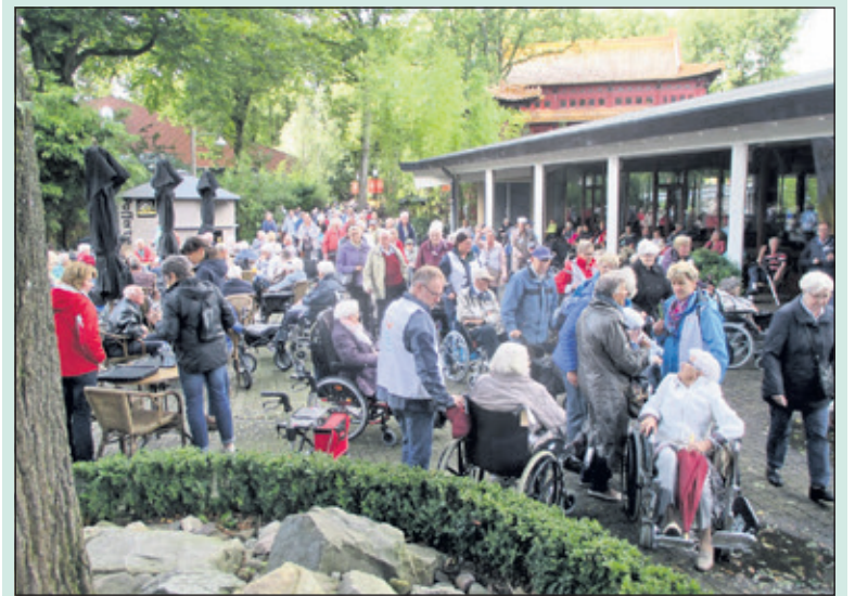
Grote drukte in Ouweland Dierenpark met alle Zonnebloemgasten.