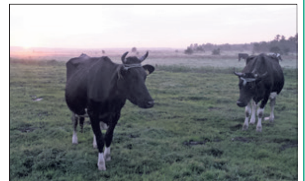
Morgenstond in de polder van Westbroek.

Dinsdag 3 oktober van 14.30 uur tot 16.30 uur bent u welkom voor de eerste bijeenkomst van Westbroek Ontmoet in het Dorpshuis van Westbroek. De kosten zijn 3 euro, inclusief een kop koffie of thee. Wanneer u wél wilt komen, maar niet weet hoe, kunt u vervoer regelen via de familie Kalisvaart, tel: 0346 281181. Ook wanneer u niet in Westbroek woont, bent u van harte welkom. (Karien Scholten)