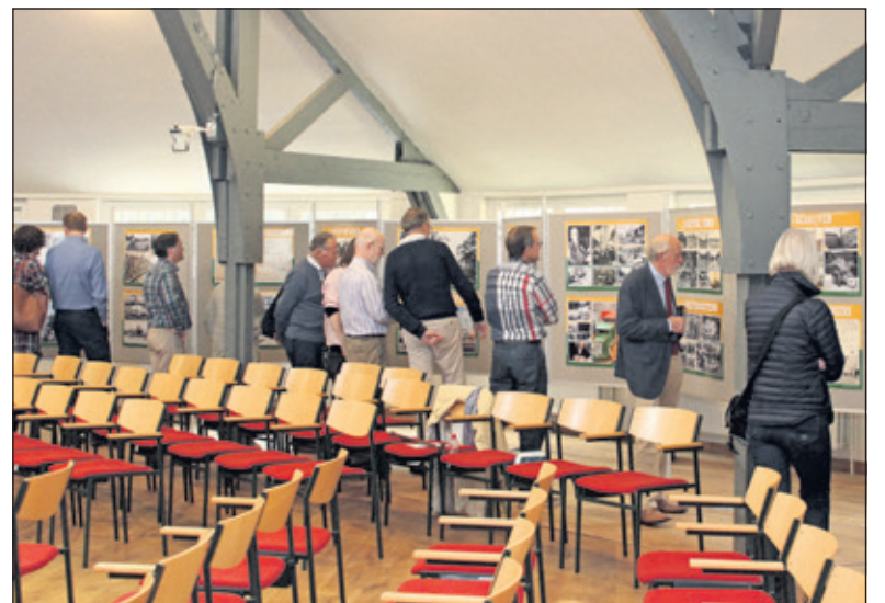
Onder de kenmerkende constructie van de Centrumkerk was er al direct ruime belangstelling voor de tentoonstelling over 100 jaar Bilthoven.