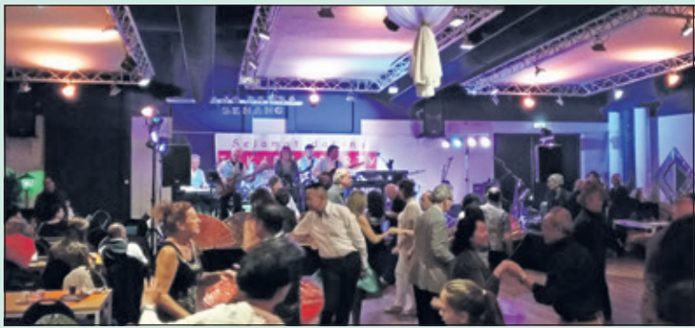
Voetjes van de vloer tijdens een gezellige Indische avond in De Bilt.

Afgelopen zaterdagavond had de Indische gemeenschap uit alle hoeken van het land zich verzameld voor een Jakarta-party, waar niet alleen heerlijk kon worden gedanst, maar even zo lekker kon worden gegeten, alles in Indische sferen, uiteraard. De voornamelijk Indische gasten lieten geen mogelijkheid aan zich voorbijgaan om zich uit te leven in typische volksdansen als de Jospa, een traditionele vorm van Indonesische linedance, alles begeleid door de opgewekte klanken van een dangdut-orkest, een band die traditionele Indische liedjes afwisselde met Spaanse en zelfs countryklanken. Een vrolijke en geanimeerde avond, die 24 september a.s. wordt voortgezet met een dansmatinee, dat om 12.30 uur begint, weer in het H. F. Wittecentrum. (Peter Schlamlich)