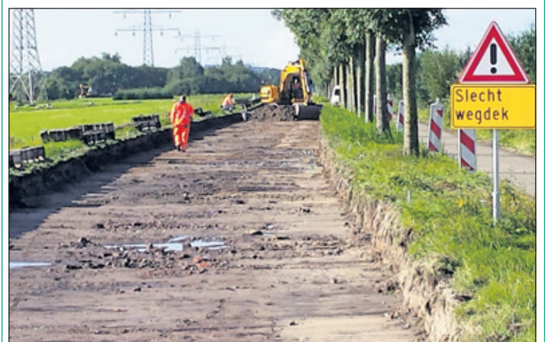
Het waarschuwingsbord op de Burg. Huydecoperweg in Westbroek lijkt wat overbodig, volgens Karien Scholten.