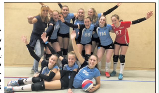
Irene MA1 wil ook dit seizoen in de bovenste regionen strijden.

Na de prijzen die Irene vorig jaar won bij de meisjes B-jeugd zijn de verwachtingen voor Meisjes A1 van Irene dit jaar hoog gespannen. Door de enorme groei van dat team is de verwachting dat ze ook dit seizoen in de bovenste regionen mee zullen strijden. Aan de andere kant spelen ze nu in een hogere leeftijdscategorie en is het Irene team gemiddeld nogal jong. Reikhalzend keek men uit naar de eerste wedstrijd, tegen het gerenommeerde PDK Huizen dat met haar eerste damesteam in de topdivisie speelt en bekend staat om haar professionele volleybalschool voor talentvolle jeugd. Maar zoals wel vaker stoort Irene zich niet aan de grote namen van tegenstanders. Vanaf het eerste punt maakten de meiden van coach Erna Everaert duidelijk dat ze dit jaar hetzelfde willen als vorig seizoen, namelijk meedingen om de titel. Zonder een moment te verslappen werd Prima Donna Kaas Huizen met 4-0 verslagen, met standen die er niet om logen (25-12, 25-8, 25-13, 25-8). Coach Erna Everaert was zeer tevreden: 'We wonnen vorig jaar al van deze tegenstander. Door het vele beachvolleybal deze zomer lijken de Irene-meiden zich nog meer ontwikkeld te hebben waardoor het verschil alleen maar groter is geworden. Een mooie competitiestart. Ik ben tevreden'. (Michel Everaert)