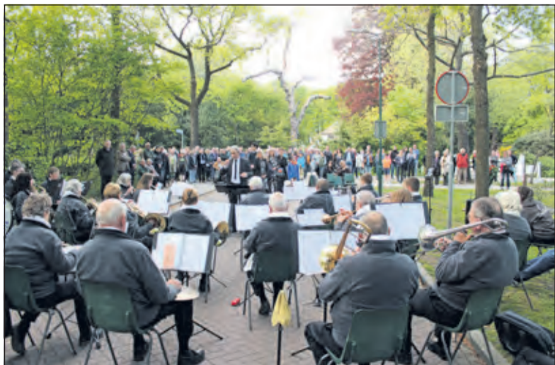
Muziekvereniging Kunst en Genoegen speelt bij het monument.