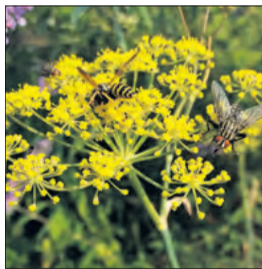
Venkel met insecten.