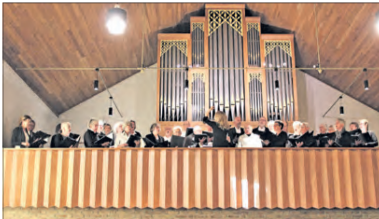
Het Algemeen Zangkoor Maartensdijk verzorgde muzikale bijdragen.