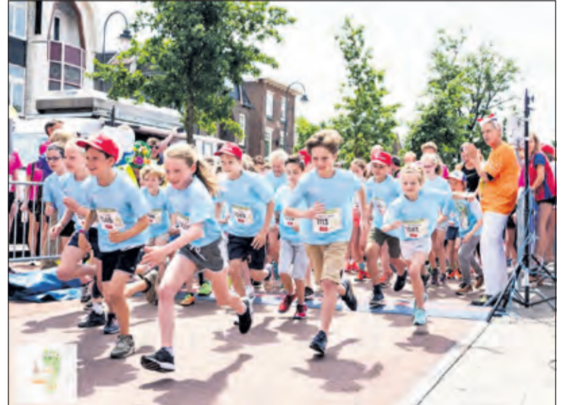
Velen rennen de 5 km.