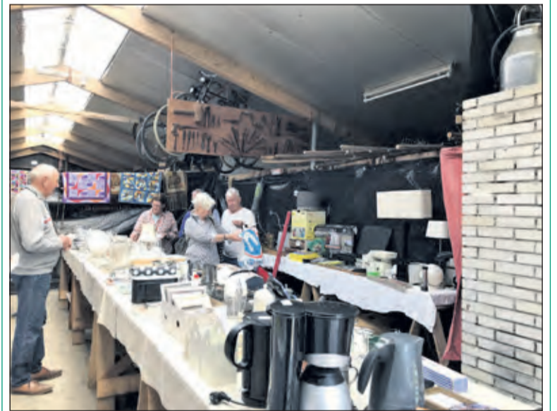
De opbrengst van de verkoop leverde het mooie bedrag op van € 680 met dank aan de vrijwilligers en de kopers.

Zaterdag 7 mei was het zonnig en druk op de Achterweteringseweg in Maartensdijk; vrijwilligers van Stichting Razem hadden zich ingespannen veel spullen te verzamelen die in de verkoop gingen voor het goede doel: hulp aan Oekraïense ontheemden in de partnergemeente van de gemeente De Bilt, Mieścisko in Polen. (Kees Floor)