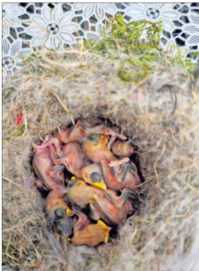
Alle negen vogeltjes vonden een vroegtijdige dood.

De volgende ochtend keek Van Poelgeest naar buiten en zag de