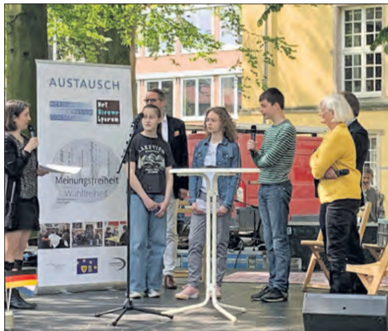
Leerlingen van het Nieuw Lyceum en van het Heriburg Gymnasium aan het woord.