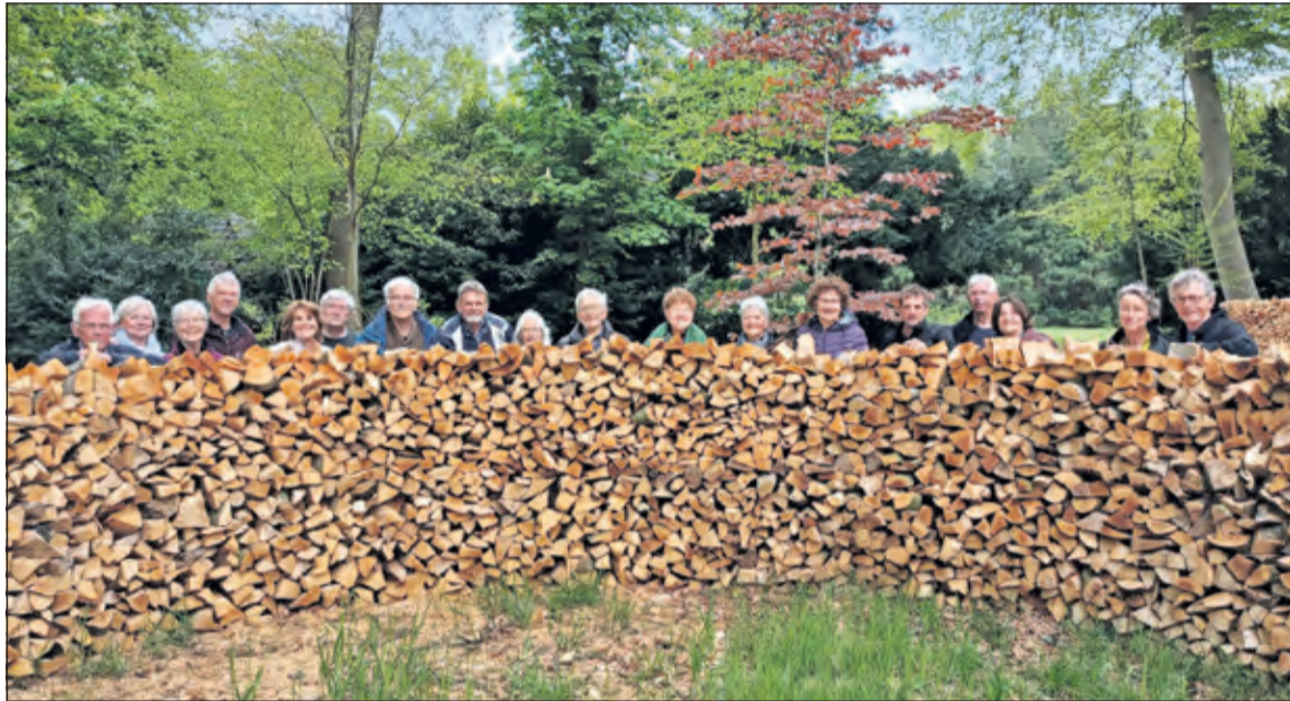
De werkgroep met partners achter het kloofhout.