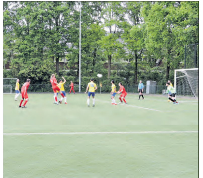
Een stormvloed aan aanvallen van SVM in de tweede helft.