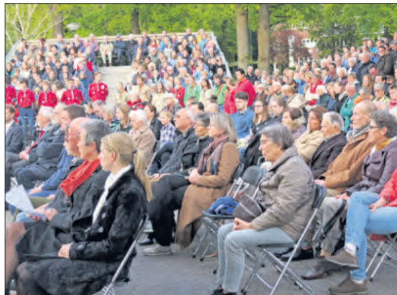
Aan de herdenking namen heel veel mensen deel.

'Gelukkig leert de geschiedenis ook dat het goede vroeg of laat het kwaad overwint. Daar kunnen we ons aan vasthouden. Door anderen