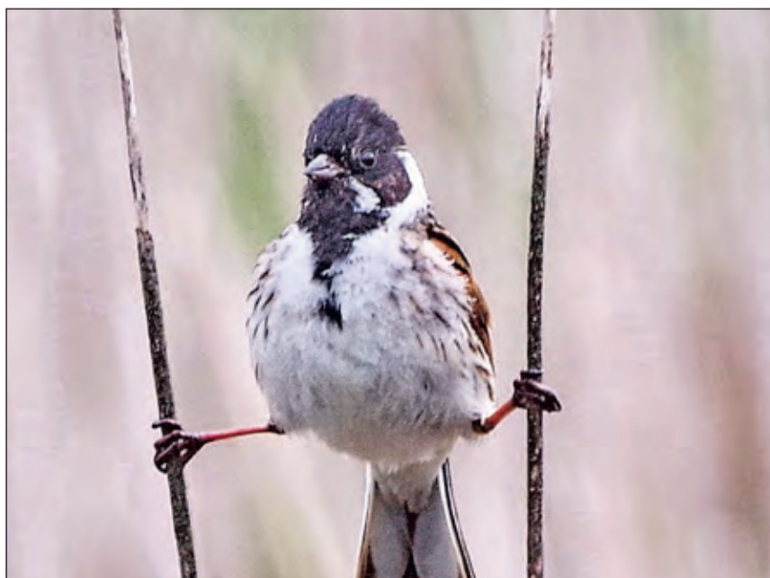
Rietgorsen laten zich tijdens het baltsen altijd goed zien. De maakt het heel spannend met een acrobatisch standje op 2 rietstengels.