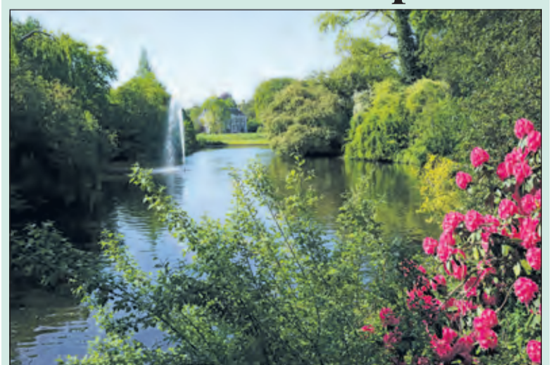
Het voorjaar is nu echt doorgebroken met een bonte kleurentooi.