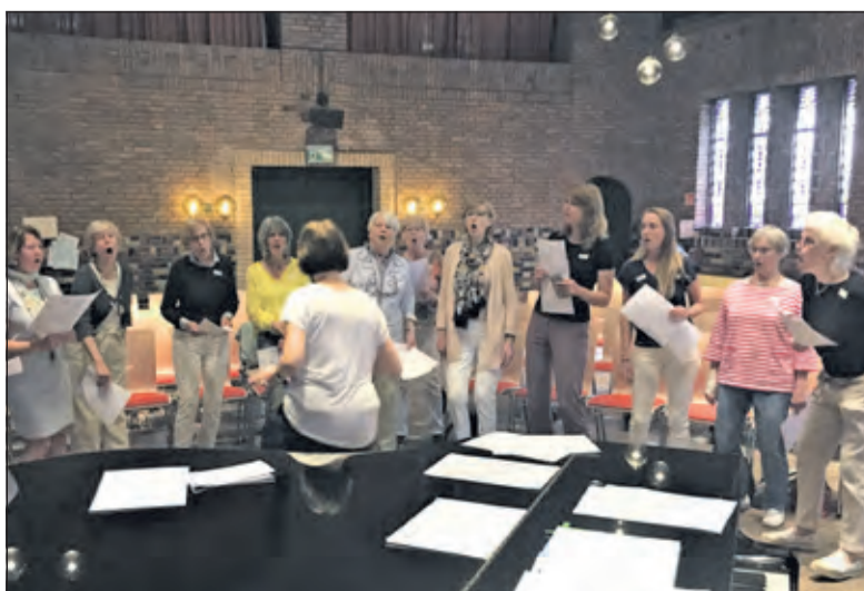
Er wordt flink geoefend in De Woudkapel.

Er zijn twee groepen: dinsdag van 10.30 tot 12.00 uur en van 19.30 tot 21.00 uur, beiden eens per 2 weken. Tussentijds instromen kan ook. Voor meer informatie en aanmelden: j.scholte12@kpnplanet.nl.