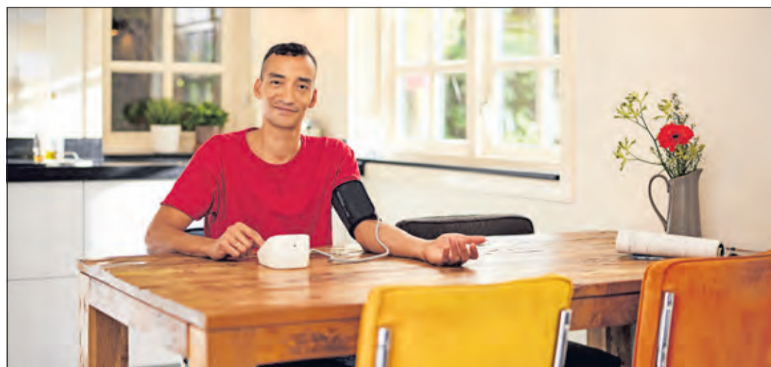
Bloeddruk meten is eenvoudig.

de Hartstichting blijkt dat 1 op de 3 Nederlanders van 30 tot 70 jaar met een hoge bloeddruk rondloopt. Van hen weet 40% niet dat zij een hoge bloeddruk hebben. Dit zijn zo'n 1,2 miljoen Nederlanders. Meten is daarom belangrijk. Om het meten van de bloeddruk voor iedereen toegankelijk te maken, richt de Hartstichting in de maand mei openbare meetpunten in door het hele land. Bibliotheek Bilthoven is één van deze locaties. U kunt op donderdag en vrijdag terecht van 11.00 tot 17.00 uur en zaterdag van 10.00 uur tot 16.00 uur. Medewerkers van de Hartstichting zijn aanwezig om te assisteren.