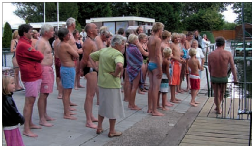
De 63 deelnemers vlak voor de start.

kwam werd door Lies v.d. Hoogen verblijd met een fraaie oorkonde en een stenen olielampje in de vorm van, hoe kan het anders, een kikker. En de twee deelnemers die voortijdig uitvielen kregen ook een kikker, maar dan van een wat bescheidener formaat. Alle deelnemers hebben volop genoten van deze tocht door de prachtige rustieke fortgracht, die bovendien perfect georganiseerd was. Het zit er dan ook in dat in dat de 45ste kilometertocht volgend jaar ook weer op het programma komt. Het evenement werd besloten met een gezellige barbecue, want zwemmen maakt hongerig.