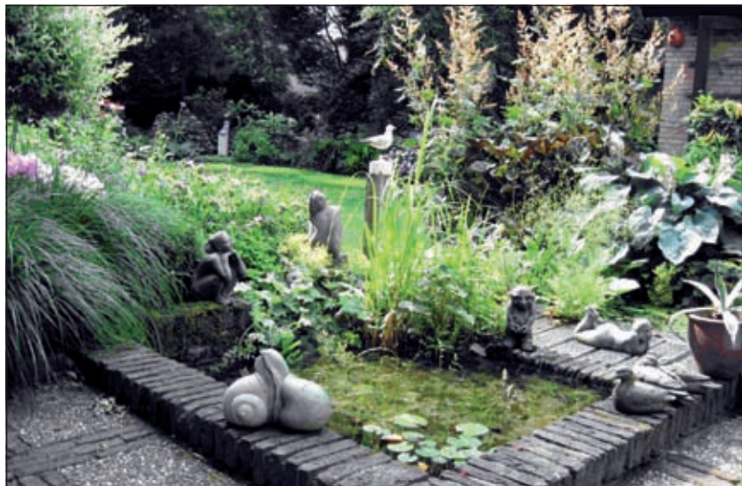
Volop beelden en schilderijen te bekijken aan de Kievitlaan in Maartensdijk.

Bij haar beelden is het de mens en dan vooral de vrouw die centraal staat. Deze beelden vallen op doordat ze er een beweging, een verstilling of een ontmoeting in vastlegt. Haar schilderijen zijn vaak realistisch, soms impressionistisch of romantisch en verbeelden mensen, landschappen