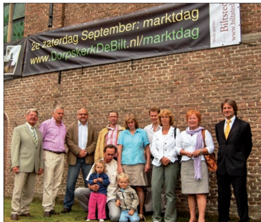
Een deel van de bij de organisatie betrokken kerkelijk meelevenenden komt uit aanpalende kernen als Maartensdijk, Bilthoven en Groenekan.

Er is een bloemenkiosk, waar men voor zichzelf of voor de ander een bloemetje van mee kan nemen. In de cadeaushop worden leuke cadeautjes op een originele manier ingepakt