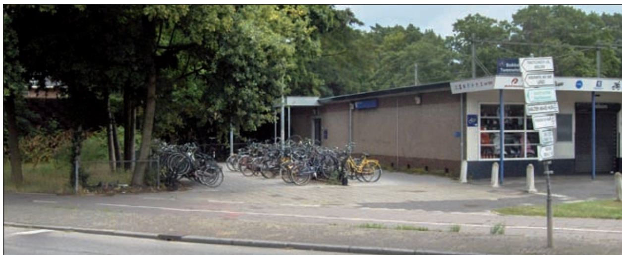
Het college van Burgemeester en Wethouders van De Bilt heeft ingestemd met het voorstel van ProRail om de onbewaakte fietsenstalling bij de spoorwegovergang in Bilthoven met 280 plaatsen uit te breiden.

in de uitbreiding van de fietsenstalling opgenomen voor een bedrag van 35.000 euro. Het college heeft de gemeentelijke bijdrage aangemeld bij het Bestuur Regio Utrecht (BRU) voor subsidie. Het BRU heeft inmiddels toegezegd om zeventig procent van de gemeentelijke kosten te subsidiëren, zodat de daadwerkelijke investering 12.600 euro bedraagt [HvdB].