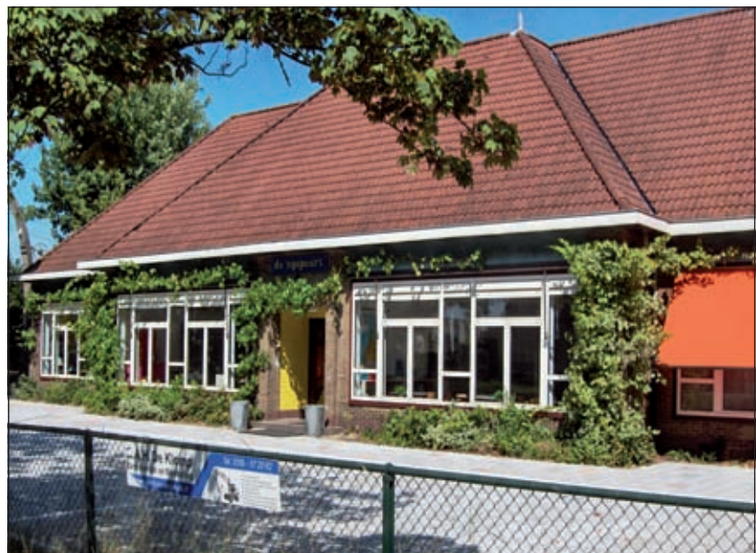
De vroegere School met de Bijbel in Groenekan zou, na het verlaten ervan door de huidige gebruiker (Nijepoortschool) heel geschikt zijn als museum.

Van Schaik begint het gesprek met de stelling, dat het uitgestalde in de Traverse van gemeentehuis Jagtlust slechts het geselecteerde topje van een grote ijsberg is, want de tentoonstelling 'Kunst op de kaart', welke daar nu loopt, laat maar een zeer klein deel zien van de in de afgelopen tijd opgeschoonde collectie kunst van de vroegere gemeenten Maartensdijk en De Bilt. Los van de zeer beperkte tentoonstellingsruimte - immers maar één wand van deze gang kan gebruikt worden om tekeningen en schilderijen op te hangen - moesten de tentoongestelde objecten ook nog een relatie hebben met het thema van de Monumentendag van dit jaar.