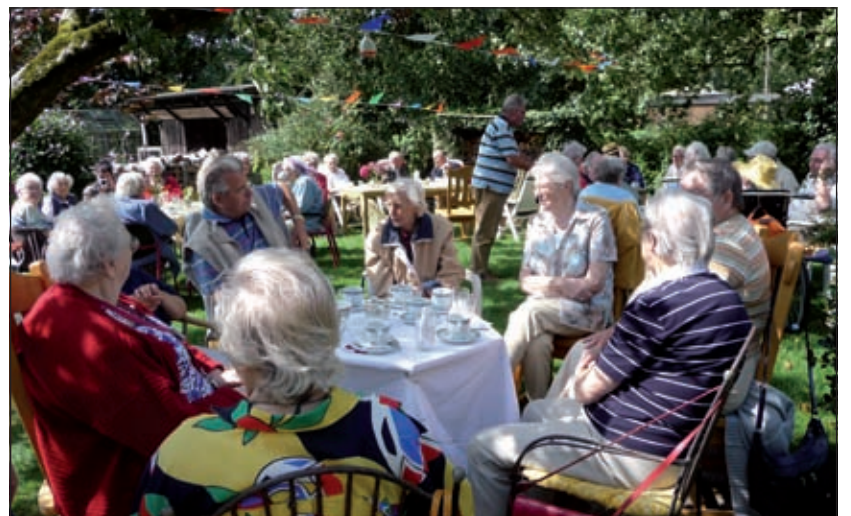
Het mooie weer, de vele mensen, de prachtige locatie, het lekkere eten en de gezellige accordeonmuziek maakten van de High Tea een geslaagde activiteit.

gevaren op het vakantieschip. Het maakte zo'n indruk, die enthousiaste inzet van alle vrijwilligers, dat ik me toen voorgenomen heb om mij eens bij de Zonnebloem aan te melden als vrijwilliger. Sinds twee jaar doe ik dat nu en het bevalt goed. De mensen voor wie we het doen zijn vaak zichtbaar blij en maken een praatje met je als je ze tegenkomt op straat. Je doet echt goed werk'. Tussen het op een schaal leggen van de aardbeien door vertelt hij dat op 12 september het zestigjarig bestaan van de Zonnebloem wordt gevierd in De Mantel in Maartensdijk. 'We hebben een leuk programma samengesteld met medewerking van Sojater en met sponsoring van feesttaarten en feestdranken door de C1000. Alle mensen die bij ons ingeschreven staan krijgen hiervoor een uitnodiging'. Eind september krijgen ze, een op de Beursvloer geregelde, rondleiding op het gemeentehuis, in november komt de