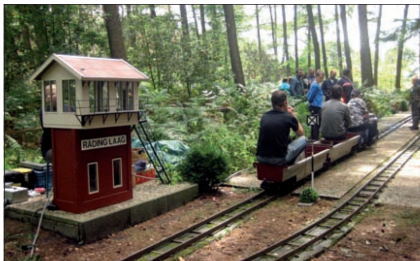
Seinpost Rading Laag.