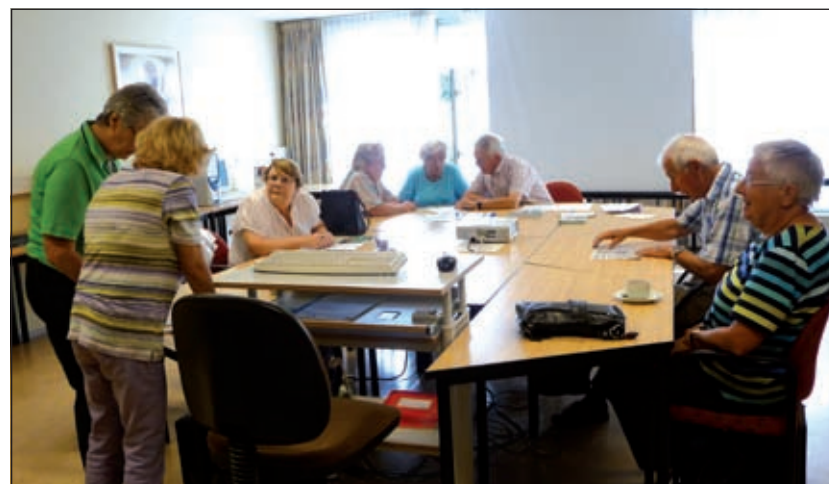
Een record aantal van 57 nieuwe cursisten heeft zich ingeschreven voor diverse computercursussen, die georganiseerd worden door de Maartensdijkse vestiging van SWO De Zes Kernen De Bilt.

5 aanmeldingen, dit overtreft echt al onze verwachtingen. We zijn er heel blij mee. Bijna iedereen kan gelijk starten, alleen 5 mensen die zich aangemeld hebben voor een cursus digitale fotobewerking staan op een wachtlijst'. Mochten er nog meer mensen geïnteresseerd zijn in een cursus dan kunnen ze of even binnen lopen in Dijkstate of even bellen met SWO Maartensdijk. (0346 214161)