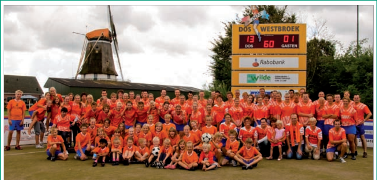
Het startweekend bij DOS is een groot succes geworden. Drie topkorfballers van Dalto uit Driebergen gaven vrijdagavond een trainingsclinic voor de jeugd van DOS. Halverwege de zaterdag werd er een verenigingsfoto gemaakt van alle op dat moment aanwezige leden.

Inlichtingen: Yogacentrum Shamballa Nederland, Industrieweg 22A unit 3, 3738JX, Maartensdijk. tel 0346 211254, e-mail: info@shamballa.nl en Internet: www.shamballa.nl