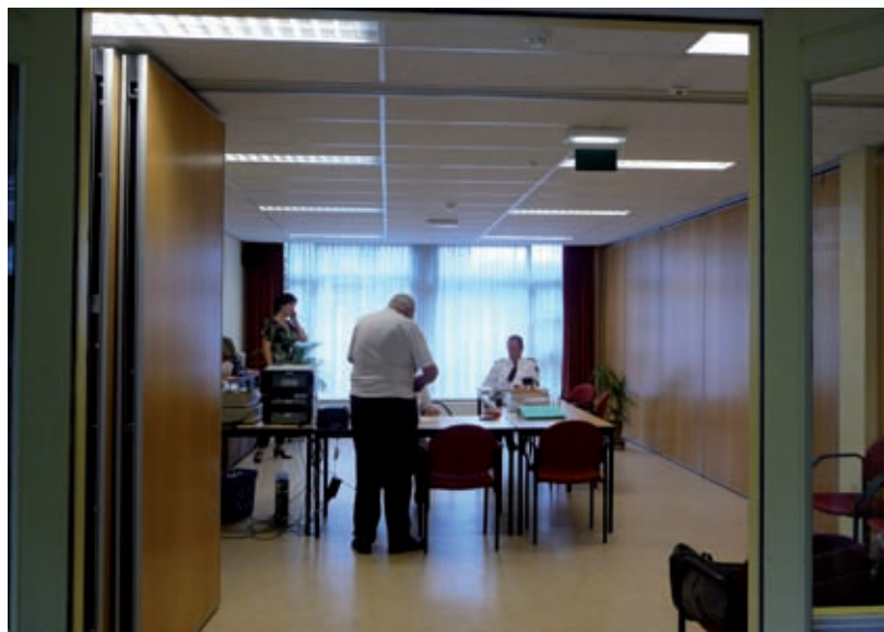
Het gemeentelijk Servicepunt is vanaf maandag 24 augustus, vooralsnog tijdelijk, gevestigd in Dijkstate.

Het Servicepunt is geopend op maandag tussen 14.00 en 19.00 uur en op donderdag tussen 8.30 en 12.30 uur. De politie is aanwezig op maandag van 18.00 tot 19.00 uur en op donderdag van 9.00 tot 10.00 uur. Telefonisch is het Servicepunt bereikbaar op kantooruren via de receptie op het gemeentehuis in Bilthoven, telefoonnummer 030 2289411.