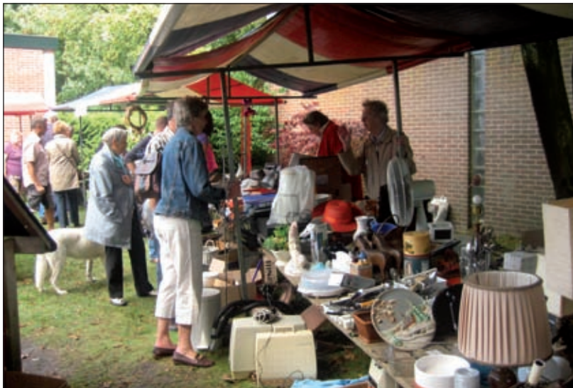
Buiten staan de kraampjes met meubels, boeken, planten en prullaria.