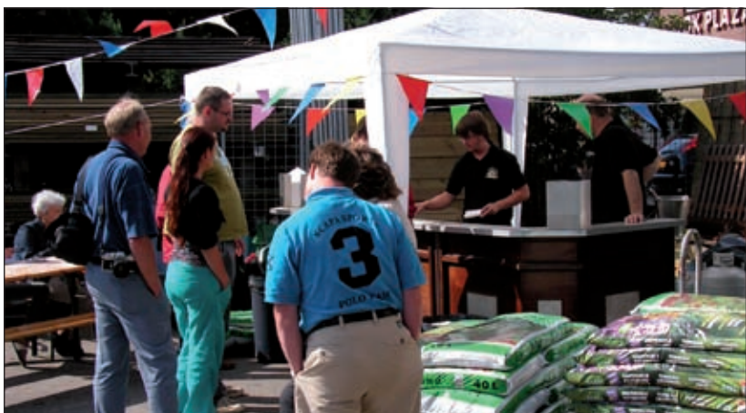
In het kader van 75 jaar van der Neut werden de klanten afgelopen zaterdag getraakteerd op poffertjes bij hun zaak in Groenekan. [MN]