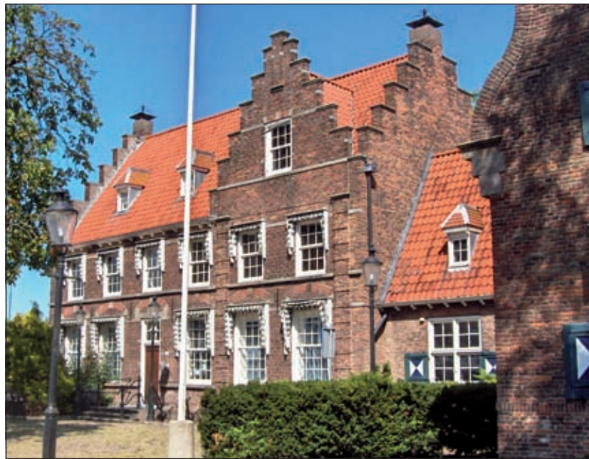
Het oude gemeentehuis van Maartensdijk is een herinneringsplek van generaties Maartensdijkers.

In de discussies over de Cultuurnota, het cultuurbeleid van de gemeente van 2009 tot 2013 is de noodzaak van zo'n museum ook aan de orde gekomen. In die discussies is naar voren gekomen dat de vroegere School met de Bijbel in Groenekan na het verlaten ervan door de huidige gebruiker (Nijepoortschool) hier heel geschikt voor zou zijn. Het referentiekader in dit geval is het Scheringamuseum in Wognum, dat in een school is ondergebracht, die gebouwd in diezelfde periode. Die klaslokalen blijken een heel goede expositieruimte te zijn. Bezoekers zijn enthousiast. Gezien de grote uitbreiding van de collectie door de aankoop al vele jaren lang is dit museum te klein geworden en