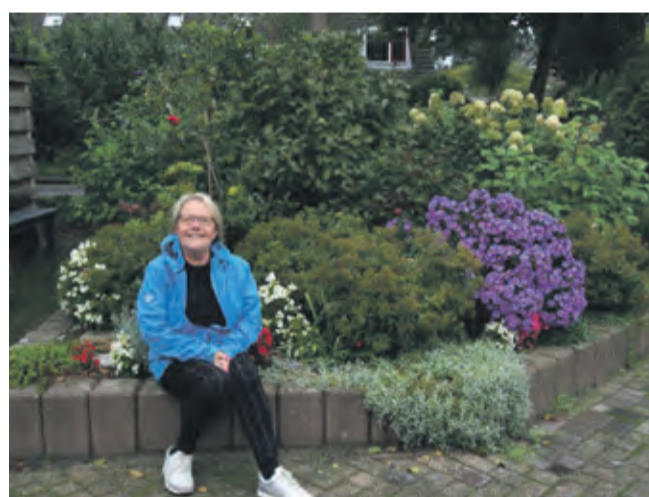
Groenadoptie: Foto mw Westerhout in De Leijen Vele groenliefhebbers adopteren openbaar groen

Dus samenwerking stimuleren: gemeente, burgers, landbouw, Groei en Bloei, natuurorg.