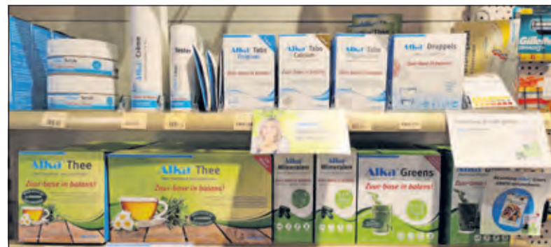
Drogisterij van Rossum heeft een uitgebreid thee assortiment op de plank. [foto Henk van de Bunt]

komt is te groot om via de normale uitscheidingsorganen ons lichaam te verlaten. Het lichaam slaat de schadelijke zurresten op in o.a. de weefsels en gewrichten.