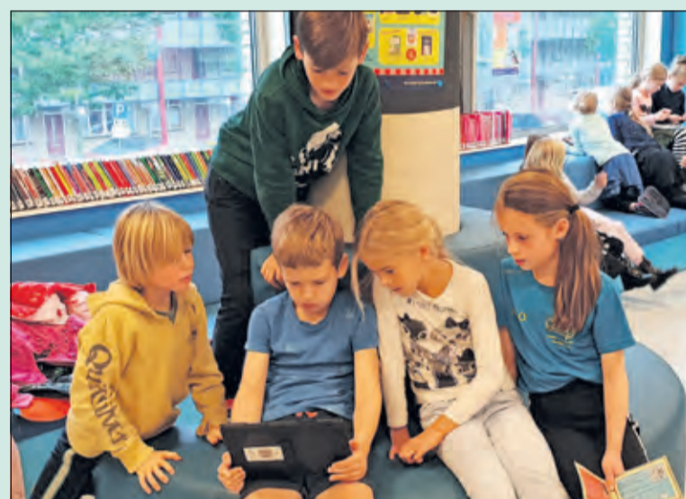
De leerlingen van groep 5/6 van de basisschool De Werkplaats gingen op maandag 28 september naar de Biltse Bibliotheek.