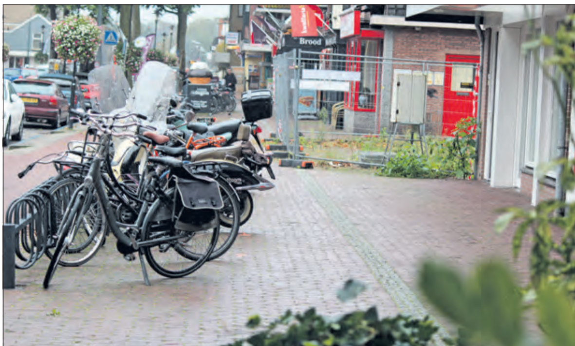
Er wordt deze week gewerkt op de Hessenweg om meer ruimte voor voetgangers te creëren.

De tijdelijke oplossing voor de Hessenweg is tot stand gekomen na een schouw op 15 september door gemeente en ondernemersvereniging. Daarbij is gekeken naar het gebruik en de inrichting van de trottoirs en andere mogelijk knelpunten. De werkzaamheden voor de tijdelijke situatie zijn maandag 5 oktober gestart. Een einddatum voor de tijdelijke oplossing is nog niet bekend en hangt uiteraard af van hoe lang de maatregelen nodig zullen zijn.