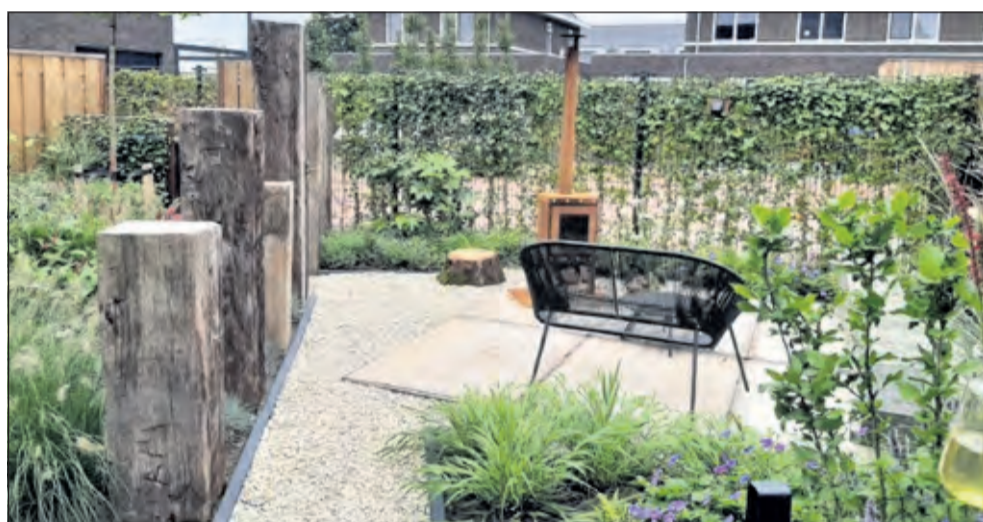
In een Levende Tuin wordt bestrating beperkt toegepast.

Ronald vertelt enthousiast verder: 'Met de pijlers van De Levende Tuin passen we meer variaties toe in onze tuinontwerpen. Vooral veel beplanting in alle soorten en maten, struiken en liefst ook een boom. Een prima leefomgeving voor mens en dier. Natuurlijk komt in deze tuin ook bestrating voor, maar beperkter en bewust toegepast. Een pad met staptegels waartussen voldoende ruimte is voor begroeiing. Of afgewisseld met grind, zodat het regenwater voldoende weg kan lopen. Een klant denkt vaak dat een tuin met meer groen om veel onderhoud vraagt. Door de levende materialen slim toe te passen in onze tuinontwerpen willen we laten zien dat het ook anders kan.'