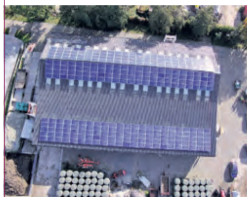
Zonneproject Nieuw Toutenburg in Maartensdijk, gerealiseerd door BENG! en Biltstroom.

BENG! is de lokale energiecoöperatie van en voor inwoners van De Bilt. Kijk op www.beng2030.nl voor informatie over projecten, activiteiten en meer.