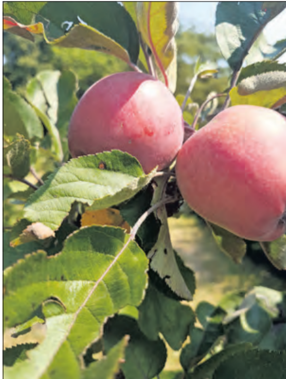
Van appels uit het Plukdoolhof wordt lekkere appeltaart gemaakt.

De ochtend wordt afgesloten met koffie/thee en appeltaart van appels uit de boomgaard.