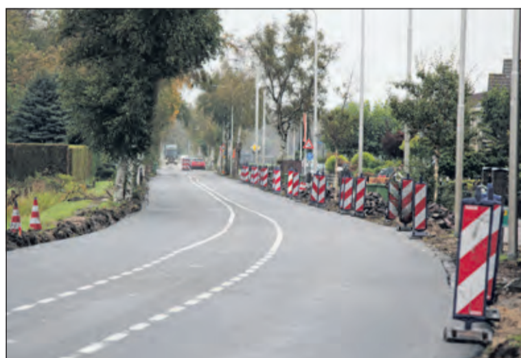
De weg naar Hollandsche Rading is weer open