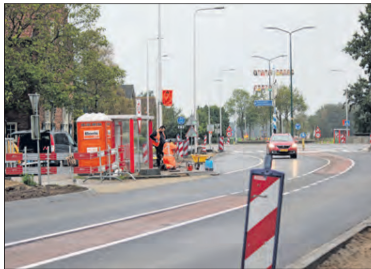
Groot onderhoud aan de N417 vordert gestaag.

Het fietspad is afgesloten: van 12-10 t/m 23-10 tussen 07.00 en 17.00 uur. De bereikbaarheid voor fietsers wordt aangegeven middels bebording. Woningen blijven via de hoofdrijbaan bereikbaar