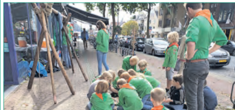
Welpen van de Laurentiusgroep puzzelen de weg naar de schat.

Elke zaterdag van 14.00 tot 16.30 uur organiseert de Laurentiusgroep een leuke activiteit voor meiden en jongens vanaf 7 jaar, in of om het clubgebouw in het Houderbos. Er is een aparte groep voor jongens en meisjes. Nieuwe leden zijn welkom. Kijk op www.laurentiusgroep.nl