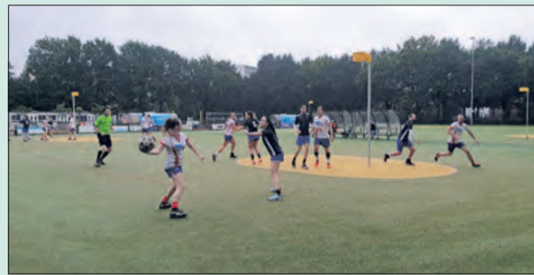
Nova loopt vanaf de eerste minuut uit.