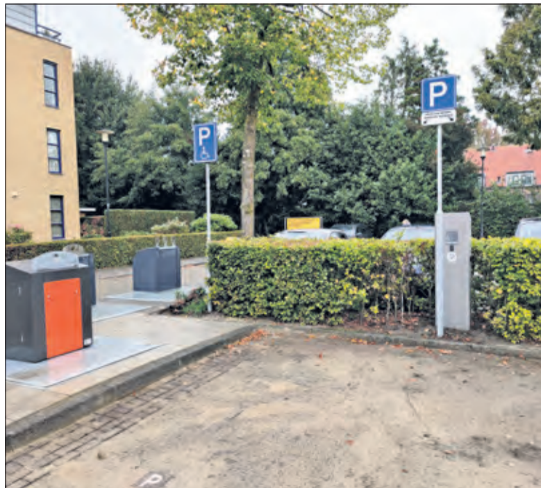
Met de komst van een nieuwe afvalcontainer is een gehandicaptenparkeerplaats plots verdwenen.

Overigens was zij niet de enige, die dat opmerkte; 'Zo ben je wel snel door je toch al te weinige parkeerplaatsen heen; naast die container kun je ook nog tweemaal niet parkeren, terwijl er niemand overdag gebruik maakt van die twee oplaadmogelijkheden voor elektrische auto's' aldus een aantal bewoners van de flats boven de oostelijk gelegen winkelrij aan het Maartensplein. [HvdB]