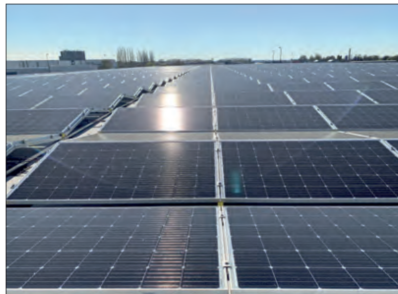
Provincie Utrecht ondersteunt ondernemers die zonnepanelen op hun dak willen plaatsen.

maatregelen waarmee bedrijven ondersteund kunnen worden bij het verduurzamen. Denk daarbij aan het verhuren of beschikbaar stellen van een bedrijfsdak aan een lokale energiecoöperatie zodat deze er zonnepanelen op kan plaatsen. Een andere mogelijkheid is om samen te werken met een energiecoöperatie in de buurt. Daarbij investeren deelnemers van de energiecoöperatie in de zonnepanelen op het bedrijfsdak en wordt stroom voor de lokale gemeenschap geproduceerd.