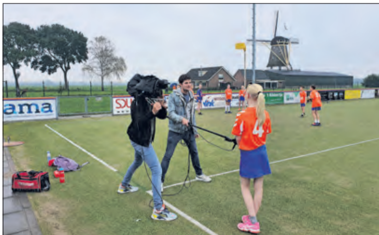
De verslaggever van het jeugdjournaal voelt iedereen aan de tand.

Het kabinet kan tevreden zijn, zoals DOS omgaat met de maatregelen. Eén voor één druppelen de sporters binnen. 'Bij aankomst vragen