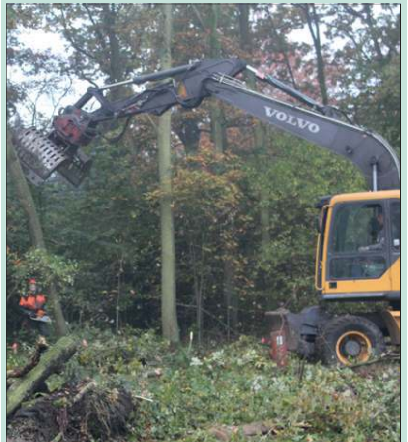
Met een zaagsnede en inzet van een grote kraan zijn de bomen snel verwijderd.

Om tijdens de werkzaamheden op de hoek van de Biltse Rading met de Groenekanseweg de overlast tijdens de kap te beperken werden verkeersregelaars ingezet en verkeersmaatregelen genomen. [HvdB]