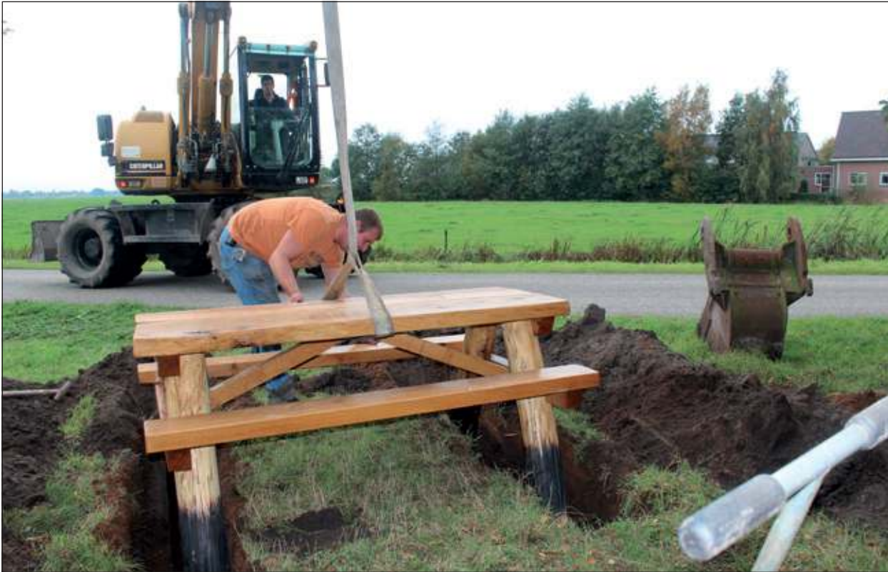
De bankjes worden o.a. geplaatst door Bouwman's Loonbedrijf BV Westbroek (zie foto) en Van Oostrum Westbroek BV. Afgelopen zaterdag viel de Korssesteeg die er al te beurt.

Elf picknickbanken met informatieborden worden er geplaatst in het Noorderparkgebied. Het is een initiatief van de gelijknamige Agrarische Natuurvereniging (ANV). Ze staan op de mooiste plekjes en nodigen recreanten uit om even rust te nemen en kennis te nemen van informatie over het prachtige boerenlandschap waarin ze vertoeven.