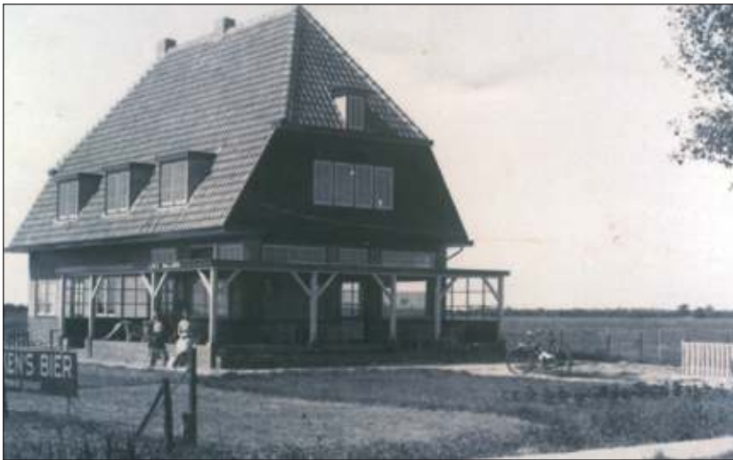
Tolakkerweg 230 Café Halfweg tot 1957

De Tolakkerweg was nog een klinkerweg. Door de weeks was het café een rustpunt voor handelaren, die met paard en wagen vanuit Hilversum of Utrecht kwamen. Op een vaste avond in de week oefende muziekvereniging Kunst en Genoegen er. De caféstoelen werden in een halve cirkel gezet en op de door de gemeente beschikbaar gestelde houten lessenaars werd de bladmuziek geplaatst. Al rond 1940 werd café Halfweg te klein als repetitieruimte voor de Maartensdijkse fanfare en verhuisde het orkest naar het Wilhelminagebouw aan de Dorpsweg.