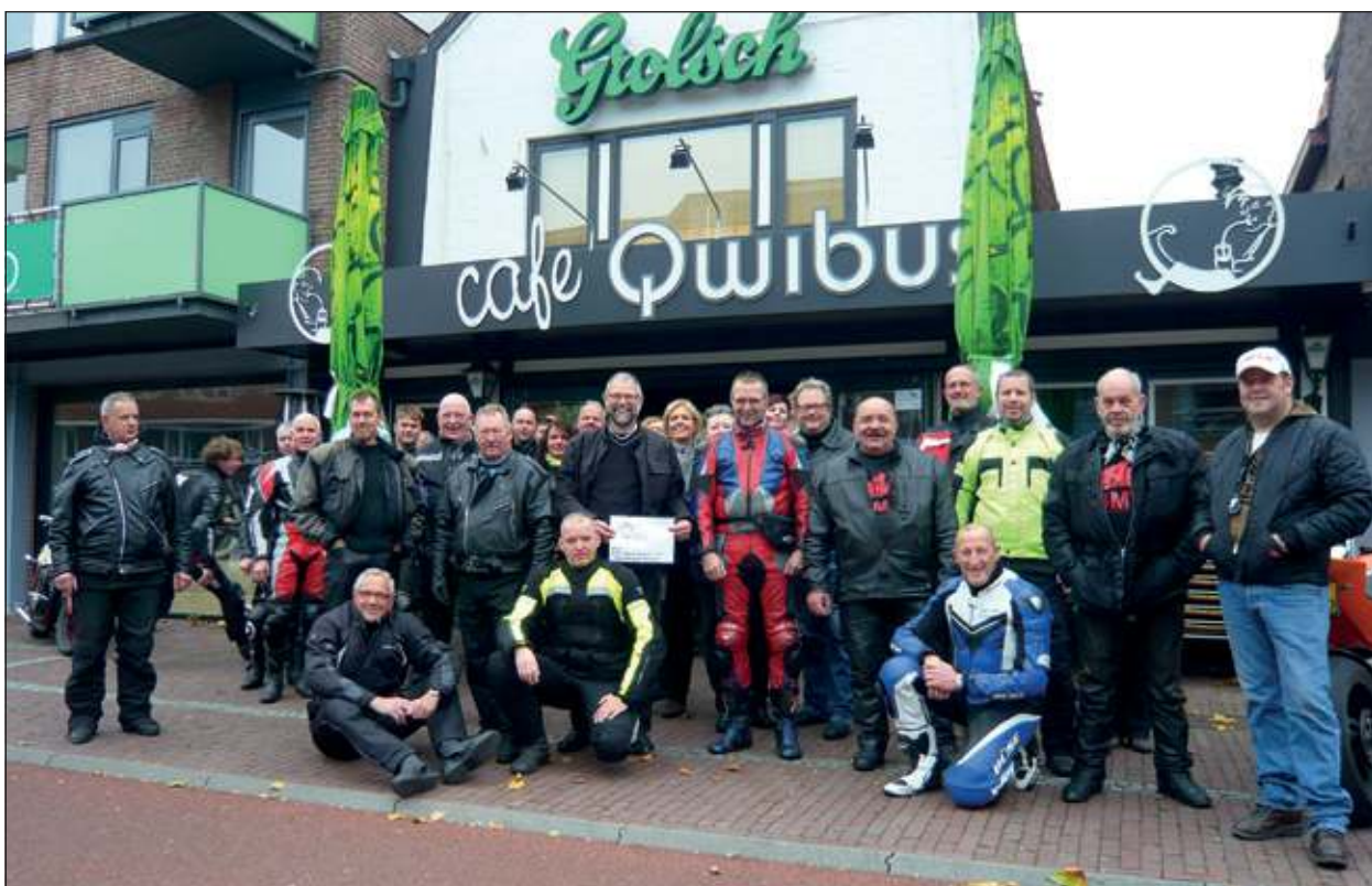
Afgelopen weekend maakte de Biltse Motorrijders Vereniging uit De Bilt een ritje voor en naar het goede doel.

De Biltse Motorrijders Vereniging organiseerde op 21 oktober haar jaarlijkse goede doelenrit. Dit jaar was de Stichting Assistentiehond Nederland uit Molenschot gekozen door de leden van de BMV.