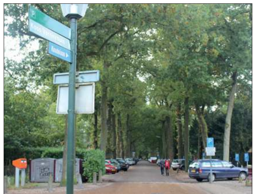
Wie van Bilthoven naar Lage Vuursche gaat krijgt juist voor de ingang van het dorp aan de linkerhand een zijlaan, die Koudelaan heet.

Het vreemdste van het geval is, dat de Koudelaan eigenlijk helemaal niet in De Bilt ligt maar in Baarn. De grens ligt langs de Zuidelijke berm. Dat niettemin De Bilt zich ermee bemoeide, zal wel gekomen zijn doordat de eerste bebouwing aan de zuidzijde van de weg verrees, dus op Bilts grondgebied. De gemeente Baarn heeft pas in 1949 namen gegeven aan de lanen in Lage Vuursche en heeft daarbij zoveel mogelijk oude gebruiksnamen toegepast. Omdat De Bilt de naam Koudelaan al voerde, besloot de gemeenteraad van Baarn die naam te handhaven. Dat was