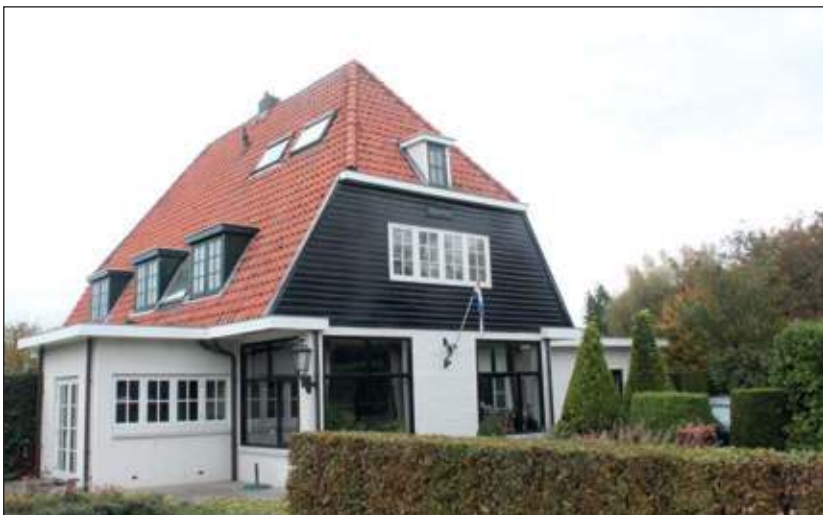
Tolakkerweg 230 wordt tegenwoordig in tweeën bewoond en is bijna geheel (vanaf de wegzijde) aan het gezichtsveld onttrokken.

Heeft u oude foto's die betrekking hebben op de voormalige vier kernen van de gemeente Maartensdijk? Of bent u benieuwd naar een speciaal Maartensdijks plekje? Meld dit de redactie op info@vierklank.nl en wij zullen proberen de reis vanuit het verleden op te pakken.