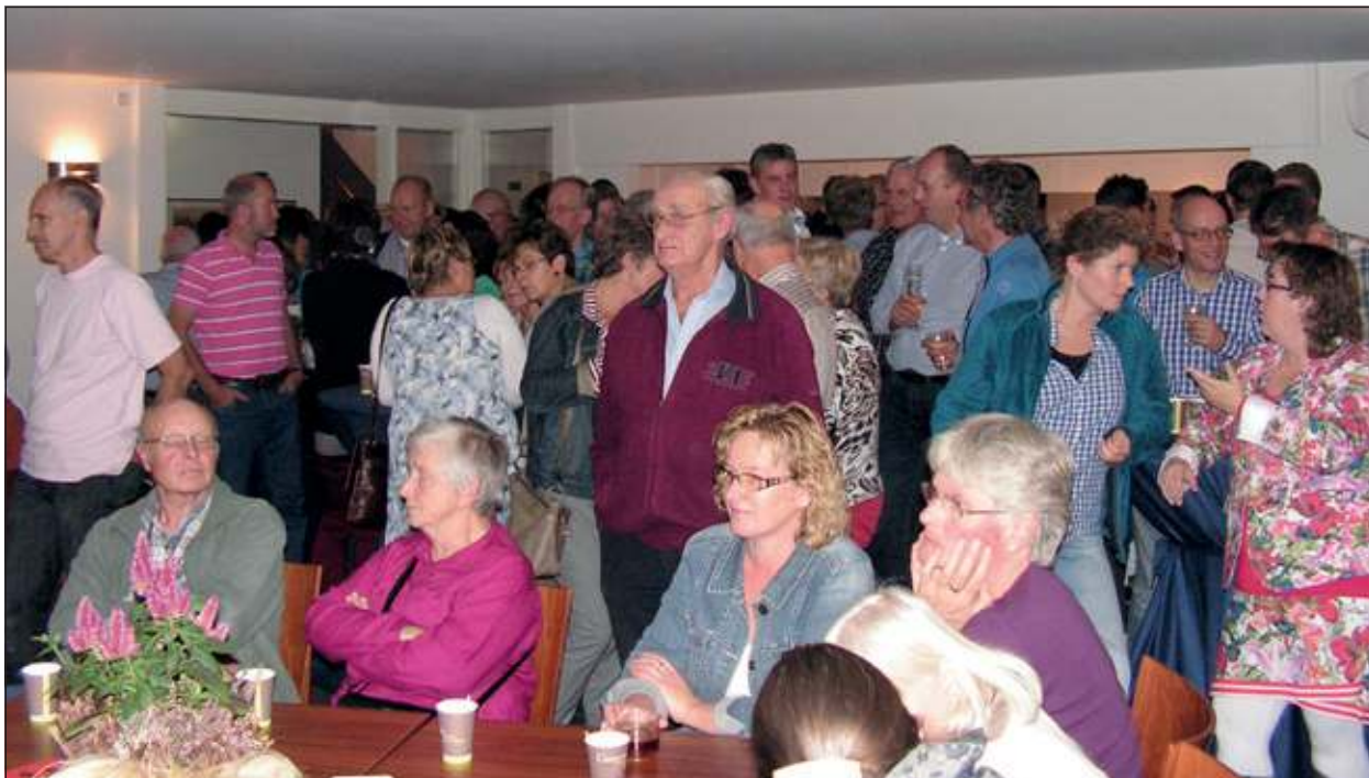
Het was druk op de Westbroekse dorpsborrel.

liedje 'Het dorp' van Wim Sonneveld. Toepasselijker kon het niet. Maar er waren ook meer eigentijdse beelden van de laatste Westbroekse Wieler-ronde. Een flitsende reportage met echt 'cleane' renners die gewoon op eigen kracht die dag er een mooi wielerspektakel van hadden gemaakt.