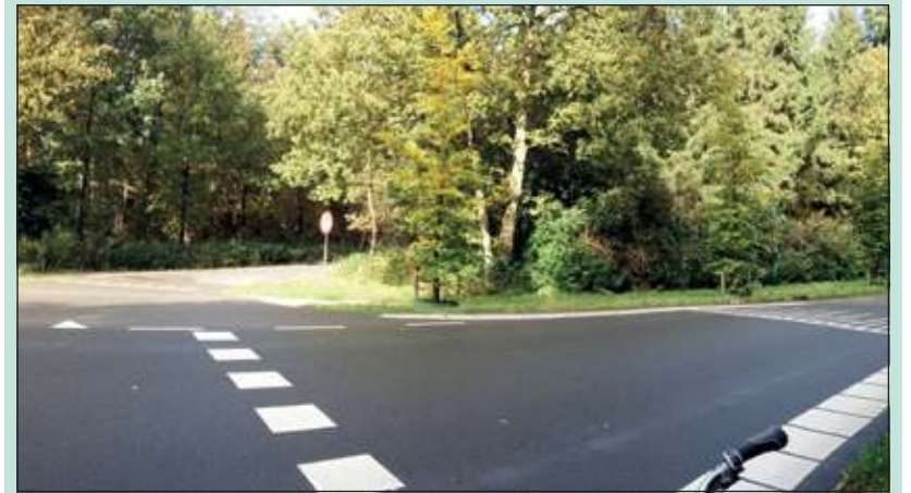
De grote bomen op de hoek ontnemen het zicht.