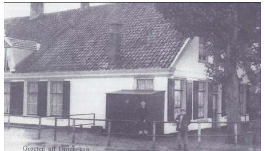
De herberg in 1915, na de verbouwing van 1909. De grond voor en aan de noordzijde van het pand is ter wille van de veiligheid omgeven door een ijzeren hek.