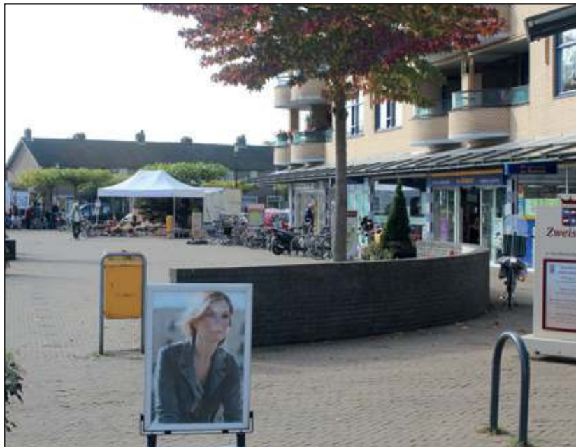
De verwachting is dat er medio 2013 gestart kan worden met de herinrichting van het Maartensdijkse Maertensplein.

Hoewel de inhoud van het plan nog niet exact bekend is, zal uitvoering ervan overlast met zich meebrengen als gevolg van graafwerkzaamheden. Omdat er op het Maertensplein nog meer zaken spelen zoals verbetering van de openbare verlichting en de eerder aangekondigde verplaatsing en/of aanpassing van het kunstwerk is ervoor gekozen om deze onderdelen samen te voegen in één project waarbij het gehele plein wordt aangepakt. Door de werkzaamheden te combineren kan er efficiënter gewerkt worden en blijft de overlast voor winkeliers, omwonenden en andere belanghebbenden beperkt. De verwachting is dat er medio 2013 gestart kan worden met de uitvoering. Voor die tijd worden belanghebbende partijen betrokken bij het proces om tot een definitief plan te komen. [HvdB]