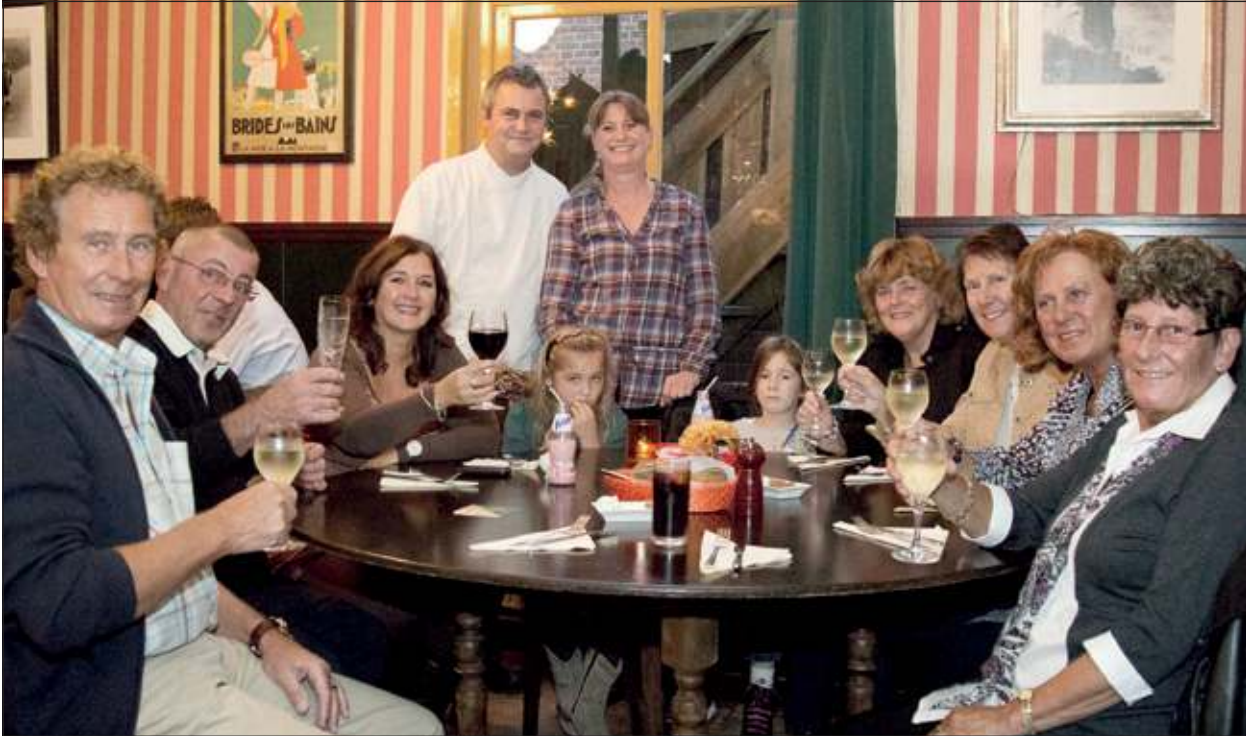
Na tien jaar is de aanschuiftafel in Dorpsbistro Naast de Buren nog steeds een groot succes.

Achttien maanden lang heeft De Vierklank twee keer per maand aandacht besteed aan het project De Bilt Schrijft. De mooiste, meest bijzondere verhalen worden eind van dit jaar gebundeld in het jubileumboek 'Verhalen van vroeger en nu, uit De Bilt, Bilthoven, Groenekan, Hollandsche Rading, Maartensdijk en Westbroek' dat begin maart 2013 verschijnt. Tot 1 januari kan het met korting worden besteld.