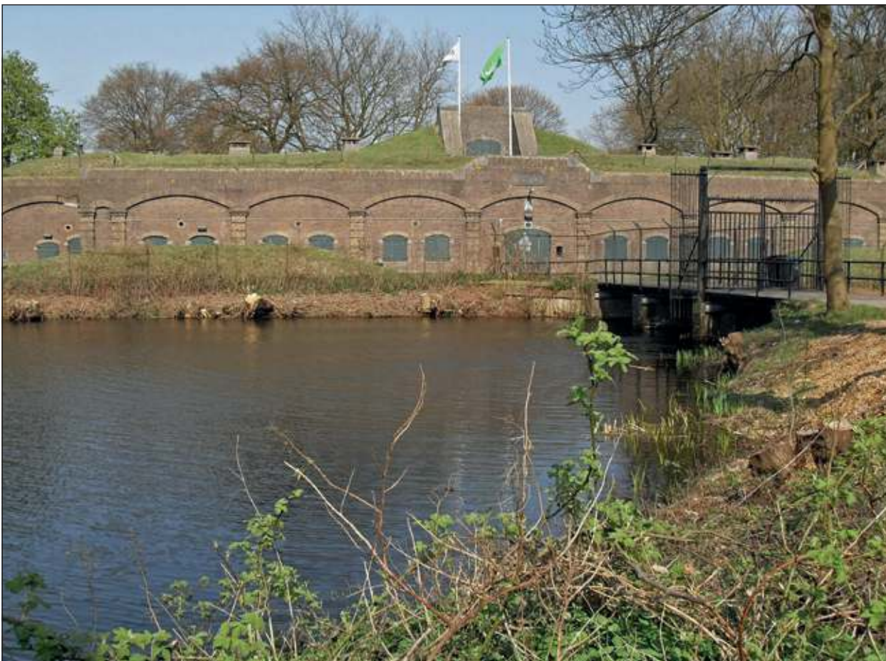
Tot eind dit jaar wordt er 3 x een rondleiding op het fort geven van ca. 1,5 uur.

Het Fort bevindt zich aan de Ruigenhoeksedijk 125a te Groenekan. De rondleiding begint om 13.30 uur