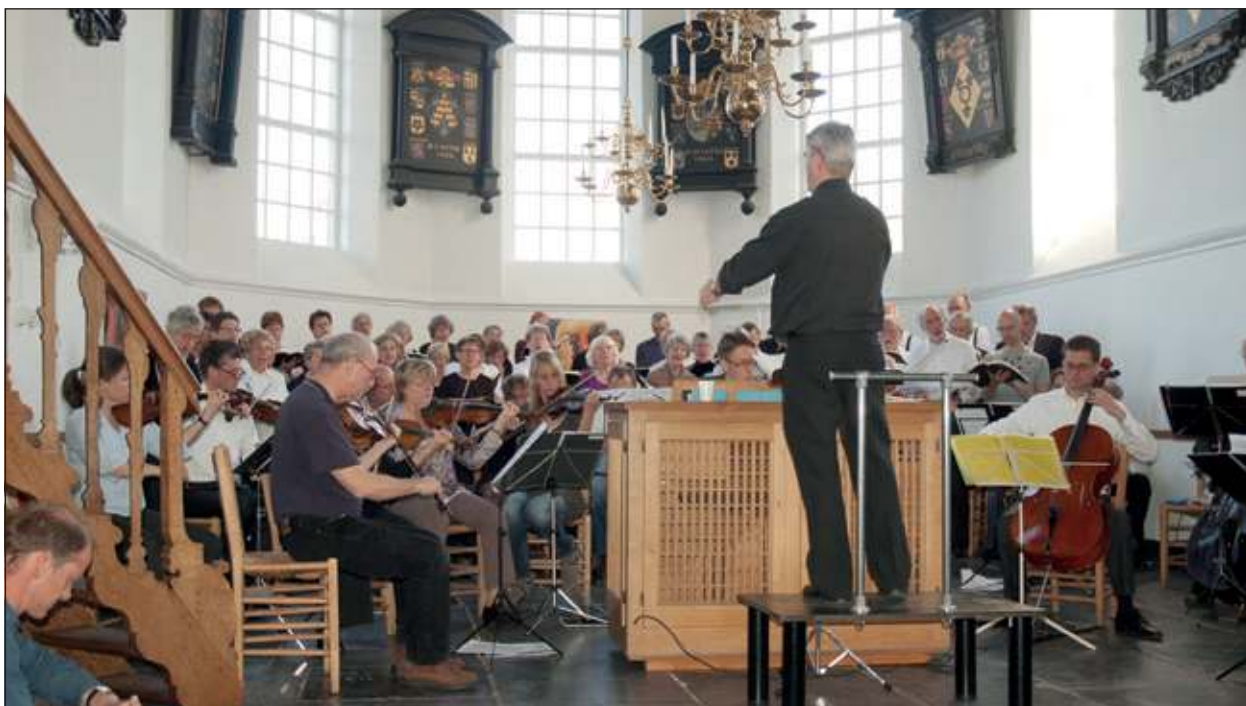
Het Cantatekoor oefent voor het Requiem van Mozart.

Het concert begint om 16.00 uur. Voorverkoop tot 19 november bij Dapper Thuis Kantoor, Julianalaan 36, Tobaccoshop Henk Hillen in winkelcentrum Planetenbaan, beide in Bilthoven en bij Optiek van Eijken op de Hessenweg 186 in De Bilt.