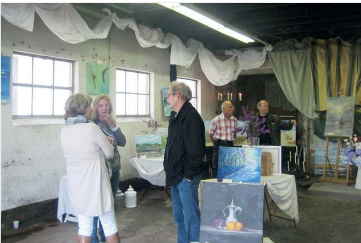
Voor de tentoongestelde werk was aardig wat belangstelling.