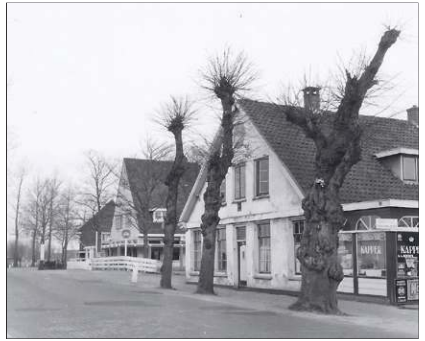
In het midden van de twintigste eeuw was er in het later afgebroken gedeelte een kapper gevestigd.

Het ingemetselde groene kannetje in de muur van de voormalige herberg op de hoek van de Groenekaneweg met de Kon. Wilhelminaweg is een stille verwijzing naar de naam van de kern. Welke pottenbakker dit kannetje heeft gemaakt, is niet bekend. Het kannetje is ook al eeuwen terug onlosmakelijk verbonden aan Groenekan en aan de gevel van daar aanwezige opstallen. Over de periode van voor 1740 is het archief van het gerecht Oostveen onvolledig en moe-