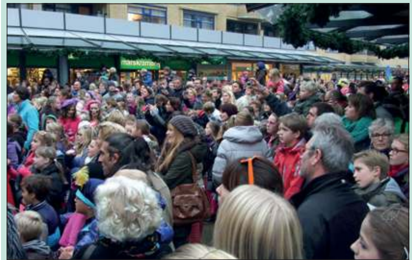
Het Maartensplein stond afgeladen vol om Sinterklaas te verwelkomen.

Er was nauwelijks tijd om uit te blazen want in de grote wagen die als toneel diende traden de jongedames van 2MOVE op met een spetterende show. De soplesse en de vrolijkheid straalden er van af. Terwijl Sinterklaas en wethouder Diteweg het podium beklommen en een korte tweespraak hielden was het plein intussen volledig vol gelopen. Maar voor een tweetal Pieten was dit de kans een jonge Piet aan te werven die eerst op het muurtje door mamma nog even werd bijgepoetst. Het sluitstuk van de dag was een rondgang van een lange stoet door de straten van het donker wordend dorp. [KP]