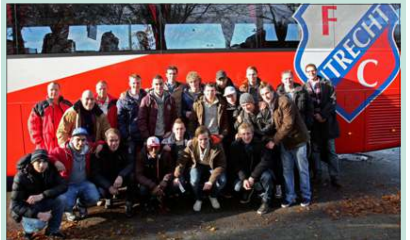
In de spelersbus van FC Utrecht naar stadion Galgewaard.

Ondanks dit tegenvallende resultaat ging het team een dag daarna met de spelersbus van FC Utrecht naar stadion Galgewaard voor de wedstrijd van FC Utrecht tegen FC Twente. In het stadion aangekomen mengde het eerste zich met vele honderden leden van FC De Bilt die eveneens in het stadion waren. Het was een prima sfeer in het stadion en ook die wedstrijd eindigde in een gelijkspel.