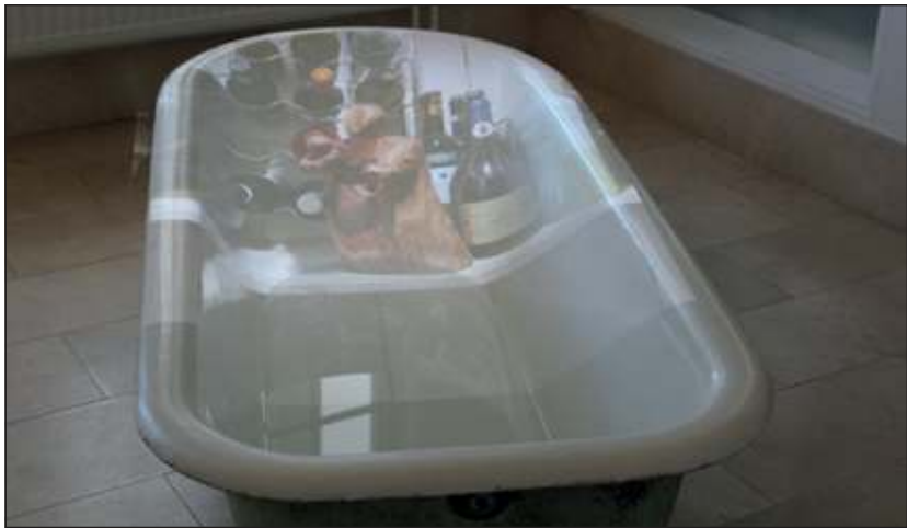
In een met water gevulde badkuip vindt een bijzondere fotoprojectie plaats.

De exposities in de ArtTraverse zijn te bezichtigen tijdens kantooruren maandag, woensdag en donderdag van 8.30 tot 17.00 uur, dinsdag van 8.30 tot 19.00 uur en vrijdag van 8.30 tot 16.00 uur. Op zondag 25 november, 9 december en 16 december 2012 van 14.00 uur tot 17.00 uur is de expositie in het gemeentehuis ook opengesteld voor publiek.