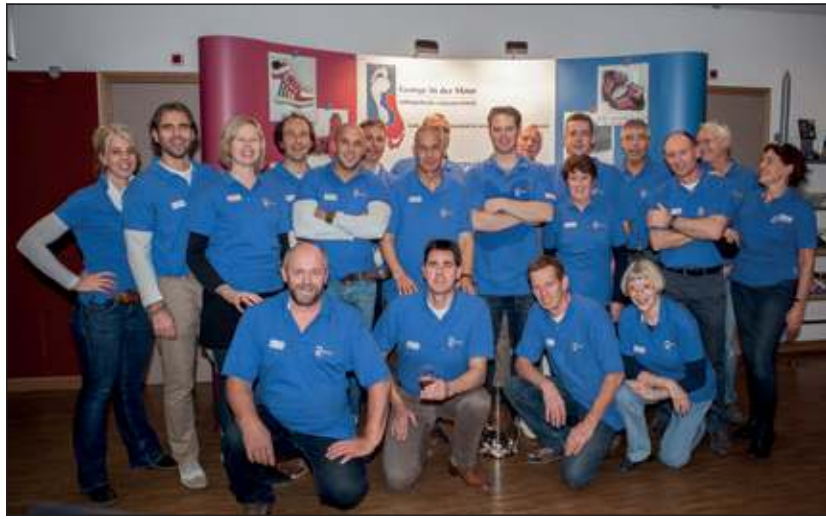
Het enthousiaste team kijkt terug op een zeer geslaagde open dag.

Iedereen kon gratis deelnemen aan de rondleiding en de voet- en schoencontrole. Met name 's middags stonden er tientallen mensen te wachten voor een voetconsult door de pedicure of orthopedisch schoenmaker.