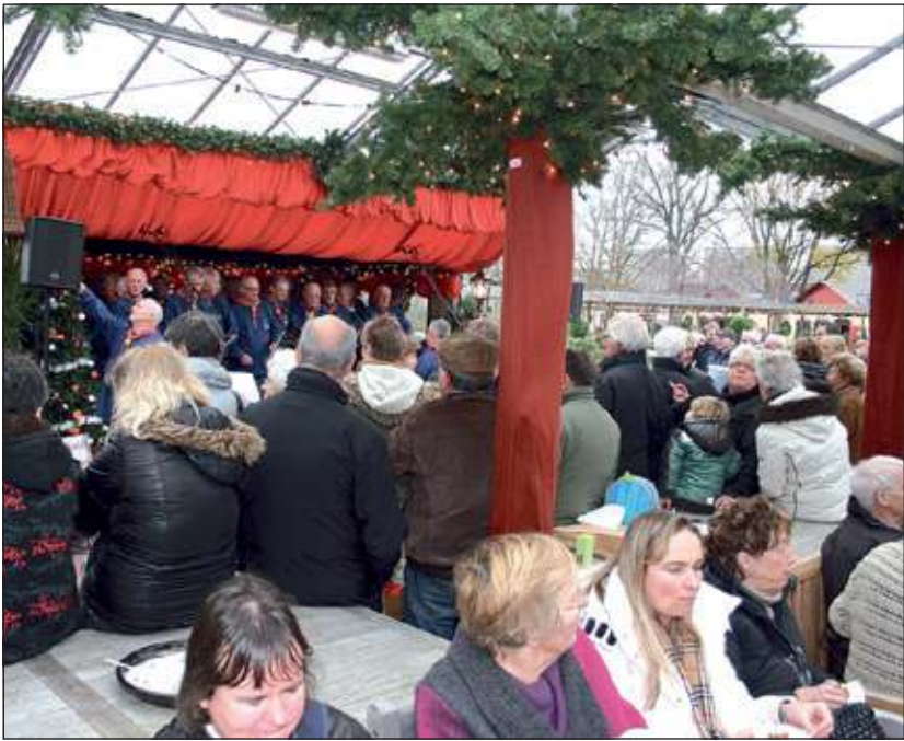
Ongeachte weertype, voor sfeer wordt gezorgd.

Ook zeer in trek is het overdekte smulplein. De plek waar vanuit de diverse eethuisjes allerlei smakelijke gerechten en dranken aangeboden worden. Erwtensoepp, warme chocolade, oliebolletjes, poffertjes en meer overheerlijke winterkost. In de overdekte kassen van 't Vaarderhoogt is een groot Kerstkoopparadijs ingericht dat vol staat met decoraties, kerst artikelen en wat dies meer zij. Een complete agenda van al wat er plaatsvindt is te zien op www.warmewittewinterweken.nl .