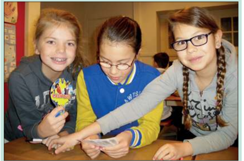
Leerlingen speelden enthousiast mee in de cashquiz.

De gastlessen zijn onderdeel van Bank voor de Klas en de winnende klas dingt mee naar een gratis excursie naar het Geldmuseum in Utrecht. Aan het eind van de les kreeg iedereen nog een cash-weetjes-kwartet mee naar huis.