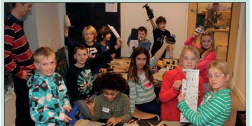
Donderdag 15 november werd de workshopserie op BSO de Wilde Poema afgesloten.

Op elke BSO in de gemeente De Bilt worden in workshopseries gegeven. Donderdag 15 november werd de workshopserie op BSO de Wilde Poema aan de Kees Boekelaan afgesloten. Daarna werden ook de kunstwerken die gebruikt worden in de tentoonstelling geselecteerd. [HvdB]