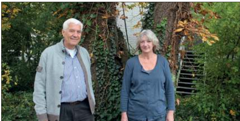
‘t Jodendom is de naam van het gebied waar voor de bouw van winkelcentrum de Kwinkelier en de drie grote flats een leefgemeenschap bestond van boerderijen en arbeidershuisjes. Het enige wat eraan nog herinnert is een oude kastanjeboom naast de uitgang van de parkeergarage onder de Kwinkelier, waar de auteurs graag poseerden.

Ook is het boek verkrijgbaar bij: Bilthovense Boekhandel-Julianalaan, Henk Hillen-Planetenbaan, Readshop- Hessenweg en Godefroy Boeken-Nieuwstraat.