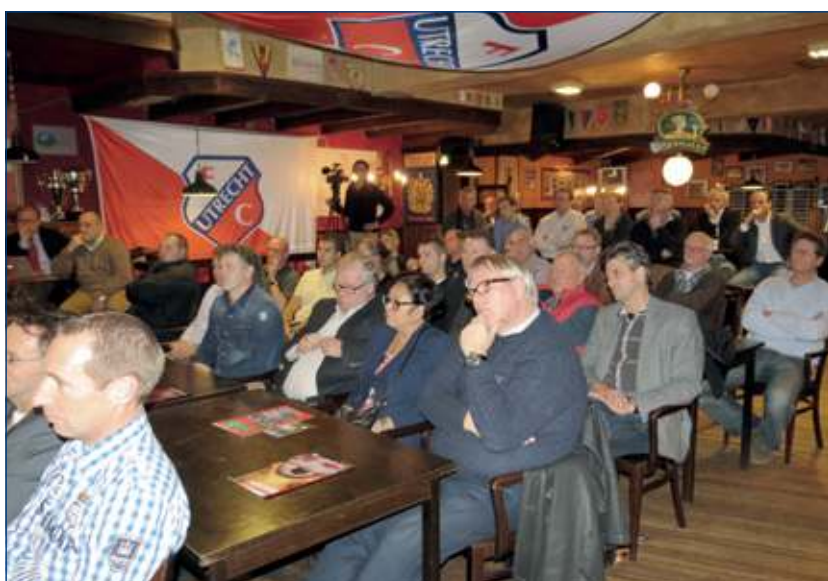
In de volle kantine wordt aandachtig naar de verhalen geluisterd.