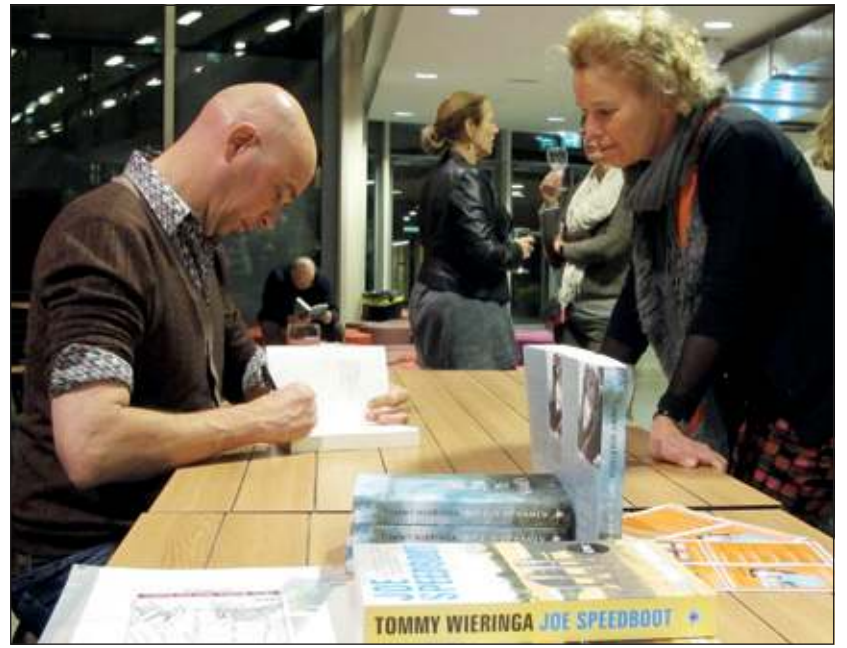
Tommy Wieringa's pauze liep enorm uit doordat veel mensen hun boeken door hem lieten signeren of met hem op de foto wilden.

Wat het meest opvalt aan het werk van Tommy Wieringa is zijn bloemrijke taalgebruik en zijn ongebruikelijke zinscombinaties van woorden en frases, die juist datgene aan zijn werk toevoegen wat het bijzonder maakt. Al voorlezend gaf hij soms nadere uitleg of provoceerde zijn toehoorders, bijvoorbeeld met de opmerking: 'Ik had het zelf niet verwacht, maar mijn voornaamste publiek bestaat uit leerlingen en bejaarden.' Wijzend op de stroken papier waarmee hij bepaalde bladzijden had gemarkeerd in de boeken die hij had meegenomen voegde hij toe: 'Voor elke doelgroep een andere kleur. Paars voor oudere dames, groen voor kinderen.' Ultrakorte verhalen schrijft hij liever dan complete boeken, maar van die laatste moet hij het toch hebben. 'Ik ben