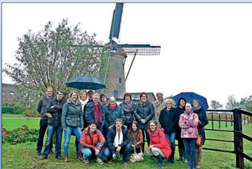
De mensen achter 'De Bilt Schrijft': de bijna voltallige redactie bij de onlangs gerenoveerde molen Geesina in Groenekan. Foto: Irene Kuizenga.*

De projecten staan nogal verborgen op de website van Kern met Pit, maar op www.debiltschrijft.nl staat een directe link bij het logo van Kern met Pit.