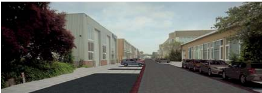
Dit aantrekkelijke beeld zal bijdragen aan de populariteit van de Industrieweg in Maartensdijk.