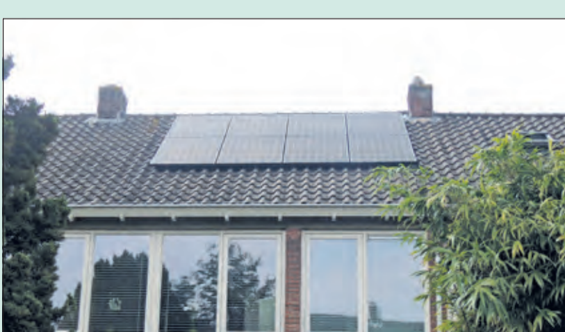
Beng informeert over zonnepanelen op je dak.

Aanmelden kan via info@beng2030.nl waarna bericht volgt over tijd en plaats. Er zijn geen kosten verbonden aan de avond. Neem de energierekening mee om inzicht te krijgen in het verbruik. Deze infoavond wordt regelmatig gehouden. Kijk voor meer informatie, ook voor de andere activiteiten, in de agenda op www.beng2030.nl. BENG! is de lokale duurzame energiecoöperatie voor en door inwoners van de gemeente. De bijna 400 leden streven naar een energieneutraal De Bilt in 2030.