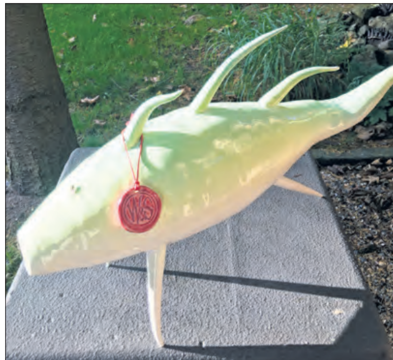
Werk van Welhuis&Smit: 'Schubert'.

voegt de kleurige inbreng van Smit een unieke nieuwe dimensie toe aan de keramische sculpturen van Welhuis&Smit. De gekleurde keramische beelden van Welhuis&Smit gaan in gesprek met de sferische werken van Spaltro.