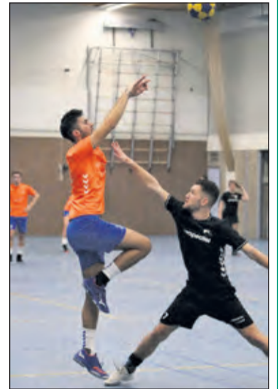
Beeld uit een enerverende wedstrijd.

De twee doelpunten achterstand werkte DOS na de pauze snel weg. Vanaf 8-8 ging het gelijk op tot 11-11. Bij deze stand halverwege de 2e helft scoorde Unitas vier maal op rij en leek het beslissende gat te slaan. Maar DOS gaf zich niet gewonnen en bij 15-15 was de stand weer gelijk getrokken. Bij 15-16 keurde de scheidsrechter voor de tweede maal een doelpunt van DOS af en besliste Unitas in de volgende aanval de wedstrijd met een doelpunt. Met nog een laatste doelpunt, bepaalde DOS in de laatste minuut de eindstand op 16-17. Komende zaterdag speelt DOS een uitwedstrijd tegen Amicitia. De wedstrijd in Vriezenveen begint om 19.30 uur.