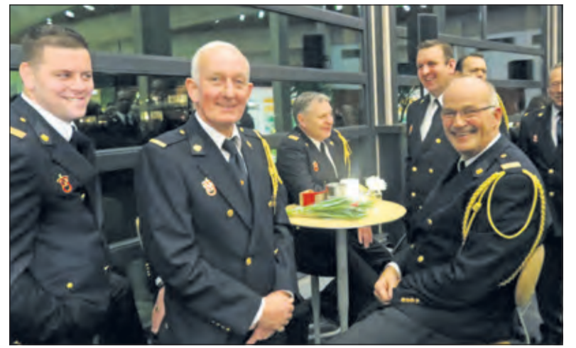
Brandweerhelden mochten natuurlijk niet ontbreken.

toekomst kijken maar daarnaast is het essentieel dat we het verleden doorgeven.' Op 5 mei organiseert de gemeente een vrijheidsontbijt waarbij ook vertegenwoordigers van alle kernen worden uitgenodigd. Het volledige jaarprogramma van 75 jaar vrijheid in De Bilt komt op de website van de gemeente te staan, www.debilt.nl .