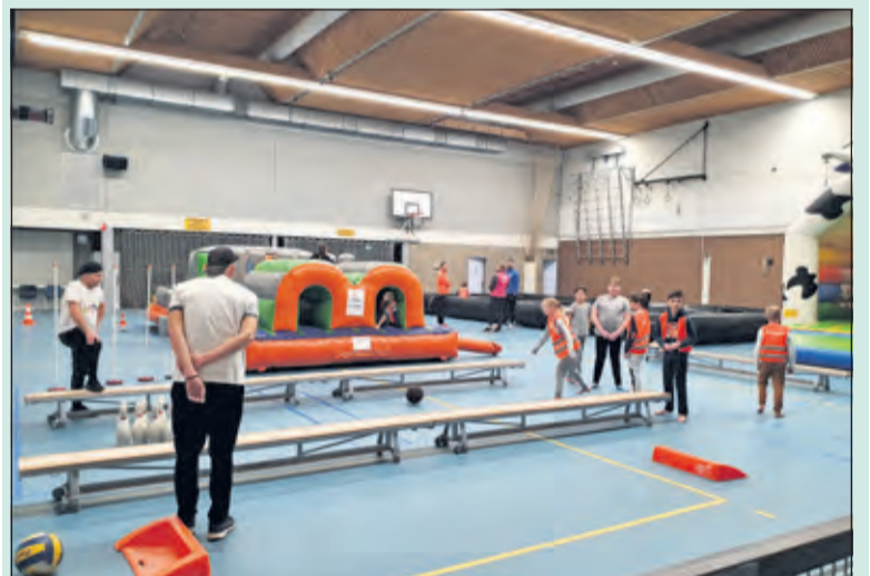
Bowlen in De Vierstee.

De organisatie ontving niet alleen vele maatschappelijke organisaties, sportverenigingen en iedereen tussen 4 en 99 jaar, maar ook schreef zij nieuwe doelgroepen aan. 'Ook van deze editie blijft mij weer heel veel bij', vertelt Plug. 'Zoals de fysiotherapeuten bezig waren met de bewoners van het Thomashuis of dat zo'n 70 kids hun kunstjes uitvoerden op de rolschaats. Echt heel bijzonder. En dan heb ik het nog niet eens over