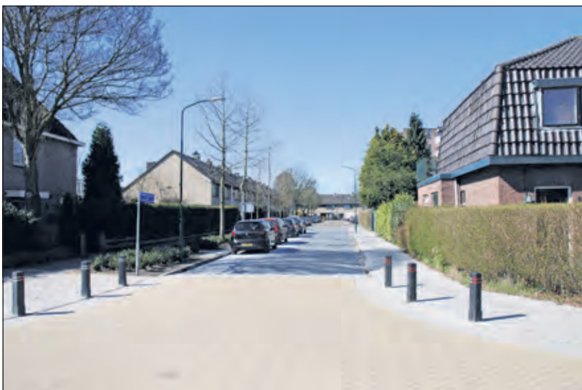
Ter plaatse van de op-rit kwam de Prof. Dr. Tinbergenweg.