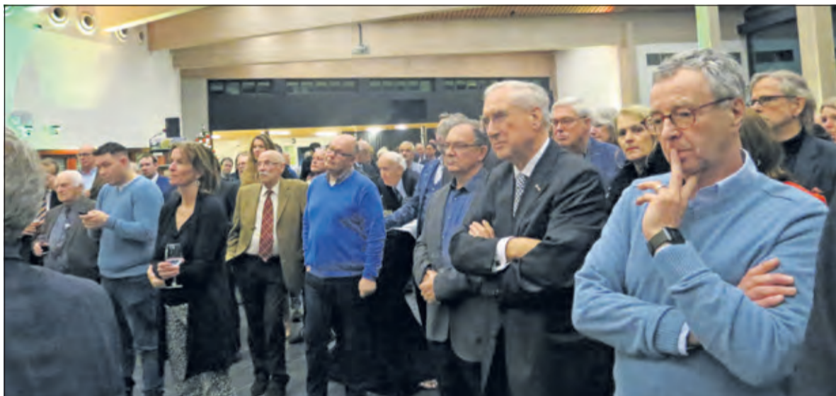
Een en al oor voor de toespraak van de burgemeester.

ding met elkaar te zoeken. Terecht hebben veel inwoners de afgelopen maanden daar nadrukkelijk om gevraagd’, aldus de burgemeester. De gemeenteraad stelde begin 2019 een document vast over Biltse ambities in regionaal verband. Deze ambities zijn vertaald in het programma Biltse Bouwstenen dat gaat over duurzame ontwikkeling, economie, wonen, mobiliteit en ons buitenge-