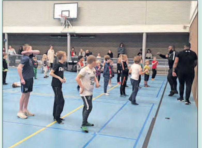
De jeugd doet graag mee aan een gezamenlijke les.

Kerst en Oud & Nieuw waren nog niet voorbij of er stond alweer een nieuwe activiteit op het programma van De Vierstee. Donderdag 2 en vrijdag 3 januari ging het dak eraf in Maartensdijk. De Vierstee was twee dagen lang vergeven van activiteiten: breakdance, dansen, pilates en diverse sporten.