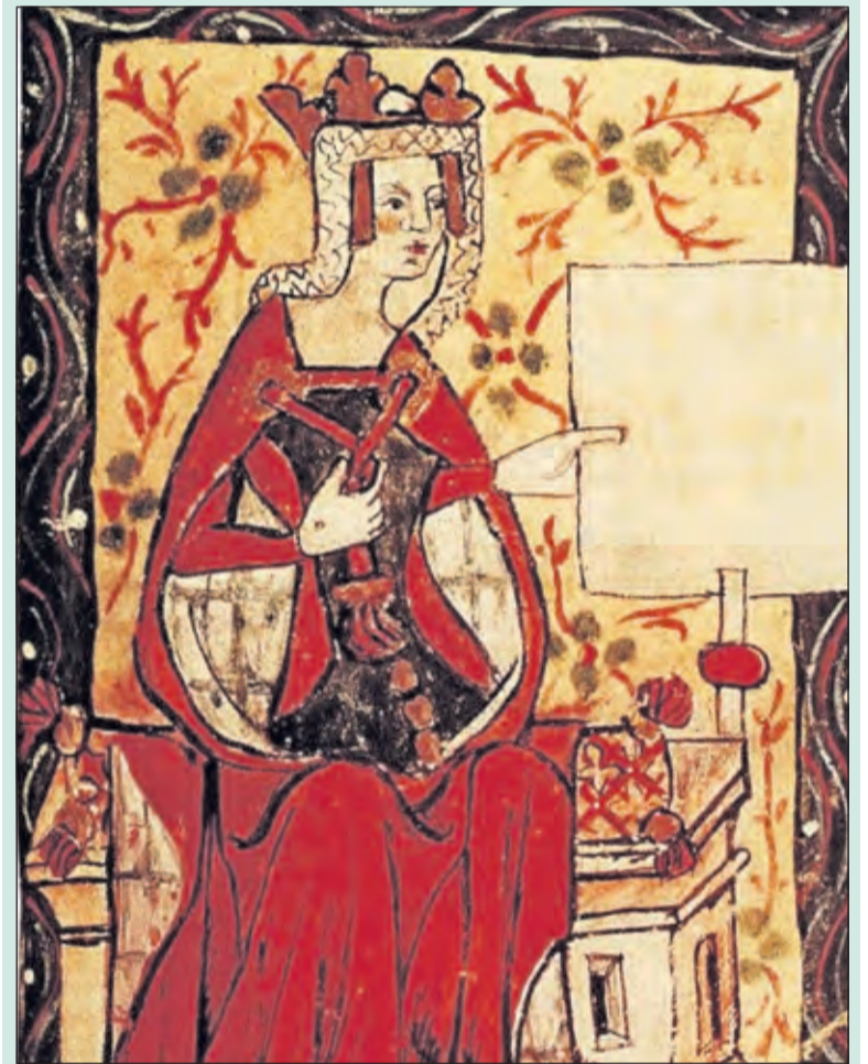
Keizerin Mathilde (1102-1167), echtgenote van keizer Hendrik V (1181 of 1186-1125). Mathilde gaf het document uit, dat de officiële erkenningsdatum van het klooster Oostbroek bevatte: 14 maart 1122. (De afbeelding komt uit een Geschiedenis van Engeland door monniken van het klooster St. Albans, uit de vijftiende eeuw, te vinden in de British Library en komt van het Onlinemuseumdebilt.nl).

Op Mathildedag wordt gevierd dat op 14 maart 1122 de gronden van het huidige De Bilt aan het nieuwe klooster Oostbroek zijn geschonken. Utrecht en Holland maakten toen deel uit van het Duitse Keizerrijk. De schenking geschiedde door de Duitse keizerin Mathilde.