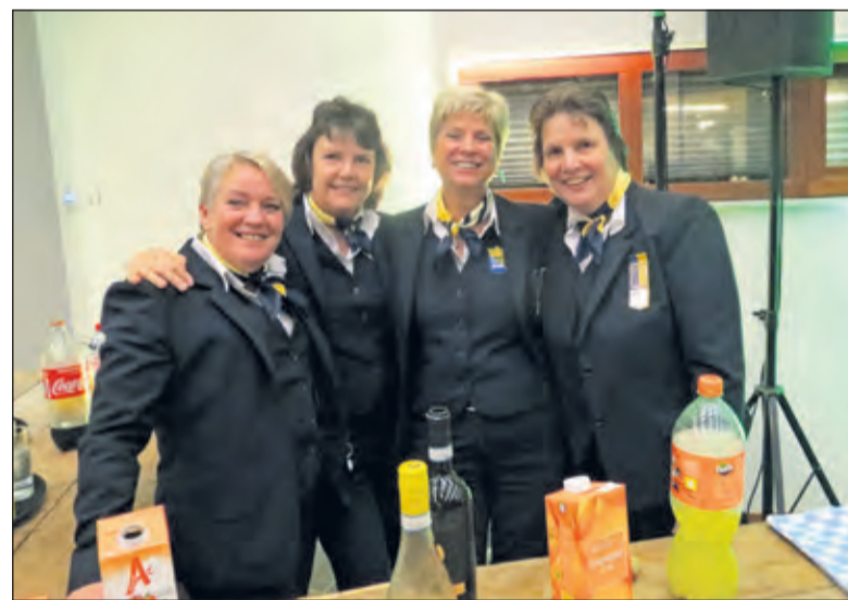
De Nieuwjaarsreceptie kon alleen maar slagen door de inzet van de bodes van de gemeente.