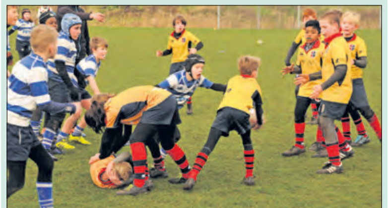
Aanval van de Stichtsche Wolven tegen Hilversum.