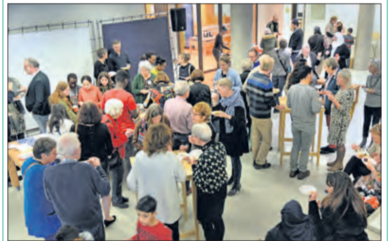
Druk bezochte nieuwjaarsbijeenkomst van Steunpunt Vluchtelingen.

Als we meer elektrisch gaan rijden krijgt het milieu veel minder te lijden en met een auto of fiets hoor je dan ook bijna niets en zo worden het duurzame tijden