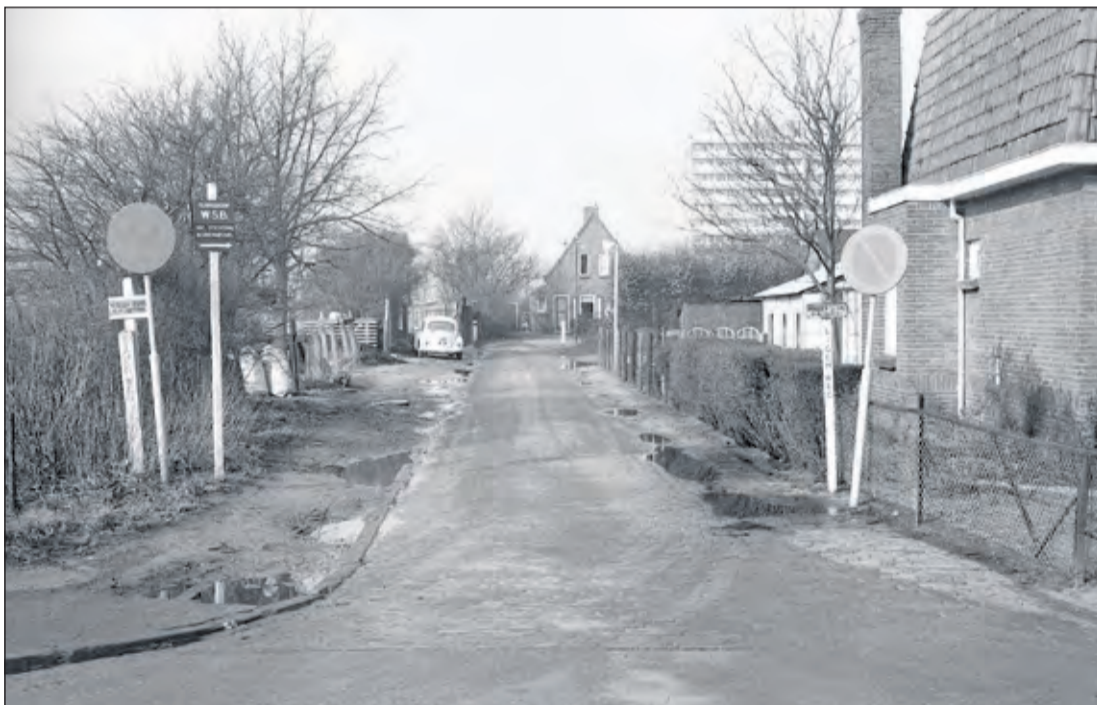
Het huis van de opzichter van de Gemeentewerf aan de Waterweg in De Bilt eind jaren zestig

Met een foto van weleer, de camera van nu en tekst van overal ((dorps-)historici en eerdere publicaties) gaan we kriskras door de kernen van deze gemeente. [Henk van de Bunt]