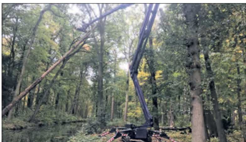
Van boomonderhoud tot straatjes leggen; de klant vindt nu alles onder één dak.

Per 1 januari 2020 startten Arjan en Cor hun gezamenlijke bedrijf, er komt een vestiging aan de Industrieweg 38 in Maartensdijk en starten zij een vestiging in Doorwerth, vlakbij Arnhem. Arjan: 'Waarom helemaal in Doorwerth, vraag je je misschien af? Ik woon in Doorwerth en in dit mooie gebied rond Arnhem kunnen wij een extra klantenkring opbouwen'.