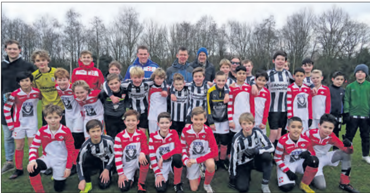
Een team van FC De Bilt onder 12/13 (rood/wit) speelt tegen een team van Hercules onder 13/14 uit Utrecht.

Na afloop van de reeks wedstrijden kijkt de organisatie hierop tevreden terug. Zoals bedoeld zijn alle wedstrijden heel sportief verlopen. Na afloop van iedere wedstrijd bedanken de tegenstanders elkaar met een handdruk. Precies zoals het hoort.