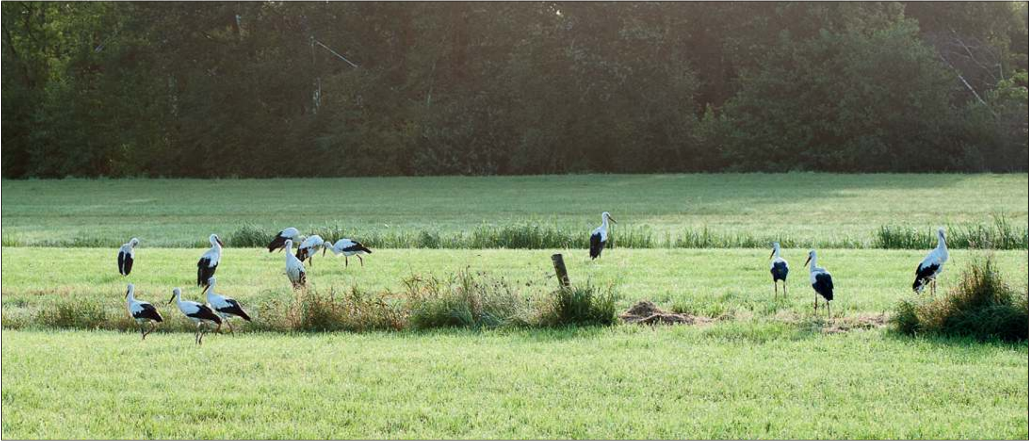
Fotograaf Roel van Norel uit Hollandsche Rading zond ons bijgaande foto van 13 (van de 22 ooievaars) donderdagochtend in het gebied ten oosten van en tegenover het voormalige 'Braadspit' aan de Koningin Wilhelminaweg te Maartensdijk.