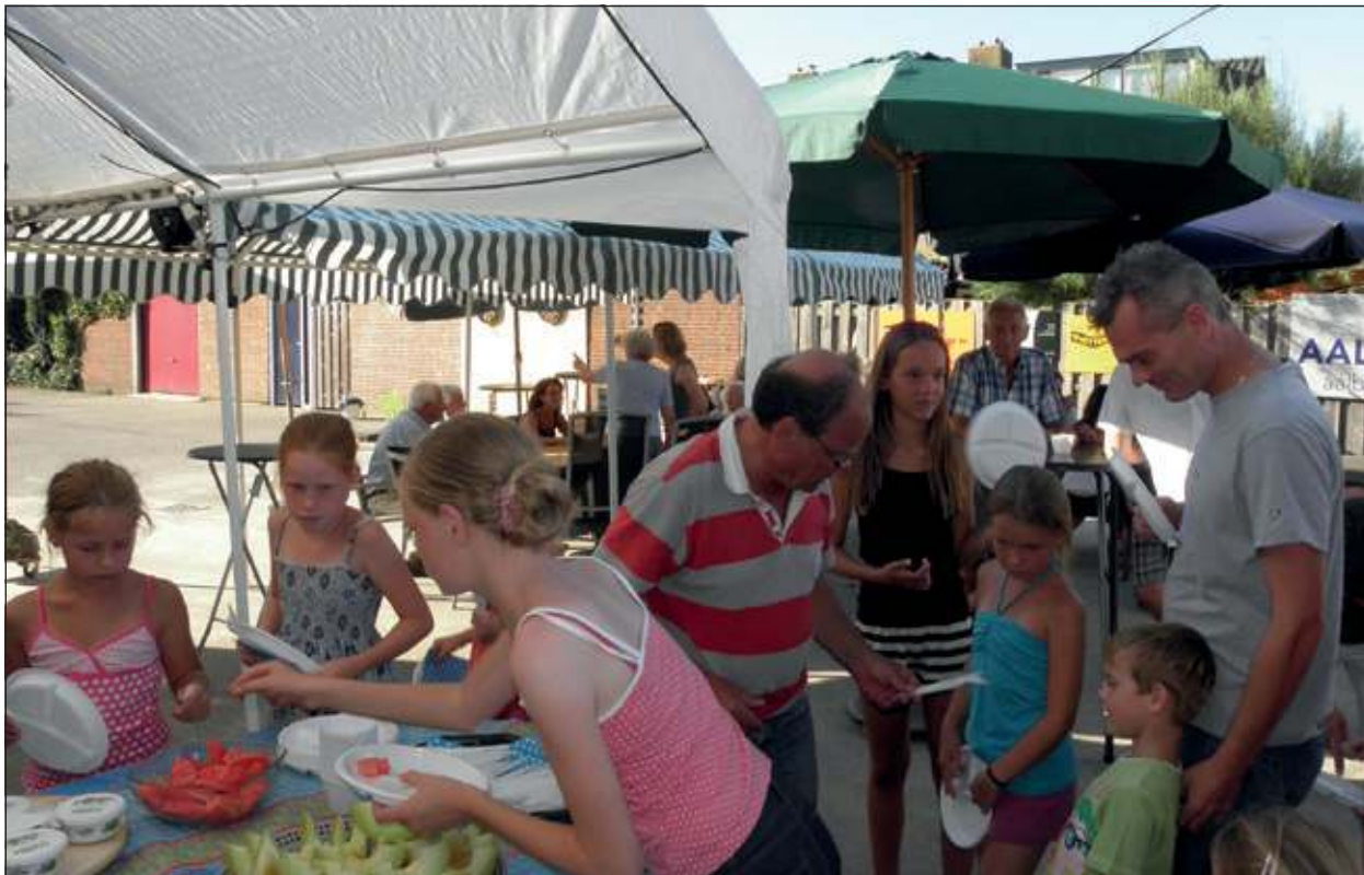
Smakelijke afsluiting van de pleinplezierweek.

Volgend jaar kunnen de pleinbewoners het tienjarig jubileum tegemoet zien. De plannen en ideeën hiervoor zijn afgelopen week al gesmeed. Met een trots gevoel kunnen ze terugkijken op een week van gezelligheid en gezamenlijkheid. Een pleinplezierweek die ook in de andere 51 weken zijn weerklank heeft. (Dennis Top)