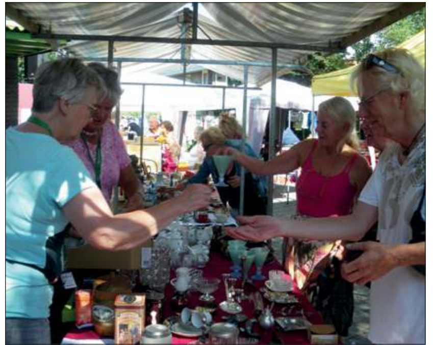
De rommelmarkt in servicecentrum 't Hoekie bood een grote variatie aan koopjes, waar bezoekers gretig gebruik van maakten.

en een workshop. Later op de middag gaf hun docent, die in de gemeente De Bilt ook buikdanses geeft, een oosters getint optreden onder haar artiestennaam Sulena. Vrijwilligers van 't Hoekie verkochten elk uur loten voor allerlei kleine en grote cadeaus, waarna een van hen aan het Rad van Avontuur draaide en de gelukkige winnaars hun prijs uitreikte. De opbrengst van de rommelmarkt komt ten goede aan de vrijwilligersactiviteiten. [LvD]