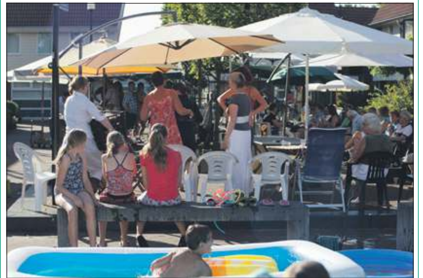
Op wat wellicht later de warmste zaterdag van 2012 genoemd kan worden, hielden de bewoners van de Maartensdijkse Nassauhofen de wijk eromheen een bijzonder gezellige barbecue. Tewijl de volwassenen zich tegoed deden aan de voortreffelijke vleeswaar en salades, vermaakte de jeugd zich op het springkussen en in de zwembadjes.