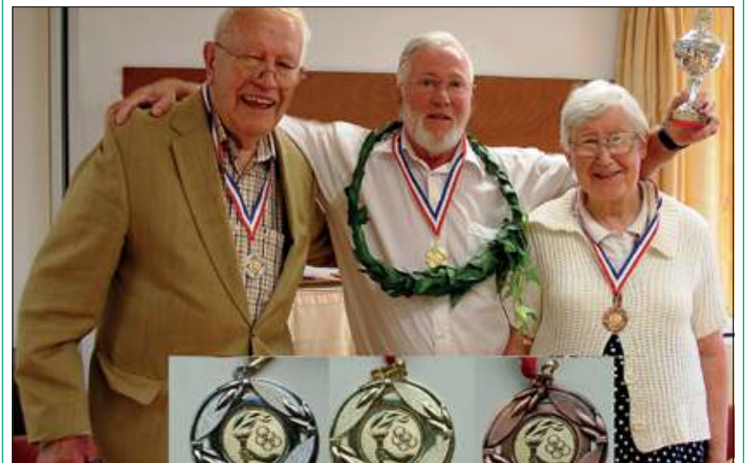
Goud, zilver en brons kregen ook in Maartensdijk een plekje.

Nu we al weer wat uit de ban van de Olympische Spelen zijn, is het tijd om nog even na te mijmeren over Olympische Kampioenen dicht bij huis. Op acht augustus kregen we in Maartensdijk onze eigen Olympische Medaillisten!