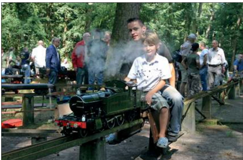
Op deze foto uit 2010 is het plezier van organisatie en deelnemers goed herkenbaar.

Tijdens de Dorpskerk Marktdag op zaterdag 8 september a.s. is een groot deel van de Biltse Dorpsstraat ingericht met kramen, waarin clubs, verenigingen en organisaties zich presenteren. Stoomgroep Rading Spoor zal daar ook vertegenwoordigd zijn. Een modelstoomtrein rijdt die dag ook op de Dorpsstraat