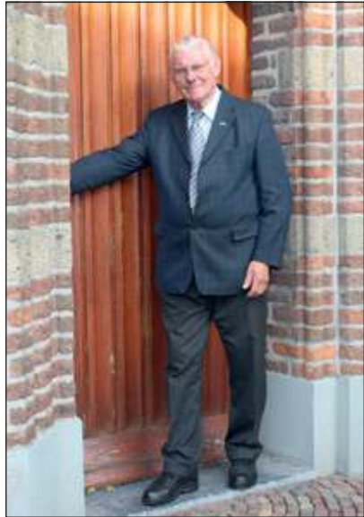
De auteur bij de toreningang van de Hervormde Kerk te Maartensdijk.

en een belangrijke fase in de Utrechtse kerkgeschiedenis: het ontwerp van