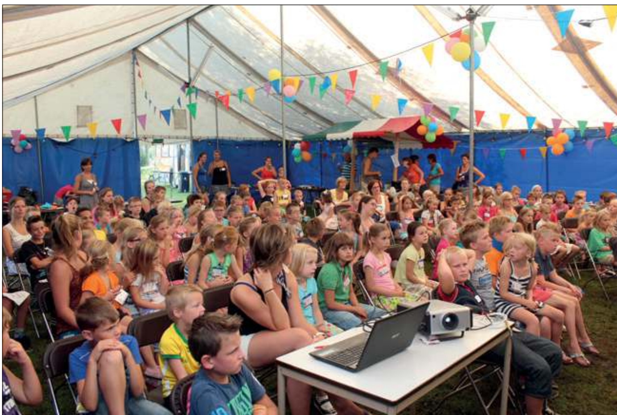
Vorige week werd in Westbroek de drie dagen durende Vakantie Bijbel Week gehouden. In tenten aan de Molenweg in Westbroek was er voor de plm. 110 deelnemers een kinder- en 's avonds voor (plm. 25) jongens en meiden vanaf 12 jaar een avondprogramma. Donderdagavond werd dit gezamenlijke project van de Hervormde Kerk en de Nederlands Gereformeerde Kerk (beiden uit Westbroek) afgesloten met een korte samenvatting en terugblik met foto's van de VBV. [HvdB]