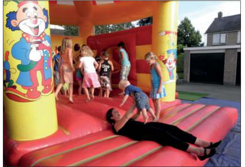
Op de laatste dag zorgde ook het springkussen weer voor eindeloos plezier.