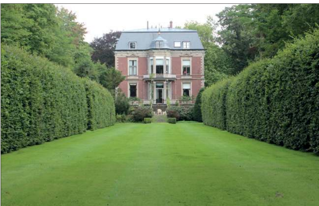
Tegen de linkerkzijgevel staat over nagenoeg de gehele hoogte van de gevel een driehoekige erkervormige uitbouw die bekroond wordt met een opvallend dak koepeltje.

Tijdens Open Monumentendag zal Dhr. J. Copijn om 12.00 uur en 14.00 uur een rondleiding geven.