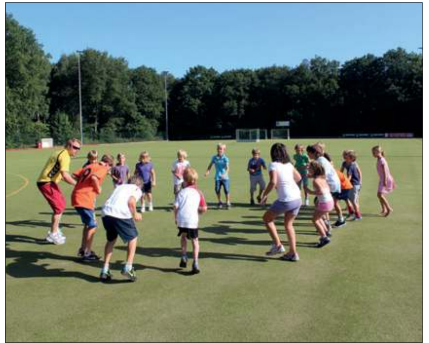
Op en rond het grasveld naast het scholencomplex aan de Nachtegaallaan in Maartensdijk werd van 10.00 tot 16.45 uur gehold, gestoeid, gesprongen, gevoetbald en vooral veel plezier gemaakt. De deelnemers zeiden volgend jaar weer mee te doen. [KP]

bridge in het Dorpshuis aan de Dennenlaan in Hollandsche Rading. Voor niet leden van Bridgeclub Hollandsche Rading zijn de kosten van deelname € 2,00 per persoon per avond. Vooraf aanmelden van zowel leden als niet-leden per paar wordt dringend geadviseerd en kan bij voorkeur per e-mail naar bchollandscherading@gmail.com of telefonisch naar 06 26947689. In het uiterste geval kan mogelijk ook nog worden ingeschreven op de betreffende donderdag ter plaatse per paar tot uiterlijk 19.15 uur, wanneer het maximum aantal paren nog niet is bereikt. [HvdB]