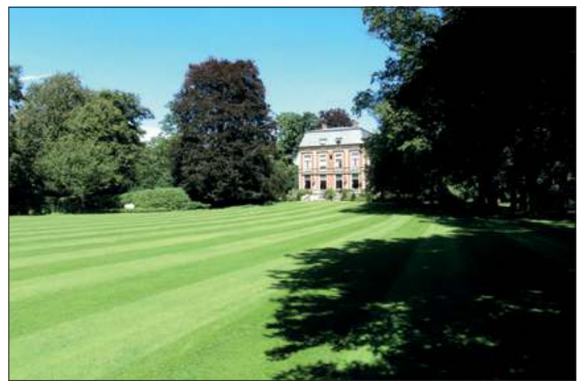
Het huis is niet opengesteld, maar de prachtige tuinen wel.

In 1991 werd door Domeinen het huis en park te koop aangeboden en door ons gekocht. We wonen er vanaf 1993. Sindsdien zijn we bezig geweest om de tuin weer te restaureren, bijgestaan door tuinarchitect Jörn Copijn. Dit was een omvangrijk werk, aangezien van de oorspronkelijke aanleg wel het lanenstelsel en de bomen bewaard waren gebleven, maar niet de heesters. Rekening houdend met het plantensortiment dat Springer gebruikte hebben wij weer heesters aangeplant'.