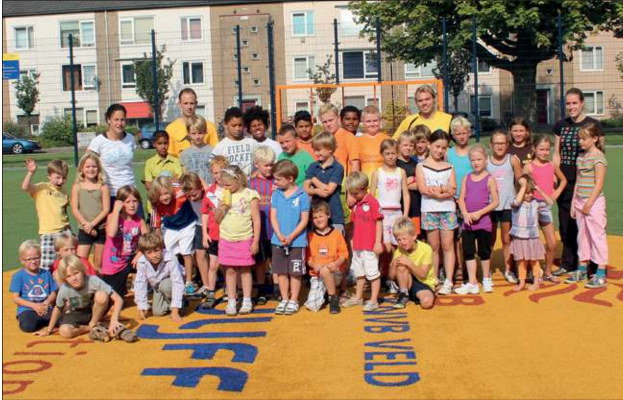
Goede belangstelling in De Bilt.

mate van belangstelling was er ook op de dinsdag op het Cruyffcourt in De Bilt en op donderdag op de velden van SCHC in Bilthoven. En ook op vrijdag op het scholencomplex aan de Nachtegaallaan was er - zeker in vergelijking met 2011, toen er geen enkele aanmelding was - sprake van een goede belangstelling.