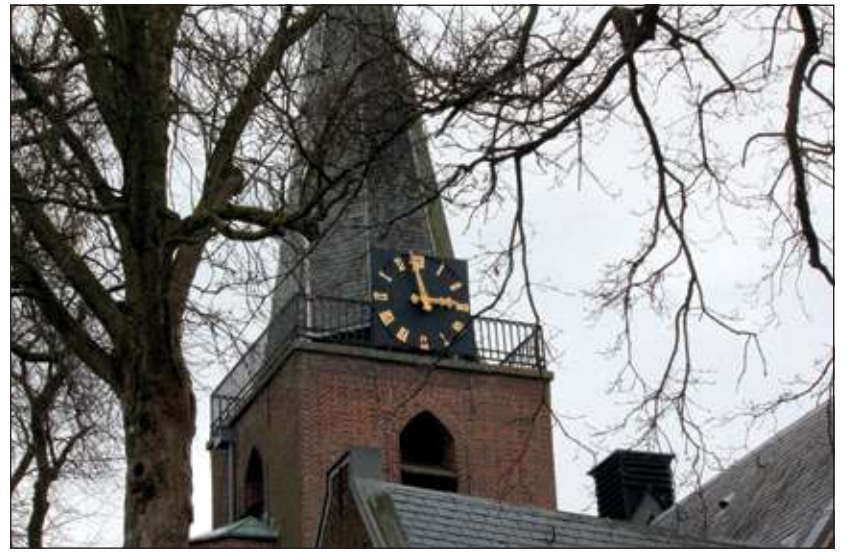
Rond 1465 werd de Sint Jacobskapel, het oudste gedeelte van de huidige Dorpskerk gebouwd.

Uitgebreid aan bod komen het interieur en exterieur van de Dorpskerk, de brand in de pastorie en kerktoren in 1692, wetenswaardigheden over de kerkklokken, de indeling van het kerkgebouw, alsook veel detailinformatie over de kansel, het kerkorgel en tal van andere onderdelen in de kerk. De predikantenlijst vanaf 1590 tot 2012 en een uitvoerig overzicht van de beroepen predikanten vanaf 1787 tot 2010 zijn in dit boek opgenomen. Een drietal: predikanten uit vroeger eeuwen, die de gemeente van Maartensdijk hebben gediend, zijn nader voor het voetlicht gebracht. Informatie uit oude kerkenraadnotulen en gegevens over het aantal lidmaten in de 17e, 18e en 19e eeuw geven een interessant beeld van de geschiedenis van onze gemeente. Het boek geeft ook een korte beschrijving van de oude