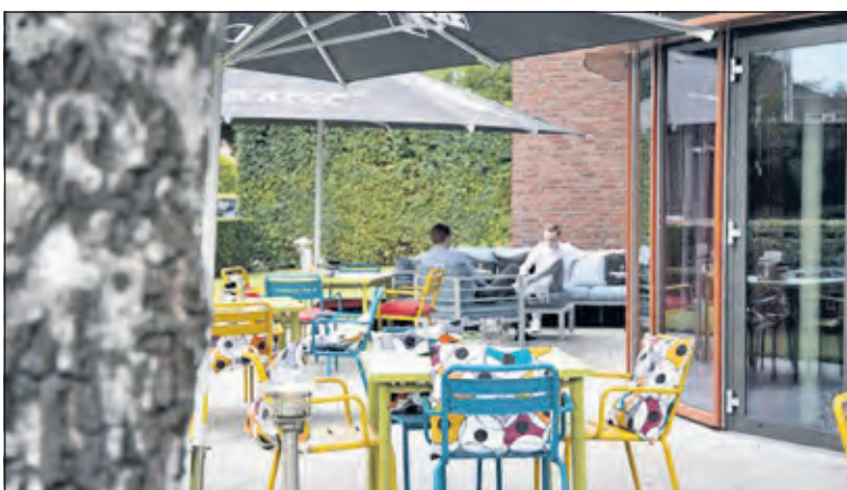
Een terrasje pikken bij Restaurant Bij de Tijd is er straks niet meer bij.