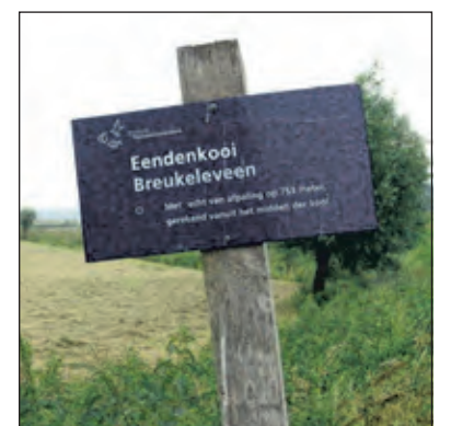
Bordje bij het hek op de weg langs het Tienhovens kanaal, met daarop de vermelding van een oud Kooirecht.

Niet alleen eendenkooi Breukeleven is een bezoek waard. De Tienhovense plassen is een typisch Hollands laagveengebied en uniek in Europa. De vrijwillige boswachters van Natuurmonumenten kunnen je meer vertellen over de ontstaansgeschiedenis van het gebied en over alles wat hier groeit, bloeit, kruipt en vliegt. Voor nadere informatie en groepsexcursie kan contact worden opgenomen met boswachter Niels Schouten, de terreinbeheerder van Natuurmonumenten, n.schouten@natuurmonumenten.nl of 06 - 542 952 04.