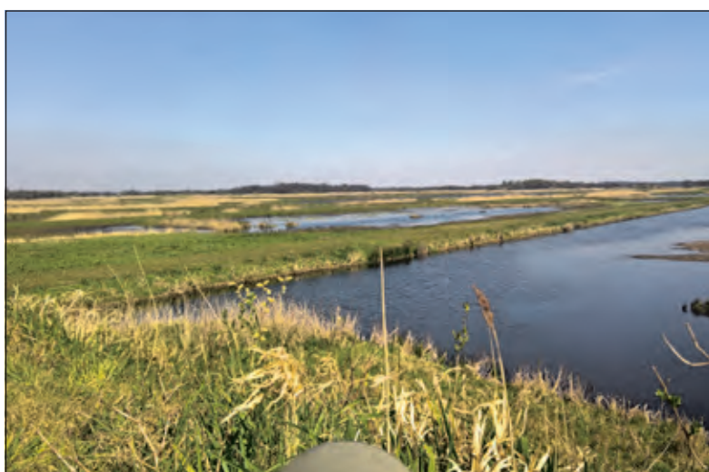
Zicht op deel van Oostelijke Binnenpolder (foto 9 april 2020) vanaf vogelkijkpunt.

Klimmen naar de top Zwaarwichtig of vederlicht Klim in vrije vlucht