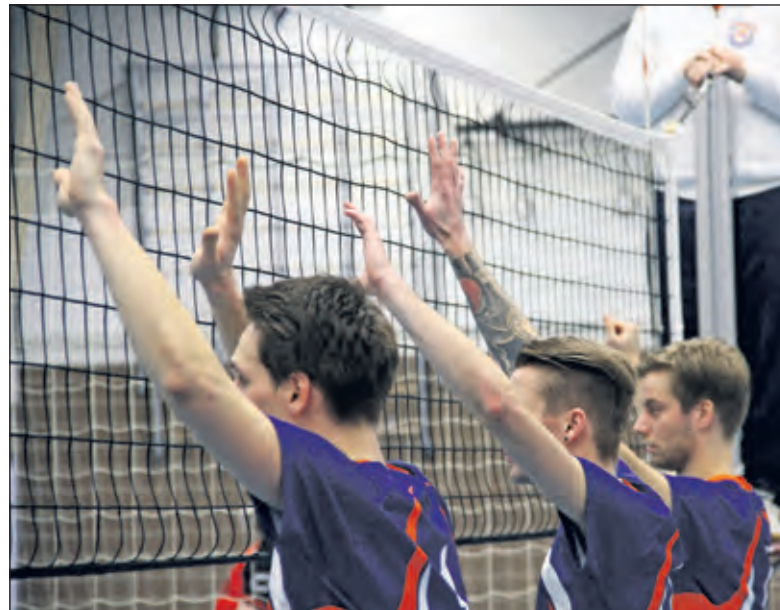
Voor nadere informatie en trainingstijden zie www.salvo67.nl

Bij Salvo wordt ook buiten de selecties om met plezier gespeeld. Zowel dames als heren van de overige competitieteam zijn we-