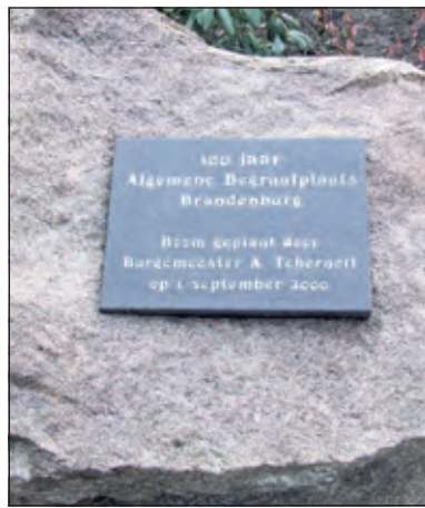
De herdenkingssteen met plaquette die ter gelegenheid van het honderdjarig bestaan werd gelegd.

tenboom bleek niet te behouden. In 2012 kreeg het monument een definitieve nieuwe plek bij een nieuw geplante roodbladige treurbeuk. De plaquette op de herdenkingssteen