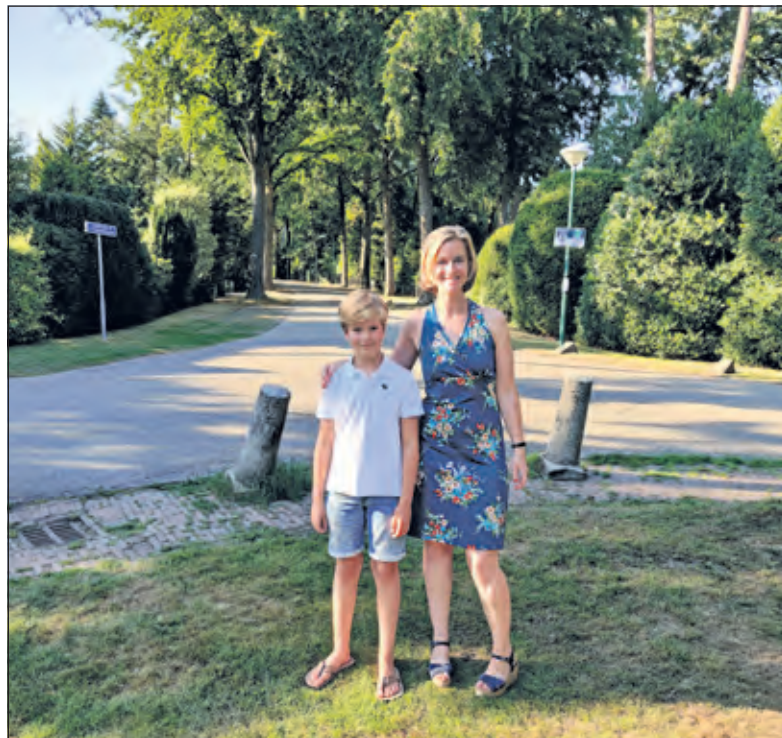
Moeder en zoon zijn er alvast klaar voor.

Het KWF zoekt nog collectanten in De Bilt voor de eerste week van september. Voor meer informatie: let van der Feltz (wijkcoördinatrice KWF in Bilthoven). Tel 030 2288481.