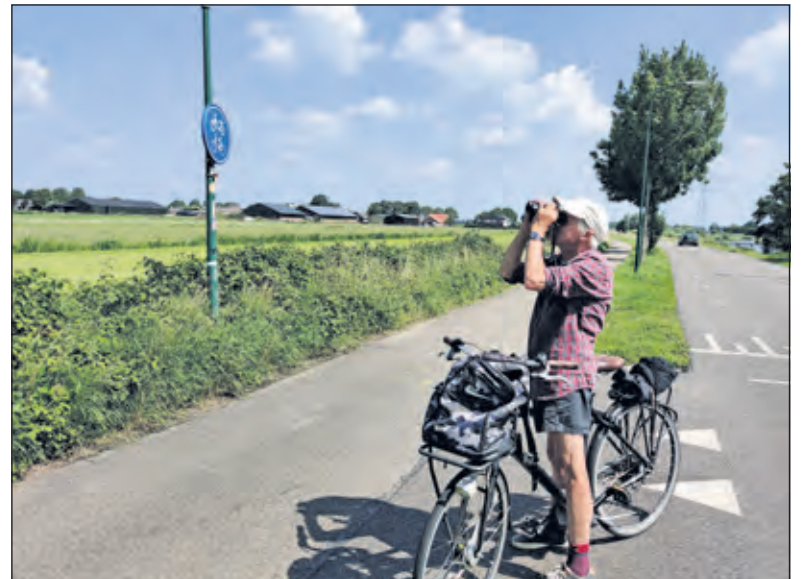
Ook langs de Burgemeester Huydecoperweg zoekt en telt Wigle watervogels.

Wigle telt zijn toegewezen telgebied heel grondig. ‘Een vogelsoort als de bok (een snipje) is moeilijk te vinden, “je moet er bijna op staan, wil zo’n vogel wegvliegen”, dus daar gaat veel werk in zitten. Ook