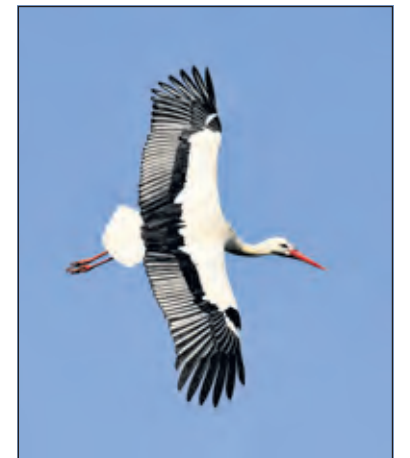
De ooievaar is een jaarrond aanwezige soort in het Noorderpark

worden ook de ontwikkelingen van vogelpopulaties beïnvloed. Spannend hoe deze ontwikkelingen zullen verlopen. Met vogeltelwerk kun je het verschijnen en verdwijnen van onder meer Biltse (broed)vogels volgen en documenteren’.