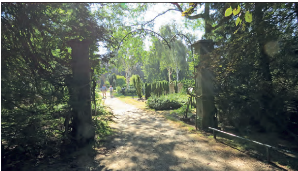
De oorspronkelijke toegang tot de begraafplaats.