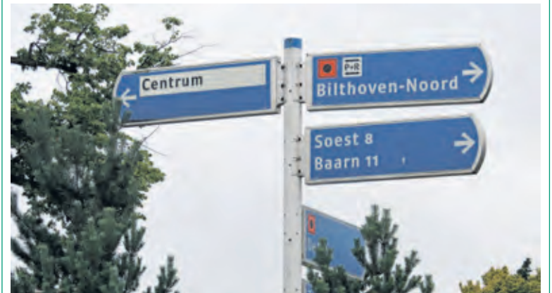
De weg naar Bilthoven-Noord.

‘De raad bevestigt dat er problemen zijn maar de algemene verwachting is dat de wethouder dit verzoek naast zich neerlegt en niets gaat doen’ aldus de Stichting Planschade Bilthoven-Noord. De stichting adviseert eigenaren die mogelijk planschade lijden een claim in te dienen. ‘Voor aansluiting of ondersteuning kunnen eigenaren zich melden bij de Stichting Planschade Bilthoven-Noord en de Bewonersvereniging Bilthoven-Noord. Een planschadeclaim kan tot en met 18 augustus 2020 worden ingediend. ‘De vaste kosten bedragen 300 euro waarvoor de gemeente na het indienen van de claim een factuur stuurt. Dit bedrag wordt terugontvangen wanneer er uiteindelijk een tegemoetkoming in planschade wordt toegekend’. De stichting adviseert voor de zekerheid een planschadeclaim in te dienen. ‘Later kunt u eventueel nog beslissen de factuur van de gemeente niet te betalen, waardoor uw claim niet in behandeling wordt genomen’.