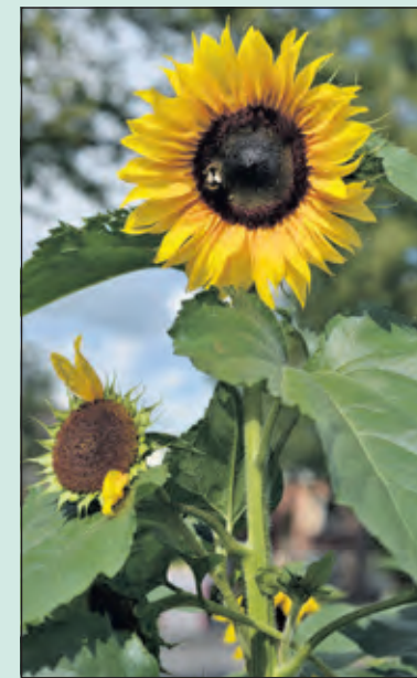
Circa 80 deelnemers strijden om de hoogste zonnebloem van Maartensdijk te kweken.

Deelnemers aan de wedstrijd 'Wie kweekt de hoogste zonnebloem van Maartensdijk' worden opgevoerd om uiterlijk zaterdag 15 augustus de hoogte van de hoogste zonnebloem door te geven via natuurlijkmaartensdijk@outlook.com . Het team Natuurlijk! Maartensdijk komt de hoogste zonnebloemen nameten. Op zaterdag 5 september vindt bij zorgboerderij Nieuw Toutenburg de prijsuitreiking plaats. Er zijn naar ruim 80 adressen pitten gebracht. Sommige deelnemers hebben Natuurlijk! Maartensdijk op de hoogte gehouden. Die berichten waren overigens zeer divers; van zonnebloemen, die de rand van het schuurdak voorbij schieten tot pitten die door gevleugelde vrienden gestolen zijn.