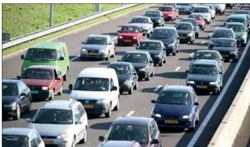
Het dagelijks leed op de huidige A27 ter hoogte van Groenekan.