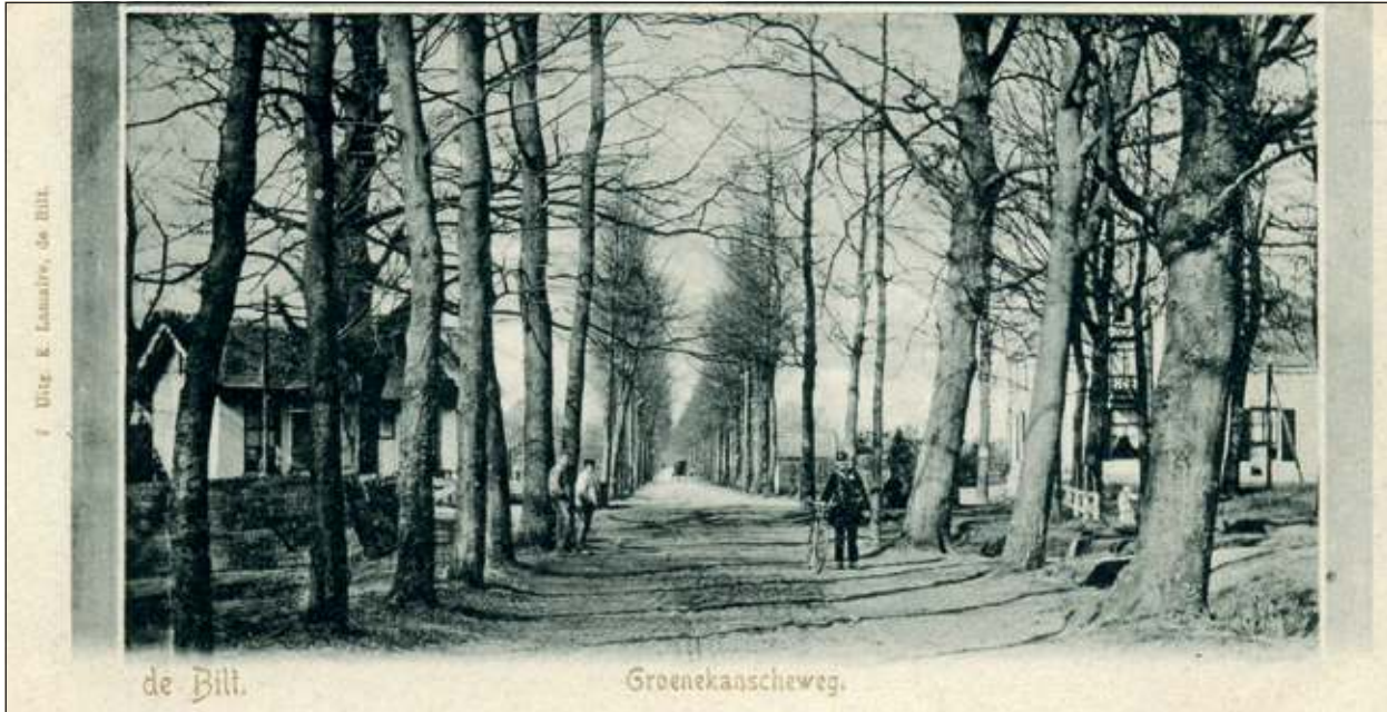
Groenekanseweg begin 20ste eeuw

deling langs woon- en zorgcentra in De Bilt en Bilthoven. De Historische Kring D' Oude School wil u in deze serie artikelen van hun hand graag laten meegenieten van dit interessante beeldmateriaal.