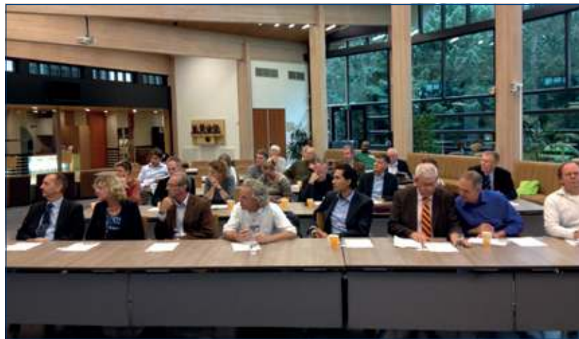
Ruim aandacht van de ZZP'ers voor vraagstukken rondom de kracht van sociale media.

ondernemers gevraagd om hun belangrijkste marketingvragen in groepjes van twee te bespreken. Er werden veel voorbeelden van positieve en negatieve ervaringen met bedrijven gegeven en er werd uitgeweid over de nieuwe trend van bedrijven om wel adequaat te reageren op klachten op