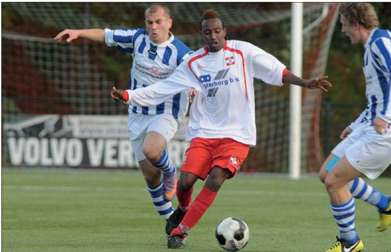
FC De Bilt heeft ook zijn vijfde achtereenvolgende wedstrijd gewonnen. In eigen huis werd Scherpenzeel met 3-2 verslagen.

Na vier winstpartijen op rij kwam in wedstrijd vijf de enige andere ploeg zonder puntverlies op bezoek bij FC De Bilt. VV Scherpenzeel speelde nog maar drie keer, maar wist alle drie deze wedstrijden te winnen. De ploeg die afgelopen seizoen verrassend uit de derde klas degradeerde, heeft net als FC De Bilt de doelstelling om zo snel mogelijk weer te promoveren. Een topper tussen twee titelkandidaten, waarbij De Bilt aan kon treden met een fitte selectie.