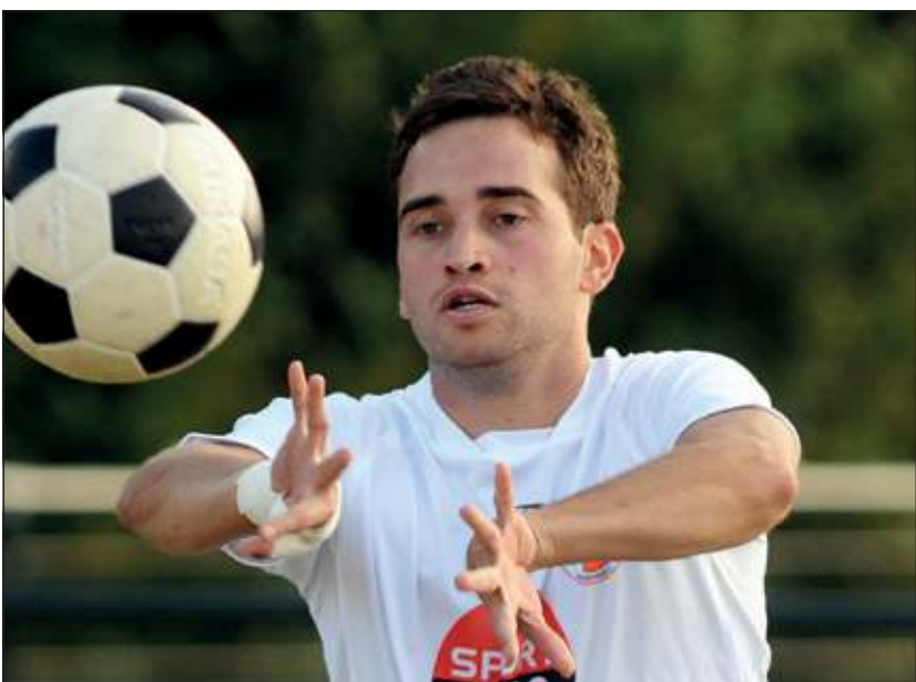
TZ won met 14-11 van het Zeeuwse Tjoba.

Na de vervelende nederlaag van vorige week in Gorinchem was de wedstrijd van dit weekend tegen Tjoba een sleutelduel. Bij winst blijft TZ aangesloten bij de kopposities, bij verlies moest de blik ook naar de onderste regionen worden gericht.