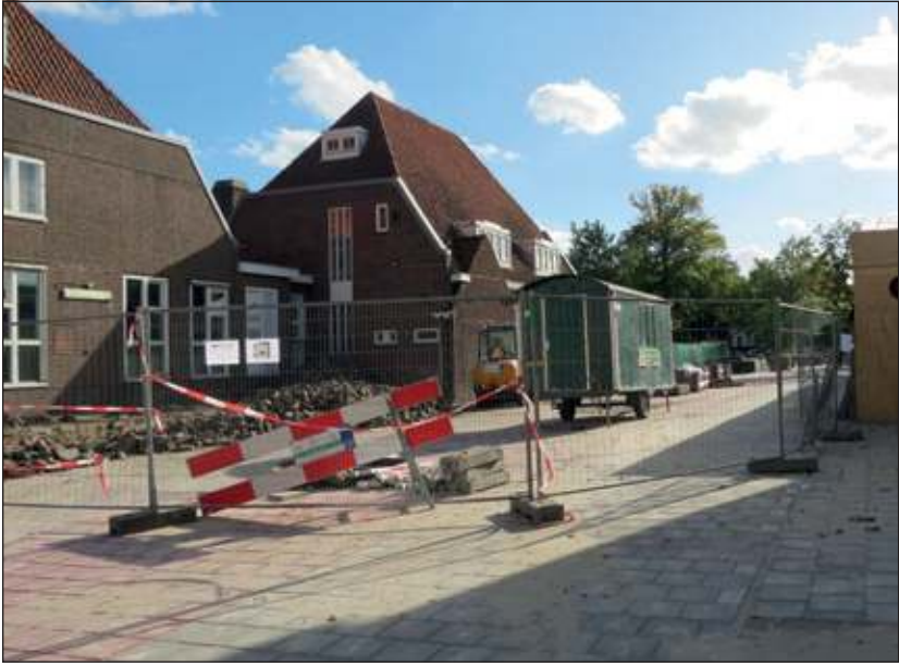
Het Centrumplan in ontwikkeling.