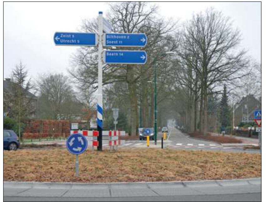
De huidige situatie.