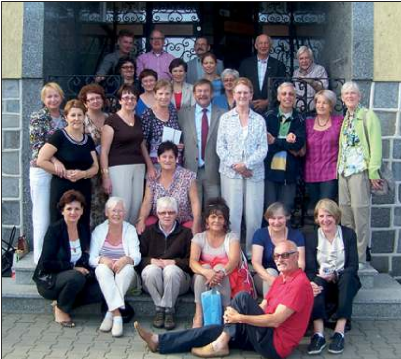
Tijdens de jaarlijkse St. Michael's Markt in Mieścisko waren dit jaar 15 vrijwilligers van Razem actief.

Nieuwe kinderkleertjes van een anonieme gever krijgen nog een goede bestemming. De Biltse deelnemers kunnen terugzien op drukke en fijne dagen met een mooie opbrengst voor de goede doelen in Mieścisko.