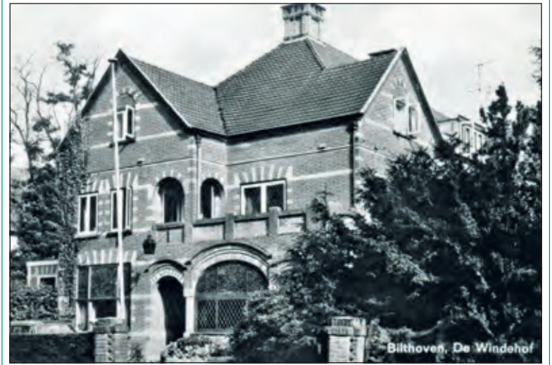
Het luxe verzorgingshuis 'De Windenhof' aan de Rembrandtlaan (Bilthoven) in 1957

Met een foto van weleer, de camera van nu en tekst van overal ((dorps-)historici en eerdere publicaties) gaan we kriskras door de kernen van deze gemeente. [Henk van de Bunt]