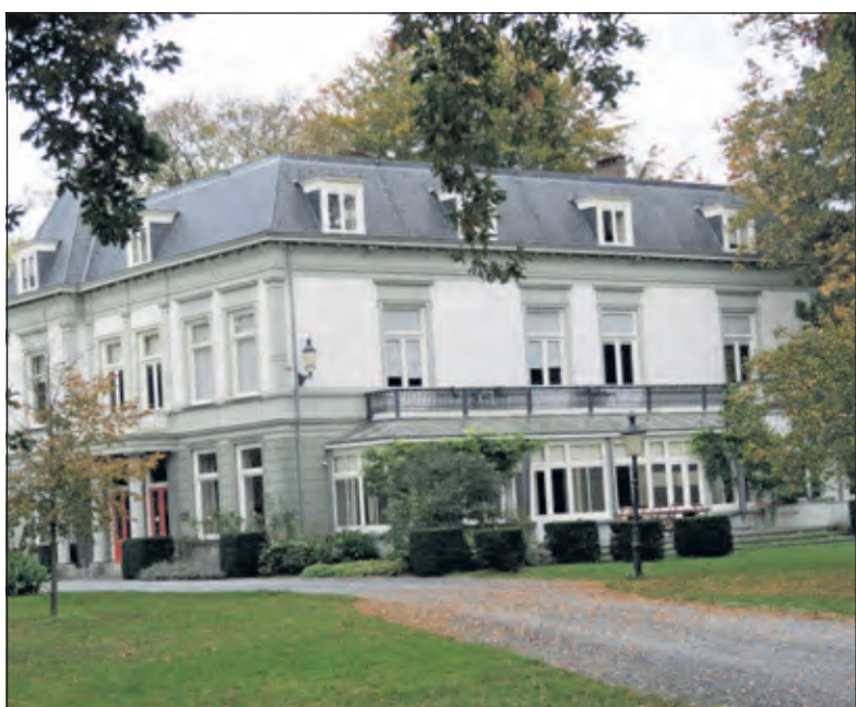
Landgoed Voordaan is beeldbepalend voor Groenekan.

in 2019 door B en W voorgestelde locaties voor woningbouw. Noordelijk van de al wel beschermde parkaanleg bevindt zich het tweede deel van het Parkbos met de bosvijver, dat nog geen deel uit maakt van de complexbescherming.