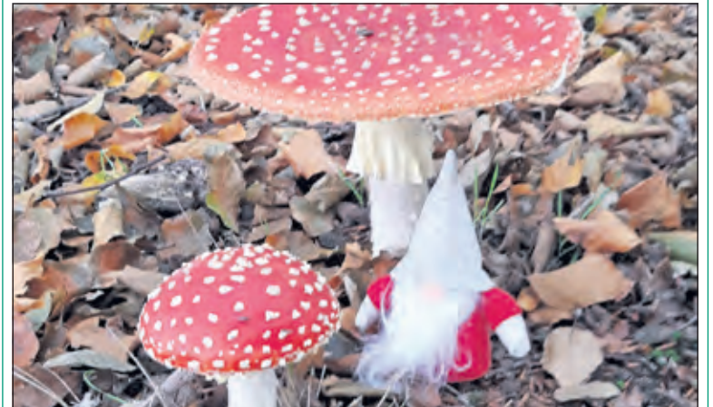
‘Kabouters bestaan! Gespot op de Holle Bilt’ door Thea Haks.