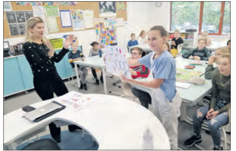
Overhandiging van de opbrengst van de sponsorloop aan de stichting 'Because we Carry'.