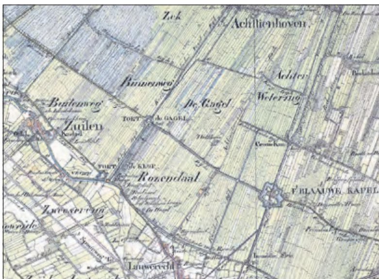
De Nieuwe Hollandse Waterlinie in 1850.