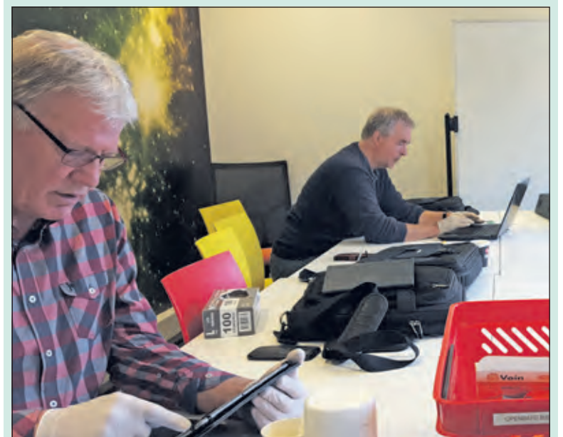
Bij het digitaal café wordt veilig en op afstand gewerkt.

In de bibliotheek wordt gewerkt volgens de RIVM-richtlijnen. Met technische hulpmiddelen kunnen vrijwilligers op afstand met je meekijken. Wie een vraag heeft, maar liever thuis blijft kan deze mailen naar seniorwebidea@gmail.com of bellen met 085 8222777 en de vraag doorgeven. Een vrijwilliger neemt dan contact op om te helpen. Veel vragen kunnen telefonisch afgehandeld worden, mocht dat niet lukken dan wordt gezocht naar een goed passende oplossing.