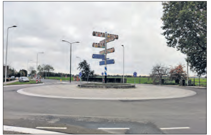
De rotonde moet hét visitekaartje van Maartensdijk worden.

Team Natuurlijk! Maartensdijk komt graag in contact met lokale hoveniers, groenbedrijven om andere groendenkers of -doeners, die mogelijkheden zien. Binnen een aantal kaders kunnen inrichtings- en financieringsvoorstellen gemaakt worden of kan daarover met het team meegedacht worden. In eerste instantie gaat het om de bekostiging, maar bij voldoende animo kan wellicht jong en oud over de inrichtingsvoorstellen meestemmen. Hulpaanbod kan naar natuurlijkmaartensdijk@outlook.com . Graag vóór 1 december.