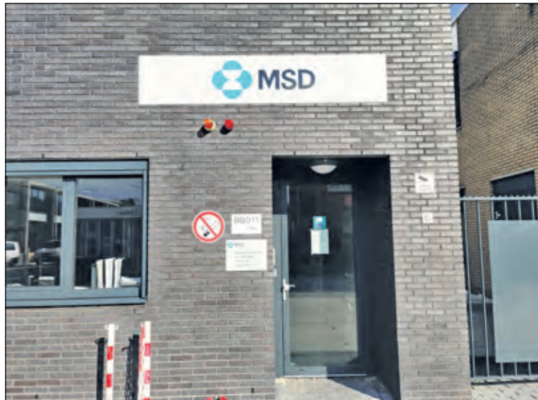
Een gedeelte van het bedrijf is gevestigd aan de Ambachtstraat 6.

‘Een aantal oppositiepartijen vindt dat ook het bestemmingsplan en de structuurvisie over dit gebied meegenomen zouden moeten worden in het advies van het college, dat dus negatief zou moeten zijn.’ Schoor verwacht dat daarover een breed