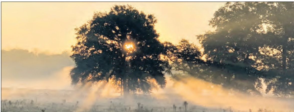
De prachtige lichtval door de bomen op Houdringe nodigen uit tot het maken van een foto.