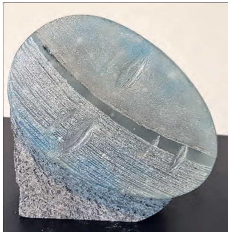
Nachtgeluiden in het hoofd van een slapende vrouw.