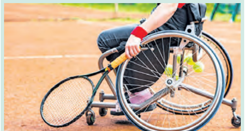
Rolstoeltennis behoort tot de mogelijkheden bij Helios.