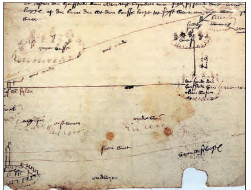
De oudste kaart: een schets uit 1472 waarop omstreden grenzen tussen het Sticht en Holland zijn afgebeeld. (Algemeen Rijksarchief Den Haag).

Vanaf de grote ontdekkingsreizen nam de ook behoefte aan grotere kaarten toe. In de late zestiende eeuw verschenen er prachtige atlassen zoals het werk van Ortelius en Hogenberg. Ook die dure atlassen waren een prestigeobject. Kaarten werden nog ongekleurd gepubliceerd, maar de koper kon naar eigen keuze met de hand kleuren laten aanbrengen. Op de kaartenverzameling van Christian sGroot