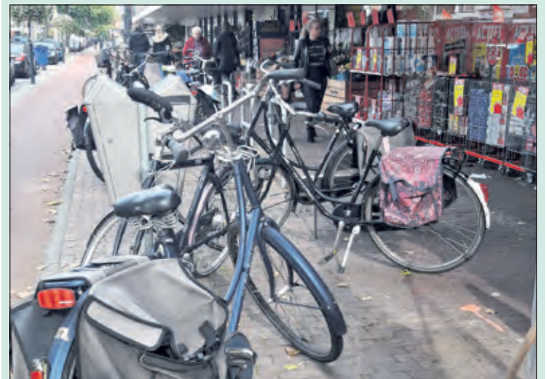
Oude rekken verwijderd; nieuwe geplaatst. Dit is het resultaat: Commentaar overbodig. (Koen Wildschut)