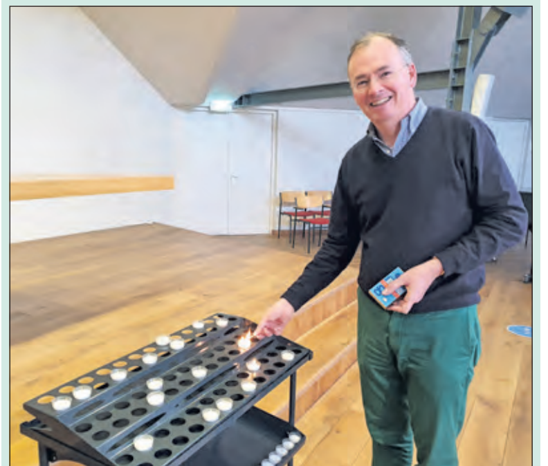
Zondag 1 november is iedereen van harte welkom in de Centrumkerk in Bilthoven

Dit evenement wordt voor de eerste keer georganiseerd door de Centrumkerk en staat geheel los van de Allerzielenviering op 2 november. Het coronavirus heeft toch nog één voordeel. Ook kerken denken out-of-the-box. Met deze nieuwe activiteit hopen zij iedereen in het dorp te bereiken. Oechies: ‘Het is voor ons een nieuwe activiteit en wij hopen dat dit het begin wordt van een nieuwe traditie. Ook aan mensen die hun verhaal kwijt willen, hebben wij gedacht. Wij hebben een luisterend oor, speciaal voor hen. En als je naar buiten gaat, liggen bij de uitgang meditatieve teksten. Belangstellenden kunnen deze meenemen’. De activiteit vindt plaats op zondag 1 november, van 16.00 tot 18.00 uur in de Centrumkerk aan de Julianalaan 42 in Bilthoven.