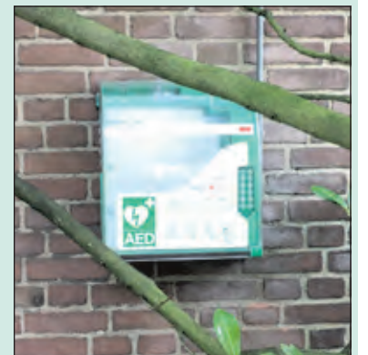
Sinds kort hangt er een AED bij de Michaelkerk.

Een dicht netwerk van AED's is cruciaal om snel te kunnen handelen. De Stichting Hartslag De Bilt zag in de Michaelkerk aan de Kerklaan 31 in De Bilt een ideale plek voor een AED om het netwerk van de bestaande apparaten te vergroten. De AED is dag en nacht beschikbaar en is aangemeld bij HartslagNu.