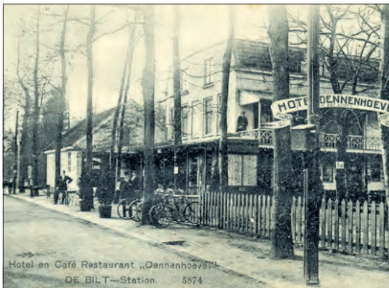
Hotel en Café Dennenhoeve De Bilt naast Station aan het Emmaplein. Het stations-koffiehuis werd in 1864 geopend. Het groeide uit tot hotel-restaurant Dennenhoeve. Deze foto uit 1914 is genomen vanaf het station kijkend in zuidelijke richting. In 1907 was het pand aangekocht door de spoorwegen. W. Brands werd in 1913 pachter van het hotel-restaurant. Het hotel kreeg in de volksmond de naam Brands.

De E-book-versie van De Bilt. Een Utrechts dorp in vroeger eeuw' is gratis te downloaden via de site van het Online Museum.