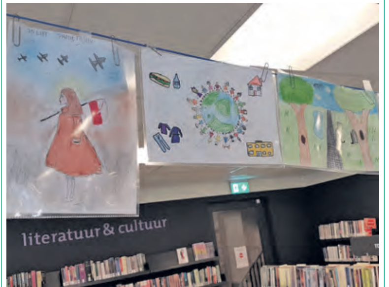
Het Poolse meisje met de vlag. 'Pamiętajmy' betekent: 'vergeet het niet'.

Opvallend was de verscheidenheid aan stijlen van de 12-jarige kinderen: de Duitse inzendingen waren allen in zwart potlood, de Nederlandse vrijwel allemaal getekend met kleurrijker, maar ook afstandelijker viltstift, de Poolse zonder uitzondering met het gevoeliger potlood. Ook inhoudelijk lijken de Poolse kinderen wat meer fijnbesnaard en zelfs teder: waar de andere kinderen soms de liefde voor hun Playstation en andere spelletjes verbeelden, tekenen de Poolse kinderen vaak over het geluk van de natuur, de vrijheid van de vogel of de geborgenheid van hun familie. Het meisje met de vlag ging hun voor als lichtend voorbeeld. (Peter Schlamilch)