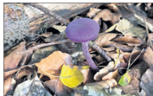
Deze fraaie (paarse) paddenstoel, gespot op Beerschoten is een Amethistzwam.