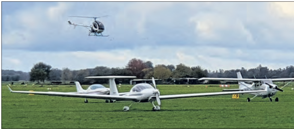
Op Vliegveld Hilversum is het een komen en gaan van sportvliegtuigjes en helikopters.6

Vanwege geluidsoverlast in den lande zijn veel vluchtroutes van en naar Schiphol omgelegd. Het lucht-ruim boven de gemeente De Bilt is