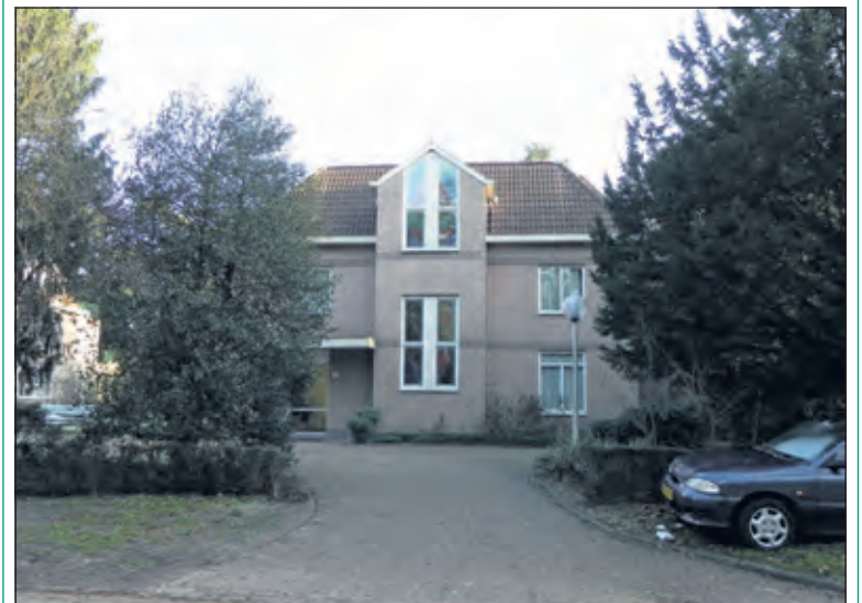
De oude grote villa heeft plaats moeten maken voor dit modernere pand.